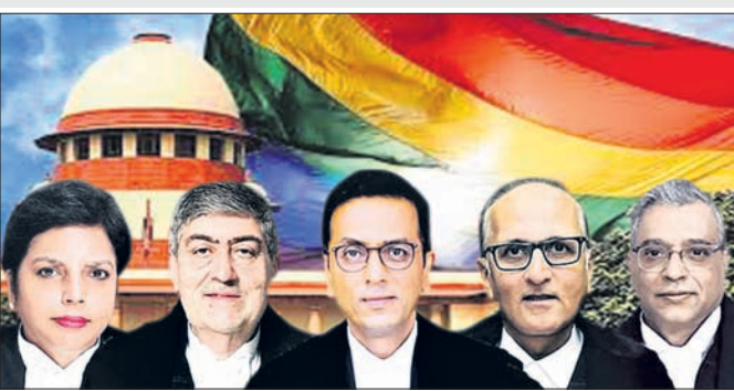
ସାମ୍ବିଧାନିକ ପୀଠର ୫ ବିଚାରପତି ହେଲେ (ବାମରୁ) ଜଷ୍ଟିସ୍ ହିମା କୋହଲି, ଜଷ୍ଟିସ୍ ସଞ୍ଜୟ କେ. କୋଲ, ପ୍ରଧାନ ବିଚାରପତି ଡି.ଓ.ଲ. ଚନ୍ଦ୍ରଚୂଡ଼, ଜଷ୍ଟିସ୍ ଏସ୍. ରବୀନ୍ଦ୍ର ଜଜ୍ ଓ ଜଷ୍ଟିସ୍ ପି.ଏସ୍. ନରସିଂହ।

ସମଲିଙ୍ଗୀ ମିଳନକୁ ବୈଧ କରିବା ସକାଶେ ଆଇନରେ ପରିବର୍ତ୍ତନ କରିପାରିବ ପାର୍ଲିାମେଣ୍ଟ: ସାମ୍ବିଧାନିକ ପୀଠ