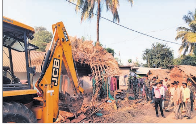
ଜବର ଦଖଲ ଉଚ୍ଛେଦ କରାଯାଇଛି।

ନବରଙ୍ଗପୁର ଜିଲ୍ଲା ନବରଙ୍ଗପୁର ପୂର୍ବ ବିଭାଗ ପକ୍ଷରୁ ରାସ୍ତା ପ୍ରଶସ୍ତିକରଣ କାର୍ଯ୍ୟ କରାଯାଇଛି।