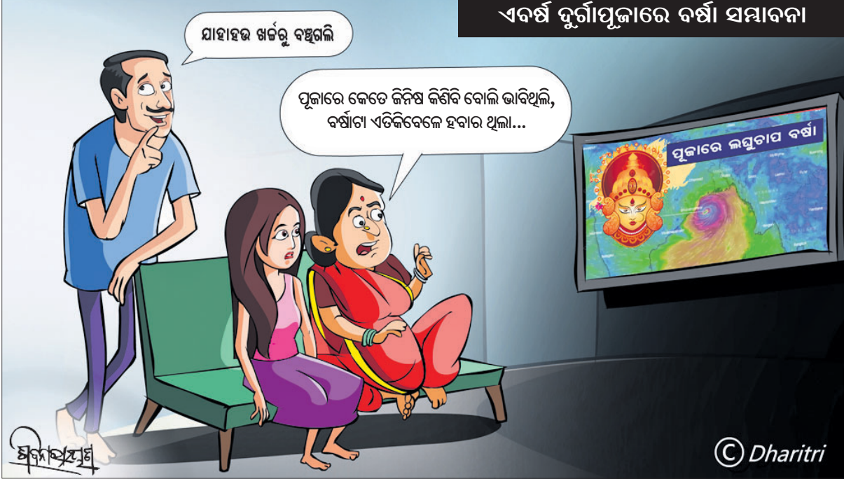
ଏବର୍ଷ ଦୁର୍ଗାପୂଜାରେ ବର୍ଷା ସମାବନା

ଜଣେ ଜଣେ ସ୍ତ୍ରୀଲୋକ ଅଛନ୍ତି ଯାହାଙ୍କ ନକର ବା ଦୃଷ୍ଟି ପଡ଼ିଲେ ଛୋଟ ଛୋଟ ପିଲାଙ୍କ ଦେହ ଖରାପ ହେବା ସହ ଦେହ ଶୁଖିଯାଉଥିବାର ଦେଖିବାକୁ ମିଳିଥାଏ। ଏଭଳି ସ୍ତ୍ରୀଲୋକଙ୍କୁ ସାଧାରଣତଃ ତାଆଣୀର ଆଖ୍ୟା ଦିଆଯାଉଥିବା ବେଳେ ଏହାକୁ ଲକ୍ଷ୍ୟକରି ଏପରି କୁହାଯାଇଛି। ଓଡ଼ିଆ ଜଗତମାଳି ଓ ରୁଚି ପ୍ରୟୋଗ - ଏ.କେ. ମିଶ୍ର ପଢ଼ିକର୍ତ୍ତା ପ୍ରା.ଲିଃ: