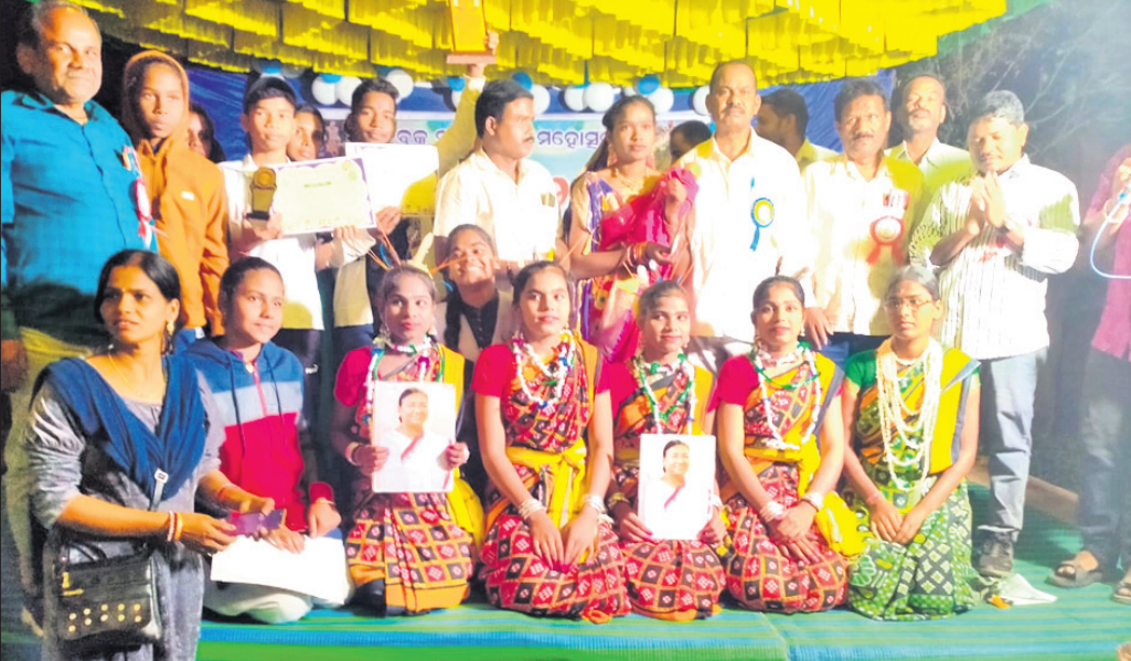
ଅତିଥିଙ୍କ ସହ କୃତୀ ପ୍ରତିଯୋଗୀମାନେ।

ଡାକୁଗାଁ, ୧୭ ଅକ୍ଟୋବର (ପ୍ରଞ୍ଜାଳକାନ୍ତ ପରିଡ଼ା)