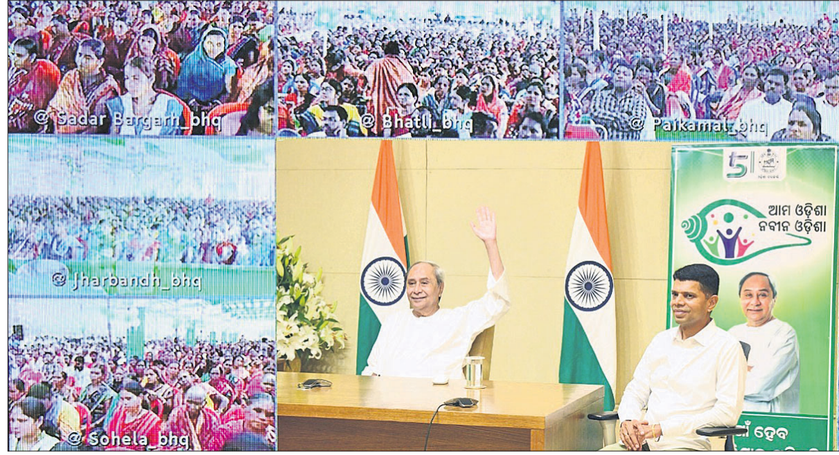
ଭୁବନେଶ୍ୱର, ୧୭।୧୦(ଅନିଲ ଦାସ)