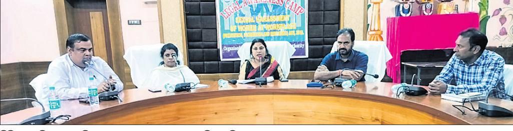
ଶିବିରରେ ଜିଲ୍ଲାପାଳ, ଡିଏଲ୍ଏସ୍‌ଏ ସଦସ୍ୟଙ୍କ ସହ ଉପସ୍ଥିତ ଅତିଥି ଓ ଅନ୍ୟମାନେ।