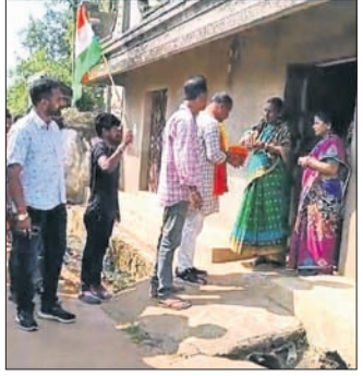
ନବରଙ୍ଗପୁର ଜିଲ୍ଲା ନେତୃତ୍ୱରେ ଯୁବ କେନ୍ଦ୍ର ପକ୍ଷରୁ ନିୟମିତ ଭାବେ କାର୍ଯ୍ୟକ୍ରମ