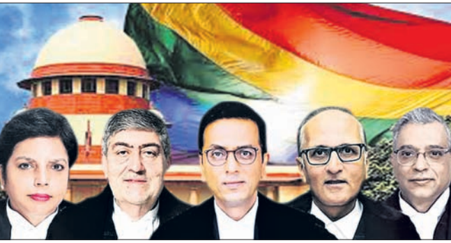
ସାମ୍ବିଧାନିକ ପୀଠର ୫ ବିଚାରପତି ହେଲେ (ବାମରୁ) ଜଷ୍ଟିସ୍ ହିମା କୋହଲି, ଜଷ୍ଟିସ୍ ସଞ୍ଜୟ କେ. କୋଲ, ପ୍ରଧାନ ବିଚାରପତି ଡି.ଓ.ଲ. ଚନ୍ଦ୍ରଚୂଡ଼, ଜଷ୍ଟିସ୍ ଏସ୍. ରବୀନ୍ଦ୍ର ଜଜ୍ ଓ ଜଷ୍ଟିସ୍ ପି.ଏସ୍. ନରସିଂହ।

ସମଲିଙ୍ଗୀ ମିଳନକୁ ବୈଧ କରିବା ସକାଶେ ଆଇନରେ ପରିବର୍ତ୍ତନ କରିପାରିବ ପାର୍ଲିମେଣ୍ଟ: ସାମ୍ବିଧାନିକ ପୀଠ