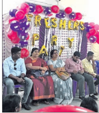
ପାଠ ପଢ଼ି ଆଗକୁ ଚାଲିବା ପାଇଁ ପ୍ରୋତ୍ସାହନ ଦେଇଥିଲେ।

ନବରଙ୍ଗପୁର ଜିଲ୍ଲା ଡାକୁଗାଁ ଭୈରବ ସ୍ନାତକ ମହାବିଦ୍ୟାଳୟରେ ଯୁକ୍ତ ତିନି ପ୍ରଥମ ବର୍ଷର ଛାତ୍ରଛାତ୍ରୀଙ୍କ ସ୍ୱାଗତ ସମ୍ବର୍ଦ୍ଧନା ଉତ୍ସବ ମଙ୍ଗଳାବାର ପାଳିତ ହୋଇଛି।