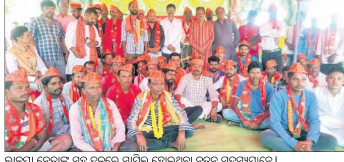
ଭାଜପା ନେତାଙ୍କ ସହ ଦଳରେ ସାମିଲ ହୋଇଥିବା ନୂତନ ସଦସ୍ୟମାନେ।

ନବରଙ୍ଗପୁର, ୧୭ ଅକ୍ଟୋବର (ପ୍ରତାପ କୁମାର ଦାଶ)