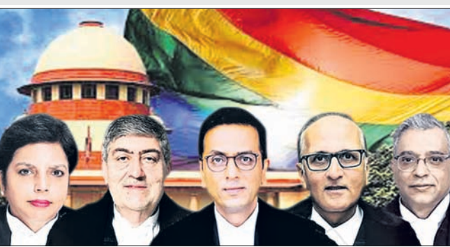
ସାମ୍ବିଧାନିକ ପୀଠର ୫ ବିଚାରପତି ହେଲେ (ବାମରୁ) ଜଷ୍ଟିସ୍ ହିମା କୋହଲି, ଜଷ୍ଟିସ୍ ସଞ୍ଜୟ କେ. କୋଲ, ପ୍ରଧାନ ବିଚାରପତି ଡି.ଓ.ଲ. ଚନ୍ଦ୍ରଚୂଡ଼, ଜଷ୍ଟିସ୍ ଏସ୍. ରବୀନ୍ଦ୍ର ଜଜ୍ ଓ ଜଷ୍ଟିସ୍ ପି.ଏସ୍. ନରସିଂହ।

ସମଲିଙ୍ଗୀ ମିଳନକୁ ବୈଧ କରିବା ସକାଶେ ଆଇନରେ ପରିବର୍ତ୍ତନ କରିପାରିବ ପାର୍ଲିାମେଣ୍ଟ: ସାମ୍ବିଧାନିକ ପୀଠ