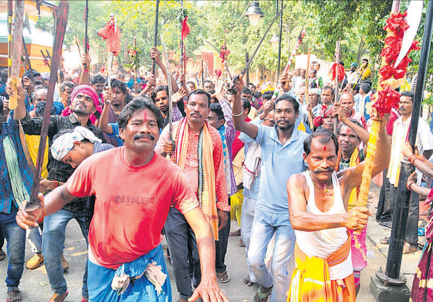
ଆଦିବାସୀମାନେ ପାରମ୍ପରିକ ଅସ୍ତ୍ରଶସ୍ତ୍ର ଧରି ରାଲିରେ ଯାଉଛନ୍ତି।

ସୋନପୁର, ୧୨.୧୦ (ମୁଖ୍ୟମନ୍ତ୍ରୀ ଶ୍ରୀ ଶ୍ରୀ) ବର୍ତ୍ତମାନ କଳା, ସଂସ୍କୃତି, ପରମ୍ପରା ଓ ପୂଜାପାଠ୍ୟ ଅନୁଷ୍ଠାନ ରଖିବା ପାଇଁ ରାଜ୍ୟ ସରକାର ଶ୍ରେଣୀକୃତ ଡେଇଁଲାପରେ କାର୍ଯ୍ୟକାରୀ (ସଂସ୍କୃତି) ଗଠନ କରିଛନ୍ତି। ତେବେ ସୁବର୍ଣ୍ଣପୁର ଜିଲ୍ଲା ସଂସ୍କୃତିରେ ସାମିଲ କରାଯାଇନାହିଁ। ଏ ନେଇ ଅନୁସୂଚିତ କର୍ମକାରୀ (ସଂସ୍କୃତି) ବର୍ଗର ଲୋକଙ୍କ ମଧ୍ୟରେ ତୀବ୍ର ପ୍ରତିକ୍ରିୟା ପ୍ରକାଶ ପାଇଛି। ସୁବର୍ଣ୍ଣପୁରକୁ ସଂସ୍କୃତିରେ ସାମିଲ କରିବା ଓ ଅନ୍ୟ ୧୫ ଦମ୍ପା ଦାବି ନେଇ ମଙ୍ଗଳବାର ଜିଲ୍ଲା ସଦର ମହକୁମାରେ ଜିଲ୍ଲା ଆଦିବାସୀ କଲ୍ୟାଣ ସଂଘ ପକ୍ଷରୁ ବିଶାଳ ରାଲି ଅନୁଷ୍ଠିତ ହୋଇଥିଲା। ଜିଲ୍ଲାର ୫ ହଜାରରୁ ଊର୍ଦ୍ଧ୍ୱ ଆଦିବାସୀ ମହିଳା