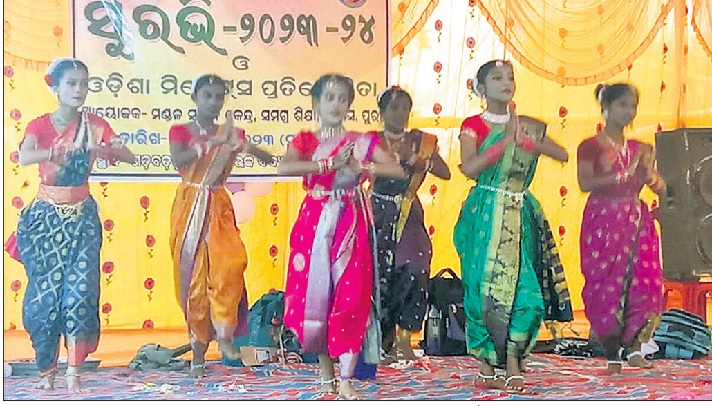
'ସୁରଭି' ଓ ଓଡ଼ିଶା ମିଲେଟସ୍ ପ୍ରତିଯୋଗିତାରେ ଅଂଶଗ୍ରହଣ କରିଥିବା ପ୍ରତିଯୋଗୀଙ୍କ ବିଭାଗୀୟ ନୃତ୍ୟ ପରିବେଷଣ ।

ବିଶ୍ୱ ଖାଦ୍ୟ ଦିବସ ପାଳିତ କଟକ, ୧୭।୧୦(ବିଭୂତି ଭୂଷଣ ତ୍ରିପାଠୀ): କଟକର ବିଭାଗୀୟ ଗ୍ରାମରେ ବିଶ୍ୱ ଖାଦ୍ୟ ଦିବସ ପାଳିତ ହୋଇଯାଇଛି। ଗ୍ରାମ କୃଷିବିକାଶ ପରିଷଦ, ପୁରୀ ଆନୁଷ୍ଠାନିକରେ ଏହା ପାଳନ କରାଯାଇଥିଲା।