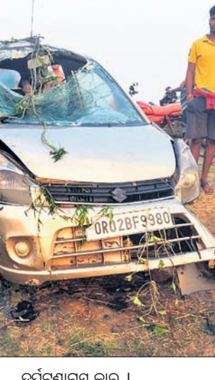
ଦୁର୍ଘଟଣାଗ୍ରସ୍ତ କାର୍ ।

କଟକ, ୧୭।୧୦(ବିଭୂତି ଭୂଷଣ ତ୍ରିପାଠୀ): କଟକର କାର୍ ଦୁର୍ଘଟଣାରେ ଯୁବକ ମୃତ ହୋଇଛି। ଘଟଣା ସମ୍ବନ୍ଧରେ ପୁଲିସ୍ ତଦନ୍ତ ଚାଲିଛି।