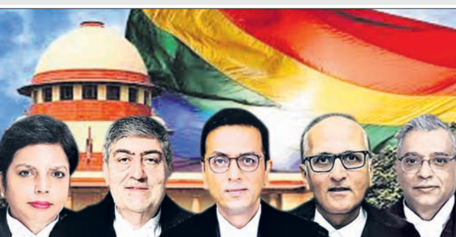
ସାମ୍ବିଧାନିକ ପୀଠର ୫ ବିଚାରପତି ହେଲେ (ବାମକୁ) ଜଷ୍ଟିସ୍ ହିମା କୋହଲି, ଜଷ୍ଟିସ୍ ସଞ୍ଜୟ କେ. କୋଲ, ପ୍ରଧାନ ବିଚାରପତି ଡି.ଓ.ଲ. ଚନ୍ଦ୍ରଚୂଡ଼, ଜଷ୍ଟିସ୍ ଏସ୍. ରବୀନ୍ଦ୍ର ଜଜ୍ ଓ ଜଷ୍ଟିସ୍ ପି.ଏସ୍. ନରସିଂହ।

ସମଲିଙ୍ଗୀ ମିଳନକୁ ବୈଧ କରିବା ସକାଶେ ଆଇନରେ ପରିବର୍ତ୍ତନ କରିପାରିବ ପାର୍ଲିାମେଣ୍ଟ: ସାମ୍ବିଧାନିକ ପୀଠ