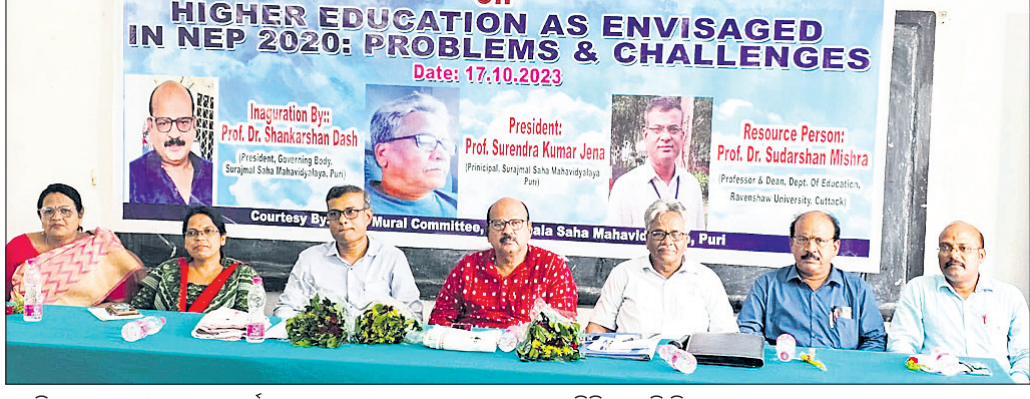
ଉଚ୍ଚଶିକ୍ଷା ସମସ୍ୟା ଓ ଆହ୍ୱାନ ଶୀର୍ଷକ ଆଲୋଚନାଚକ୍ରରେ ଯୋଗ ଦେଇଥିବା ବିଶିଷ୍ଟ ବ୍ୟକ୍ତି ବିଶେଷ ।