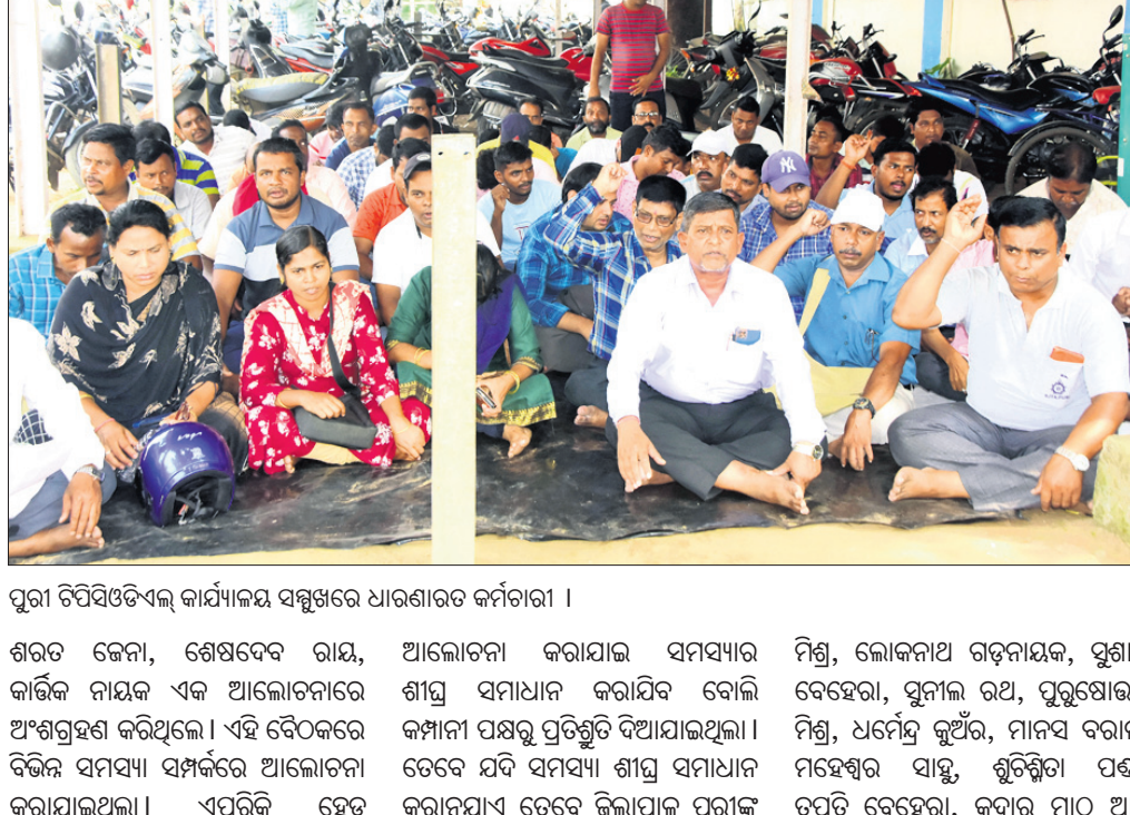
ପୁରୀ ଚିପିପିଡିପଲ୍ କାର୍ଯ୍ୟାଳୟ ସମ୍ମୁଖରେ ଧାରଣାରତ କର୍ମଚାରୀ ।