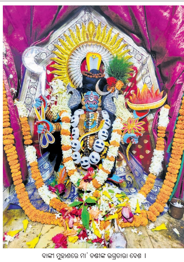
ବାଙ୍କୀ ମୁହାଣରେ ମା' ଚଣ୍ଡାଳ ଭଗ୍ନତାରା ବେଶ ।