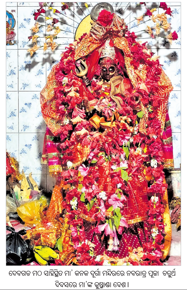
ଦେବଗଡ଼ ୧୦୦୦ ପାଠକ ସମିତିର 'କଳାକୃତି' ମିନିତ୍ରୟର ନବନିର୍ମାଣ ପୂଜା ଚରୁଥିବ ବେଳେ ମା'ଙ୍କ କୁଣ୍ଡଳା ବେଶ।

ଉନ୍ନତି ନାମରେ ୧୦ଲକ୍ଷରୁ ଊର୍ଦ୍ଧ୍ୱ ଟଙ୍କା ହତ୍ୟା କରାଯାଇଥିବା ଜଣାଯାଇଛି।