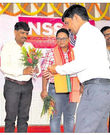
ଅତିଥିଙ୍କୁ ସମର୍ଥନ କରାଯାଇଛି।

ସମ୍ବଲପୁର, ୧୮୧୦(ବି.ଶଙ୍କର) ସମ୍ବଲପୁର ଶାସନସ୍ଥିତ ବିକାଶ ଉଚ୍ଚ ମାଧ୍ୟମିକ ବିଦ୍ୟାଳୟରେ ଏନ୍‌ଏସ୍‌ଏସ୍ ଏକଦିବସୀୟ ପ୍ରଶିକ୍ଷଣ ଶିବିର ଅନୁଷ୍ଠିତ ହୋଇଯାଇଛି।