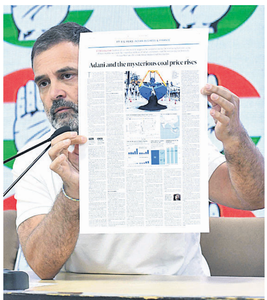
‘ଫାଇନାନ୍ସିଆଲ ଟାଇମ୍ସ’ ଖବରକାଗଜରେ ଆଦାନା ଗୁପ୍ତର କୋଇଲା ଦୁର୍ନୀତି ଉପରେ ପ୍ରକାଶିତ ରିପୋର୍ଟ ଗଣମାଧ୍ୟମକୁ ନୂଆଦିଲ୍ଲୀରୁ ଏଆଇସିସି ମୁଖ୍ୟାଳୟରେ କଂଗ୍ରେସ ନେତା ରାହୁଲ ଗାନ୍ଧୀ ଦେଖାଉଛନ୍ତି।