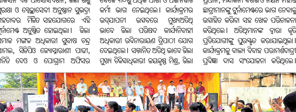
ବାଳିକାମାନେ ଖେଳ ପୂର୍ବରୁ ପରେତ କରୁଛନ୍ତି।

'ମେରା ମାଟି, ମେରା ଦେଶ' କାର୍ଯ୍ୟକ୍ରମରେ ମାଟି ସଂଗ୍ରହ କରାଯାଇଛି।