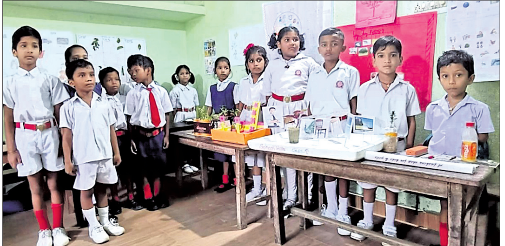
ସରସ୍ୱତୀ ଶିଶୁ ମନ୍ଦିରରେ ବିଜ୍ଞାନ ମେଳା।

ସମ୍ବଲପୁର, ୧୮୧୦(ବି.ଶଙ୍କର) ସମ୍ବଲପୁର ମହାନଗର ନିଗମ ଅନ୍ତର୍ଗତ ଆଦିବାସୀ କୃଷି ଓ ଅଧ୍ୟାପିକା ପୁରାଣୀ ଶିଶୁ ବିଦ୍ୟାଳୟରେ ବିଜ୍ଞାନମେଳା ୨୦୨୩ ରୁପସାରି ଅନୁଷ୍ଠିତ ହୋଇଯାଇଛି।