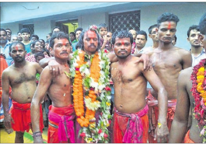
ଖଉଳ ପିଟା ବଳି ପରେ ଖଣ୍ଡେଶ୍ୱରୀ ମନ୍ଦିର ସମ୍ମୁଖରେ ବରୁଆ ଓ ସେବାୟତ ଦ୍ୱୟ (ଫାଇଲ ଫଟୋ)।

ସୋନପୁର, ୧୮୧୦ (ମୁଖ୍ୟମନ୍ତ୍ରୀ ଶତପଥୀ) ଅଷ୍ଟକୋଟି ଶ୍ରଦ୍ଧାଳୁଙ୍କୁ ସୁବର୍ଣ୍ଣପୁରରେ ଆଶ୍ୱିନ ଅମାବାସ୍ୟା ଗତ ୧୪ ତାରିଖରେ ଆରମ୍ଭ ହୋଇଥିବା ପ୍ରସିଦ୍ଧ ବଳିଯାତ୍ରା ୨୯ ତାରିଖ ପର୍ଯ୍ୟନ୍ତ ଚାଲିବ।