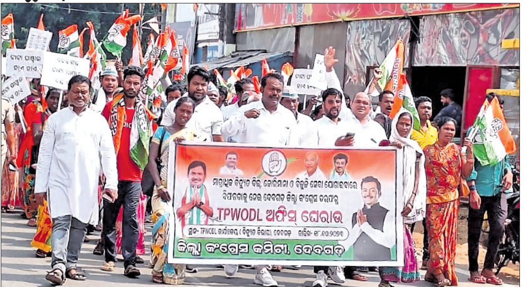
କଂଗ୍ରେସ ପକ୍ଷରୁ ବାହାରିଥିବା ରାଲି।

ସମ୍ବଲପୁର, ୧୮୧୦(ବି.ଶଙ୍କର) ପଶ୍ଚିମ ଓଡ଼ିଶାର ୧୧ ଜିଲ୍ଲାରେ ସମ୍ବଲପୁରୀ ଭାଷା ସଂସ୍କୃତିର ସ୍ୱତନ୍ତ୍ରତା ରହିଛି। ଏହାକୁ ଦୃଷ୍ଟି ରାଜ୍ୟ ସରକାର ସମ୍ବଲପୁରରେ ସମ୍ବଲପୁରୀ ଐତିହାସିକ କେନ୍ଦ୍ର ନିର୍ମାଣ କରିବାକୁ ପଶ୍ଚିମାଞ୍ଚଳ ଏକତା ମଞ୍ଚ ଦାବି କରିଛି।