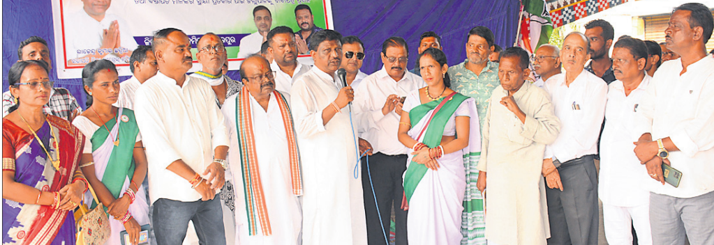
କଂଗ୍ରେସର ପ୍ରତିବାଦ ସଭାରେ ଯୋଗଦେଇଥିବା ଦଳୀୟ ନେତୃତ୍ୱ।

ଏକଲବ୍ୟ ଆଦର୍ଶ ବିଦ୍ୟାଳୟକୁ ପ୍ରଧାନମନ୍ତ୍ରୀଙ୍କ ଶୁଭେଚ୍ଛା ବାଞ୍ଛା କୁଟିଆ, ୧୮୧୦(ବି.ଶଙ୍କର) କୁଟିଆ ଏକଲବ୍ୟ ଆଦର୍ଶ ଆବାସିକ ବିଦ୍ୟାଳୟର ଶିକ୍ଷକମାନଙ୍କୁ ପ୍ରଧାନମନ୍ତ୍ରୀଙ୍କ ଶୁଭେଚ୍ଛା ପ୍ରଦାନ କରାଯାଇଛି।