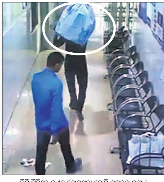
ସିପି ଟିଭିରେ କଏଦ ହୋଇଥିବା ଚୋରି ସମୟର ଦୃଶ୍ୟ।