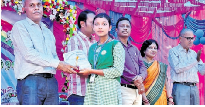
ଜଣେ କୁଡ଼ା ପ୍ରତିଯୋଗୀଙ୍କୁ ଅତିଥି ପୁରସ୍କାର ପ୍ରଦାନ କରୁଛନ୍ତି।

ପ୍ରତିଭା ପ୍ରଦର୍ଶନ କଲେ ଛାତ୍ରୀଛାତ୍ର। ପ୍ରତିଭା ପ୍ରଦର୍ଶନ କଲେ ଛାତ୍ରୀଛାତ୍ର। ପ୍ରତିଭା ପ୍ରଦର୍ଶନ କଲେ ଛାତ୍ରୀଛାତ୍ର।