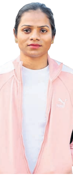
ଦିନେ ସତ ହେବ ସମାଲିଙ୍ଗ ବିବାହ: ଦୃତୀ

ଦିନେ ସତ ହେବ ସମାଲିଙ୍ଗ ବିବାହ: ଦୃତୀ ଦିନେ ସତ ହେବ ସମାଲିଙ୍ଗ ବିବାହ: ଦୃତୀ