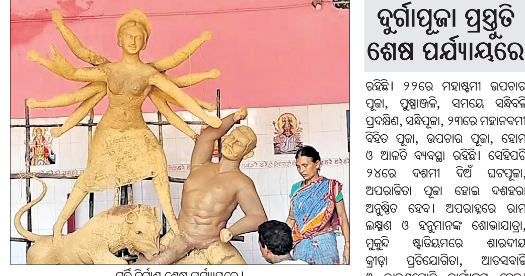
ପୂର୍ଣ୍ଣ ନିର୍ବାଣ ଶେଷ ପର୍ଯ୍ୟାୟରେ।

ସମ୍ବଲପୁର ଜିଲ୍ଲା କୁଟିଆରେ ୯୬୩୩ ଦୁର୍ଗାପୂଜା ପ୍ରସ୍ତୁତି ଶେଷ ପର୍ଯ୍ୟାୟରେ ପହଞ୍ଚିଛି। ମା'ଙ୍କ ଧରାବତରଣ ଅପେକ୍ଷାରେ ଶ୍ରଦ୍ଧାଳୁ ଭକ୍ତ।