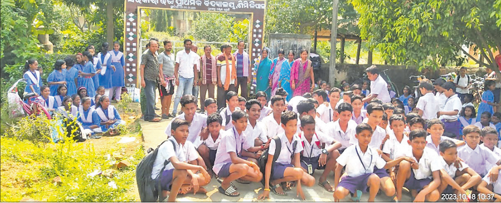
ସ୍କୁଲ ଆଗରେ ଧାରଣାରେ ବସିଛନ୍ତି ଛାତ୍ରଛାତ୍ରୀ, ଅଭିଭାବକ।

ନାକଟିବେଳେ, ୧୮୧୦(ବି.ଶଙ୍କର) ନାକଟିବେଳେ ବ୍ଲକ୍ ଅନ୍ତର୍ଗତ ଶିମିଳିପାଳ ସରକାରୀ ଉଚ୍ଚ ପ୍ରାଥମିକ ବିଦ୍ୟାଳୟରେ ଶିକ୍ଷକ ନିଯୁକ୍ତି ଦାବିରେ ରୁଧିରା ଧରଣୀ ଥାନାରେ ଗିରଫ କରାଯାଇଛି।