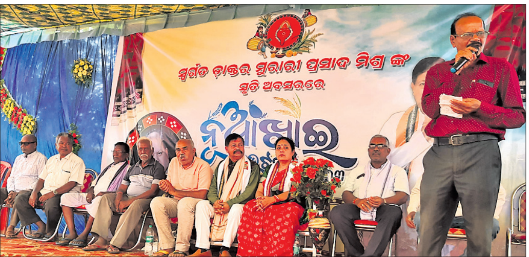
ମୁରାରୀ ମିଶ୍ରଙ୍କ ସ୍ମୃତିରେ ନୂଆଁଖାଇ ଭେଟ୍‌ଘାଟ୍‌ରେ ମଞ୍ଚାଧାର ଅର୍ପଣ।

ପୂର୍ବତନ ବିଧାୟକ ସ୍ୱର୍ଗତ ମୁରାରୀ ମିଶ୍ରଙ୍କ ସ୍ମୃତିରେ ନୂଆଁଖାଇ ଭେଟ୍‌ଘାଟ୍‌ରେ ମଞ୍ଚାଧାର ଅର୍ପଣ କରାଯାଇଥିଲା।