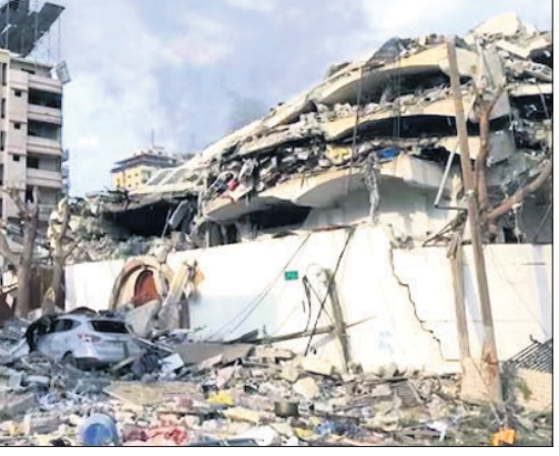
ବୋମାମାଡ଼ରେ ବିଧ୍ଵସ୍ତ ହୋଇଥିବା ଗାଜାର ଅଲ-ଅହଲି ଅଲ-ଆରବା ହତ୍ୟାଚଳ।

ଗାଜା ହତ୍ୟାଚଳ ବିଚାରଣାରେ ଶତାଧିକ ନିହତ ହେବା ପରେ ମଧ୍ୟପ୍ରାନ୍ତରେ ଉତ୍ତେଜନା ବଢ଼ିବାରେ ଲାଗିଛି। ବିଭିନ୍ନ ସ୍ଥାନରେ ଇସ୍ରାଏଲ ବିରୋଧୀ ବିରୋଧୀ ପୂଣ୍ଡ ଚଳିଛି। ଗଣହତ୍ୟା ରୋକିବାରେ ପାଲେଷ୍ଟିନୀୟ ସୁରକ୍ଷା ବଳ ବିଫଳ ହୋଇଥିବା ଦର୍ଶାଇ ଫ୍ରେଣ୍ଡ୍ ବ୍ୟାଙ୍କରେ ସେମାନଙ୍କ ଉପରକୁ ମଧ୍ୟ ବିରୋଧକାରୀମାନେ ଚେକାମାଡ଼ କରିଛନ୍ତି। ଆକ୍ରମଣ ପାଇଁ ଇସ୍ରାଏଲ ସରକାର ଓ ହମାସ୍ ପରସ୍ପର ଉପରେ ଦୋଷ ଲଦୁଥିବାବେଳେ ଆମେରିକା ରାଷ୍ଟ୍ରପତି ଜୋ ବାଇଡେନ୍ ରୁଧିର ଇସ୍ରାଏଲ ଉପରେ ଆକ୍ରମଣ କରିଛନ୍ତି। ହମାସ୍ ବିରୋଧୀ ଯୁଦ୍ଧରେ ଇସ୍ରାଏଲକୁ ସମର୍ଥନ