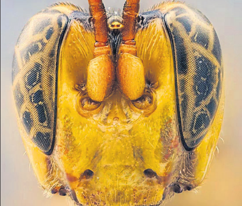
ନିକଟରେ ଏଲିୟନ ଭଳି ଏକ ଘାତକ ପରଜୀବୀକୁ ଆମାଜନୋପା ଠାବ କରାଯାଇଛି । ଯିଏ ପରପୋଷୀକୁ ଖାଇବା ପୂର୍ବରୁ ତା’ ଭିତରୁ ରକ୍ତ ପାନ କରିଥାଏ । ସାଧାରଣ

କିପରି ଫ୍ରିଂରେ ଯାତ୍ରା କରିହେବ, ସେନେଇ ଅନୁଲୋଚନରେ ଖୋଜିଥିଲେ । ଏହାପରେ ସେ କାନାଡାରେ ଅଣ୍ଟୋଲିଆକୁ ଯାତ୍ରା ପାଇଁ ଘୁମି କଲେ । ସେ ଅଣ୍ଟୋଲିଆରେ କୌଣସି ହୋଟେଲରେ ନ ରହି ସେଠାକାର ନାଗରିକଙ୍କ ଘରେ ଆଶ୍ରୟ ନେଇଥିଲେ । ଏହା ବଦଳରେ ସେହି ଘରେ ଥିବା ଗୃହପାଳିତ ପ୍ରାଣୀଙ୍କ ଦେଖାଶୁଣା କରିବା ଭଳି ପାଇଁ ମଧ୍ୟ କଲେ । ସେ ସେଠାରେ ରାଜିତି କରିବା ସହ ମାଗଣାରେ ରହୁଥିଲେ । ହେଲି ତାଙ୍କର ଏହି ଚିତ୍ରରେ ଅନେକ ଗୃହପାଳିତ ପ୍ରାଣୀଙ୍କ ଦେଖାଶୁଣା କରିଛନ୍ତି । ଏହିପରି ଭାବେ ସେ ବ୍ରିସ୍ବେନ, ହିଟରଲାଣ୍ଡ, ଗୋଲ୍ଡ କୋଷ୍ଟ ଭଳି ସ୍ଥାନରେ ଫ୍ରିଂରେ ରହି ୧୦ ଲକ୍ଷରୁ ଊର୍ଦ୍ଧ୍ୱ ଟଙ୍କା ରୋଜଗାର କରିଛନ୍ତି ।