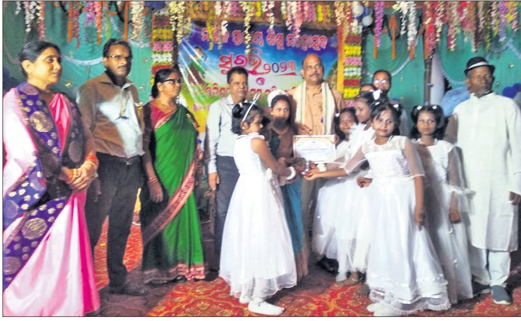
କୃତୀ ଛାତ୍ରାଛାତ୍ରୀଙ୍କୁ ଅଭିଯୁକ୍ତ ପ୍ରମାଣପତ୍ର ପ୍ରଦାନ କରୁଛନ୍ତି ।