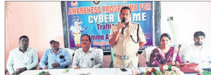
ଶିବିରରେ ଯୋଗଦେଇଥିବା ଅତିଥି ।