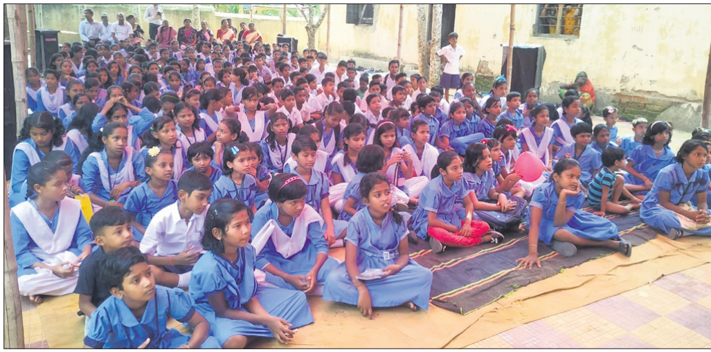
କାର୍ଯ୍ୟକ୍ରମରେ ଯୋଗଦେଇଥିବା ଶିକ୍ଷୟିତ୍ରୀ ଶିକ୍ଷକଙ୍କ ଗହଣରେ ଛାତ୍ରାଛାତ୍ରୀ ।