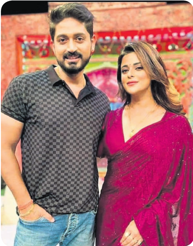
'ରାମ' ଫିଲ୍ମରେ ଅଭିନୟ-ରୁପସା