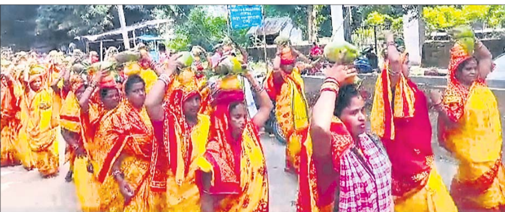
କଳସ ଶୋଭାଯାତ୍ରାରେ ସାମିଲ ଶ୍ରଦ୍ଧାଳୁ ।

ଖଣ୍ଡପଡ଼ା, ୧୮.୧୦ (ଅକ୍ଷୟ କୁମାର ମହାରଣା) ହଜାରେ ଉର୍ଦ୍ଧ୍ୱ ମହିଳା ପୁରୁଷ କଳସ ଶୋଭାଯାତ୍ରାରେ ସାମିଲ କରି ପାଣ୍ଡୁଗ୍ରାହ ପାଟଣା ଯଜ୍ଞସ୍ଥଳରେ ଅନୁଷ୍ଠିତ ହୋଇ ଆସୁଥିବା ବିଶ୍ୱ ଶାନ୍ତି ବୈଦିକ ମହାଯଜ୍ଞ ବୃଧବାର ୫୦୦ବର୍ଷରେ ପଦାର୍ପଣ କରିଛି । ଏଥିପାଇଁ ଗ୍ରାମବାସୀ ଚଳିତ ବର୍ଷ ଏହି ମହାଯଜ୍ଞର ସୁବର୍ଣ୍ଣ ଜୟନ୍ତୀ ପାଳନ କରୁଛନ୍ତି । ବୁଧବାରଠାରୁ ଆରମ୍ଭ ହୋଇଥିବା ଏହି ମହାଯଜ୍ଞ ଆସନ୍ତା ୨୯ ତାରିଖ ପର୍ଯ୍ୟନ୍ତ ଚାଲିବ । ଏହି ଅବସରରେ ବୁଧବାର ପୂର୍ବାହ୍ନରେ ଏକ କଳସ ଶୋଭାଯାତ୍ରା ଅନୁଷ୍ଠିତ ହୋଇଥିଲା । ଏଥିରେ ହଜାରେ ଉର୍ଦ୍ଧ୍ୱ ମହିଳା ଓ ପୁରୁଷ ଗଣ୍ଡା ମନ୍ଦିର ମହାନଦୀ ଘାଟକୁ ଜଳଭାଗ ନେଇ ଗ୍ରାମ ପରିକ୍ରମା କରିଥିଲେ ।