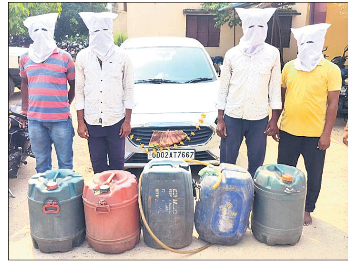
ଜବତ ଡିଭେଲ ସହ ଗିରଫ ଅଭିଯୁକ୍ତମାନେ ।