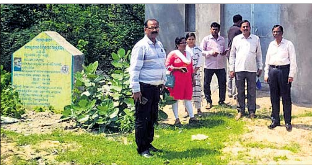
୬ମାସ ତଳେ ପ୍ରଶାସନିକ ଅଧିକାରୀମାନେ ତଦନ୍ତ କରୁଛନ୍ତି ।

୪ ଲକ୍ଷ ଟଙ୍କା ମଞ୍ଜୁର କରାଯାଇଥିଲା । ହେଲେ ନିମ୍ନମାନର ନିର୍ମାଣ କାର୍ଯ୍ୟ ହୋଇଛି । କୋଭିଡ଼ ସମୟରେ ଯେଉଁ ପ୍ରବାସୀ ଶ୍ରମିକମାନେ ପଞ୍ଚାୟତକୁ ଆସିଲେ ସେମାନଙ୍କ ପାଇଁ ଆସିଥିବା ଅର୍ଥରେ ଆସବାବପତ୍ର କିଣାଗଲା ସେ ସବୁ ବର୍ତ୍ତମାନ କୁଆଡ଼େ ଉଦ୍ଧାନ ହୋଇଯାଇଛି । ଏନେଇ ପଞ୍ଚାୟତରେ ଅନେକ କୋଟି ଟଙ୍କା ଆତ୍ମସାତ୍