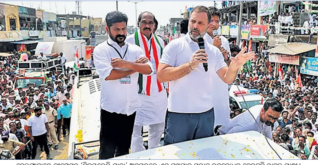
ଡେଲିଭେରୀରେ କଂଗ୍ରେସର 'ବିକେନ୍ଦ୍ର ରାମା' ଅଧିକାରରେ ଏକ ପ୍ରସ୍ତାବ ପ୍ରକାଶ କରାଯାଇଛି।