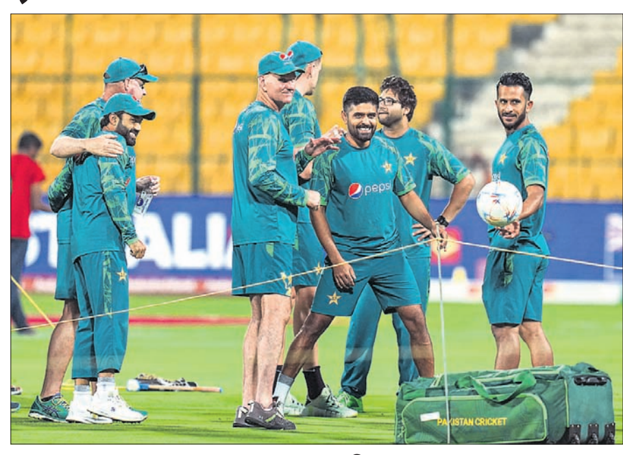
ଅଧିନାୟକ ବାବର ଆଜମଲ ସହ ପାକିସ୍ତାନ ଦଳର ଅଭ୍ୟାସ ।

ବେଙ୍ଗାଲୁରୁର ଏମ୍. ଚିନ୍ମାସୀ ଷ୍ଟାଡ଼ିୟମରେ ବିଶ୍ୱକପର ୧୮ତମ ମ୍ୟାଚରେ ଶୁକ୍ରବାର ପରସ୍ପରକୁ ଭେଟିବେ ପାକିସ୍ତାନ ଓ ଅଷ୍ଟ୍ରେଲିଆ। ଉଭୟ ଦଳ ଏହି ମ୍ୟାଚରେ ନିଜର ବ୍ୟାଟିଂ ଓ ବୋଲିଂରେ ଉନ୍ନତ ଆଖିବାକୁ ଚେଷ୍ଟା କରିବେ। ଅଷ୍ଟ୍ରେଲିଆ ତୁରନ୍ତ ପରାଜୟ ପରେ ବିଜୟ ଧାରାକୁ ଫେରିଥିବା ବେଳେ ପାକିସ୍ତାନର ବ୍ୟାଟିଂ ଓ ବୋଲିଂ ଦୁର୍ବଳତା ଭାରତ ବିପକ୍ଷ ମ୍ୟାଚରେ ପଦାରେ ପଡ଼ିଛି। ଉଭୟ ଦଳର ବ୍ୟାଟିଂ ଓ ବୋଲିଂରେ ତଥା ଦଳ ଚୟନକୁ ନେଇ ରହିଥିବା ଦୁର୍ବଳତାକୁ ଏଡ଼ାଇବାକୁ ଚେଷ୍ଟା କରିବେ। ପାକିସ୍ତାନ ଦଳ ସର୍ବଦା ଚାପରେ ଭଲ ପ୍ରଦର୍ଶନ କରିଆସି। ଏହାର ଉଦାହରଣ ହେଉଛି ୧୯୯୨ ବିଶ୍ୱକପ। ଦଳ ଯେଉଁ ସ୍ଥିତିରେ ଯାଇ ବିଶ୍ୱକପ ଜିତିଥିଲା ତାହା ପ୍ରଶଂସନୀୟ। ଶ୍ରୀଲଙ୍କା ବିପକ୍ଷରେ ୩୪୫ ରନ୍ ଯୁକ୍ତ ସମତାପର ସହ ଚେକ୍ କରି ବିଶ୍ୱକପରେ ପାକିସ୍ତାନ ବିପକ୍ଷରେ ୧୯୯୧ ରନ୍ରେ ଅଳ୍ପାଧିକ ହୋଇ ଅସ୍ଥିର ପ୍ରଦର୍ଶନର ଉଦାହରଣ ଦେଇଥିଲା। ଅନ୍ୟପକ୍ଷରେ ୪ ଥର ବିଶ୍ୱ ଚାମ୍ପିୟନ ସର୍ବଦା ନିଜର ଲକ୍ଷ୍ୟ ମନୋଭାବ ପାଇଁ ପ୍ରସିଦ୍ଧ। ପ୍ରଥମ ଦୁଇ ମ୍ୟାଚ୍ ହାରିଥିଲେ ମଧ୍ୟ ଶ୍ରୀଲଙ୍କା ବିପକ୍ଷରେ ବିଜୟ ହାସଲ କରିଥିଲା। ଏହି ବିଜୟ ସହ ଦଳ ଆଧୁନିକାୟରେ ରହିଥିବା ବେଳେ ଏହା ପାକିସ୍ତାନ ବିପକ୍ଷରେ ସହାୟକ ହେବ। ସେହିପରି ଉଭୟ ଦଳ ମଧ୍ୟରେ ଦିନିକିଆ ପ୍ରଦର୍ଶନକୁ ଧ୍ୟାନରେ