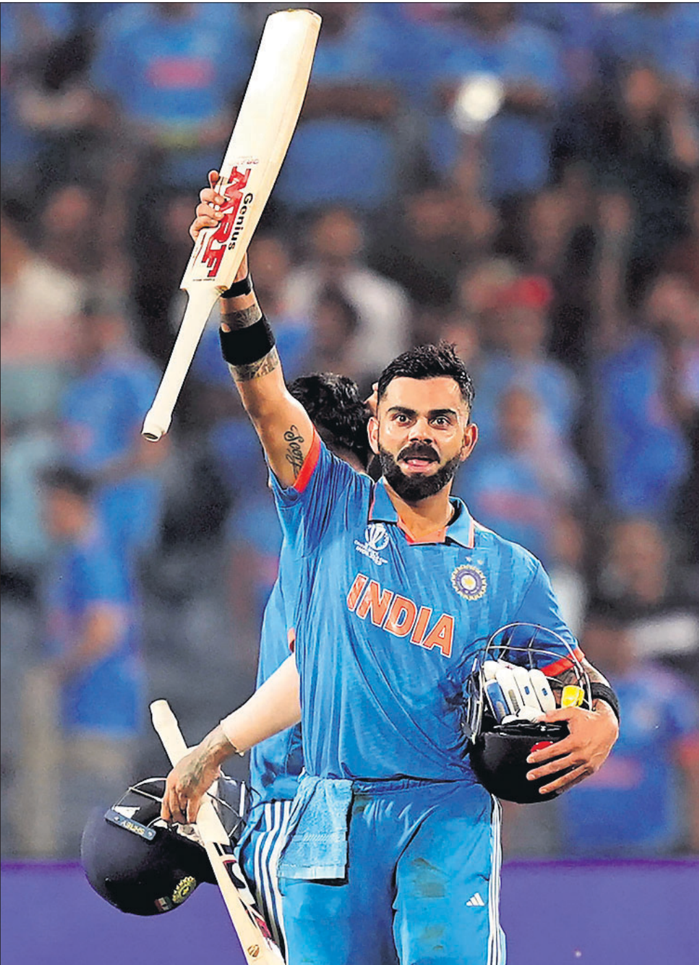
ପୁଣେରେ ରୁରୁବାର ଅନୁଷ୍ଠିତ ବାଂଲାଦେଶ ବିପକ୍ଷ ବିଶ୍ୱକପ୍ ଟ୍ରାନ୍ସକ୍ସ ମ୍ୟାଚରେ ଶତକ ହାସଲ ପରେ ବିରାଟ କୋହଲି।