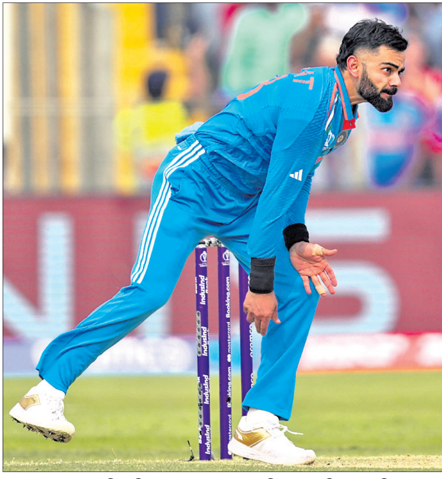
ବାଲାଦେଶ ବିପକ୍ଷ ବିଶ୍ୱକପ ମ୍ୟାଚରେ ଗୁରୁବାର ବୋଲି ଆକ୍ରମଣରେ ବିରାଟ କୋହଲି।

ସଚିନ୍ଙ୍କ ରେକର୍ଡ ଭାଙ୍ଗିଲେ କୋହଲି ଭାରତୀୟ କ୍ରିକେଟର ମାଲକିଷୋର ମ୍ୟାନ୍ ବିରାଟ କୋହଲି ନିଜ ନାମରେ ଆଉ ଏକ ରେକର୍ଡ କରିଛନ୍ତି। ଏହା ସହ ଭାରତୀୟ କ୍ରୀଡ଼ା କ୍ରୀଡ଼ା ସଚିନ୍ ଚେନ୍ନାଇକରଙ୍କ ଆଉ ଏକ ରେକର୍ଡ ଭାଙ୍ଗିଛନ୍ତି କୋହଲି। ଭୁବନେଶ୍ୱର ଖେଳାଳି ଭାବରେ ୨୬ ହଜାର ରନ ସ୍କୋର କରିଥିବା କୋହଲି ପୁଣ୍ୟବେଶ ବାଲାଦେଶ ବିପକ୍ଷ ବିଶ୍ୱକପ ମ୍ୟାଚ୍ରେ ଅପରାଜିତ ୧୦୩ ରନର ଇନିଂସ ଖେଳି କୋହଲି ଏହି ମାଲକିଷୋରଙ୍କ ହାସଲ କରିଛନ୍ତି। ସଚିନ୍ ଚେନ୍ନାଇକର ୬୦୦ ତମ ଅନ୍ତର୍ଜାତୀୟ ଇନିଂସରେ ୨୬ ହଜାର ରନ ସ୍କୋର କରିଥିବା ବେଳେ କୋହଲି ୫୬୭ ତମ ଇନିଂସରେ ଏହି ସଫଳତା ହାସଲ କରିଛନ୍ତି। ଏହା ସହିତ ଅନ୍ତର୍ଜାତୀୟ କ୍ରିକେଟରେ ସର୍ବାଧିକ ରନସଂଗ୍ରହକାରୀ ଖେଳାଳିଙ୍କ ମଧ୍ୟରେ କୋହଲି ଚତୁର୍ଥ ସ୍ଥାନରେ ପହଞ୍ଚିଛନ୍ତି। ୫୬୭ ତମ ଇନିଂସକୁ ସେ ୨୬୦୨୩ ରନ ସହିତ ଚତୁର୍ଥ ସ୍ଥାନରେ ରହିଛନ୍ତି।