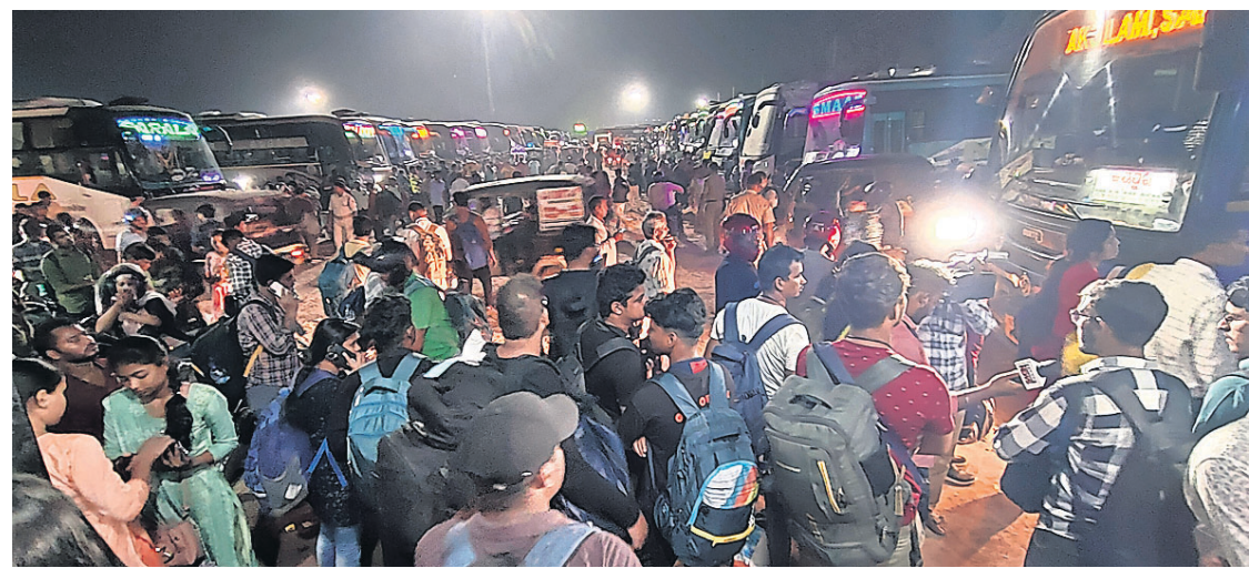
ଘରୋଇ ବସ୍ ସଂଘ ପକ୍ଷରୁ ବସ ଡାକରା ଦେବା ପରେ ବରମୁଣ୍ଡା ବସଷ୍ଟାଣ୍ଡରେ ଗୁରୁବାର ଗଡ଼ବ୍ୟସ୍ତକକୁ ଯିବା ଲାଗି ଯାତ୍ରୀଙ୍କ ପ୍ରବଳ ଭିଡ଼।