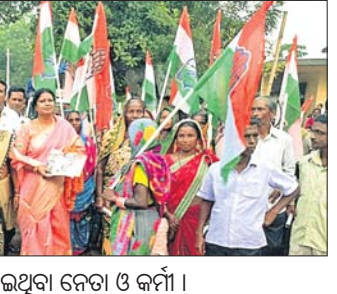
ପଦଯାତ୍ରାରେ ସାମିଲ ହୋଇଥିବା ନେତା ଓ କର୍ମୀ।

ଉଦ୍‌ଘାଟନ, ଉଦ୍‌ଘାଟକତା, ଗୁଣବତ୍ତା, ନିରାପତ୍ତା, କଲ୍ୟାଣ ଏବଂ କର୍ମଚାରୀଙ୍କ ପ୍ରଶିକ୍ଷଣ ସମ୍ବନ୍ଧୀୟ ପ୍ରସଙ୍ଗ ଉପରେ ଆଲୋଚନା ପାଇଁ ଏକ ପ୍ଲାଟଫର୍ମ ପ୍ରଦାନ କରିବା ଏହି ବ୍ୟବସ୍ଥାର ଉଦ୍ଦେଶ୍ୟ ହେଉଛି ଏକ ସୌହାର୍ଦ୍ଦ୍ୟପୂର୍ଣ୍ଣ ଏବଂ ଉଦ୍‌ଘାଟନ କାର୍ଯ୍ୟ ପରିବେଶ ସୃଷ୍ଟି କରିବା, ଯାହା ସହଯୋଗକୁ ପ୍ରୋତ୍ସାହିତ କରିବ। କାର୍ଯ୍ୟକ୍ରମରେ ଗାଟା ସ୍କିଲର ବିଭିନ୍ନ ନେତୃତ୍ୱ, ସଂଘ ଅଧିକାରୀ କର୍ମଚାରୀ, ସଂଘ ଏବଂ ପରିଚାଳନା