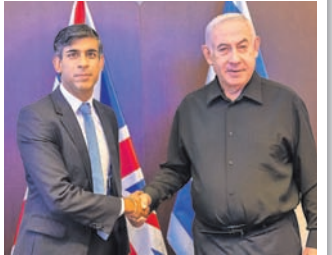
ରଷି ସୁନକଙ୍କ ସହ ବେନିଆମିନ୍ ନେତାନ୍ୟାହୁ ପୁରୁଷିତ ଭାବେ ପ୍ରତ୍ୟାବର୍ତ୍ତନ ପୁସ୍ତକ ଦେଇଥିବା ସୁନକଙ୍କୁ ଧନ୍ୟବାଦ ଦେଇ ଇସ୍ରାଏଲକୁ ପୂର୍ଣ୍ଣ ଅଧିକାର ଦେବାକୁ ଅନୁରୋଧ କରିଛନ୍ତି।

ଆମେରିକା ରାଷ୍ଟ୍ରପତି ଜୋ ବାଇଡେନ୍‌ଙ୍କ ପରେ ତ୍ରିତରଫ ପ୍ରଧାନମନ୍ତ୍ରୀ ରଷି ସୁନକ ଗୁରୁବାର ଇସ୍ରାଏଲରେ ପହଞ୍ଚିଛନ୍ତି। ଏହି ଅବସରରେ ସେ ଇସ୍ରାଏଲକୁ ଦୃଢ଼ ସମର୍ଥନ ଜଣାଇଛନ୍ତି। ହମାସ୍ ବିରୋଧୀ ଯୁଦ୍ଧରେ ଆମେରିକା ପାଇଁ ଇସ୍ରାଏଲର ପୂର୍ଣ୍ଣ ଅଧିକାର ଥିବା ସୁନକ ପ୍ରକାଶ କରିଛନ୍ତି। ଇସ୍ରାଏଲ ପ୍ରଧାନମନ୍ତ୍ରୀ ବେନିଆମିନ୍ ନେତାନ୍ୟାହୁଙ୍କ ସହ ଏକ ମିଳିତ ଖବରଦାତା ସମ୍ମିଳନୀକୁ ସମେତ କରି ସୁନକ କହିଛନ୍ତି, ଗାଜାବାସୀଙ୍କ କ୍ଷତି ନ ଘଟିବା ଦିଗରେ ତେଜ୍ ଅଭିଭାଷଣ ପକ୍ଷରୁ ନିଆଯାଉଥିବା ସତର୍କତାମୂଳକ ପଦକ୍ଷେପ ଉଲ୍ଲେଖନୀୟ। ତ୍ରିତରଫ ନାଗରିକମାନଙ୍କୁ