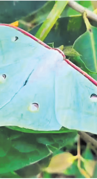
ଲୁନା ମୈଥ ପ୍ରଜାତିର ବିରଳ ପ୍ରଜାପତି ଏକତା ହିଁ ବଳ