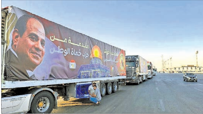
ସହାୟତା ପହଞ୍ଚାଇବା ପାଇଁ ଇଡିଆର ପକ୍ଷରୁ ରୁଷିଆରୁ ଟ୍ରକ୍‌ଗୁଡ଼ିକ ଛଡ଼ା ହୋଇଛି।

ମୁଖ ପ୍ରତାପିତ ଗାଜା ସ୍ଥିତିରେ ନାହିଁ ନ ଥିବା ଦୁର୍ଦ୍ଦଶା ଯୋଗୁଁ ପାକିସ୍ତାନ ପାଇଁ ରୁଷିଆର ରୁଷିଆ ପକ୍ଷରୁ ୨୭ ଟ୍ରକ୍ ସହାୟତା ପଠାଯାଇଛି। ଏହି ଅତ୍ୟାବଶ୍ୟକ ସାମଗ୍ରୀଗୁଡ଼ିକ ଇଡିଆର ପରିବହନ କରାଯିବ ବୋଲି ରୁଷିଆର କରୁଆ ସ୍ଥିତି ମନ୍ତ୍ରଣାଳୟ ପକ୍ଷରୁ ସୂଚନା ଦିଆଯାଇଛି।