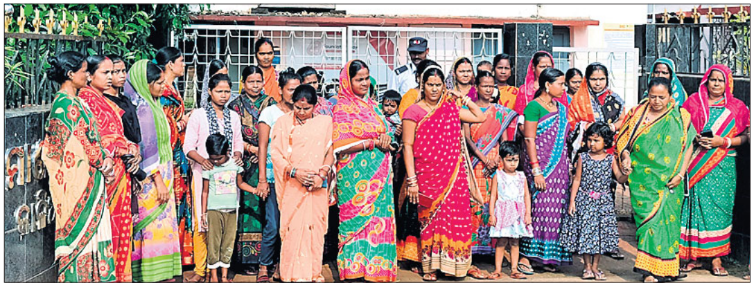
ଓଡ଼ିଶା ଖଣି ନିଗମ କାଳିଆପାଣି କାର୍ଯ୍ୟାଳୟରେ ମହିଳା ଧାରଣା ଦେଇଛନ୍ତି।