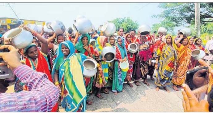
ମହିଳମାନେ ହାଣ୍ଡି ମାଠିଆ ଧରି ରାସ୍ତା ଅବରୋଧ କରିଛନ୍ତି।

ଧରାକୋଟ ବ୍ଲକ୍ ଅନ୍ତର୍ଗତ ରେଞ୍ଜା ଦାମୋଦର ପଲ୍ଲୀ ପଞ୍ଚାୟତର କମା ଶାସନ ଗ୍ରାମରେ ପାନୀୟ ଜଳ ଯୋଗାଣ ସମସ୍ୟାକୁ ନେଇ ଗ୍ରାମବାସୀଙ୍କ ଦ୍ୱାରା ଜାତୀୟ ରାଜପଥ ୫୯କୁ ଗୁରୁବାର ଅବରୋଧ କରାଯାଇ ଥିଲା। କମା ଶାସନ ଗ୍ରାମରେ ପାନୀୟ ଜଳର ଯୋଗ ଅଭାବ ଏବଂ ସମଗ୍ର ଗ୍ରାମରେ ପାଣିର ସଂକଳନ ନେଇ ଉତ୍ତ୍ୟକ୍ତ ସମସ୍ତ ଜନ ସାଧାରଣ ମହିଳାଙ୍କୁ ସାଙ୍ଗରେ ନେଇ ଖାଲି ହାଣ୍ଡି ମାଠିଆ ଧରି ରାଜପଥକୁ ଅବରୋଧ କରିଥିଲେ। ରାଜପଥ ଅବରୋଧ ଯୋଗୁ ଉଭୟ ପଟରେ ଶତାଧିକ ଯାତ୍ରୀଙ୍କ