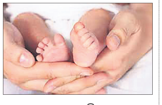
ପୁରୀର ବାଲକ ପତିୟା ଅଞ୍ଚଳରେ ଜନ୍ମ ହୋଇଥିବା ଶିଶୁଟି ହଲଟଲ ନ ହେବା ଓ ନ କାନ୍ଦିବାକୁ ଡାକ୍ତରୀ ଶିଶୁ ହସ୍ପିଟାଲରେ ଭର୍ତ୍ତି କରାଯାଇଥିଲା। ଡାକ୍ତରମାନଙ୍କ ଉପଯାଗ ସହେ କୌଣସି ଫଳ ନ ମିଳିବାରୁ ଉକ୍ତ ଶିଶୁକୁ ଟ୍ରେନ୍‌ଡେଡ୍ ଯୋଷଣା କରାଯାଇଥିଲା। ଫଳରେ ଶିଶୁର ମାଆବାପା ଡା'ର ଅଜାସଙ୍କୁ ହସ୍ପିଟାଲକୁ କର୍ତ୍ତୃପକ୍ଷକୁ ଜଣାଇଥିଲେ, ଯେପରି ଉକ୍ତ ଅଜା ଦିଘ୍ନିକ ପୂର୍ବରୁ ଅନ୍ୟ କେତେକ ପିଲାଙ୍କ ଜୀବନରେ ଆଲୋକ ଆଣିପାରିବ।

ଗୁରୁବାର ପୁରୀରେ ଜଣେ ୪ ଦିନର ଟ୍ରେନ୍‌ଡେଡ୍‌ଶିଶୁ ଡା'ର ଅଜାସଙ୍କୁ ଦେଖିଛନ୍ତି। ଡାକ୍ତରମାନେ ଉକ୍ତ ଶିଶୁର ୨ କିଲୋ, ୨ କାର୍ଡିଆ, ଲିଭର ଏବଂ ପିତ୍ତାସ୍ରୁତ୍ କରୁଛନ୍ତି। ଏହି ଅନୁରୋଧ ଧାନ କେତେକ ଶିଶୁଙ୍କ ଜୀବନ ବଞ୍ଚାଇବାରେ ସହାୟକ ହୋଇପାରିବ ନେଇ ଆଶାସଞ୍ଚାର ହୋଇଛି। ଜଣେ ୮ ମାସର ଶିଶୁ ଡାକ୍ତରୀ ପ୍ରତିରୋପଣ ଲାଗି ଏହାକୁ ଅଧିକାରୀଙ୍କୁ ଇନ୍‌ସ୍ପେକ୍ଟର୍ ଅଫ୍ କିଲ୍‌ଡିଆ ଡିଭିଜନ୍ ଆଣ୍ଡ ରିଭର୍ଟ ସେକ୍ସରୁ ପଠାଯାଇଥିବାବେଳେ ଜଣେ ୧୦ ମାସର ଶିଶୁ ଦେହରେ ଲିଭର ଲଗାଇବା ପାଇଁ ଏହାକୁ ନୂଆଦିଲ୍ଲୀର ଇନ୍‌ସ୍ପେକ୍ଟର୍ ଅଫ୍ ଲିଭର ଆଣ୍ଡ ବାଲିଷ୍ଟିଆରି ସାଇନ୍ (ଆଇଏଲ୍‌ସିଏସ୍)କୁ ପଠାଯାଇଛି। ସୂଚନାଯୋଗ୍ୟ, ଗତ ୧୩ ତାରିଖରେ