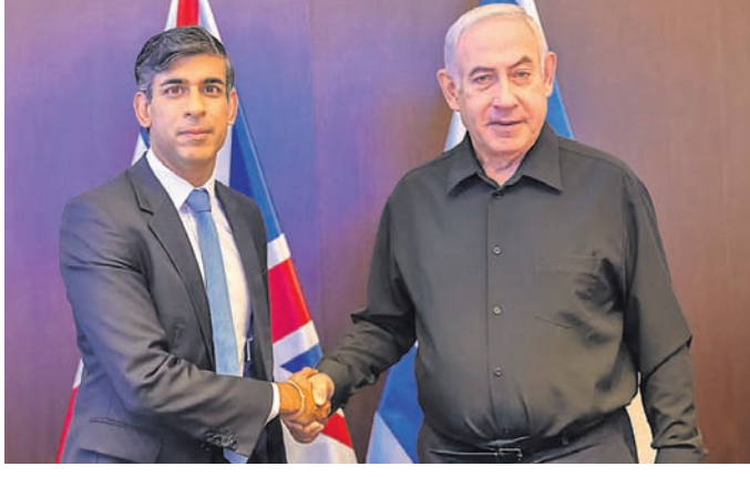
ରଷି ସୁନକଙ୍କ ସହ ବେଞ୍ଜାମିନ୍ ନେତାମ୍ୟାସୁ।

ହମାସ୍ ସହ ଏକାଠି ଗୁରୁତ୍ୱପୂର୍ଣ୍ଣ ଦିନରେ ଇସ୍ରାଏଲ ପ୍ରଧାନମନ୍ତ୍ରୀ ବେଞ୍ଜାମିନ୍ ନେତାମ୍ୟାସୁ ଏହାକୁ ଏକ ଦୀର୍ଘକାଳୀନ ମୁଦ୍ଦା ଭାବେ ଅଭିହିତ କରି ଏଥିପାଇଁ ସେ ତ୍ରିତରଫ ନିରନ୍ତର ସମର୍ଥନ ଲୋଡ଼ିଛନ୍ତି। ଆମେରିକା ରାଷ୍ଟ୍ରପତି ଜୋ ବାଇଡେନ୍‌ଙ୍କ ପରେ ତ୍ରିତରଫ ପ୍ରଧାନମନ୍ତ୍ରୀ ରଷି ସୁନକ ଗୁରୁତ୍ୱପୂର୍ଣ୍ଣ ଇସ୍ରାଏଲରେ ପହଞ୍ଚିଛନ୍ତି। ଏହି ଅବସରରେ ସେ ଇସ୍ରାଏଲକୁ ଦୃଢ଼ ସମର୍ଥନ ଜଣାଇଛନ୍ତି। ହମାସ୍ ବିରୋଧୀ ମୁଦ୍ଦାରେ ଆମ୍ବରକ୍ଷା ପାଇଁ ଇସ୍ରାଏଲର ପୂର୍ଣ୍ଣ ଅଧିକାର ଥିବା ସୁନକ ପ୍ରକାଶ କରିଛନ୍ତି। ନେତାମ୍ୟାସୁଙ୍କ ସହ ଏକ ମିଳିତ ଖବରଦାତା ସମ୍ମିଳନୀକୁ ସମେୟତ କରି ସୁନକ କହିଛନ୍ତି, ଗାଜାବାସୀଙ୍କ କ୍ଷତି ନ ଘଟିବା ଦିଗରେ ତେଲ ଆଭିଭ ପକ୍ଷରୁ ନିଆଯାଉଥିବା ସୁଯୋଗ ବେଳେ ଇସ୍ରାଏଲର ପ୍ରତ୍ୟାବର୍ତ୍ତନ ସୁଯୋଗ ଦେଇଥିବାକୁ ସୁଯୋଗ ଦେଇଛନ୍ତି।