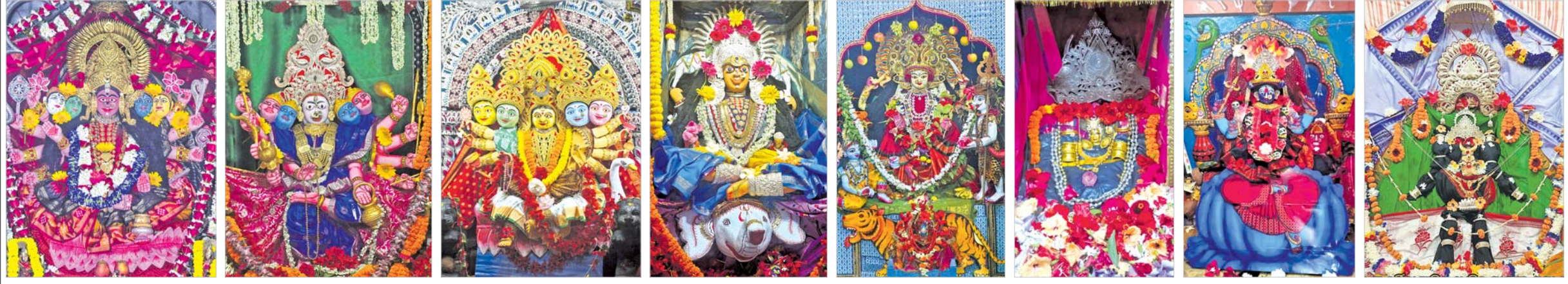
ଷୋଳପୂଜା ଅବସରରେ ମା' କଟକଚଣ୍ଡାଳ ଗାୟତ୍ରୀ ବେଶ । ମା' ଗଡ଼ଚଣ୍ଡାଳ ଗାୟତ୍ରୀ ବେଶ । ମା' ଝାଞ୍ଜିମଙ୍ଗଳାଳ ଗାୟତ୍ରୀ ବେଶ । ମା' ବାସନ୍ତୀ ଦୁର୍ଗାଳ ଗଜଲକ୍ଷ୍ମୀ ବେଶ । ପିଠାପୁରସ୍ଥିତ ମା' ଧାନ୍ତଲକ୍ଷ୍ମୀ ବେଶ । ବଡ଼ମ୍ବା ଭଗୀରୀକାଳ ଗାୟତ୍ରୀ ବେଶ । ନୂଆପାଟଣା କଳାପାଟ ଠାକୁରାଣୀକାଳ ତ୍ରିପୁରାବେଶ । ମା' ଚଣ୍ଡିକାଳ ବସନ୍ତ ବେଶ ।