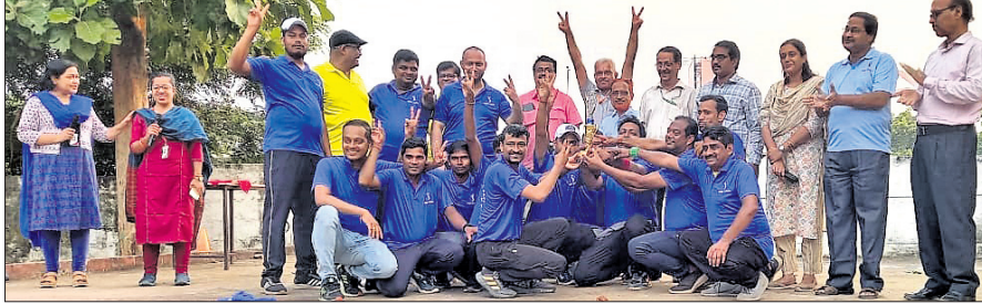
ଅତିଥିକ ଗହଣରେ ବିକେଟା ଚନ୍ଦ୍ରଶେଖରପୁର ଭେଙ୍କଟେଶ୍ୱର ସ୍କୁଲର ଖେଳାଳିମାନେ।