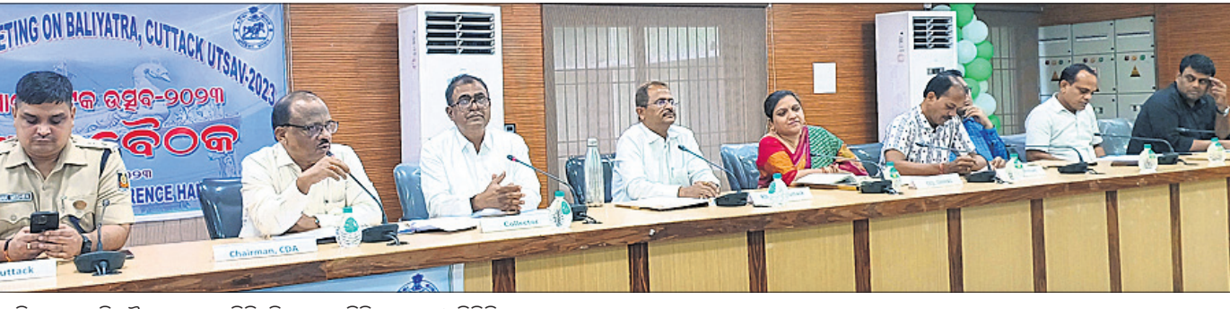
ବାଲିଯାତ୍ରା ପ୍ରସ୍ତୁତି ବୈଠକରେ ଆରତି, ଜିଲାପାଳ, ସିଏସ୍ ଅଧ୍ୟକ୍ଷ ଓ ଡିପିପିଙ୍କ ସହ ଅନ୍ୟମାନେ।

ନଭେମ୍ବର ୨୭ ତାରିଖରୁ ଆରମ୍ଭ ହେବାକୁ ଥିବା ଐତିହାସିକ କଟକ ବାଲିଯାତ୍ରାର ମୁଖ୍ୟ ଆକର୍ଷଣ ସାଜିବ କଟକ ଇନ୍ କଟକ ପାଲିଯାତ୍ରାରେ ଗ୍ରାମ୍ୟ କଟକର ପ୍ରତିଫଳନ। ଏଥିପାଇଁ ଦାସ ନିବେଦନ କରିଛନ୍ତି। ସେହିଭଳି ଡିଜେ ମୁକ୍ତ ରୋଷଣୀ ଓ ନିଶାମୁକ୍ତ ଭଣାଣୀ ପାଳନ କରିବା ପାଇଁ ସେ କହିଛନ୍ତି।