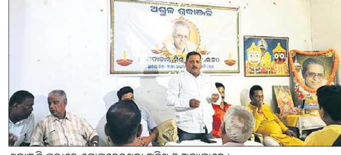
ଶ୍ରୀକାଞ୍ଚଳ ସଭାରେ ଯୋଗଦେଇଥିବା ଅତିଥି ଓ ଅନ୍ୟମାନେ ।