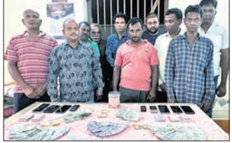
କଟକ, ୧୯୧୦