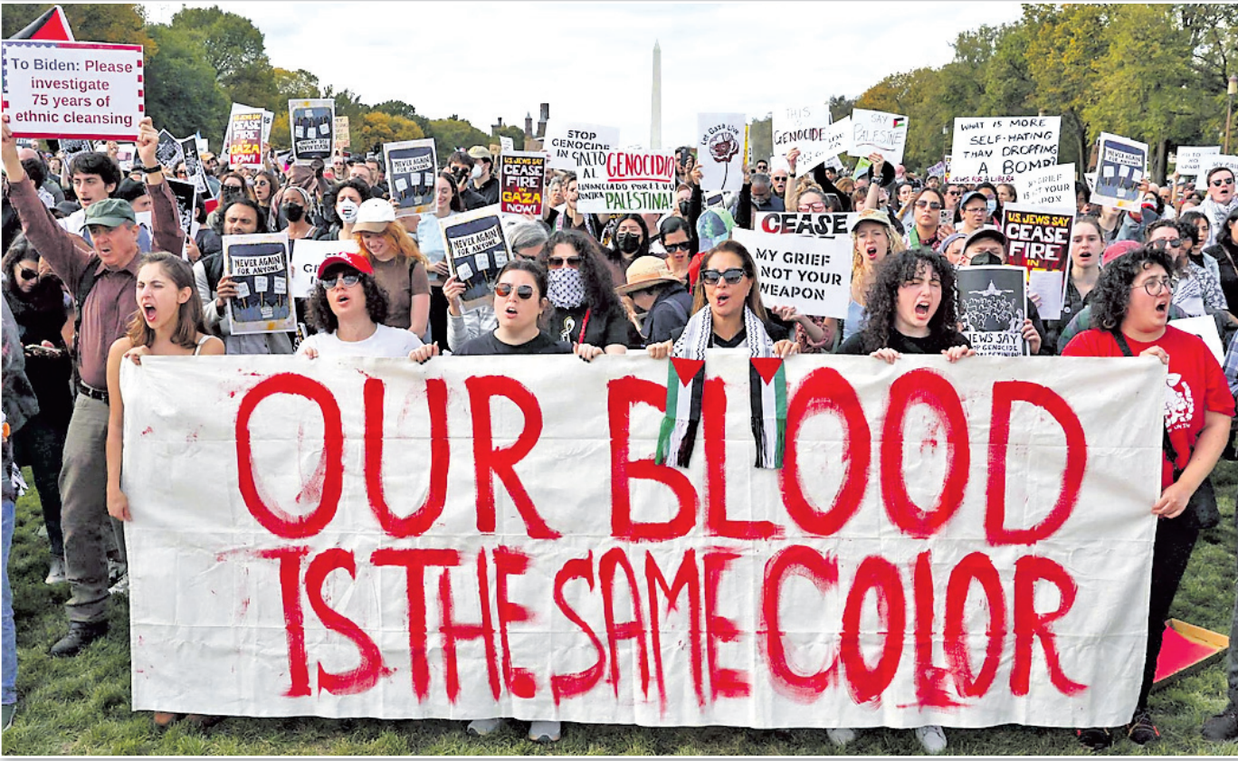
ଗାଜାରେ ଅସୁବିଧିତ ଦାବିରେ ଖ୍ରୀଷ୍ଟିୟାନ ଲୋକମାନଙ୍କ ଦ୍ୱାରା ଆମେରିକାରେ ଉପାସନା।

ପୁସ୍ତକାଳୟ ସର୍ବସାଧାରଣରେ ଶାନ୍ତି ପୂର୍ଣ୍ଣ ହେଲା ଅହମଦାବାଦ, ୧୯୧୦ ଗୁଜରାଟର ଖେଡା ଜିଲ୍ଲାରେ ୫ ପୁସ୍ତକାଳୟ ସ୍ତରକୁ ସର୍ବସାଧାରଣରେ ଦଖ୍ତ ଦେବା ନିମନ୍ତେ ଗୁଜରାଟ ହାଇକୋର୍ଟ ଗୁରୁତ୍ୱପୂର୍ଣ୍ଣ ନିର୍ଦ୍ଦେଶ ଦେବା ପରେ ୪ ପୋଲିସ୍ ଅଫିସରଙ୍କୁ ଦୋଷୀ ସାବ୍ୟସ୍ତ କରି ୧୪ ଦିନ ପାଇଁ ଜେଲ ପଠାଇଛନ୍ତି। ଗତବର୍ଷ ଅକ୍ଟୋବର ୪ରେ ଉକ୍ତ ଜିଲ୍ଲାରେ ଗରବା ଉତ୍ସବବେଳେ ଉକ୍ତ ପୁସ୍ତକାଳୟରେ ଚୋରୀ ପିଣ୍ଡିଥିବା ଅଭିଯୋଗ ହୋଇଥିଲା। ପୋଲିସ୍ ସେମାନଙ୍କୁ ଗିରଫ କରି ଏକ ଖୁଣ୍ଟରେ ବାନ୍ଧି ଲୋକମାନଙ୍କ ଉପସ୍ଥିତିରେ ବେହାରିଆ କରିଥିଲା। ଏଥିପ୍ରତି ଅପିସରମାନଙ୍କୁ ୨,୦୦୦ ଟଙ୍କା ଲେଖାଏ ଜରିମାନା ଦେବାକୁ ନିର୍ଦ୍ଦେଶ ଦେଇଛନ୍ତି। ଜରିମାନା ଦେବା ନ ଜେଲ ସେମାନଙ୍କୁ ଆଉ ୩ ଦିନ ଜେଲରେ ରହିବାକୁ ପଡ଼ିବ।