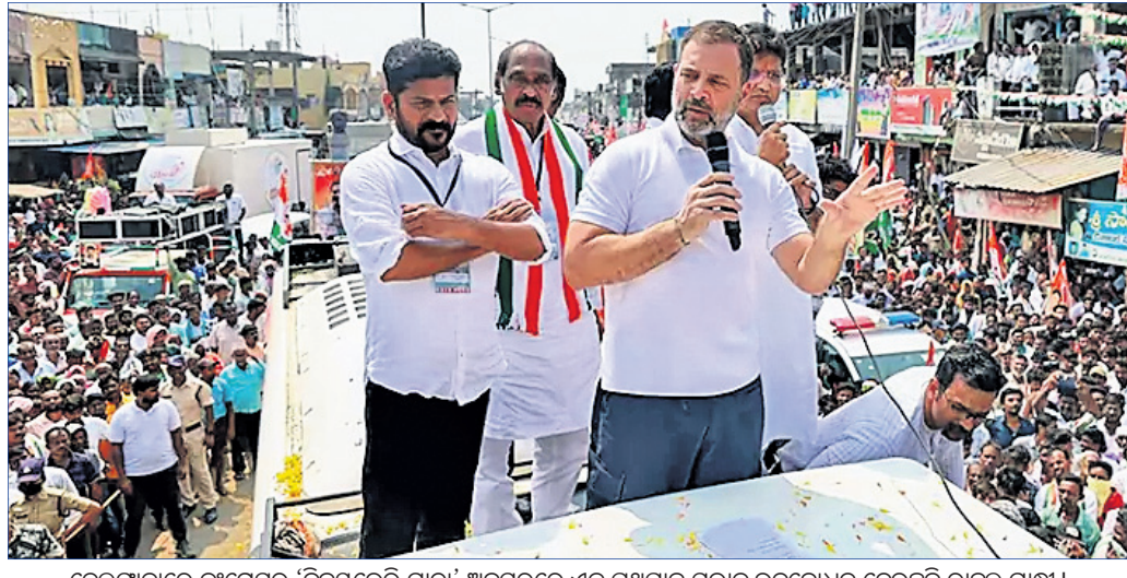
ତେଲଙ୍ଗାନାରେ କଂଗ୍ରେସର 'ବିକ୍ଷୟଭେରି ଯାତ୍ରା' ଅବସରରେ ଏକ ପ୍ରସ୍ତାବ ସଭାକୁ ଉଦ୍ଦେଶ୍ୟରେ ଦେଖିବାକୁ ରାହୁଲ ଗାନ୍ଧୀ ।

ନୂଆଦିଲ୍ଲୀ, ୧୯୧୧୦ ତେଲଙ୍ଗାନାରେ କଂଗ୍ରେସ ଶମତାକୁ ଆସିଲେ ଜାତି ଜନଗଣନା କରାଯିବ ବୋଲି ଦଳର ନେତା ରାହୁଲ ଗାନ୍ଧୀ ଗୁରୁବାର ରାଜ୍ୟବାସୀଙ୍କୁ ପ୍ରତିଶ୍ରୁତି ଦେଇଛନ୍ତି । ତେଲଙ୍ଗାନା ବିଧାନସଭା ନିର୍ବାଚନ ନଭେମ୍ବର ୩୦ରେ ଅନୁଷ୍ଠିତ ହେବାରୁ ଯାତ୍ରାରେ ରାହୁଲ ଗାନ୍ଧୀ ଯିବା ବାଟରେ ଏକ ପ୍ରସ୍ତାବ ସଭାକୁ ଉଦ୍ଦେଶ୍ୟରେ ଦେଖିବାକୁ