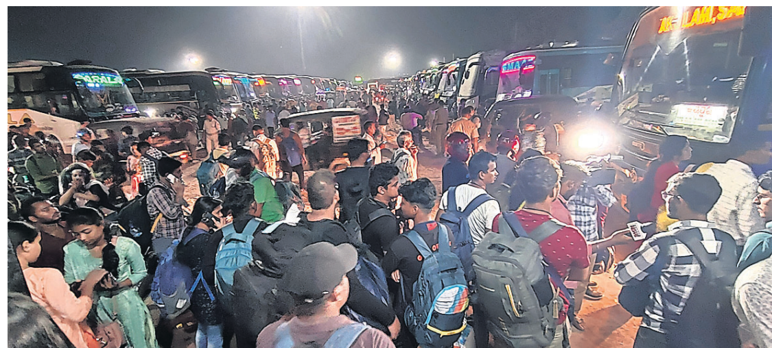
ଘରୋଇ ବସ୍ ସଂଘ ପକ୍ଷରୁ ବସ ଡାକରା ଦେବା ପରେ ବରମୁଣ୍ଡା ବସଷ୍ଟାଣ୍ଡରେ ଗୁରୁବାର ଗଡ଼ବ୍ୟସ୍ତକକୁ ଯିବା ଲାଗି ଯାତ୍ରୀଙ୍କ ପ୍ରବଳ ଭିଡ଼।