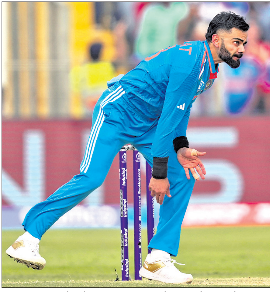
ବାଂଲାଦେଶ ବିପକ୍ଷ ବିଶ୍ୱକପ ମ୍ୟାଚରେ ଗୁରୁବାର ବୋଲି ଆକ୍ରମଣରେ ବିରାଟ କୋହଲି।