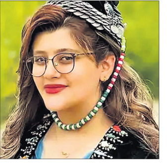
ସ୍ତ୍ରୀସର୍ବ (ପ୍ରାନ୍ତ), ୧୯୧୦

ଗତବର୍ଷ ଉତ୍ତର ଜଙ୍ଗଲରେ ଗୁଣ୍ଡା ପିନ୍ଧି ନ ଥିବାରୁ ଇନ୍ଦୁ ମାନବାଧିକାର ପୁରସ୍କାର ପ୍ରଦାନ କରାଯାଇଥିଲା। ସର୍ବସାଧାରଣରେ ଦଖ୍ତ ଦେବା ନିମନ୍ତେ ଗୁଜରାଟ ହାଇକୋର୍ଟ ଗୁରୁତ୍ୱପୂର୍ଣ୍ଣ ନିର୍ଦ୍ଦେଶ ଦେବା ପରେ ୪ ପୋଲିସ୍ ଅଫିସରଙ୍କୁ ଦୋଷୀ ସାବ୍ୟସ୍ତ କରି ୧୪ ଦିନ ପାଇଁ ଜେଲ ପଠାଇଛନ୍ତି। ଗତବର୍ଷ ଅକ୍ଟୋବର ୪ରେ ଉକ୍ତ ଜିଲ୍ଲାରେ ଗରବା ଉତ୍ସବବେଳେ ଉକ୍ତ ପୁସ୍ତକାଳୟରେ ଚୋରୀ ପିଣ୍ଡିଥିବା ଅଭିଯୋଗ ହୋଇଥିଲା। ପୋଲିସ୍ ସେମାନଙ୍କୁ ଗିରଫ କରି ଏକ ଖୁଣ୍ଟରେ ବାନ୍ଧି ଲୋକମାନଙ୍କ ଉପସ୍ଥିତିରେ ବେହାରିଆ କରିଥିଲା। ଏଥିପ୍ରତି ଅପିସରମାନଙ୍କୁ ୨,୦୦୦ ଟଙ୍କା ଲେଖାଏ ଜରିମାନା ଦେବାକୁ ନିର୍ଦ୍ଦେଶ ଦେଇଛନ୍ତି। ଜରିମାନା ଦେବା ନ ଜେଲ ସେମାନଙ୍କୁ ଆଉ ୩ ଦିନ ଜେଲରେ ରହିବାକୁ ପଡ଼ିବ।