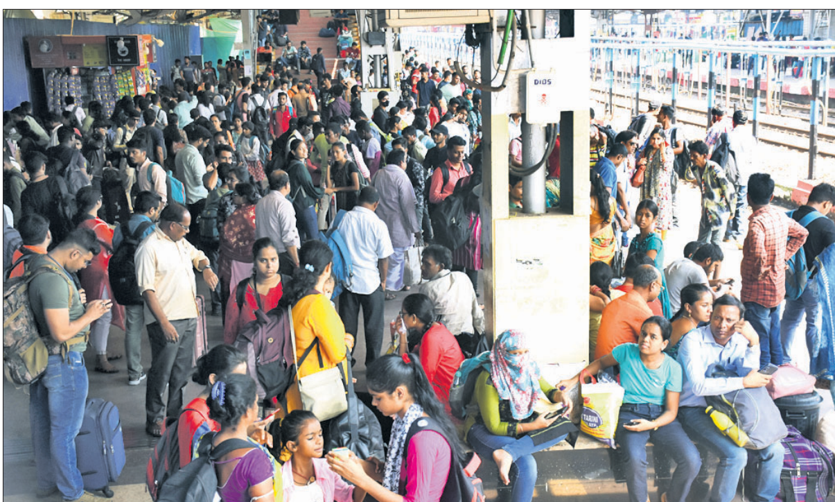
ବସ୍ ଧର୍ମଘଟ ପ୍ରତ୍ୟାହାର ପୂର୍ବରୁ ଗରବ୍ୟସ୍ଥଳକୁ ଯିବା ପାଇଁ ବ୍ୟସ୍ତ ହୋଇପଡ଼ିଥିବା ଯାତ୍ରୀମାନେ ଭୁବନେଶ୍ୱର ରେଳଷ୍ଟେଶନରେ ଟ୍ରେନକୁ ଅପେକ୍ଷା କରିଛନ୍ତି।