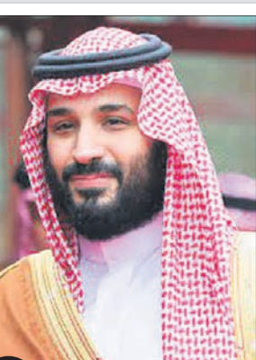
୧୯୬୭ରେ ନିର୍ଦ୍ଧାରିତ ସୀମା ଭିତରେ ପାଲେଷ୍ଟିନୀୟ

ନ ଗଲେ ସେ ପୋଲାଣ୍ଡ, ଏଷ୍ଟୋନିଆ, ଲାତ୍ଭିଆ ଓ ଲିଥୁଆନିଆ ସମେତ ନର୍ଥ ଆଟଲାଣ୍ଟିକ୍ ଟ୍ରିଟି ଅଗାଧିକାରୀମାନଙ୍କୁ (ନାଟୋ) ପାଇଁ ବିପଦ ସୃଷ୍ଟି କରିବ। ପୁଟିନ୍ କୌଣସି ନାଟୋ ସଦସ୍ୟ ରାଷ୍ଟ୍ର ୧ ଇଞ୍ଚ ଭୂମି ଛଡ଼ାଇଲେ ଆମେ ଏହି ସାମରିକ ମେଣ୍ଟର ପ୍ରତି ଇଞ୍ଚ ଭୂମିକୁ ସୁରକ୍ଷା ଦେବୁ ବୋଲି ବାଇଡେନ୍ ଦୃଢ଼ାଭିମୁଖୀ ପ୍ରକାଶ କରିଛନ୍ତି। ଆମେରିକା କାର୍ଯ୍ୟାଳୟ ନ ନେଲେ ମଧ୍ୟପ୍ରାନ୍ତ ସମେତ ଅନ୍ୟ ବିଶ୍ୱ ଭାଗଗୁଡ଼ିକରେ ସଂଘର୍ଷଜନିତ ବିପଦ ଓ ଆତଙ୍କକତା ବଢ଼ିପାରିବ ବୋଲି ବାଇଡେନ୍ କହିଛନ୍ତି। ବାଇଡେନ୍ ଅତିରିକ୍ତ ଖର୍ଚ୍ଚ ପାଇଁ ୧୦୫ ବିଲିୟନ ଡଲାର ମଞ୍ଜୁର କରିବାକୁ କଂଗ୍ରେସକୁ ଅନୁରୋଧ କରିଛନ୍ତି। ସେଥିରୁ ମୁକ୍ତେନ୍ ୬୦ ବିଲିୟନ ଡଲାର ଏବଂ ଇସ୍ରାଏଲକୁ ୧୪ ବିଲିୟନ ଡଲାର ସହାୟତା ଦିଆଯିବ ବୋଲି ସୂଚନା ଜଣାପଡ଼ିଛି।