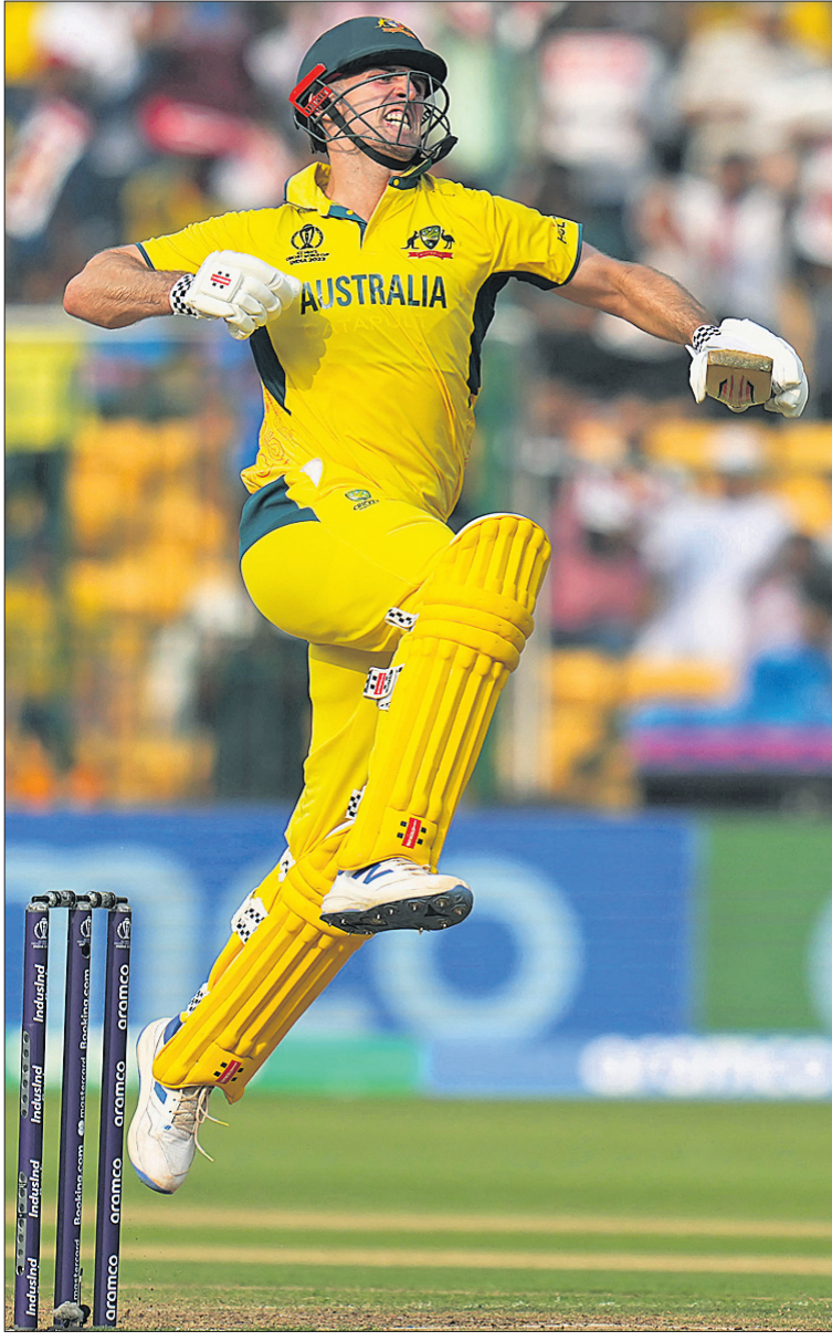
ବେଙ୍ଗାଲୁରୁରେ ଶୁକ୍ରବାର ଅନୁଷ୍ଠିତ ପାକିସ୍ତାନ ବିପକ୍ଷ ବିଶ୍ୱକପ ମ୍ୟାଚ୍‌ରେ ଶତକ ହାସଲ ପରେ ଉଲ୍ଲସିତ ଡେଭିଡ୍ ଓପିନିଂ ଓ ମିଚେଲ ମାର୍ଣ୍ଟି