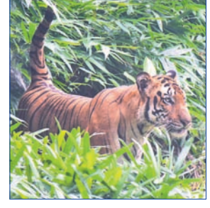
ରୁହନ୍ତି ବରଂ ବଗୁଆ ଜନ୍ମ ତିତାବାଘ ଲୋକମାନଙ୍କ ସହିତ ରହୁଛନ୍ତି। ଏକ ରିପୋର୍ଟ ଅନୁଯାୟୀ

ଯୋଧପୁର: ମଣିଷ ଏବଂ ପ୍ରାଣୀମାନଙ୍କ ମଧ୍ୟରେ ସମ୍ପର୍କ ସ୍ୱତନ୍ତ୍ର। ମଣିଷ ନିଜକୁ ଶ୍ରେଷ୍ଠ ଏବଂ ପୃଥିବୀରେ କେବଳ ସେମାନଙ୍କର ଅଧିକାର ଅଛି ବୋଲି ଭାବିଥାଏ। କିନ୍ତୁ ତାହା ଠିକ୍ ନୁହେଁ। ମଣିଷ ପରି ପ୍ରାଣୀ ମଧ୍ୟ ପ୍ରକୃତି ପାଇଁ ଗୁରୁତ୍ୱପୂର୍ଣ୍ଣ। ଏହାର ପ୍ରମାଣ ଭାରତର ଏକ ଗ୍ରାମରେ ଦେଖିବାକୁ ମିଳିଛି, ଯେଉଁଠି ମଣିଷ ଏବଂ ପଶୁମାନେ ଏକାଠି ରହନ୍ତି। ସବୁଠାରୁ ଆଶ୍ଚର୍ଯ୍ୟର କଥା ଏଠାରେ କୋଣସି ଘରୋଇ ପ୍ରାଣୀ