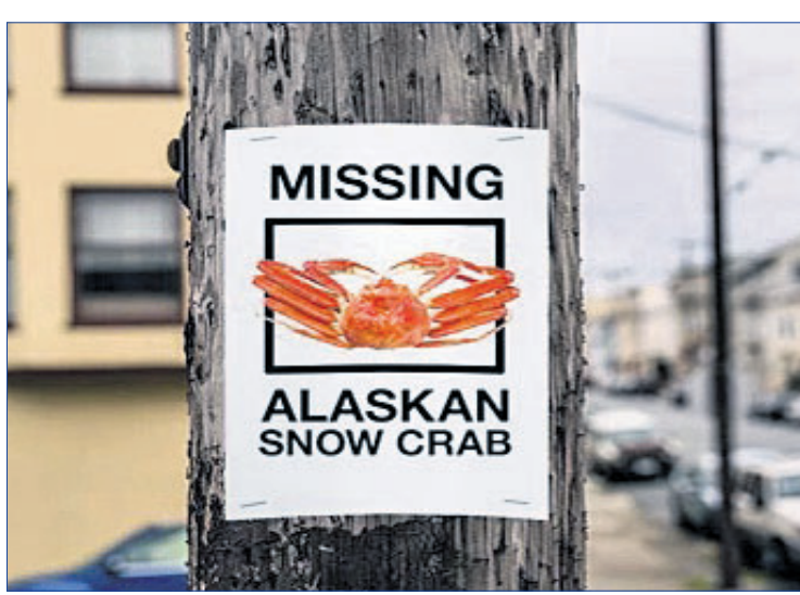
୨୦୨୦ ପରଠାରୁ ଆଲାସ୍କାର ହୋଇଯାଇଛି। ବିଜ୍ଞାନିକମାନେ ଏହାର ବେରିକ୍ ସାଗରରୁ ସ୍କୋ କ୍ରାବ୍ ଆସୁଛି କାରଣ ଜାଣିବାକୁ ଯାଇ ଜାଣିପାରିଥିଲେ

ଜଳବାୟୁ ପରିବର୍ତ୍ତନ ବିଷୟ ପାଇଁ ଏକ ବଡ଼ ସମସ୍ୟା ଭାବରେ ଉଦ୍ଧତ ହୋଇଛି। ଜନସମାଜ ପାଇଁ ଗ୍ଲୋବାଲ ୱାର୍ମିଂ ବିପଦ ସାଜିଥିବାବେଳେ ଚଳିତ ବର୍ଷ ଗ୍ଲୋବାଲ ବଏଲିଂ ମୁଣ୍ଡବିନ୍ଧାର କାରଣ ପାଲଟିଛି। ଉଦାହରଣ ସ୍ୱରୂପ ଚଳିତ ବର୍ଷର ଲୁଲାଇ ବିଷ୍ଣୁର ସବୁଠାରୁ ଉଚ୍ଚତମ ମାସ ଭାବେ ପରିଗଣିତ ହୋଇଛି। ବିଷ୍ଣୁତାପନ କେବଳ ଜନସମାଜ ଉପରେ ପ୍ରଭାବ ପକାଇଛି ତାହା ନୁହେଁ, ଜୀବଜଗତ ଓ ଉଦ୍ଭିଦଜଗତ ଠାରେ ମଧ୍ୟ ସମାନ ପ୍ରଭାବ ପକାଇଛି। ଆମେରିକାର ଆଲାସ୍କା ନିକଟ ସମୁଦ୍ରରୁ କୋଟି କୋଟି ସ୍କୋ କ୍ରାବ୍(ବରଫରେ ରହୁଥିବା ଜଳଜୀବ) ହାତକୁ ଆସୁଛି। ହୋଇଥିବାର ଉଦାହରଣ ସମଗ୍ର ପୃଥିବୀରେ ନେଇ ଚେତାଇ ଦେଇଛି।