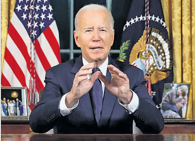
ଆକ୍ରମଣ କରିଥିବା ରୁଷିଆ ରାଷ୍ଟ୍ରପତି ଭାଉତିମିର ପୁଟିନ୍‌ଙ୍କୁ ଗାଳି ଝିର ଶାସକ ତଥା ଆତଙ୍କବାଦୀ ସଙ୍ଗଠନ ହମାସ୍ ସହ ଚୁକନା କରିଛନ୍ତି ବାଇଡେନ୍ କହିଛନ୍ତି, ହମାସ୍ ଓ ପୁଟିନ୍ ଭିନ୍ନ ଆତଙ୍କର ପ୍ରତୀକ। ତଥା ଆତଙ୍କବାଦୀ ସଙ୍ଗଠନ ହମାସ୍ ସହ ଚୁକନା କରିଛନ୍ତି ବାଇଡେନ୍ କହିଛନ୍ତି, ହମାସ୍ ଓ ପୁଟିନ୍ ଭିନ୍ନ ଆତଙ୍କର ପ୍ରତୀକ। ତଥା ଆତଙ୍କବାଦୀ ସଙ୍ଗଠନ ହମାସ୍ ସହ ଚୁକନା କରିଛନ୍ତି ବାଇଡେନ୍ କହିଛନ୍ତି, ହମାସ୍ ଓ ପୁଟିନ୍ ଭିନ୍ନ ଆତଙ୍କର ପ୍ରତୀକ।

ସମାଜତା ହେଉଛି, ଉଭୟ ହମାସ୍ ଓ ପୁଟିନ୍ ନିଜ ନିଜ ପଡ଼ୋଶୀ ରାଷ୍ଟ୍ରର ଗଣତନ୍ତ୍ରକୁ ନୁହେଁ ନଷ୍ଟ କରିବାକୁ ଚାହୁଁଛନ୍ତି। ଆମେରିକା ମୁଣ୍ଡପୁଟିକୁ କାହିଁକି ସମର୍ଥନ କରୁଛି ବୋଲି କେତେଜଣ ଦେଶବାସୀ ପ୍ରଶ୍ନ କରୁଛନ୍ତି। ଏଥିରୁ ଆମେରିକାକୁ କ'ଣ ମିଳିବ, ତାହା ସେମାନେ ଜାଣିବାକୁ ଦେଖିବା। ଏହି ସଂପର୍କଗୁଡ଼ିକ ଲାଘା ରାଜିବ। ଆତଙ୍କବାଦୀମାନେ ନିଜ ଆତଙ୍କବାଦ କାର୍ଯ୍ୟକଳାପ ପାଇଁ ଦକ୍ଷତା ନ ହେଲେ ଓ ଏକତ୍ରତାବାଦୀମାନେ ନିଜ ଅତିକ୍ରମଣ ଲାଗି ମୂଲ୍ୟ ନ ଦେଲେ ସେମାନେ ଅଧିକ ଆତଙ୍କକତା ସୃଷ୍ଟି କରି ଧ୍ୟାନ ଲାଳା ରଖିଥାନ୍ତା। ସେମାନେ ନିଜ ଅଭିଯାନ ଜାରି ରଖିଲେ ଆମେରିକା ସମେତ ବିଶ୍ୱ ପାଇଁ ବିପଦ ଦେଖାଦେଇଥାଏ। ଏକଥା ଇତିହାସ ଆମକୁ ଶିକ୍ଷା ଦେଇଛି। ପୁଟିନ୍‌ଙ୍କୁ ରୋକା