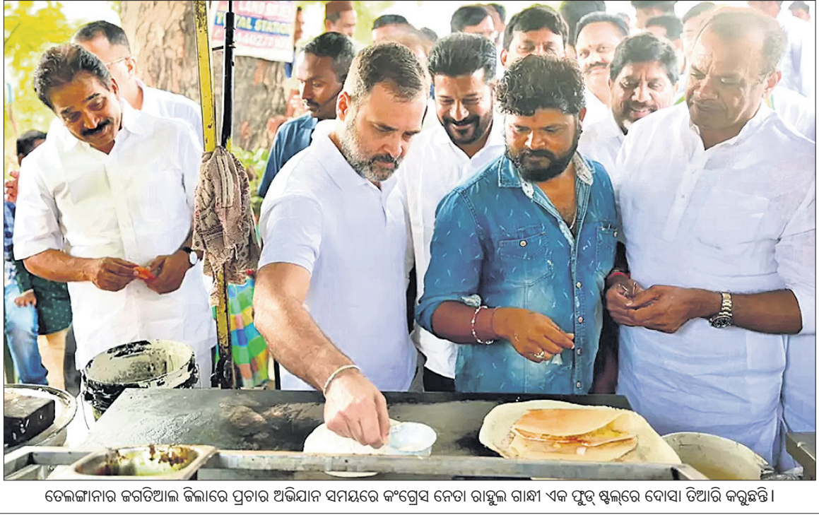
ତେଜସ୍ୱୀନୀ କମିଟିର ସଭାରେ ପ୍ରଚାର ଅଭିଯାନ ସମୟରେ କଂଗ୍ରେସ ନେତା ରାଜୁଲ ଗାନ୍ଧୀ ଏକ ଫୁଟ୍ ଷ୍ଟଲ୍ରେ ସୋପା ଡିଆର କରୁଛନ୍ତି।