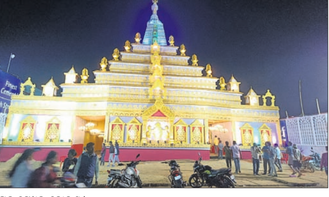
ଭ୍ରମର ଟେମ୍ପୁଲ ତୋରଣ ।