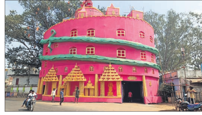
ଜୈନ ଭବନ ।

ପାପଡ଼ାହାଣ୍ଡି, ୨୦୧୩ (ସ୍ୱଚ୍ଛତା ପକ୍ଷୀ) ଭ୍ରମର ଟେମ୍ପୁଲ ତୋରଣ ଡ୍ରାଗନ୍ ଟେମ୍ପୁଲ ତୋରଣର ଭକ୍ତ ୧୦ ଫୁଟ ଥିବାରୁ କେଳି ତରୁଣୀ ହୋଇଛନ୍ତି। ନବରଙ୍ଗପୁର ଜିଲାର ପାପଡ଼ାହାଣ୍ଡି ସହର।