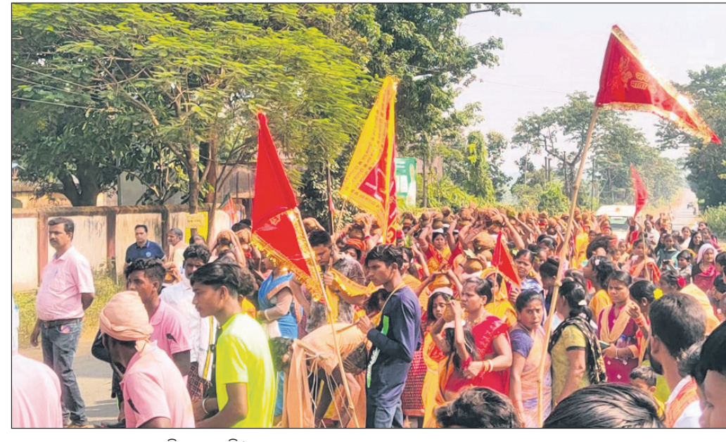
କଳସ ଶୋଭାଯାତ୍ରା ସହର ପରିକ୍ରମା କରୁଛି ।