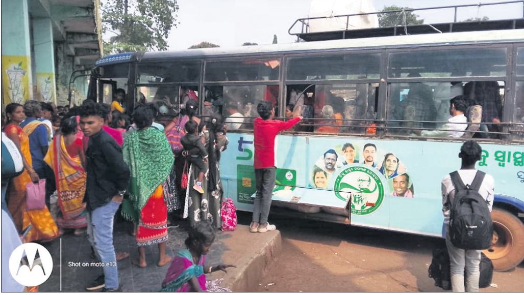
କୋରାପୁଟ ବସ୍ପକ୍ଷରେ ବିଭିନ୍ନ ସ୍ଥାନକୁ ଯିବାପାଇଁ ବସକୁ ଅପେକ୍ଷା କରିଥିବା ଯାତ୍ରୀ ।