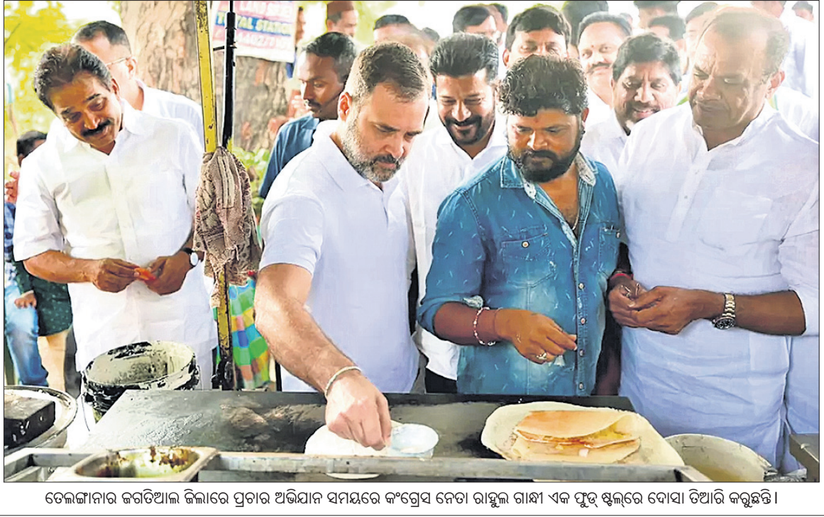
ତେଜସ୍ୱୀନାଥ କୁମାରଙ୍କ ଉପସ୍ଥିତିରେ ପ୍ରଚାର ଅଭିଯାନ ସମୟରେ କଂଗ୍ରେସ ନେତା ରାଜୁଲ ଗାନ୍ଧୀ ଏକ ଫୁଟ୍ ଷ୍ଟଲ୍ରେ ଦୋସା ତିଆରି କରୁଛନ୍ତି।