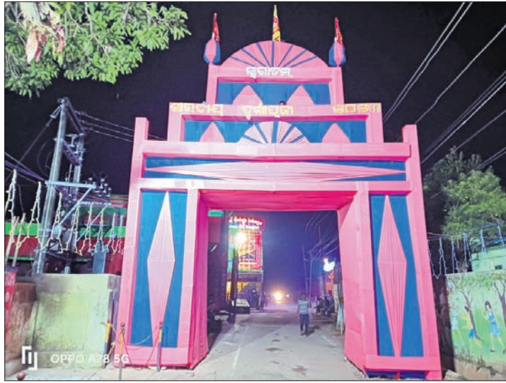
ମଣ୍ଡଳ କାରାଗାର ପକ୍ଷରୁ ମଣ୍ଡପରେ ପୂଜା ପାଉଛନ୍ତି ମା' ଦଶଗୁଜା ।