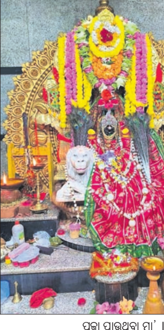
ପୂଜା ପାଉଥିବା ମା' ।

କୋରାପୁଟ ରେଳଷ୍ଟେସନରେ ରହିଥିବା ହୀରାଖଣ୍ଡ ଏକ୍ସପ୍ରେସ ।