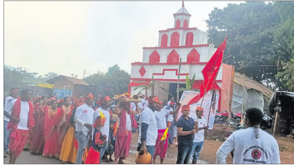
ଲକ୍ଷ୍ମୀପୁରରେ ହେଉଥିବା ପୂଜା ।