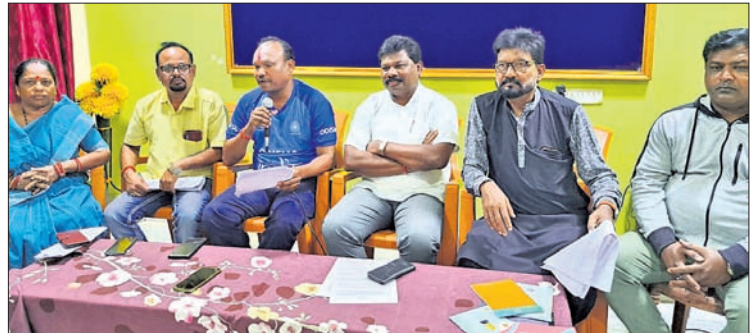
ଖବରଦାତା ସମ୍ମିଳନୀରେ ଉପସ୍ଥିତ ବିଜେଡି ନେତାମାନେ ।

ନବରଙ୍ଗପୁର, ୨୦୧୩ (ସବାଶିବ ପ୍ରହରାଳ) ଗଞ୍ଜା ଉପଯୋଗୀ ଡିପ୍ ଜନିତ୍‌କର ଭୌଗୋଳିକ ସ୍ଥିତି ପାଇଁ ପାରମ୍ପରିକ ପଦ୍ଧତିରେ ଜଳସେଚନ କରିବା ସମ୍ଭବ ନୁହେଁ। ଏହି କର୍ମକୁ ଜଳସେଚନ କରିବାକୁ ରାଜ୍ୟ ସରକାର ବୃହତ୍ ଗଞ୍ଜା ଜଳସେଚନ ଯୋଜନା କାର୍ଯ୍ୟକାରୀ କରିଛନ୍ତି।