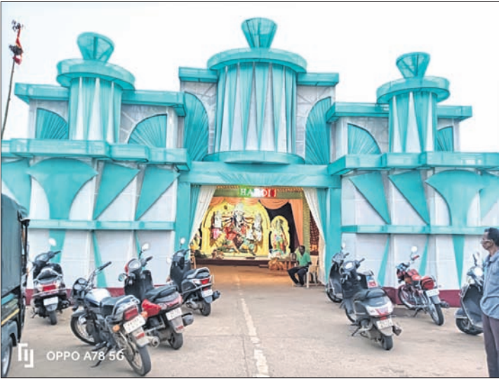
କୋରାପୁଟ ଘରୋଇ ବସ୍ ମାଲିକ ସଂଘ ପକ୍ଷରୁ ହୋଇଥିବା ଦୁର୍ଗାପୂଜା ମଣ୍ଡପ ।