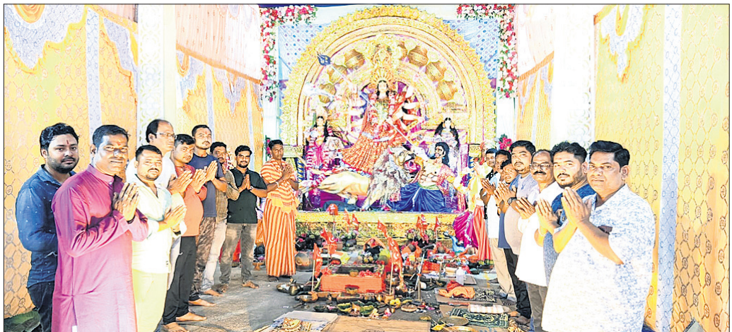
ଅନୁଗୋଳ ଜିଲା କିଶୋରନଗର ବୁକ୍ ଅଞ୍ଚଳରେ ହୋଇଥିବା ମେଡ଼ ନିକଟରେ ପୂଜା କମିଟି କର୍ମକର୍ମୀମାନେ।