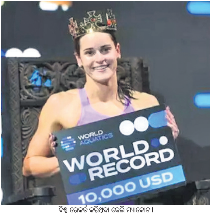
ବିଶ୍ୱ ରେକର୍ଡ କରିଥିବା କେଲି ମ୍ୟାକୋନ

ବୁଦାପେଷ୍ଟ, ୨୧।୧୦ (ଏପି) କରିଦେଇଛନ୍ତି। ଏହାଦ୍ୱାରା ୫୦,୧୦୦ ଓ ୨୦୦ ମିଟର ବ୍ୟାକ୍‌ସ୍ଟୋକ୍ ଇଭେଣ୍ଟରେ ବିଶ୍ୱ ରେକର୍ଡ ପ୍ରତିଷ୍ଠା କରିବାରେ ପ୍ରଥମ ମହିଳା ଭାବେ ବିବେଚିତ ହୋଇଛନ୍ତି। ଜୁଲାଇରେ ଅନୁଷ୍ଠିତ ବିଶ୍ୱ ଚାମ୍ପିୟନଶିପ୍‌ରେ ସେ ଏହି ୩ ଇଭେଣ୍ଟ ଜିତିଥିଲେ। ଟୋକିଓ ଅଲିମ୍ପିକ୍‌ରେ ସେ ୧୦୦ ଓ ୨୦୦ ମିଟର ଚାଇନାର ଲିଭ ଜିଆଙ୍ଗ (୨୬.୯୮) କିତିଥିଲେ। ୫୦ମିଟର ବ୍ୟାକ୍‌ସ୍ଟୋକ୍ ୨୦୧୮ରେ କରିଥିବା ରେକର୍ଡକୁ ଭଙ୍ଗ ଏକ ଅଲିମ୍ପିକ୍ ଇଭେଣ୍ଟ ସୁହେଁ।