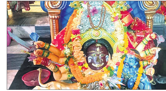
ଦେଢ଼ାମାଳ ବାଜିଚୋକସ୍ଥିତ ମା' ବ୍ରହ୍ମାୟଣୀଙ୍କ ପୀଠରେ ଅଷ୍ଟମୀ ପୂଜା କରାଯାଇଛି।

ଦେଢ଼ାମାଳ ବାଜିଚୋକସ୍ଥିତ ମା' ବ୍ରହ୍ମାୟଣୀଙ୍କ ପୀଠରେ ଅଷ୍ଟମୀ ପୂଜା କରାଯାଇଛି। ଦେଢ଼ାମାଳ ପୀଠରେ ଶନିବାର ଅଷ୍ଟମୀ ପୂଜା ଅନୁଷ୍ଠିତ ହୋଇଛି। ଭୋଗ ଧର୍ମକୁ ମା'ଙ୍କ ମହାସ୍ନାନ, ମଙ୍ଗଳ ଆଳତୀ, ଧୂପଦୀପ, ଭୋଗ ସମ୍ପନ୍ନ ସହ ଯଜ୍ଞ ପ୍ରସ୍ତୁତ ହୋଇଥିଲା। ଅପରାହ୍ନରେ ମହାସ୍ନାନ ହେବାପରେ ମା'ଙ୍କ ଦୁର୍ଗା ନାଶିନୀ ମହିଷାସୁର ବେଶ କରାଯାଇଥିଲା। ଦିନ ୨ଟାରେ ମା'ଙ୍କ ଅନୁସ୍ନାନ ଧର୍ମରେ ପଣା, ଫଳପୂଜା, ମିଷ୍ଟାନ