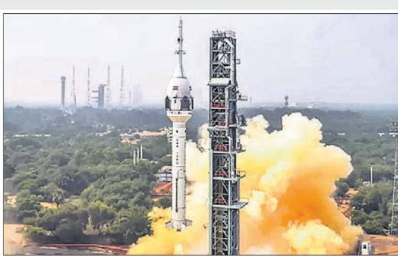
ଶ୍ରୀହରିକୋଟାସ୍ଥିତ ସତୀଶ ଧାଞ୍ଜନ ମହାକାଶ କେନ୍ଦ୍ରରୁ ଇସ୍ରୋର ଟିଭି-ଡିଏ ଉଡ଼େଇପାଣ ବେଳର ଦୃଶ୍ୟ ।

ଶ୍ରୀହରିକୋଟା, ୨୧୧୦ ମହାକାଶ ଗବେଷଣା କ୍ଷେତ୍ରରେ ଭାରତର ପ୍ରଥମ ବୃହତ୍ ପଦକ୍ଷେପ ସଫଳ ହୋଇଛି । ଭାରତୀୟ ମହାକାଶ ଗବେଷଣା ପ୍ରତିଷ୍ଠାନ (ଇସ୍ରୋ) ପକ୍ଷରୁ ଶନିବାର ପୂର୍ବାହ୍ନ ୧୦ଟାରେ ଗଗନଯାନର ପ୍ରଥମ ଚେଷ୍ଟା ପ୍ଲାନେଟ୍ ଲକ୍ଷ୍ୟ କରାଯାଇଛି । ୨୦୨୫ରେ ମହାକାଶକୁ ମାନବପୁଣ୍ଡ ଯାନ ପ୍ରେରଣ କରିବା ପାଇଁ ଏହି ଚେଷ୍ଟାର ସଫଳତା ବିଶେଷ ସହାୟକ ହେବ ବୋଲି ଆଶା