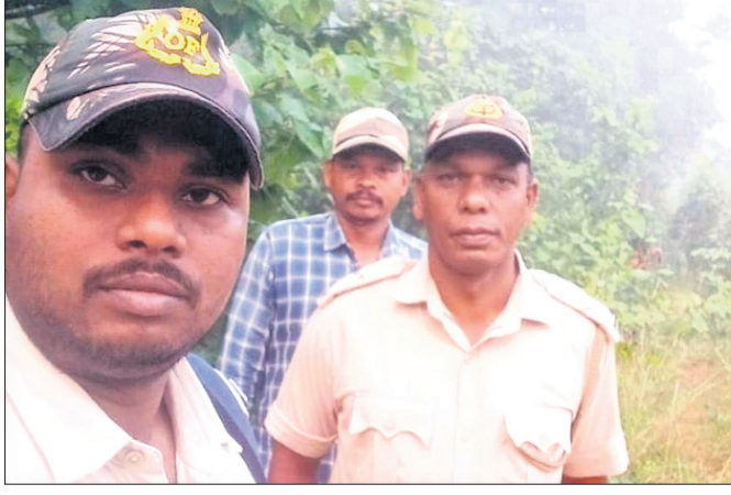
ଦେଢ଼ାମାଳ, ୨୧।୧୦ (ରଚନ ନାୟକ)

ଦେଢ଼ାମାଳ ଜିଲ୍ଲାରେ ବାଘ ଗଣନା ଚାଲିଛି। ଅକ୍ଟୋବର ୧୪ରୁ ଏହା ଆରମ୍ଭ ହୋଇଥିବା ବେଳେ ଆସନ୍ତା ୩୧ ଦିନରେ ରାଜ୍ୟ ଓ କେନ୍ଦ୍ର ସରକାର ଧ୍ୟାନ ଦେବାକୁ ପ୍ରେସ୍ ବିବୃତିରେ ଜଣାଇଛନ୍ତି।