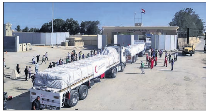
ଇଜିପ୍ଟର ରାଫାହ ଗେଟ୍ ଦେଇ ଅତ୍ୟାବଶ୍ୟକ ସାମଗ୍ରୀ ବୋହେଇ ଟ୍ରକ୍ସ ଗାଜା ଖୁପୁକୁ ଯାଉଛି।

ଗାଜା ସିଟି/କେରୁଜେଲମ, ୨୧।୧୦ ଇସ୍ରାଏଲ ଓ ହମାସ୍ ମୁକ୍ତ ଶନିବାର ୧୫ ଦିନ ପୂରିଥିବାବେଳେ ଗାଜାରେ କାର୍ଯ୍ୟାନୁଷ୍ଠାନରେ ଗାଜାକୁ ଚାର୍ଜେଟ ନାହିଁ ନ ଥିବା ଦୁର୍ଦ୍ଦଶା ଭୋଗୁଥିବା ଲୋକଙ୍କ ସହାୟତା ପାଇଁ ଅତ୍ୟାବଶ୍ୟକ ସାମଗ୍ରୀ ନେଇ ଗୋଟିଏ ପରେ ଗୋଟିଏ ଟ୍ରକ୍ ପହଞ୍ଚିବାରେ ଲାଗିଛି। ଚେବେ ଇସ୍ରାଏଲ ପକ୍ଷରୁ ଓ ମିଶାଇଲ ମାଡ୍ ଜାରି ରହିଛି। ଅକ୍ଟୋବର ୨ରେ ଗାଜାର