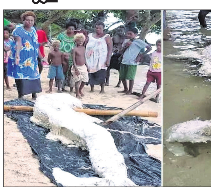
ପୃଷ୍ଠା ଉପରେ ଏକ ରହସ୍ୟମୟ ଜୀବ ଦେଖିବାକୁ ମିଳିଛି। ଏହି ଜୀବ ଦେଖିବାକୁ ଆମର କାଳ୍ପନିକ ଚରିତ୍ର ଜଳପରୀ ଭଳି। ଗତମାସରେ ଏହି ଜୀବ ପୃଷ୍ଠା ଉପରେ ସମୁଦ୍ର ତଟକୁ ଭାସି ଆସିଥିଲା।