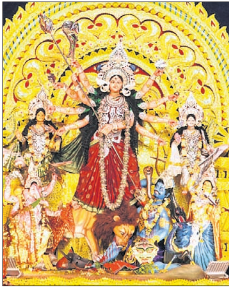
ଅନୁଗୋଳ ଦଶହରା ପଡ଼ିଆ ପୂଜା କମିଟି ମେଡ଼