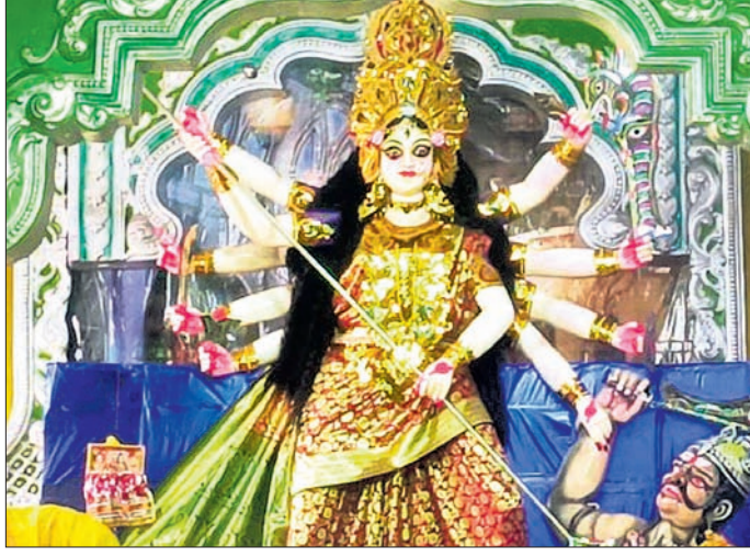
ଏମ୍‌ସିଏଲ୍ ବଳରାମ ଓସିପି ପକ୍ଷରୁ ମା' ଦୁର୍ଗାଙ୍କ ମେଡ଼।

ହୋଇଛନ୍ତି। ସେହିପରି ମଣ୍ଡପଗୃହିକ ପାଖରେ ବହୁ ଅଗ୍ରାୟା ଉଠା ବୋକାଳୀ, ବିଭିନ୍ନ ଖେଳନା, ଘରସଜା ଉପକରଣଠାରୁ ଆରମ୍ଭ କରି ପାଷ୍ଟୁଚି, ଚାଟି, ଗୁପ୍ତପୁ ଆଦି ଖାଦ୍ୟ ବିକ୍ରି ହେଉଛି। ଦର୍ଶକମାନେ ମାନାବଜାର, ଦୋଳି ଆଦିର ଭରପୁର ମଜା ଉଠାଉଥିବା ଦେଖାଯାଇଛି। ବିଜୟାଦଶମୀ ଦିନ ସାଉଥବଲ୍ଲଭାସ୍ଥିତ ରାବଣପୋଡ଼ି ଅନୁଷ୍ଠାନ ପକ୍ଷରୁ ରାବଣ ପୋଡ଼ି ଉତ୍ସବ ପାଳନ କରାଯିବାର କାର୍ଯ୍ୟକ୍ରମ ରହିଛି। ବିଭିନ୍ନ ପୂଜା କମିଟି ପକ୍ଷରୁ ବିଭିନ୍ନ ସାପ୍ତା ପାଟି, ଭଜନ ସନ୍ଧ୍ୟା, ମେଲୋଡ଼ି କାର୍ଯ୍ୟକ୍ରମ ଆୟୋଜନ କରାଯାଇଛି।