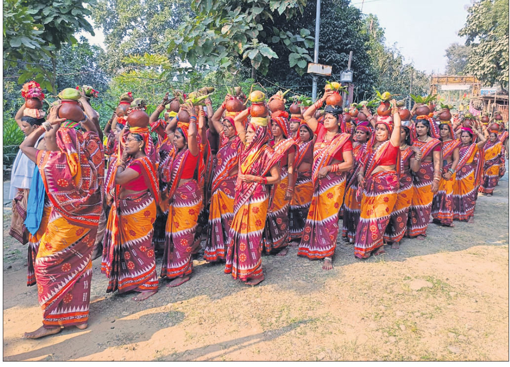
ତାରିଣୀ ମନ୍ଦିରର ବାର୍ଷିକ ଉତ୍ସବ ପାଳନ ଅବସରରେ ଶତାଧିକ ମହିଳା କଳସଯାତ୍ରାରେ ସାମିଲ ହୋଇଛନ୍ତି।