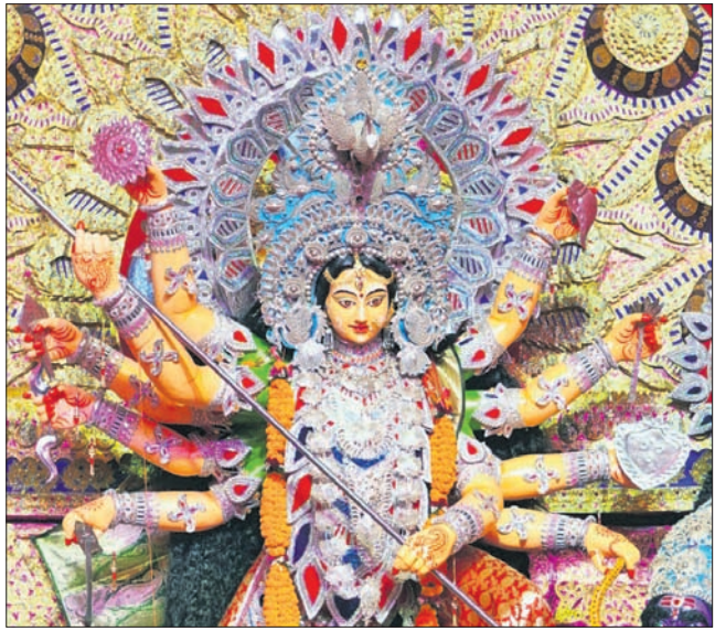
ଅନୁଗୋଳ ହୁଲୁରିସିଂହା ଦୁର୍ଗାପୂଜା କମିଟିର ମେଡ଼।