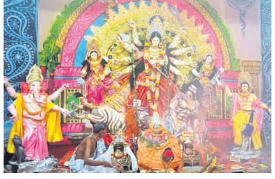
ବାସୁଦେବପୁର ଧାନାହାଟ ଦୁର୍ଗାପୂଜା ମଣ୍ଡପ।