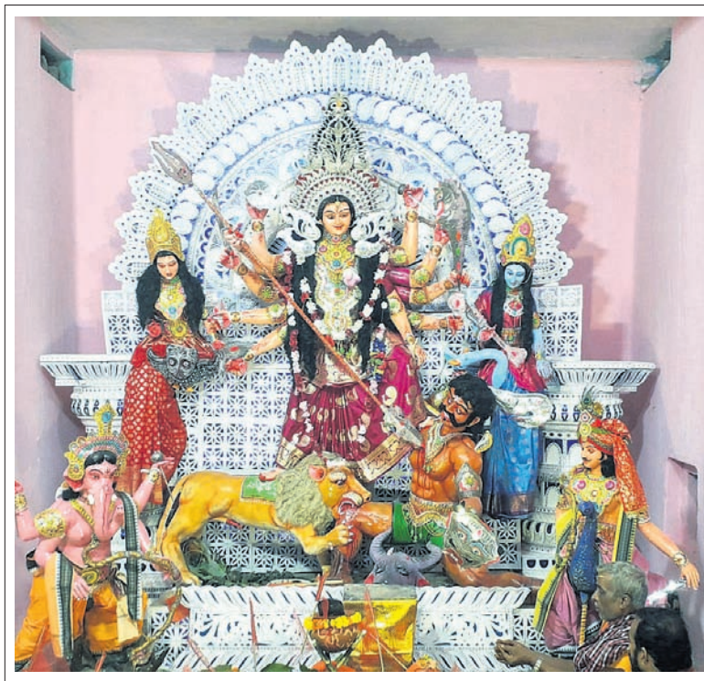
ଢେଙ୍କାନାଳ ଜିଲା କାମାକ୍ଷାନଗରସ୍ଥିତ ଜଗନ୍ନାଥ ବଜାରରେ ହୋଇଥିବା ମା' ଦୁର୍ଗାଙ୍କ ମେଡ଼।