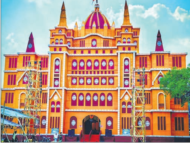
ଏମ୍‌ସିଏଲ୍ ଜଗନ୍ନାଥ ଓସିପି ପକ୍ଷରୁ ହୋଇଥିବା ଆକର୍ଷଣୀୟ ତୋରଣ।