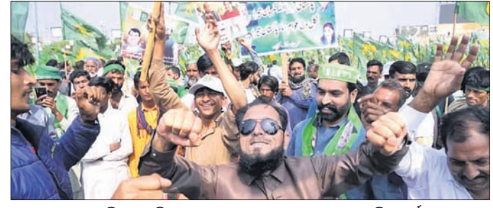
ନୂଆ ଶରିୟତ୍ ଫେରିବା ପରେ ଲାହୋରରେ ଉତ୍ସବ ମନାଉଛନ୍ତି ସମର୍ଥକ।