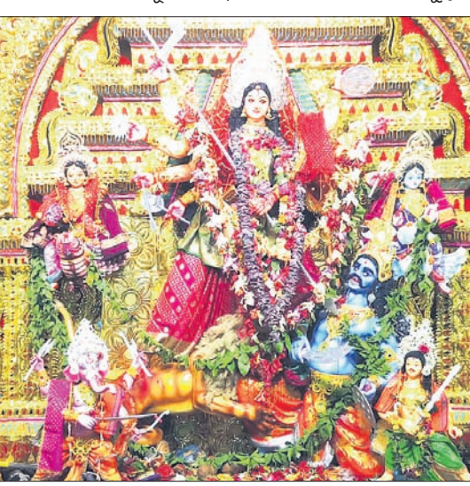
ଢେଙ୍କାନାଳ ସହର ରାଧାକୃଷ୍ଣ ବଜାର।

ଢେଙ୍କାନାଳ ସହରରେ ମା' ଦୁର୍ଗାଙ୍କ ପୂଜା ଶନିବାରଠାରୁ ଆରମ୍ଭ ହୋଇଛି। ସବୁ ମଣ୍ଡପରେ ମା'ଙ୍କ ମହାସପ୍ତମୀ ପୂଜା ହୋଇଥିବା ବେଳେ ରବିବାର ଅଷ୍ଟମୀ ପୂଜା ପାଇଁ ପ୍ରସ୍ତୁତି କରାଯାଇଛି। ରାଧାକୃଷ୍ଣ ବଜାରରେ ମା'ଙ୍କ ନବରାତ୍ର ପୂଜା ଆନନ୍ଦ ଭଙ୍ଗାସର ସହ ଅନୁଷ୍ଠିତ ହେଉଛି। ସେହିପରି ଶ୍ରୀଶ୍ରୀ ମା' ଦୁର୍ଗାପୂଜା କମିଟି ହନୁମାନ ସାହି ମହାବୀର ବଜାରରେ ମଧ୍ୟ ମା'ଙ୍କ ପୂଜା ଉତ୍ସବ ଚଳିତବର୍ଷ ୧୯ ବର୍ଷରେ ପହଞ୍ଚିଛି। କୁଞ୍ଜକାନ୍ତ