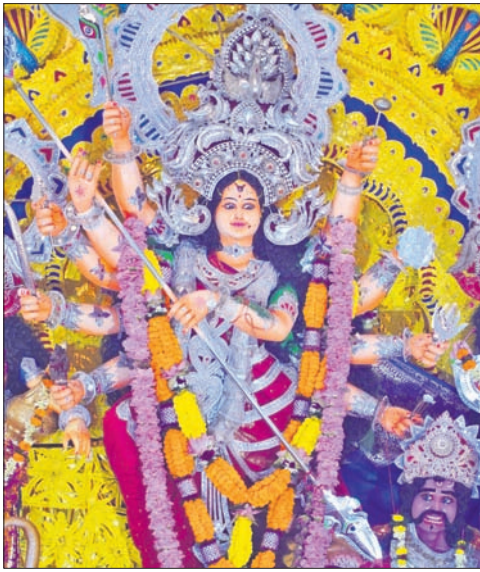
ହେମପୁରପଡ଼ା ପୂଜା ସମିତି ପକ୍ଷରୁ ହୋଇଥିବା ମେଡ଼।