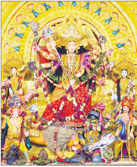
ଅନୁଗୋଳ ଅମଳାପଡ଼ା ଦୁର୍ଗାପୂଜା କମିଟି ମେଡ଼।

ଅନୁଗୋଳ ସହରରେ ଆରମ୍ଭ ହୋଇଛି ମା' ଦୁର୍ଗାଙ୍କ ପୂଜା। ସହରର ହୁଲୁରିସିଂହା, ଦଶହରା ପଡ଼ିଆ, ହେମପୁରପଡ଼ା, ଅମଳାପଡ଼ା, ଶିମିଳିପଡ଼ା, ରାଣାଗୋଡ଼ା, ଗାନ୍ଧୀଛକ, ବସଷ୍ଟାଣ୍ଡ ଆଦି ସ୍ଥାନରେ ଆଡ଼ମ୍ବରରେ ମା'ଙ୍କ ଆବାହନ କରାଯାଇଛି। ଶୁକ୍ରବାର ବିଲ୍ୱବରଣ କରାଯାଇଥିବା ବେଳେ ଶନିବାରଠାରୁ ମା'ଙ୍କ ପୂଜା ଆରମ୍ଭ ହୋଇଛି। ରବିବାର ମଣ୍ଡପଗୃହିକରେ ମହାଷ୍ଟମୀ ପୂଜା କରାଯିବାକୁ ସ୍ୱତନ୍ତ୍ର ପ୍ରସ୍ତୁତି ଶେଷ ହୋଇଛି।