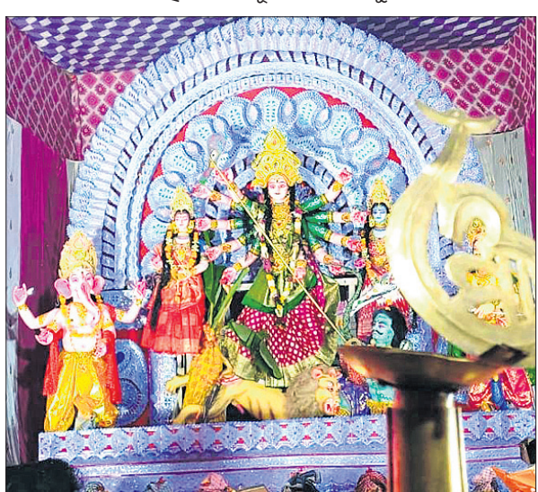
ଢେଙ୍କାନାଳ ମହାବୀର ବଜାର ହନୁମାନ ସାହି ମେଡ଼।