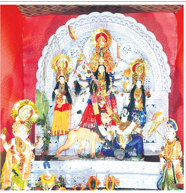
କାମାକ୍ଷାନଗର ରେକୁଳାରେ ହୋଇଥିବା ମେଡ଼।