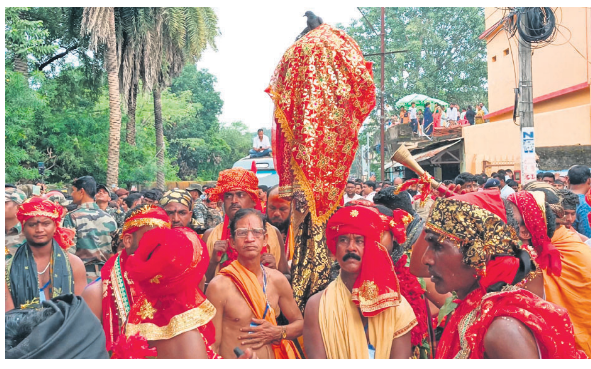
ମାଣିକେଶ୍ୱରୀଙ୍କ ଛତରକୁ ଶୋଭାଯାତ୍ରାରେ ନିଆଯାଇଛି । (ଫାଇଲ ଫଟୋ)