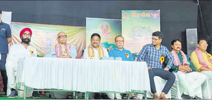
ନୂଆଁଖାଇ ଭେଟିଘାଟରେ ମଞ୍ଚାସୀନ ଅତିଥି।