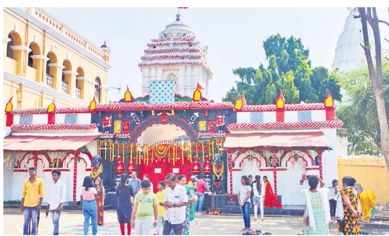
ଭବାନୀପାଟଣାରେ ମା' ମାଣିକେଶ୍ୱରୀଙ୍କ ଛତରଯାତ୍ରା ପାଇଁ ଶନିବାର ମାଣିକେଶ୍ୱରୀ ମନ୍ଦିରରେ ମା'ଙ୍କ ଦର୍ଶନ ପାଇଁ ଭକ୍ତମାନେ ଅପେକ୍ଷା କରିଛନ୍ତି ।

ଭବାନୀପାଟଣା, ୨୧।୧୦ (ଉତ୍ତମ କୁମାର ଦାଶ) ମା' ମାଣିକେଶ୍ୱରୀଙ୍କ ଛତର ଯାତ୍ରା ଉପଲକ୍ଷେ ଭବାନୀପାଟଣା ସହରରେ ରବିବାର ଲକ୍ଷାଧିକ ଭକ୍ତଙ୍କ ସମାଗମ ହେବ ବୋଲି ଆଶା କରାଯାଉଛି । ଶାନ୍ତିଶୁଖିଲା ରକ୍ଷା ପାଇଁ ପୋଲିସ ପ୍ରଶାସନ ପକ୍ଷରୁ ବ୍ୟାପକ ପ୍ରସ୍ତୁତି କରାଯାଇଛି । କଳାହାଣ୍ଡି ଏସ୍ପି ଅଭିଳାଷ ଜିଙ୍କ ଅଧିକାରରେ ଜିଲ୍ଲା ପୋଲିସ ପ୍ରଶାସନ ପକ୍ଷରୁ ଏକ ପ୍ରସ୍ତୁତି ବୈଠକ ଅନୁଷ୍ଠିତ ହୋଇଯାଇଛି । ଚଳିତବର୍ଷ ଯେମିତି ଶାନ୍ତିଶୁଖିଲା ସହ ମା'ଙ୍କ ଛତର ଯାତ୍ରା ଅନୁଷ୍ଠିତ ହେବ ଓ ଭକ୍ତମାନେ କିପରି ମା'ଙ୍କ ଛତର ପୁରୁଷିତ ଭାବେ ଦର୍ଶନ କରିବେ ସହ ନେଇ ଜିଲ୍ଲା ପୋଲିସ ପକ୍ଷରୁ ବ୍ୟାପକ ପଦକ୍ଷେପ ଗ୍ରହଣ କରାଯାଇଛି । ମା'ଙ୍କ ଛତର ଯାତ୍ରାରେ ଏଥର ୧୨୩୦୦ରୁ ପୋଲିସ ପୁରୁଷିତ ହେବା ସହ ୨୫୫ ଅତିରିକ୍ତ ଏସ୍ପି, ୯ ଡିଏସ୍ପି, ୧୯ ଲକ୍ଷ୍ମପକ୍ଷର, ୩୧ ସବ୍‌ଇନ୍ସପେକ୍ଟର, ଏଏସ୍‌ଆଇ ୫୪ ଜଣ ଉପସ୍ଥିତ ରହି ଶାନ୍ତିଶୁଖିଲା ନିୟନ୍ତ୍ରଣ କରିବେ ବୋଲି ଜଣାପଡ଼ିଛି । ସେହିପରି ଭବାନୀପାଟଣା ସହରର ଚାରିଆଡ଼େ ଅର୍ଥାତ୍ କୁନାଗଡ଼, ଥୁଆମୁଳ ରାମପୁର, କେସିଜା ଓ ନଳା ଆଦି ମୁଖ୍ୟ ରାସ୍ତାରେ ବ୍ୟାରିକେଡ୍ ପାଇଁ ବ୍ୟବସ୍ଥା କରାଯାଇଛି । ଛତର ଯାତ୍ରା ପାଇଁ ସହରର ଗତି ସ୍ଥାନରେ ପୋଲିସ କଣ୍ଟ୍ରୋଲ୍ କରାଯାଇଥିବାବେଳେ ସିସିଟିଭି ବ୍ୟବସ୍ଥା ମଧ୍ୟ କରାଯାଇଛି । ମା'ଙ୍କ ଛତର ଯାତ୍ରା ଆରମ୍ଭରୁ ଶେଷ ଯାଏ ଭକ୍ତଙ୍କ ଗତିବିଧି ଉପରେ ନଜର ରଖିବ ସିସିଟିଭି ବୋଲି ଜିଲ୍ଲା ପୋଲିସ ପକ୍ଷରୁ ସୂଚନା ମିଳିଛି ।