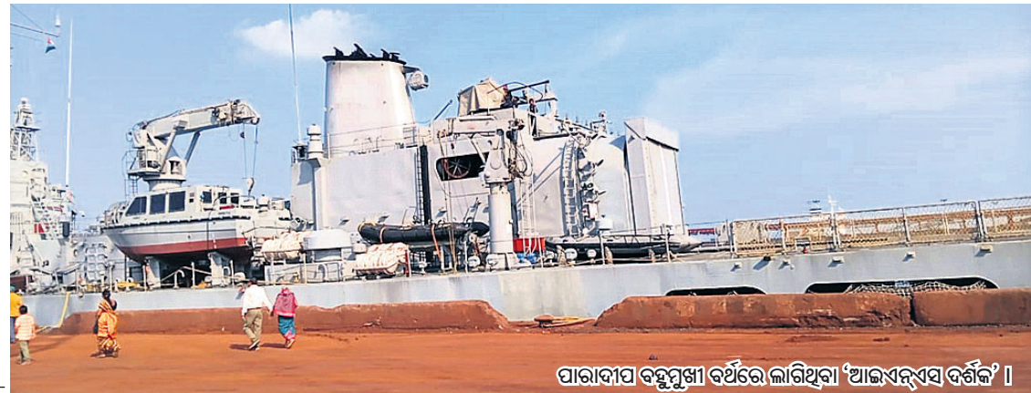
ପାରାଦୀପ ବନ୍ତୁପୁଞ୍ଜା ବର୍ଥରେ ଲାଗିଥିବା ‘ଆଇଏନ୍ଏସ୍ ଦର୍ଶକ’ ।

ପାରାଦୀପ, ୨୧୧୦ (ଶରତ ରାଉତ) ଓଡ଼ିଶା ଉପକୂଳ ସମୁଦ୍ରରେ ପାଗୋଲି କରୁଥିବା ଭାରତୀୟ ନୌସେନା ଜାହାଜ ‘ଆଇଏନ୍ଏସ୍ ଦର୍ଶକ’ ଜରୁରିକାଳୀନ ଭାବେ ପାରାଦୀପ ବନ୍ତୁପୁଞ୍ଜା ବର୍ଥରେ ଲାଗିଛି। ସେଥିରେ ଥିବା ଜଣେ ଯବାନଙ୍କ ଦେହ ଅସ୍ତୁ