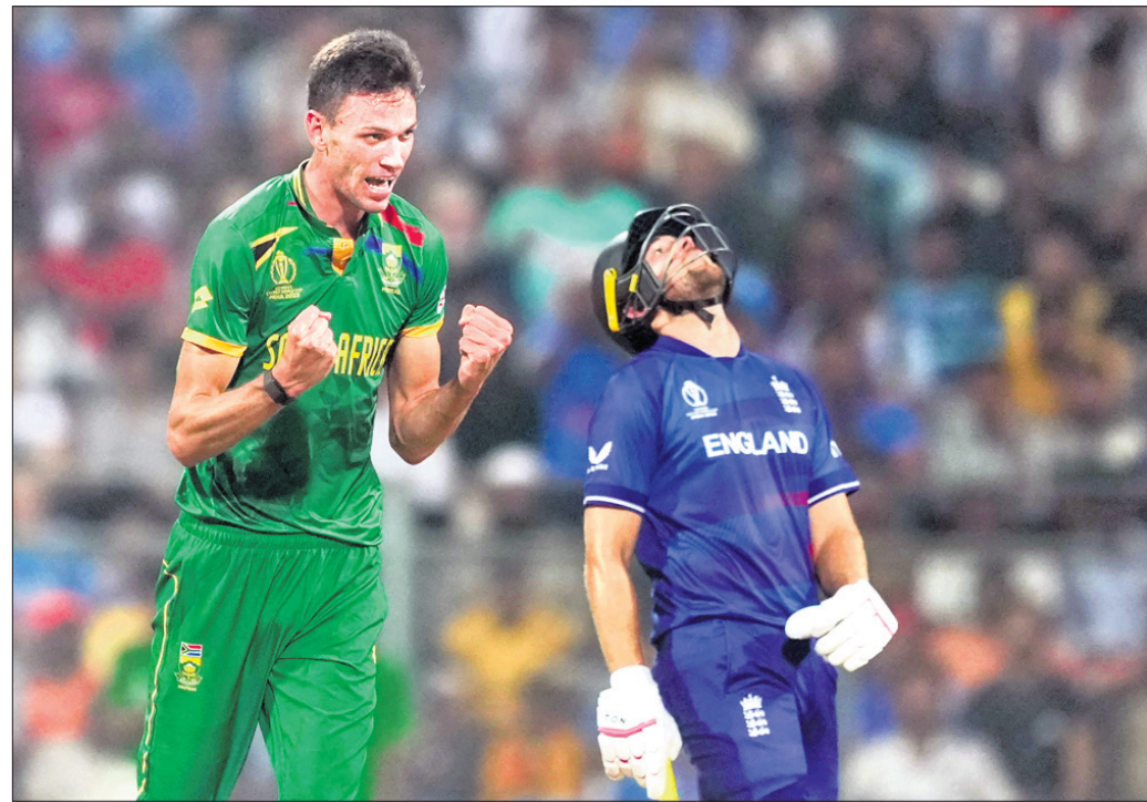
କୋ ରୁଟ୍‌କୁ ଆଉଁସ କରିବା ପରେ ମାର୍କୋ ଯାନ୍‌ସେନ୍

ମୁମ୍ବାଇ, ୨୧।୧୦ (ପି.ଟି.) ମୁମ୍ବାଇର ଓଫ୍‌ସେଟେ ଷ୍ଟାଡ଼ିୟମରେ ଇଂଲଣ୍ଡକୁ ୨୩୦ ରନ୍‌ରେ ହରାଇବା ସହ ବିଜୟ ଧାରାକୁ ଫେରିଛି ଦକ୍ଷିଣ ଆଫ୍ରିକା। ନେତୃତ୍ୱାଳୟ ନିକଟରୁ ଅପ୍ରତ୍ୟାଶିତ ଭାବରେ ପରାଜିତ ହେବା ପରେ ଏତେନ୍ ମାର୍କୋଙ୍କ ଦଳ ଜବରଦସ୍ତ ପ୍ରତ୍ୟାବର୍ତ୍ତନ କରିବା ସହିତ ଶନିବାର ବିଜୟ ହାସଲ