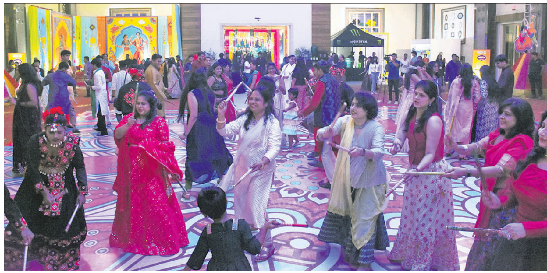
ଚନ୍ଦ୍ରଶେଖରପୁରସ୍ଥିତ ହୋଟେଲ କ୍ରିଷ୍ଣାଳ କ୍ରୀଡ଼ାଘାଟରେ ଚାଲିଥିବା ଦାଣ୍ଡିଆ କାର୍ନିଭାଲରେ ସହରବାସୀ ଉତ୍ସବର ମଜା ନେଉଛନ୍ତି ।