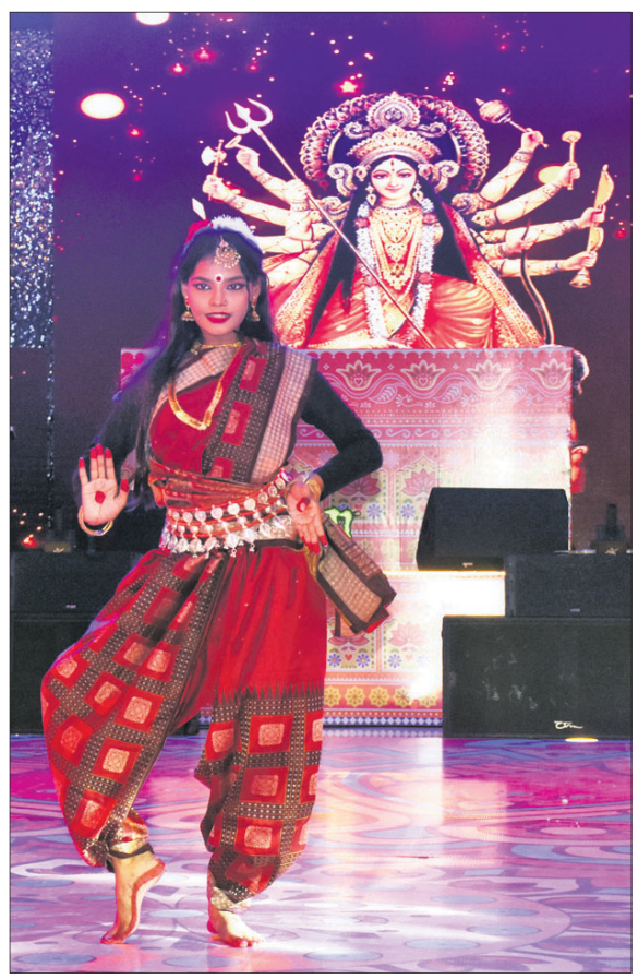
ନୃତ୍ୟଶିଳ୍ପୀ ପ୍ରକୃତି ମା' ଦୁର୍ଗାଙ୍କ ଅବତାରରେ ନୃତ୍ୟ ପରିବେଷଣ କରୁଛନ୍ତି ।