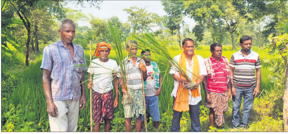
ଚକଡ଼ା ରୋଗ ଲାଗିଥିବା ଚାଷୀମାନେ ଦେଖାଉଛନ୍ତି।

ଅନାବୃଷ୍ଟି କାରଣରୁ କଳାହାଣ୍ଡି ଜିଲ୍ଲା କୋକସରା ବ୍ଲକର ଅନେକ ପଞ୍ଚାୟତରେ ସମାବ୍ୟ ମରୁତି ପରିସ୍ଥିତି ଉପସ୍ଥିତ। ଚାଷଜମିରେ ଚାଷ କରାଯାଇ ନଥିବାରୁ ଚାଷ ନଷ୍ଟ କରିଦେଇଛି ଚକଡ଼ା କୀଟ। ଏହାର ପ୍ରକାଶନା ପାଇଁ ଯେତେ କାଟନାଶକ ସିଧନ କଲେ ମଧ୍ୟ ଆୟତ୍ତରେ ଆସୁ ନ ଥିବା ଅଭିଯୋଗ କରିଛନ୍ତି ଚାଷୀ। କୋକସରା ବ୍ଲକର ରେଙ୍ଗାକପାଳି ପଞ୍ଚାୟତରେ ବ୍ୟାପକ ଭାବେ ଚକଡ଼ାର ପ୍ରାଚୁର୍ଯ୍ୟ ଦେଖିବାକୁ ମିଳିଥିବାରୁ କୋକସରା, କାଉଡୋଳା, ମାଝାଗୁଡ଼ା, କାଶିବାହାଲ, କଦାବୁରୁରା, ମୋଟେର, ଲହୁରୀ, ଗୟାଗୁଡ଼ା, ତୁହରୀ, ତାଲଗୁମା, ମୁଷାପାଳି ପଞ୍ଚାୟତରେ ମଧ୍ୟ ଚକଡ଼ା ରୋଗପୋକ ବଂଶ ବିସ୍ତାର କରିବାରେ ଲାଗିଛି। ପ୍ରତି ପଞ୍ଚାୟତରେ ନୂଆ ନିୟୋଜିତ କୃଷି କର୍ମଚାରୀଙ୍କୁ ଅଭିଯୋଗ କଲେ ମଧ୍ୟ କୌଣସି ସୁଫଳ ମିଳୁ ନ ଥିବା ଅଭିଯୋଗ କରିଛନ୍ତି ଚାଷୀ। ଏପଟେ ବିଭିନ୍ନ ବ୍ୟାଙ୍କ, ପାଇନାସ୍ ମହାଜନ