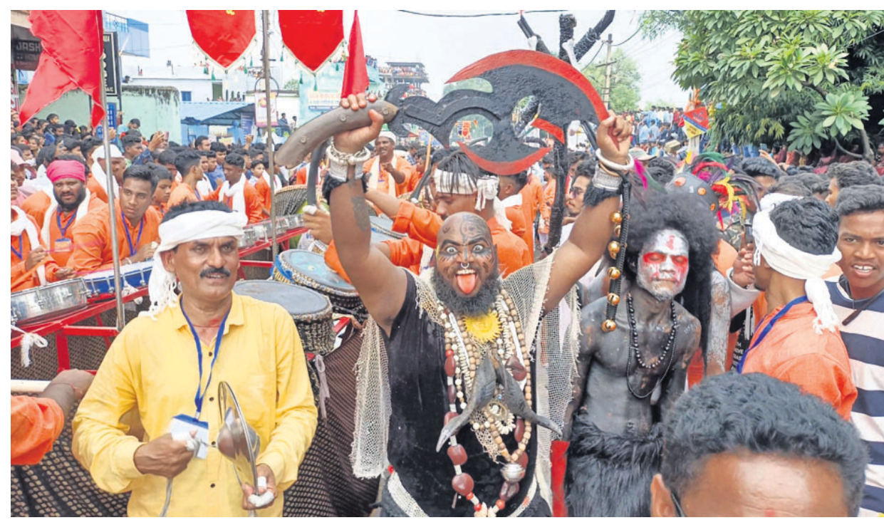
ମାଣିକେଶ୍ୱରୀଙ୍କ ଛତରଯାତ୍ରାରେ ବିଭିନ୍ନ ଭେଷଜୁଷାରେ ସଜିତ ହୋଇ ଶୋଭାଯାତ୍ରାରେ ସାମିଲ ହୋଇଛନ୍ତି ଶ୍ରଦ୍ଧାଳୁ । (ଫାଇଲ ଫଟୋ)