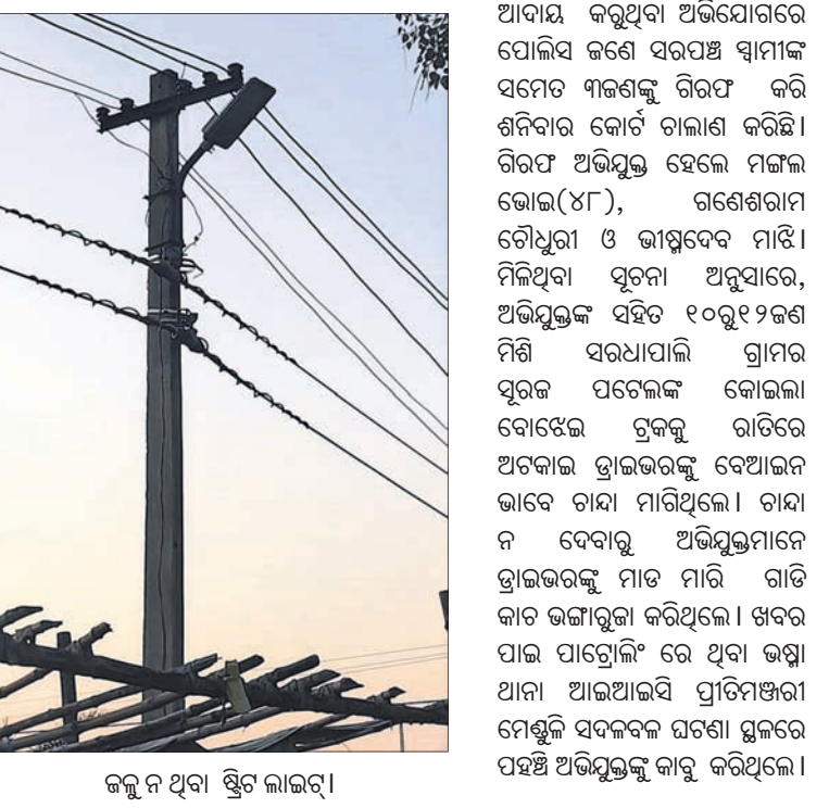
ଜଳୁ ନ ଥିବା ସ୍ତ୍ରୀ ଲାଇଟ୍।