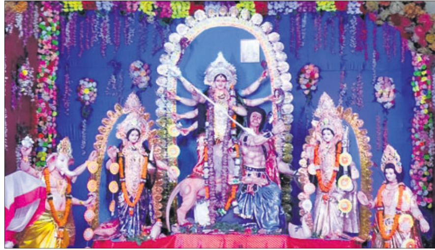
ରାଜଗାଙ୍ଗପୁର କମ୍ପ୍ୟୁନିଟ ସେଣ୍ଟର।