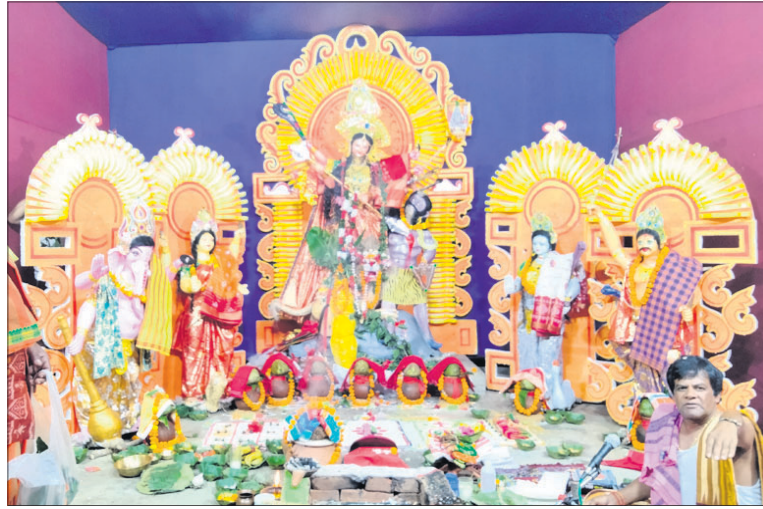
ସୁନ୍ଦରଗଡ଼ ଇବ୍ ନଗର ।