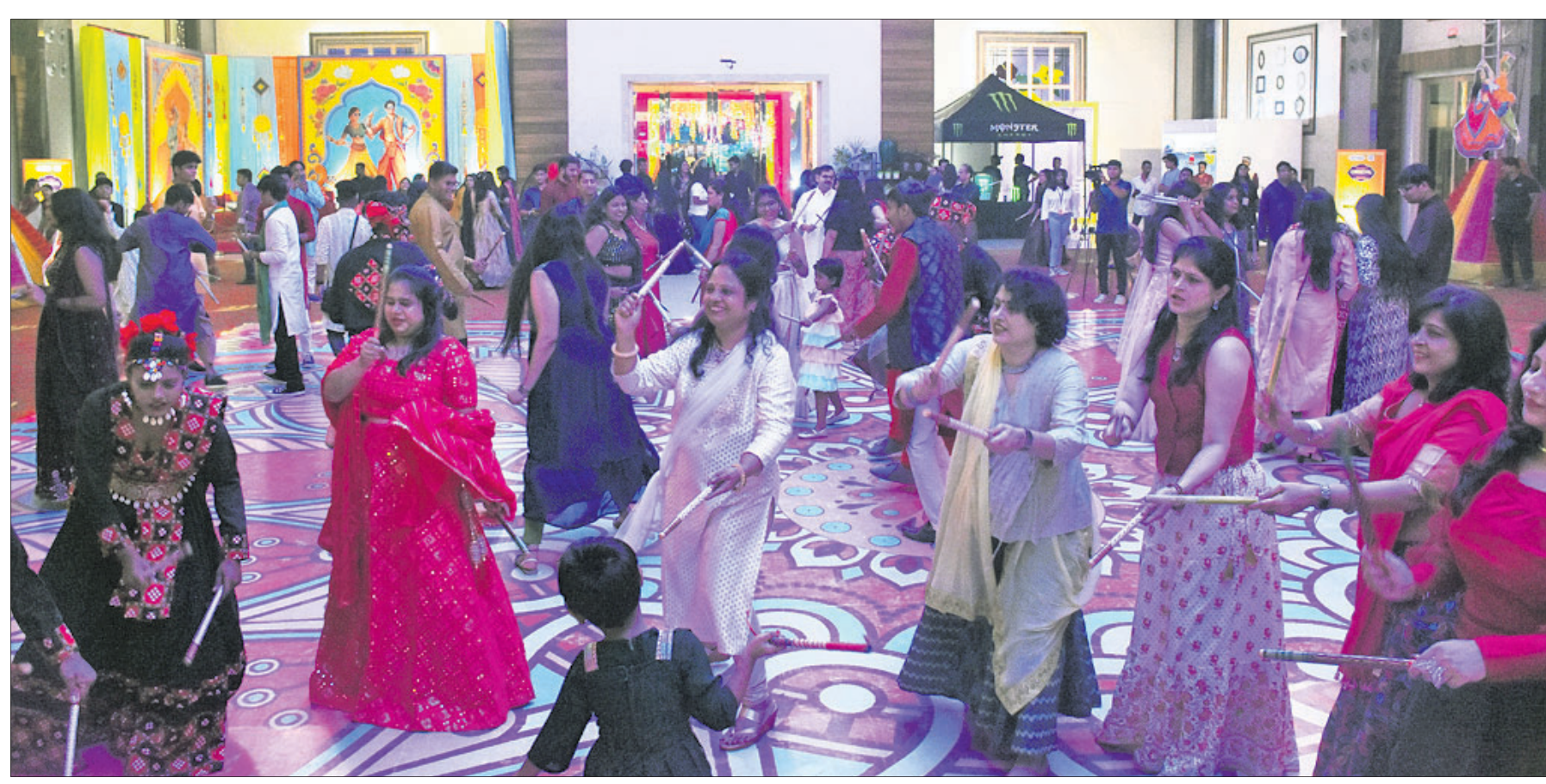
ଚନ୍ଦ୍ରଶେଖରପୁରସ୍ଥିତ ହୋଟେଲ କ୍ରିଷ୍ଣାଲ କ୍ରାଉନ୍‌ଠାରେ ଚାଲିଥିବା ଦାଣ୍ଡିଆ କାର୍ନିଭାଲରେ ସହରବାସୀ ଉତ୍ସବର ମଜା ନେଉଛନ୍ତି ।