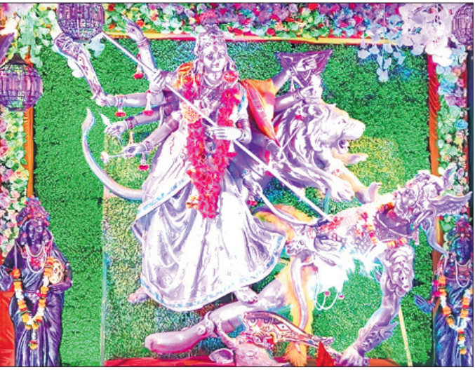
ବ୍ରହ୍ମପୁର: ଓଏସଆରଟିଭି ପୂଜା କମିଟି ପକ୍ଷରୁ ତୁର୍ତ୍ତା ପୂଜା।