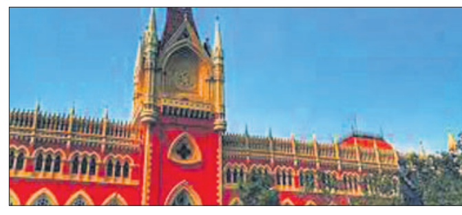
ଅବସରରେ କଷ୍ଟିତ୍ୱ ଚିରଋଜନ ଦାଶ ଏବଂ ପାଠ୍ୟପାଠ୍ୟା ସେନାଙ୍କ ଖଣ୍ଡପୀଠ ଏହା କହିଛନ୍ତି। ଖଣ୍ଡପୀଠ କିଶୋରୀ କିଶୋରୀଙ୍କ କର୍ତ୍ତବ୍ୟ ଏକ ଚାଲିକା ଦେଇଛନ୍ତି। ଜଣେ କିଶୋରୀ ମାତ୍ର ୨ ମିନିଟ୍‌ର ଯୌନ ସହୃଦ୍ଧି ଉପଭୋଗ କରିବାକୁ ଯାଇ ସମାଜ ଆଖିରେ ଯିବାରୁ ହୋଇଥାଏ। ସେଥିପାଇଁ ଯୌନ ଇଚ୍ଛାକୁ

କିଶୋରୀମାନେ ଦୁଇ ମିନିଟ୍‌ର ଖୁସି ପଛରେ ନ ଥାଇ ସେମାନଙ୍କ ଯୌନ କାମନାକୁ ନିୟନ୍ତ୍ରଣ କରିବା କରୁଣା ବୋଲି କାଲକାଟା ହାଇକୋର୍ଟି ଏକ ବକାଳ୍ହାର ମାମଲାରେ ଶୁଣାଣି ଦେଇ କହିଛନ୍ତି। ସେହିପରି କିଶୋରୀମାନେ ମଧ୍ୟ ମୁଦତା ଓ ମହିଳାମାନଙ୍କୁ ତଥା ସେମାନଙ୍କ ମର୍ଯ୍ୟାଦାକୁ ସମ୍ମାନ ଦେବା ଶିଖିବାକୁ ବୋଲି ହାଇକୋର୍ଟି ଟିପ୍ପଣୀ ଦେଇଛନ୍ତି। ଜଣେ ନାବାଳିକା ସହ ପ୍ରେମ ସମ୍ପର୍କରେ ଥାଇ ତାଙ୍କୁ ବକାଳ୍ହାର କରିବା ଅଭିଯୋଗରେ ତଳକୋର୍ଟ ଦ୍ୱାରା ଦୋଷୀସାବ୍ୟସ୍ତ ଜଣେ କିଶୋରୀଙ୍କୁ ଦୋଷମୁକ୍ତ କରିବା