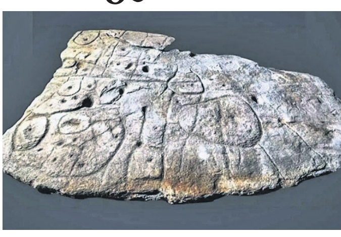
ବୈଜ୍ଞାନିକମାନେ ପ୍ରାୟ ୨୦୦୧ରେ ହାସଲ କରିଥିବା ପଥର ଉପରେ ଖୋଦିକାକୁ ଖଜାଣା ନକ୍ସା ଭାବେ ବ୍ୟବହାର କରୁଛନ୍ତି। ଡେକ୍ଟର୍‌ଙ୍କ ଦ୍ୱିତୀୟ ମୁନିଉର୍‌ସିଟିର ପ୍ରଫେସର ଯଦନ ପିଲାର

ନିକଟରେ ବୈଜ୍ଞାନିକମାନେ ୪ହଜାର ବର୍ଷ ପୁରୁଣା ଏକ ରହସ୍ୟମୟ ପଥର ବାବଦରେ କିଛି ତଥ୍ୟ ହାସଲ କରିଛନ୍ତି। ସେମାନଙ୍କ କହିବା କଥା କି, ପଥର ଉପରେ ହୋଇଥିବା କଳାକୃତି ପ୍ରକୃତରେ ଏକ ପ୍ରକାରର ଗୁପ୍ତ ଚେଜର। ନକ୍ସା ଅଟେ। କା'ସ୍ୟ ମୂରର ଏହି ପଥର ସେକ୍ସ ବେଲାକ୍ ମ୍ୟାଡ଼ ନାମରେ ପରିଚିତ, ଯାହାକୁ ବୈଜ୍ଞାନିକମାନେ ୨୦୦୧ରେ ଯୁରୋପର ସବୁଠୁ ପୁରୁଣା ନକ୍ସା ବୋଲି କହିଥିଲେ। ସେବେଠାରୁ ବୈଜ୍ଞାନିକମାନେ ଏହି ନକ୍ସା ବାବଦରେ ଜାଣିବାକୁ ପ୍ରୟାସ କରୁଥିଲେ। ରିପୋର୍ଟ ମୁତାବକ, ବର୍ତ୍ତମାନ