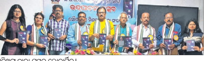
ଅତିଥିଙ୍କ ଦ୍ୱାରା ପୁସ୍ତକ ଲୋକାର୍ପଣ।