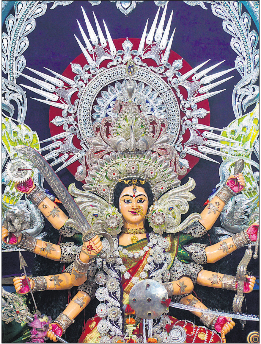
କଟକ ମାଷ୍ଟୁଆ ବଜାର ପୂଜା ମଣ୍ଡପରେ ଶନିବାର ମହାସପ୍ତମୀ ଅବସରରେ ମା' ଦୁର୍ଗା ।

■ ୨୩ରୁ ୨୬ ଉପକୂଳରେ ବର୍ଷା ସମାବନା ■ ମହାକାଳୀଙ୍କୁ ସମୁଦ୍ର ମନା ଭୁବନେଶ୍ୱର, ୨୧.୧୦ (ଅନିଲ ଦାସ) ଦକ୍ଷିଣ ପୂର୍ବ ବଙ୍ଗୋପସାଗରରେ ସୂକ୍ଷ୍ମ ଲଘୁଚାପ ପୂର୍ବ-କେନ୍ଦ୍ରୀୟ ବଙ୍ଗୋପସାଗର ଅଞ୍ଚଳରେ ସୂକ୍ଷ୍ମ ରହିଛି । ଏହା ଧୀରେ ଧୀରେ ଉତ୍ତର-ପଶ୍ଚିମ ଦିଗରେ ଗତି କରୁଛି । ରବିବାର ଏହା ଉତ୍ତର-ପଶ୍ଚିମରୁ ପଶ୍ଚିମ କେନ୍ଦ୍ରୀୟ ବଙ୍ଗୋପସାଗରକୁ ଗତି କରି ଅଧିକ ଘନୀଭୂତ ହୋଇ ଅବପାତର ରୂପ ନେବ । ଏହା ପରେ ଲଘୁଚାପ ୩ ଦିନ ଧରି ଉତ୍ତର-ଉତ୍ତର ପୂର୍ବଦିଗକୁ ପ୍ରସାରି ବ୍ୟାଲକେଣ୍ଡ ଏବଂ ପଶ୍ଚିମବଙ୍ଗ ଉପକୂଳ ଆଡ଼କୁ ଗତି କରି ସାମୁଦ୍ରିକ ଝଡ଼ରେ ପରିଣତ ହେବାର ସମ୍ଭାବନା ରହିଛି । ରବିବାରଠାରୁ ପଶ୍ଚିମ କେନ୍ଦ୍ରୀୟ ବଙ୍ଗୋପସାଗର ଅଞ୍ଚଳରେ ପବନର ବେଗ ୪୫ରୁ ୫୫ ଓ ପୃଷ୍ଠା-୨