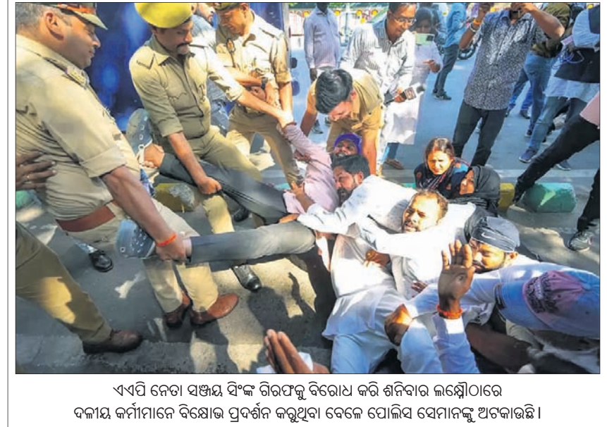
ଏଏପି ନେତା ସଞ୍ଜୟ ସିଂହ ଗିରଫକାରୀଙ୍କୁ ବିରୋଧ କରି ଶନିବାର ଲକ୍ଷ୍ମଣାପୁର ଦଳୀୟ କର୍ମୀମାନେ ବିରୋଧ ପ୍ରଦର୍ଶନ କରୁଥିବା ଦେଖି ଯୋଗ୍ୟ ସେମାନଙ୍କୁ ଅଟକାଇଛି।