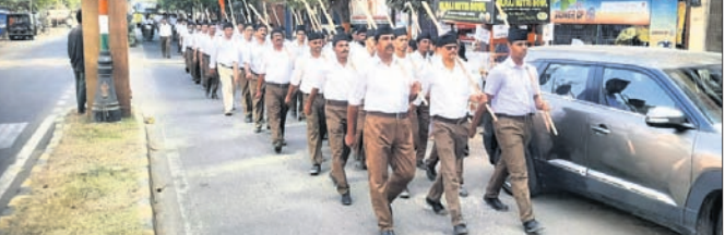
ସଂଘ ପକ୍ଷରୁ ସାହି ପରିଭ୍ରମଣ।

ବ୍ରହ୍ମପୁର, ୨୧.୧୦ (ସ୍ମୃତିରଞ୍ଜନ ମହାଲିକ) ବିଜୟା ଦଶମୀ ଉତ୍ସବର ମହତ୍ତ୍ୱ ସଂଘର ରାଷ୍ଟ୍ରୀୟ ସ୍ୱୟଂ ସେବକ ସଂଘ (ଆରବ୍ୟସ୍ୱର) ଜଗନ୍ନାଥ ଉପନଗର ପକ୍ଷରୁ ଶନିବାର ରୋସାଣା ନୂଆ ଗାଁଠାରେ ସଂଘର ପଠିଆ ଦିବସ ଓ ବିଜୟା ଦଶମୀ ଉତ୍ସବ ଅନୁଷ୍ଠିତ ହୋଇଯାଇଛି। ଏଥିରେ ସଂଘର ୨୦୦ ଜଣ ସଦସ୍ୟ ରୋସାଣା ନୂଆ ଗାଁର ସମସ୍ତ ସାହି ସମେତ ବିଜୁପୁର ମୁଖ୍ୟ ରାସ୍ତା ପରିଭ୍ରମଣ କରି ଶିଶୁମିତ୍ରରେ ପହଞ୍ଚିଥିଲେ। ସଂଘର ଅଶୋକ ପାଟା