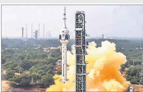
ଶ୍ରୀହରିକୋଟାସ୍ଥିତ ସତୀଶ ଧାଞ୍ଜନ ମହାକାଶ କେନ୍ଦ୍ରରୁ ଇସ୍ରୋର ଚିତ୍ରି-ଡିଏ ଉଡ଼ିକ୍ଷେପଣ ବେଳର ଦୃଶ୍ୟ ।

ଶ୍ରୀହରିକୋଟା, ୨୧.୧୦ ମହାକାଶ ଗବେଷଣା କ୍ଷେତ୍ରରେ ଭାରତର ପ୍ରଥମ ବୃହତ୍ ପଦକ୍ଷେପ ସଫଳ ହୋଇଛି । ଭାରତୀୟ ମହାକାଶ ଗବେଷଣା ପ୍ରତିଷ୍ଠାନ (ଇସ୍ରୋ) ପକ୍ଷରୁ ଶନିବାର ପୂର୍ବାହ୍ନ ୧୦ଟାରେ ଗଗନଯାନର ପ୍ରଥମ ଚେଷ୍ଟା ପ୍ଲାନେଟ୍ ଲକ୍ଷ୍ୟ କରାଯାଇଛି । ୨୦୨୫ରେ ମହାକାଶକୁ ମାନବଯୁକ୍ତ ଯାନ ପ୍ରେରଣ କରିବା ପାଇଁ ଏହି ଚେଷ୍ଟାର ସଫଳତା ବିଶେଷ ସହାୟକ ହେବ ବୋଲି ଆଶା