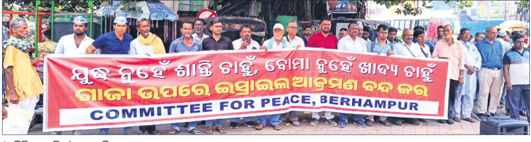
'କମିଟି ଫର୍ ପିସ୍' ପକ୍ଷରୁ ବିକ୍ଷୋଭ।

ବ୍ରହ୍ମପୁର, ୨୧.୧୦ (ନବସିଂହ ସାହୁ) 'କମିଟି ଫର୍ ପିସ୍' ବ୍ରହ୍ମପୁର ପକ୍ଷରୁ ଶନିବାର ପୁରୁଣା ବସଷ୍ଟାଣ୍ଡ ନିକଟରେ ପ୍ରତିବାଦ ସମାବେଶ ହୋଇଥିଲା। ପାଲେଷ୍ଟାଇନ ଉପରେ ଇସ୍ରାଏଲର ଆକ୍ରମଣ ଓ ନୂଆ ଆକ୍ରମଣର ତୀବ୍ର ନିନ୍ଦା ସହ ବନ୍ଦ ଦାବିରେ ଏହି କାର୍ଯ୍ୟକ୍ରମ କରାଯାଇଥିଲା। ଏଥିରେ ମିଳିତ ବାମପନ୍ଥା ନେତାମାନେ ସାମିଲ ହୋଇଥିଲେ ଏବଂ ମୁଖ ନୁହେଁ ଶାନ୍ତି ହିଁ ମାନବ ସଭ୍ୟତାର ମାଧ୍ୟମ ବୋଲି ନାରାବାଜି କରିଥିଲେ।