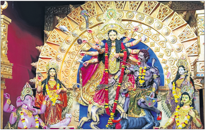
ନେହେରୁ ନଗର ପୂଜା କମିଟି ପକ୍ଷରୁ ତୁର୍ତ୍ତା ପୂଜା।