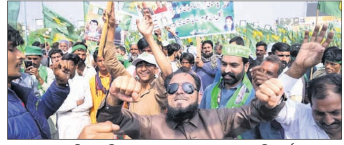
ନୂଆ ଶରିୟ୍ ଫେରିବା ପରେ ଲାହୋରରେ ଉତ୍ସବ ମନାଉଛନ୍ତି ସମର୍ଥକ।

ଅନ୍ୟପକ୍ଷେ ଗାଜା ଷ୍ଟିପ୍ ଉପରେ ଆକ୍ରମଣ କରି ରହିଥିବା ଯାଏ ପଶବନ୍ଧା ଥିବା ଇସ୍ରାଏଲୀ ସୈନ୍ୟମାନଙ୍କ ଭାଗ୍ୟ ରାଷ୍ଟ୍ରପତି ଡୋ ବାଇଡେନ୍ ଏନେଇ ଖୁସି ବ୍ୟକ୍ତ କରିବା ସହ କାତାର ସରକାରକୁ ନାହିଁ ବୋଲି ଶନିବାର ହମାସ୍ ସୂଚକ କରିଛି।