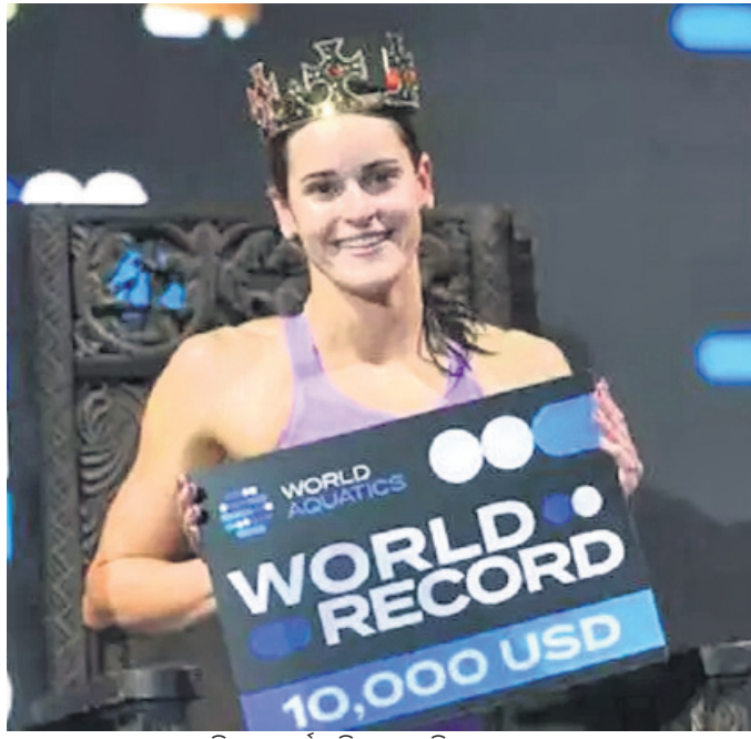
ବିଶ୍ୱ ରେକର୍ଡ କରିଥିବା କେଲି ମ୍ୟାକୋନ

କରିଦେଇଛନ୍ତି। ଏହାଦ୍ୱାରା ୫୦,୧୦୦ ଓ ୨୦୦ ମିଟର ବ୍ୟାକ୍‌ସ୍ଟୋକ୍ ଇଭେଣ୍ଟରେ ବିଶ୍ୱ ରେକର୍ଡ ପ୍ରତିଷ୍ଠା କରିବାରେ ପ୍ରଥମ ମହିଳା ଭାବେ ବିବେଚିତ ହୋଇଛନ୍ତି। ଜୁଲାଇରେ ଅନୁଷ୍ଠିତ ବିଶ୍ୱ ଚାମ୍ପିୟନଶିପ୍‌ରେ ସେ ଏହି ୩ ଇଭେଣ୍ଟ ଜିତିଥିଲେ। ତୋକିଓ ଅଲିମ୍ପିକ୍ସରେ ସେ ୧୦୦ ଓ ୨୦୦ ମିଟର ଚାଳନା ଲିଭ ଜିଆଙ୍ଗ (୨୬.୯୮) ଜିତିଥିଲେ। ୫୦ମିଟର ବ୍ୟାକ୍‌ସ୍ଟୋକ୍ ୨୦୧୮ରେ କରିଥିବା ରେକର୍ଡକୁ ଭଙ୍ଗ ଏକ ଅଲିମ୍ପିକ୍ସ ଇଭେଣ୍ଟ ସୁହେଁ।