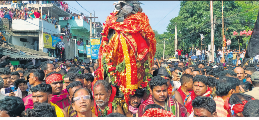
ମନ୍ଦିର ଅଭିମୁଖେ ମା'ଙ୍କ ବିକ୍ରୟ ପ୍ରତିମା ଛତର।

ରାସ୍ତା। ଭକ୍ତଙ୍କ ମାନସିକ ଆଗରେ ହାର୍ ମାନିଥିଲା ପ୍ରଶାସନ। ଶାନ୍ତକୃମିକଳାହାଣ୍ଡିରେ ଦଶହରା କହିଲେ ଏଠିକାର ଅଧିକାରୀ ଦେବା ମା' ମାଣିକେଶ୍ୱରୀଙ୍କ ପ୍ରସିଦ୍ଧ ଛତର ଯାତ୍ରାକୁ ବୁଝାଏ। କଳାହାଣ୍ଡିର ମୂଳ ଅଧିକାରୀ ଏହି ଶକ୍ତିର ଉପାସକ। ଆଜି ମାସ କୃଷ୍ଣପକ୍ଷ ଅଷ୍ଟମୀ ଦିନ ଭବାନୀପାଟଣା ରାଜପ୍ରାସାଦରେ