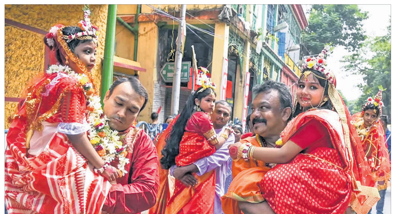
କୋଲକାତାରେ ମହାଷ୍ଟମୀ ଅବସରରେ କୁମାରୀ ପୂଜା ପାଇଁ ଭକ୍ତମାନେ ସେମାନଙ୍କ କନ୍ୟା ସନ୍ତାନଙ୍କୁ ସଜାଇ ମଞ୍ଚପୂଜା ନେଉଛନ୍ତି ।