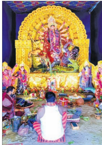
ପୁଲବାଣୀ ଚାକ୍ଷୁ ଷ୍ଟାଣ୍ଡ