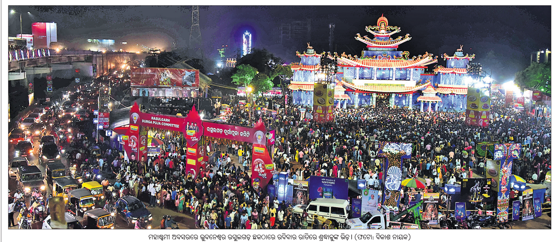
ମହାଶ୍ୱମୀ ଅବସରରେ ଭୁବନେଶ୍ୱର ରସୁଲଗଡ଼ ଛକଠାରେ ରବିବାର ରାତିରେ ଶ୍ରଦ୍ଧାଳୁଙ୍କ ଭିଡ଼।