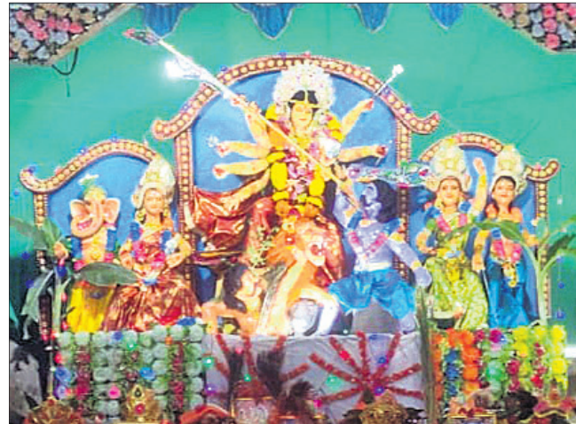
ଆର. ଉଦୟଗିରି ।