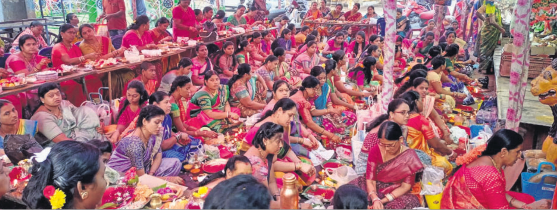
ରାୟଗଡ଼ା ଜିଲ୍ଲା ଗୁଣାପୁରସ୍ଥିତ ଦକ୍ଷିଣକାଳୀ ମନ୍ଦିରରେ ରବିବାର ମହାଷ୍ଟମୀ ତିଥିରେ ମହିଳାମାନେ କୁଞ୍ଜମ ପୂଜା କରୁଛନ୍ତି ।

ଆହତ ହୋଇଛନ୍ତି । ଉଭୟେ ପୁରୀପୂଜା ଦେଖିବା ପାଇଁ ବାଇକ ଯୋଗେ ଶିଶୁକେଳା ଯାଉଥିଲେ । କାନ୍ଥର ରାଜପଥ ୨୬ ପିପୁଟ ନିକଟରେ ସେମାନଙ୍କୁ କୌଣସି ଗାଡ଼ି ଧକ୍କା ଦେଇ ପକାଇ ଯାଇଥିଲା । ଉଭୟେ ବାଇକକୁ ଛାଡ଼ି ରାସ୍ତାରେ ପଡ଼ିଥିଲେ । ଖବର ପାଇ ସରକାରୀ ଥାନା ପୋଲିସ୍ ଉଭୟଙ୍କୁ ଉଦ୍ଧାର କରି ସ୍ଥାନୀୟ ଗୋଷ୍ଠୀ ସ୍ୱାସ୍ଥ୍ୟକେନ୍ଦ୍ରକୁ ପଠାଇଥିଲା । ହେଲେ ସେଠାରେ ହାତର ଲାଙ୍ଗୁଣକୁ ମୃତ ଘୋଷଣା କରିଥିଲେ ।