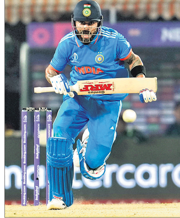
ରନ୍ ନେବା ଅବସରରେ ବିରାଟ କୋହଲି।

ମହାନ ଶାନ୍ତି ୫ ଉଲକେଟ ସଫଳତା ଓ ବିରାଟ କୋହଲିଙ୍କ ଧୈର୍ଯ୍ୟପୂର୍ଣ୍ଣ ୯୫ ରନ୍ ବଳରେ ବିଶ୍ୱକପ୍ରେ ୨୧ତମ ମ୍ୟାଚରେ ଦେଶକୁ ଚମ୍ପିୟାନ ହେବାକୁ ୪ ଉଲକେଟରେ ପରାସ୍ତ କରିଛି ଭାରତ। ଚଳିତ ବିଶ୍ୱକପ୍ରେ ଭାରତର ଏହା କ୍ରମାଗତ ପଞ୍ଚମ ବିଜୟ ହୋଇଥିବା ବେଳେ ନ୍ୟୁଜିଲାଣ୍ଡ ପ୍ରଥମ ପରାଜୟ ବରଣ କରିଛି। ଏହାପୂର୍ବେ ୨୦ ବର୍ଷ ପରେ ଦିନକିଆ ବିଶ୍ୱକପ୍ରେ ନ୍ୟୁଜିଲାଣ୍ଡ ବିପକ୍ଷରେ ବିଜୟ ହାସଲ କରିଛି ଭାରତ। ଶେଷ ଥର ପାଇଁ ୨୦୦୩ କ୍ରିକେଟ ବିଶ୍ୱକପ୍ରେ ଭାରତ ଜିତିଥିଲା। ଏହି ବିଜୟ ସହିତ ଭାରତ ପଏଣ୍ଟ ଟେବୁଲର ପ୍ରଥମ ସ୍ଥାନରେ ପହଞ୍ଚିଥିବା ବେଳେ ନ୍ୟୁଜିଲାଣ୍ଡ ଦ୍ୱିତୀୟ ସ୍ଥାନକୁ ଖସିଛି। ପ୍ରଥମେ ଦ୍ୟାଟ୍ କରିଥିବା ନ୍ୟୁଜିଲାଣ୍ଡ ୫୦ ଓଭରରେ ସମସ୍ତ ଉଲକେଟ ହରାଇ ୨୭୩ ରନ୍ କରିଥିବା ବେଳେ ଭାରତ ୪୮ ଓଭରରେ ୬ ଉଲକେଟ