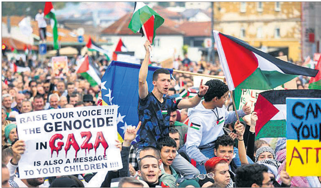
ସାରାଜେଭାରେ ପାଲେଷ୍ଟାଇନ୍ ସପକ୍ଷ ଓ ଇସ୍ରାଏଲ ବିରୋଧରେ ବିଶୋଭ ପ୍ରଦର୍ଶନ ।

କାଠମାଣ୍ଡୁରେ ଭୂକମ୍ପ କାଠମାଣ୍ଡୁ ୨୨୧୦: ଦେପାଳ ରାଜଧାନୀ କାଠମାଣ୍ଡୁ ଉପତ୍ୟକାରେ ରବିବାର ସକାଳେ ଭୂକମ୍ପ ଅନୁଭୂତ ହୋଇଛି ।