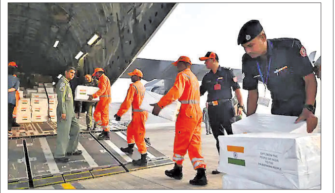
ବାୟୁସେନାର ସି-୧୭ ପରିବହନ ବିମାନରେ ରିଲିଫ୍ ଓ ଔଷଧ ଲୋଡ଼ କରାଯାଉଛି ।

ନୂଆଦିଲ୍ଲୀ, ୨୨୧୦(ପି.ଟି.) ଫୋନ୍‌ରେ କଥା ହୋଇ ଗାଜା ହସ୍ତିଚାଳ ଆକ୍ରମଣରେ ସାଧାରଣ ଲୋକଙ୍କ ମୃତ୍ୟୁକୁ ନେଇ ଦୁଃଖପ୍ରକାଶ କରିଥିଲେ ।