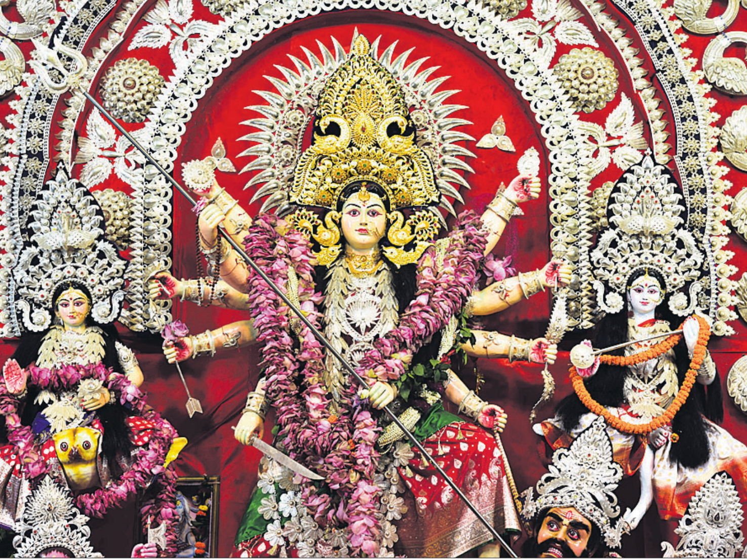
ଭକ୍ତିମୟ ପରିବେଶ ଭିତରେ ରବିବାର ଭୁବନେଶ୍ୱର ଶହାଦନଗରସ୍ଥିତ ପୂଜା ମଣ୍ଡପରେ ଦୁର୍ଗାପୂଜା ପୂଜା କରାଯାଇଛି।

ହରାଇ ୨୭୩ ରନ୍ କରିଥିଲା। ଓହ୍ଲାଇଥିଲା। ପାଞ୍ଚାଳ ସ୍ଥାନରେ ହାର୍ଦ୍ଦିକ ପାଞ୍ଚାଳ ଆହତ ଥିବାରୁ ସୂର୍ଯ୍ୟକୃମାର ଯାଦବ ଓ ଶାର୍ଦ୍ଦୂଳ ଭାରତ ଦୁଇଟି ପରିବର୍ତ୍ତନ ସହିତ ଠାକୁରଙ୍କ ସ୍ଥାନରେ ଚୋପୁଷ୍ପା-୪