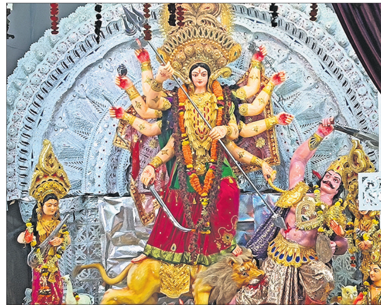
ବ୍ରହ୍ମପୁର ରଷିକୁଳ୍ୟା ଜଳ ସେବନ ମଣ୍ଡଳ ।