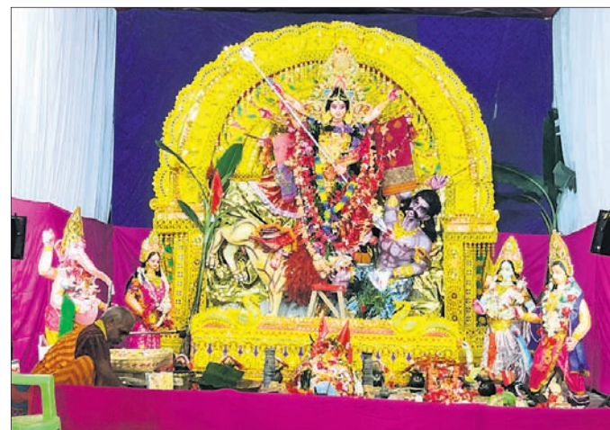
ପୁଲବାଣୀ ମାଛକୁଦ ଛକ ।