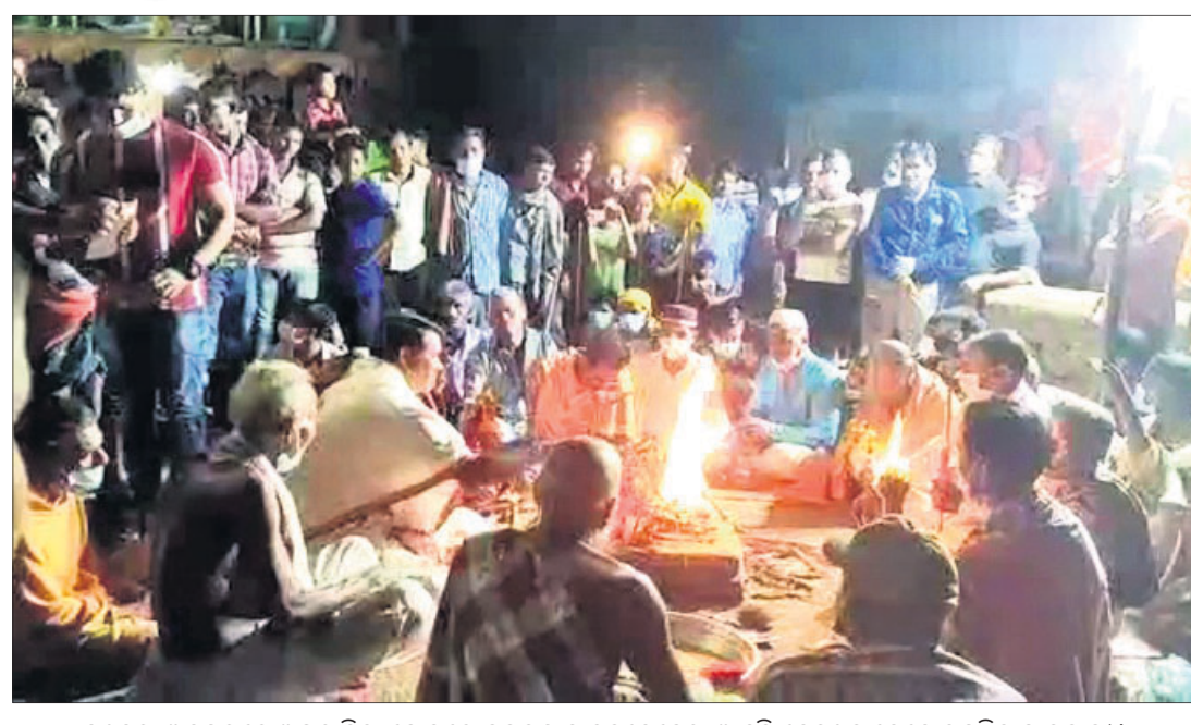
ଦଶହରା ଅବସରରେ ଅପରାଜିତା ହୋମରେ ମୁସଲମାନ ଦଳବେହେରା ଆହୁତି ଦେଉଥିବାବେଳେ ଉପସ୍ଥିତ ଗ୍ରାମବାସୀ।

ଖୋର୍ଦ୍ଧା ଜିଲ୍ଲା ବୋଲଗଡ଼ା ବ୍ଲକର ମାଣିକଗୋଡ଼ା ଗ୍ରାମ। ଏଠାରେ ନିଆରା ଭଙ୍ଗରେ ପାଳିତ ହୁଏ ଦଶହରା। ହିନ୍ଦୁ ଓ ମୁସଲମାନ ମିଳିତ ଭାବେ ଏଠି ପାଳନ କରି ଆସୁଛନ୍ତି ଦଶହରା ପର୍ବ। ସମସ୍ତଙ୍କର ବାଣୀ: ବିକ୍ରମାଦଶମୀ ଉତ୍ସବରେ ବ୍ରାହ୍ମଣ ପୂଜା କରୁଥିବା ବେଳେ ମୁସଲମାନ ଦଳବେହେରା କର୍ତ୍ତା ସାଜି ଅପରାଜିତା ହୋମରେ ଆହୁତି ଦେଇଥାନ୍ତି। କୁହାଯାଏ ଅତି ପ୍ରାଚୀନ କାଳରୁ ଏହି ନିଆରା ପରମ୍ପରା ଚାଲି ଆସିଛି। ଏହା ହିଁ ମାଣିକଗୋଡ଼ା ଦଶହରାର ବିଶେଷତ୍ୱ। ଏଠାରେ ୪ଦିନ ଧରି