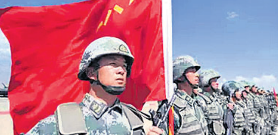
ନିକଟରେ ଚାଇନା ଅଧିକ ସୈନ୍ୟ ପୁରସ୍କର କରିବା ସହ ଭିତ୍ତିଭୂମି ନିର୍ମାଣ ବଢ଼ାଇଛି। ତୋକଲାମ ନିକଟରେ ଚାଇନା ମୁଖ୍ୟ ମହକୁମ