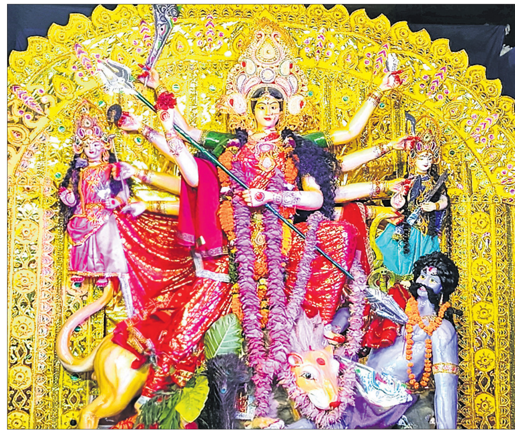
କୋର୍ଟପେଟା ଛକ ।