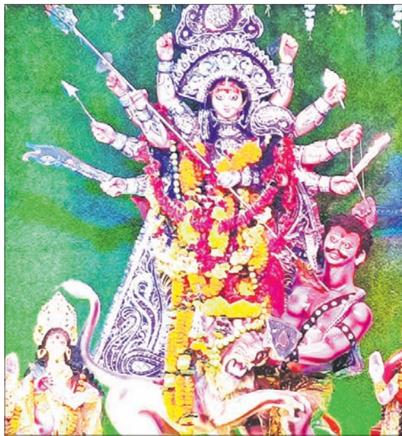
ଚୋଟା ସାହି ବୃତ୍ତୀୟ ଲାଲନ୍ ।