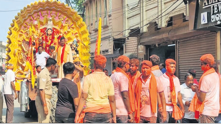
ବରଗଡ଼ ଭଜନାଶ୍ରମ ବୁର୍ଲାପୂଜାର ମୂର୍ତ୍ତି ଭସାଣି ଶୋଭାଯାତ୍ରା।

ପଦ୍ମପୁର, ୨୫.୧୦ (ପ୍ରଦୀପ୍ତ ଦାଶ): ଅଭରାଭରା କ୍ରିକେଟ ପଡ଼ିଆରେ ଖାନ ଭାଇତା ରୁଗ୍ମଜ୍ୱଳ ଓ କରବଲପୁର ରେସିଡେନ୍ସିଆଲ ମୁକ୍ତ ୨ ମହାବିଦ୍ୟାଳୟ ଆଇ.ଏସ.ଏଲ.ରେ ତୃତୀୟ ଯଯ୍ୟ ଘାଁ ବୁର୍ଲା କ୍ରିକେଟ କପ୍ ଚୂନାମେଣ୍ଟ ଉଦ୍‌ଯାପିତ ହୋଇଛି।