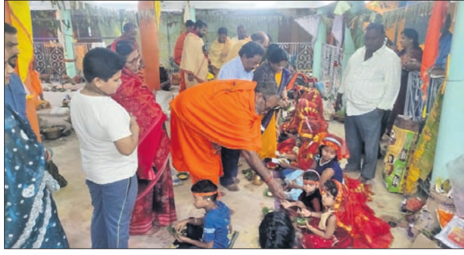
ଯଜ୍ଞ ସ୍ଥଳରେ କୁମାରୀମାନଙ୍କୁ ପୂଜା କରାଯାଇଛି।

ଶାରଦୀୟ ପାର୍ବଣ ଅବସରରେ ସୋନପୁର ଗଡ଼ଜାତ ଅଞ୍ଚଳର ଲକ୍ଷ୍ମଣଦାସ ମା' ସୁରେଶ୍ୱରୀଙ୍କ ଶକ୍ତିପୀଠରେ ତଳିଥିବା ସପ୍ତଶତୀ ଚଣ୍ଡୀଯଜ୍ଞ ମଙ୍ଗଳବାର ଉଦ୍‌ଘାଟିତ ହୋଇଯାଇଛି।