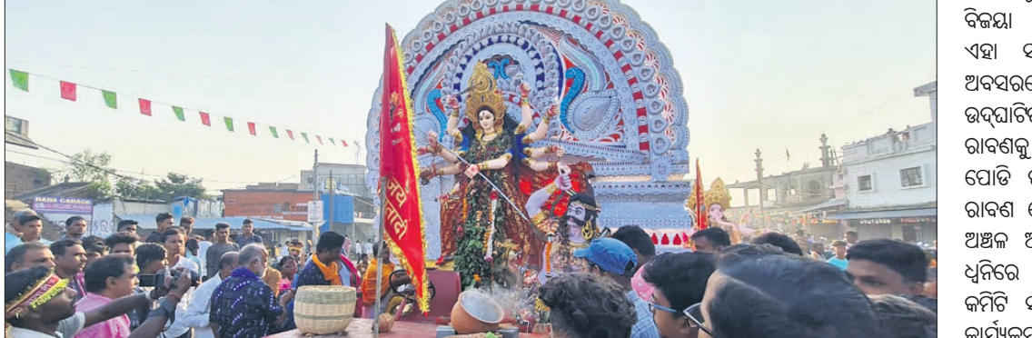
ମା'ଙ୍କ ମୂର୍ତ୍ତିକୁ ବିସର୍ଜନ ପାଇଁ ଶୋଭାଯାତ୍ରାରେ ନିଆଯାଉଛି।