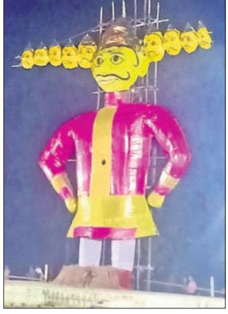
ସୋନପୁର, ୨୫.୧୦ (ମୁଖ୍ୟମନ୍ତ୍ରୀ ଶତପଥୀ)

ସୁବର୍ଣ୍ଣପୁର ସହରରେ ମଙ୍ଗଳବାର ବିକ୍ରୟ ଦଶମୀ ଅବସରରେ ରାବଣ ପୋଡ଼ି ମହୋତ୍ସବ ଅନୁଷ୍ଠିତ ହୋଇଯାଇଛି।