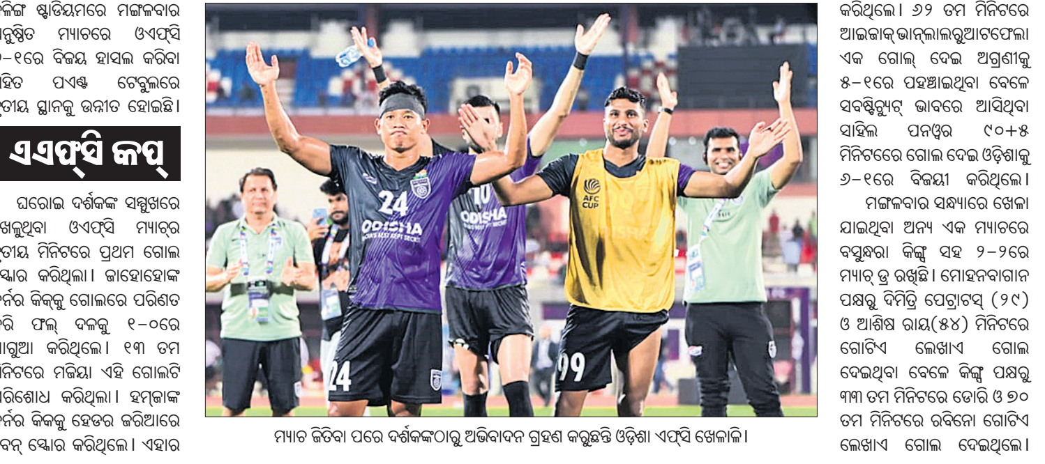
ମ୍ୟାଚ ଜିତିବା ପରେ ଦର୍ଶକଙ୍କଠାରୁ ଅଭିବାଦନ ଗ୍ରହଣ କରୁଛନ୍ତି ଓଡ଼ିଶା ଏସିଏସିଏ ଖେଳାଳି।

ଭୁବନେଶ୍ୱର, ୨୫।୧୦ (ସରୋଜ କେନା) ମୋଟାମୋଟା ଫାଇଲ୍ ଡବଲ୍ ଗୋଲ୍ ବଳରେ ଏସିଏସିଏ କପରେ ପ୍ରଥମ ବିଜୟ ହାସଲ କରିଛି ଓଡ଼ିଶା ଏସିଏସିଏ(ଏସିଏସିଏ)। କଳିଙ୍ଗ ଷ୍ଟାଡିୟମରେ ମଙ୍ଗଳବାର ଅନୁଷ୍ଠିତ ମ୍ୟାଚରେ ଏସିଏସିଏ ୬-୧ରେ ବିଜୟ ହାସଲ କରିବା ସହିତ ପାଞ୍ଚ ଚେଷ୍ଟିକରେ ତୃତୀୟ ସ୍ଥାନକୁ ଉନ୍ନତ ହୋଇଛି।