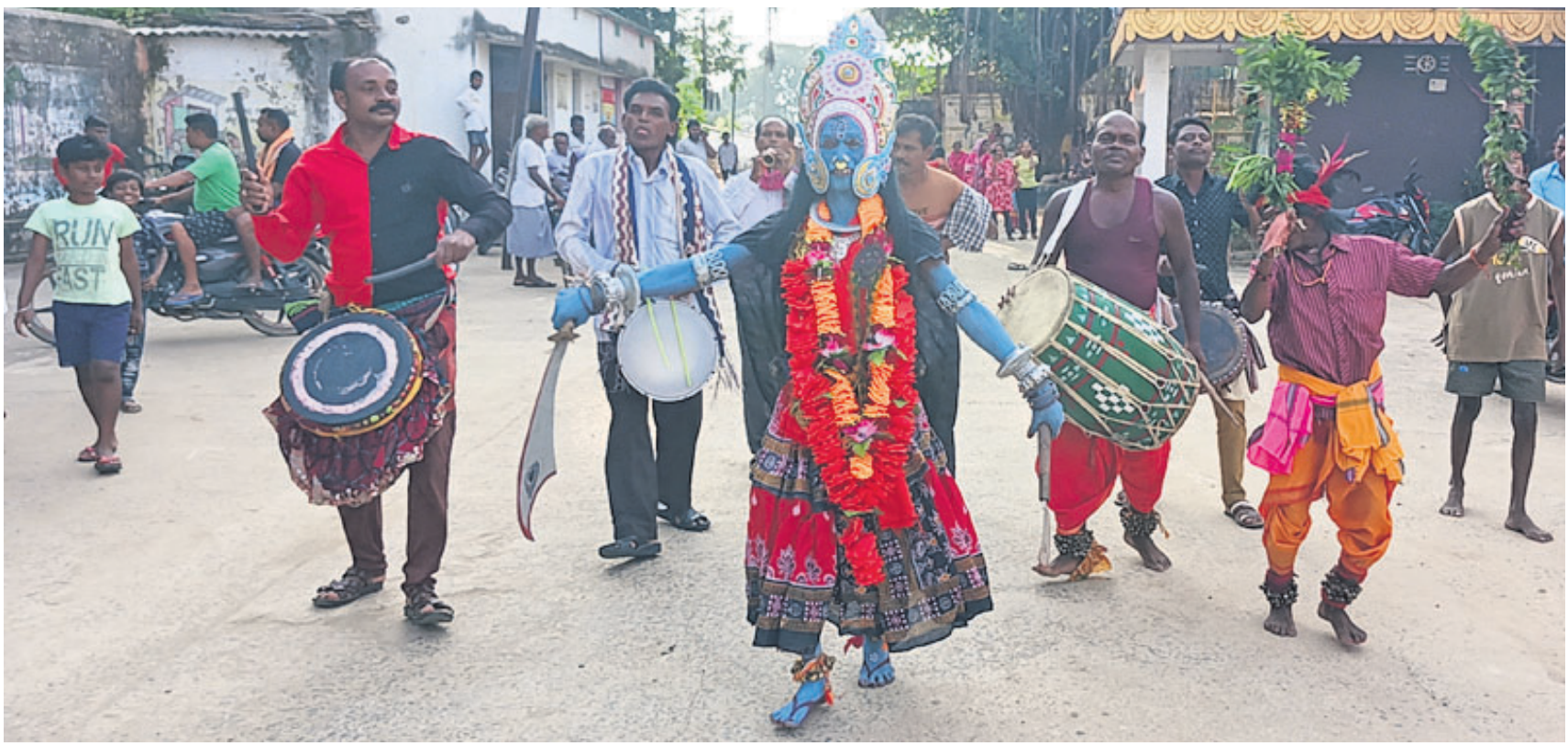
ଦଶହରା ଅବସରରେ ପଦ୍ମପୁର ନାଗ ଲକ୍ଷ୍ମୀ ଦେବୀ ଧାରଣ କରି ନିଜ ଗାଁ ବରଗଡ଼ ଜିଲ୍ଲା ସୋହେଲ୍ଲା ବ୍ଲକ୍ ଘାଟି ପରିକ୍ରମା କରୁଛନ୍ତି।

ବରଗଡ଼, ୨୫.୧୦ (ପ୍ରେମାନନ୍ଦ ଖମାରି): ବରଗଡ଼ ଗ୍ରାମାଞ୍ଚଳ ଥାନା ଅଞ୍ଚଳରେ ଜଣେ ନାବାଳିକାଙ୍କୁ ବଳାହାର କରାଯାଇଥିବା ଅଭିଯୋଗ ହୋଇଛି।