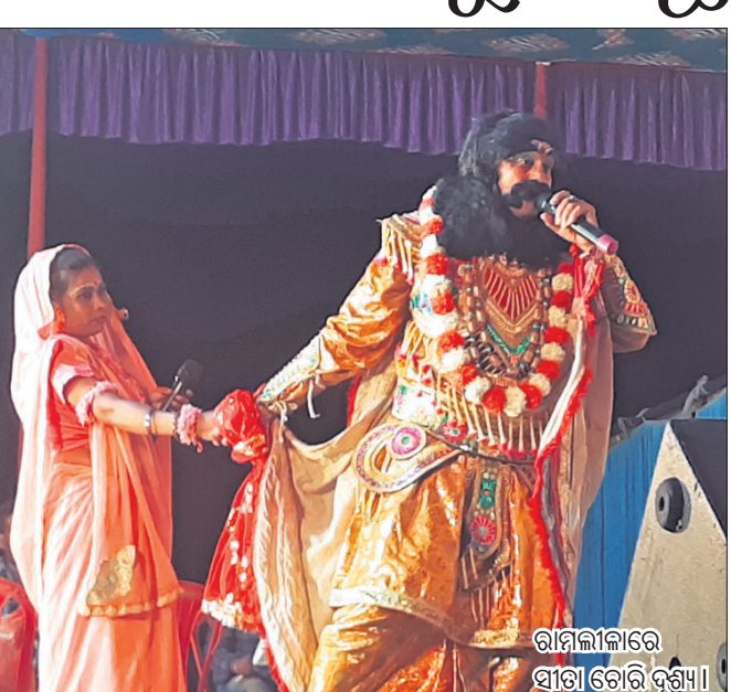
ଶାମିଲୀକାରେ ସାଂଗୀତୋତ୍ସବ ଯାତ୍ରାରେ ଦୁର୍ଗାପୂଜା।

ବରଗଡ଼ ଜିଲ୍ଲା ଅତାବିରା ବ୍ଲକ୍ ଅନ୍ତର୍ଗତ ଗୋଡ଼ଭରା କ୍ୟାମ୍ପ ଦୁର୍ଗାପୂଜା ରୂପବାର ଭସାଣି ସହ ସମ୍ପନ୍ନ ହୋଇଛି।