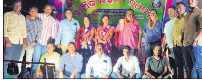
ବାର୍ଷିକ ଉତ୍ସବରେ ମଞ୍ଚାସୀନ ଅତିଥି ଓ ସଂଘ କର୍ମକର୍ତ୍ତା।

ସୁବର୍ଣ୍ଣପୁର ଜିଲ୍ଲା ବୀରମହାରାଜପୁର ବ୍ଲକ ଉଚ୍ଚ ବିଦ୍ୟାଳୟରେ ଆନୁଷ୍ଠାନିକ ଭାବେ ପାଠ୍ୟପୁସ୍ତକ ଲାଲବାହାଦୁର ଯୁବକ ସଂଘର ବାର୍ଷିକ ଉତ୍ସବ ଅନୁଷ୍ଠିତ ହୋଇଯାଇଛି।