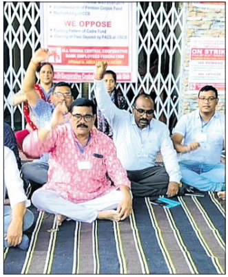
ବୌଦ୍ଧ, ୨୫.୧୦ (ଅଜିତ କୁମାର ବାରିକ)

ରାଜ୍ୟ ସମବାୟ ବ୍ୟାଙ୍କ କେନ୍ଦ୍ର ବ୍ୟାଙ୍କ ମହାସଂଘର ଆହ୍ୱାନକ୍ରମେ ୫ ଦିନୀ ଦାବି ନେଇ ବୌଦ୍ଧ କେନ୍ଦ୍ର ସମବାୟ ବ୍ୟାଙ୍କ ଆଗରେ ରୁଧିବାରଣକୁ ଉଚ୍ଚ ବ୍ୟାଙ୍କର କର୍ମଚାରୀମାନେ ଧାରଣା ଦେଇଛନ୍ତି।