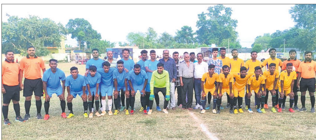
ଖେଳାଳି ଓ ଅତିଥି।

ବୌଦ୍ଧ କେନ୍ଦ୍ର ପଡ଼ିଆଠାରେ ଗେହ୍ଲାନା କ୍ଲବ ପକ୍ଷରୁ ଚାଲିଥିବା ଗେହ୍ଲାନା କ୍ଲବ ପୁଟବଲ ଦୁର୍ଗାମେଣ୍ଟର ରୁଧିବାର ଦିନ ବି ଗ୍ରୁପର ପ୍ରଥମ ଖେଳ ସ୍ପୋର୍ଟସ୍ ହଷ୍ଟେଲ ପୁଲବାଣୀ ଓ ଏସପିସି ବୌଦ୍ଧ ମଧ୍ୟରେ ଅନୁଷ୍ଠିତ ହୋଇଥିଲା।