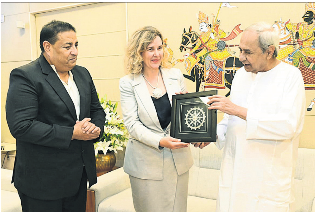
ପୁଖ୍ୟମନ୍ତ୍ରୀ ନବୀନ ପଟ୍ଟନାୟକଙ୍କ ସହ ଅଭିଭାବୀ ଚେଷ୍ ଫେଡେରେଶନ(ଫିଡେ)ର ଉପାଧ୍ୟକ୍ଷ ତଥା ମହିଳା ଗ୍ରାଣ୍ଟମାଷ୍ଟର ଡାନା ରିଜନିସ୍ ଓଜୋଲା।

ଓଡ଼ିଶା ପୁଖ୍ୟମନ୍ତ୍ରୀ ନବୀନ ପଟ୍ଟନାୟକଙ୍କୁ ଅଭିଭାବୀ ଚେଷ୍ ଫେଡେରେଶନ (ଫିଡେ)ର ଉପାଧ୍ୟକ୍ଷ ତଥା ମହିଳା ଗ୍ରାଣ୍ଟମାଷ୍ଟର ଡାନା ରିଜନିସ୍ ଓଜୋଲା ବୁଧବାର ଭେଟିଛନ୍ତି। ରିପବ୍ଲିକ୍ ଅଫ୍ ଲାଟଭିଆର ପୂର୍ବତନ ଅର୍ଥମନ୍ତ୍ରୀ ଡାନା ବର୍ତ୍ତମାନ ଓଡ଼ିଶା ଗସ୍ତରେ ରହିଥିବା ବେଳେ ପୁଖ୍ୟମନ୍ତ୍ରୀଙ୍କୁ ଭେଟିଥିଲେ। ଓଡ଼ିଶାରେ ଚେଷ୍ ପ୍ରଚାର ପ୍ରସାର ପାଇଁ କରାଯାଉଥିବା ଉଦ୍ୟମକୁ ସେ ବେଶ୍ ପ୍ରଶଂସା ମଧ୍ୟ କରିଥିଲେ। ଏହା ସହିତ ରାଜ୍ୟର ଯୁବ ଚେଷ୍ ପ୍ରତିଭାମାନଙ୍କୁ ଆଗକୁ ଆସିବା ପାଇଁ ଏକ ମାଧ୍ୟମ ପ୍ରଦାନ କରିବା ଲାଗି ଆଲୋଚନା ହୋଇଥିଲା। ଚେଷ୍ ଉଭୟ ବୁଦ୍ଧିମତା ଓ ମାନସିକ ଦକ୍ଷତା ବୃଦ୍ଧି କରୁଥିବା ବେଳେ ଯୁବବର୍ଗଙ୍କ ମଧ୍ୟରେ ଏହାର ଲୋକପ୍ରିୟତା ବୃଦ୍ଧି କରିବା ଉପରେ ଉଭୟ ନେତା ରୁଚୁକାରୋପ କରିଥିଲେ। ଯୁବ ଚେଷ୍ ପ୍ରତିଭାମାନଙ୍କୁ ବିକ୍ଷେପ କରି ଉପଯୁକ୍ତ ପ୍ରଶିକ୍ଷଣ ମାଧ୍ୟମରେ ଜାତୀୟ ଓ ଅଭିଭାବୀ ସ୍ତର ପାଇଁ ପ୍ରସ୍ତୁତ କରିବାକୁ ମଧ୍ୟ ଆଲୋଚନା ହୋଇଥିଲା। ରାଜ୍ୟରେ ଯୁବ ସମାଜର ଉନ୍ନତି ପାଇଁ ଆମେ ପ୍ରତିଶ୍ରୁତିବଦ୍ଧ। ଏହାକୁ ତର୍କାତର୍କ କରିବା ପାଇଁ ଚେଷ୍ ଏକ ଉପଯୁକ୍ତ ମାଧ୍ୟମ ବୋଲି କହିଥିଲେ ପୁଖ୍ୟମନ୍ତ୍ରୀ