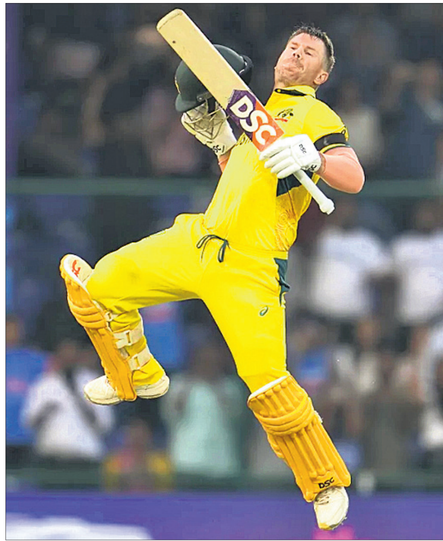
ଶତକ ହାସଲ ପରେ ଉଲ୍ଲସିତ ଖେଳାଳୀ