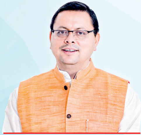
Pushkar Singh Dhami Chief Minister, Uttarakhand