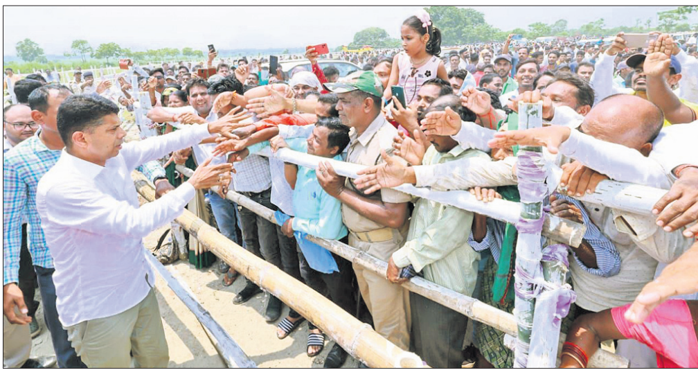
ଯାଜପୁର ଜିଲା ଗସ୍ତ କରି ଲୋକମାନଙ୍କଠାରୁ ଅଭିଯୋଗ ଶୁଣିବା ଅବସରରେ ଜନସାଧାରଣଙ୍କ ସହ ଭି.କେ. ପାଣିଆନ