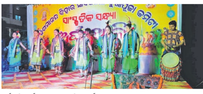
ଅର୍ଥଥାଳି କାର୍ଯ୍ୟକ୍ରମରେ ସାଂସ୍କୃତିକ କାର୍ଯ୍ୟକ୍ରମ।

ଏକତା, ଆଖଣ୍ଡତା ଏବଂ ଭାଇତାରା ପ୍ରତୀକ ବରଗଡ଼ ପୌର ପରିଷଦ ଅଧୀନ ଖାର୍ଚ୍ଚ ୨-୧ ନଗରାମୟ ବିହାର। ଏହି ପଦ୍ମପାଠ୍ୟକ ଫଣ୍ଡରେ ଥିବା ସଂସ୍କୃତି ଅନନ୍ୟ, ନିଆରା।