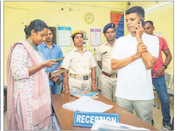
ଗଜପତି ଜିଲା ଗସ୍ତ ସମୟରେ ବିକଳପ ଗାଡିରେ ପାରଳାଖେମୁଣ୍ଡି ଆମା ପରିବର୍ତ୍ତନ କରି ସମସ୍ୟା ଦୂରୀକୃତି