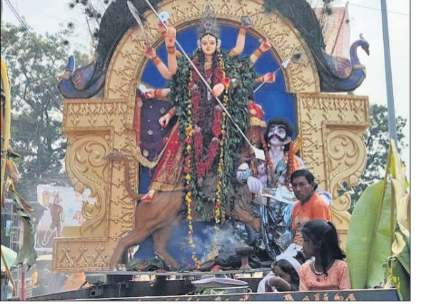
ବରଗଡ଼ ଗୌରପଡ଼ା ବୁର୍ଲାପୂଜାର ଭସାଣି ଶୋଭାଯାତ୍ରା।