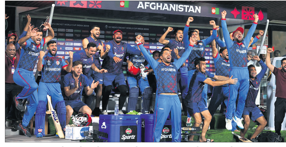
ପାକିସ୍ତାନ ବିପକ୍ଷ ବିଜୟ ପରେ ଖୁସିରେ ଆମ୍ବୁହାର ଆଫଗାନିସ୍ତାନ ଖେଳାଳୀ

୪୧୭/୬: ବନାମ ଆଫଗାନିସ୍ତାନ, ପର୍ଯ୍ୟ, ୨୦୧୫ ୩୯୯/୯: ବନାମ ନେଦରଲାଣ୍ଡ, ଦିଲ୍ଲୀ, ୨୦୨୩ ୩୮୧/୫: ବନାମ ବାଂଲାଦେଶ, ନୂଆଦିଲ୍ଲୀ, ୨୦୧୯ ୩୭୭/୬: ବନାମ ଦକ୍ଷିଣ ଆଫ୍ରିକା, ବାସେଟେରେ, ୨୦୦୭ ୩୭୬/୯: ବନାମ ଦକ୍ଷିଣ ଆଫ୍ରିକା, ସିଡ୍ନୀ, ୨୦୧୫ ଦିନିକିଆରେ ଦ୍ରୁତତମ ଶତକ (ବଲ୍ ଦୃଷ୍ଟିରୁ) ୩୧: ଏବି ଡି'ଭିଲିୟର୍ସ ବନାମ ଫ୍ରେସ୍ଚୋଲ୍ଡ, କୋହାଟୁବର୍ଗ, ୨୦୧୫ ୩୬: କୋରେ ଆଣ୍ଡରସନ ବନାମ ଫ୍ରେସ୍ଚୋଲ୍ଡ, କୁଇନ୍ସଟାଉନ, ୨୦୧୪ ୩୭: ଶାହିଦ ଆଫ୍ରିକା ବନାମ ଶ୍ରୀଲଙ୍କା, ନାଲରୋବି, ୧୯୯୬ ୪୦: ଗ୍ରେନ୍ ମ୍ୟାକ୍ଗ୍ରୋଲ ବନାମ ନେଦରଲାଣ୍ଡ, ଦିଲ୍ଲୀ, ୨୦୨୩ ଦିନିକିଆ ବିଶ୍ୱକପରେ ଦ୍ରୁତତମ ଶତକ ୪୦: ଗ୍ରେନ୍ ମ୍ୟାକ୍ଗ୍ରୋଲ ବନାମ ନେଦରଲାଣ୍ଡ, ଦିଲ୍ଲୀ, ୨୦୨୩ ୪୯: ଏଡେନ ମାରକ୍ସ ବନାମ ଶ୍ରୀଲଙ୍କା, ଦିଲ୍ଲୀ, ୨୦୨୩ ୫୦: କେଜିନ ଓ'ବ୍ରାଏନ ବନାମ ଇଂଲଣ୍ଡ, ବେଙ୍ଗାଲୁରୁ, ୨୦୧୧ ୫୧: ଗ୍ରେନ୍ ମ୍ୟାକ୍ଗ୍ରୋଲ ବନାମ ଶ୍ରୀଲଙ୍କା, ସିଡ୍ନୀ, ୨୦୧୫ ୫୨: ଏବି ଡି'ଭିଲିୟର୍ସ ବନାମ ଫ୍ରେସ୍ଚୋଲ୍ଡ, ସିଡ୍ନୀ, ୨୦୧୫ ଦିନିକିଆ କ୍ରିକେଟରେ ବୃହତ୍ ବିଜୟ ୩୧୭: ଭାରତ ବନାମ ଶ୍ରୀଲଙ୍କା, ତ୍ରିଭେନ୍ଦ୍ରମ, ୨୦୨୩ ୩୦୯: ଅଷ୍ଟ୍ରେଲିଆ ବନାମ ନେଦରଲାଣ୍ଡ, ଦିଲ୍ଲୀ, ୨୦୨୩ ୩୦୪: ଜିୟାହ୍ନୁ ବନାମ ଯୁଏଲ, ହରାରେ, ୨୦୨୩ ୨୯୦: ମୁକ୍ତିଲାଭ ବନାମ ଆୟର୍ଲ୍ୟାଣ୍ଡ, ଆବେର୍ଡେନ, ୨୦୦୮ ୨୭୫: ଅଷ୍ଟ୍ରେଲିଆ ବନାମ ଆଫଗାନିସ୍ତାନ, ପର୍ଯ୍ୟ, ୨୦୧୫