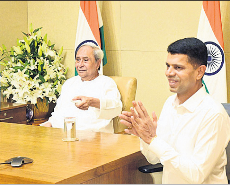
ମୁଖ୍ୟମନ୍ତ୍ରୀ ନବୀନ ପଟ୍ଟନାୟକଙ୍କ ଦ୍ୱାରା କଟକ ଜିଲାର ବିଭିନ୍ନ ପ୍ରକଳ୍ପ ଉଦ୍‌ଘାଟନ ଅବସରରେ ଉପସ୍ଥିତ ୫-ଟି ସର୍ତ୍ତ ଭି.କେ. ପାଣିଆନ