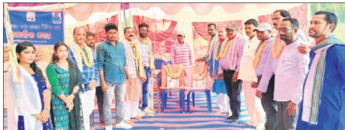
ବୈଠକରେ ଯୋଗ ଦେଇଥିବା ଅତିଥିବୃନ୍ଦ।