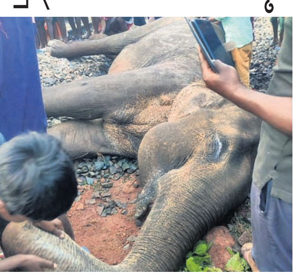
ତ୍ରେନ୍ ଧକ୍କାରେ ମୃତ ମାଛହାତୀ।