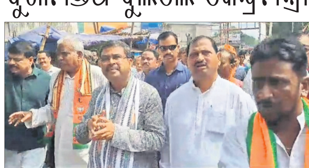
ପାଳଲହଡ଼ା ଗସ୍ତ ଅବସରରେ ଦଳାୟ କର୍ମୀଙ୍କ ଗହଣରେ କେନ୍ଦ୍ରମନ୍ତ୍ରୀ ଧର୍ମେନ୍ଦ୍ର ପ୍ରଧାନ।