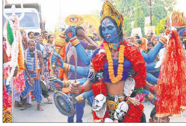
ଭସାଣି ଶୋଭାଯାତ୍ରାରେ ସାଂସ୍କୃତିକ କାର୍ଯ୍ୟକ୍ରମ ।