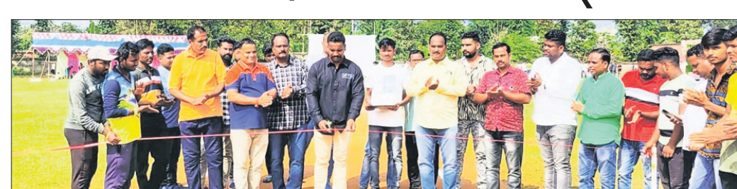
ପୁଖ୍ୟ ଅତିଥି ଚୁର୍ଚ୍ଚାମେଘକୁ ଉଦ୍‌ଘାଟନ କରୁଛନ୍ତି।