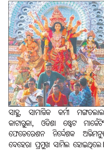
ରାସୋଳ ପୋଲିସ୍ ଉପଯୋଗ କରି ରାସୋଳ ପୋଲିସ୍ ଉପଯୋଗ କରିଥିଲେ।