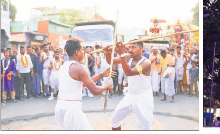
ଅନୁଗୋଳ ଅମଳାପତା ମେଡ଼ ।