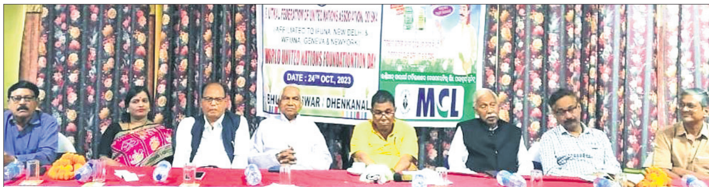
ଉତ୍ସୁକ ପକ୍ଷରୁ ବିଶ୍ଵ ଜାତିସଂଘ ଦିବସ ପାଳନ କରାଯାଇଛି।