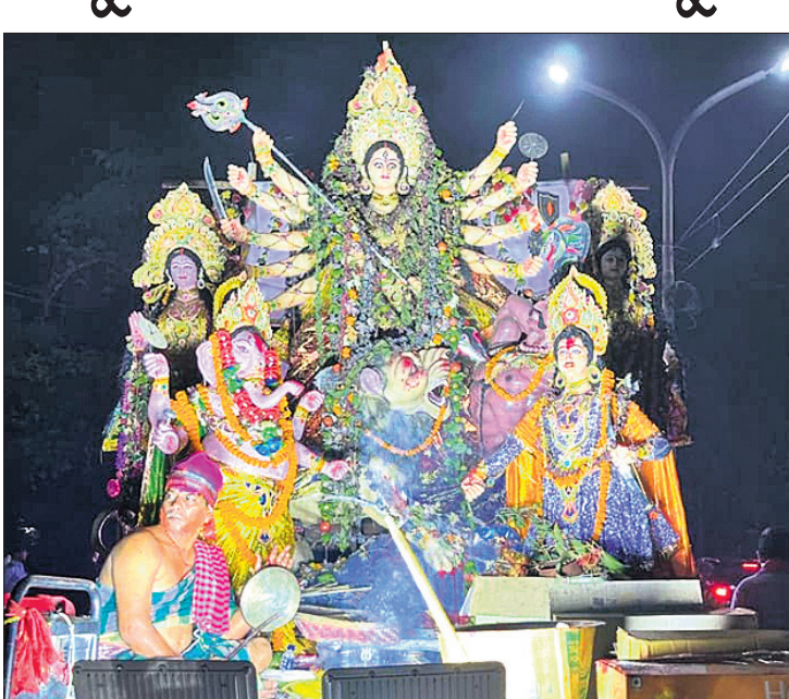
ଶୋଭାଯାତ୍ରା ବିସର୍ଜନ ପାଇଁ ମା' ଦୁର୍ଗାଙ୍କ ମେଡ଼କୁ ନିଆଯାଇଛି।