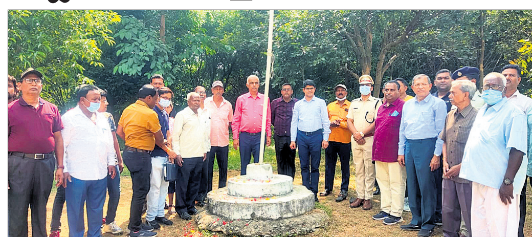
ବନ୍ଧୁକ ଚାଳନା ପ୍ରତିଯୋଗିତାକୁ ଅତିଥିମାନେ ଉଦ୍‌ଘାଟନ କରୁଛନ୍ତି।