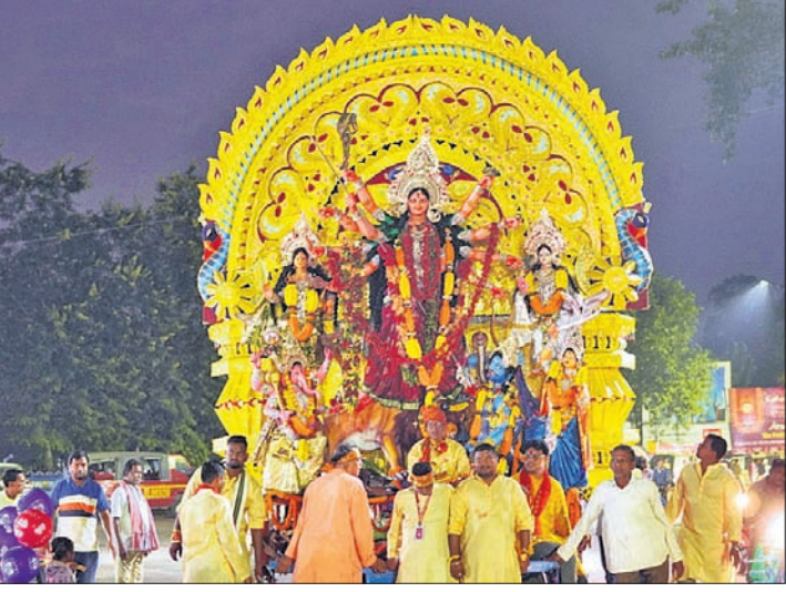
ଭସାଣି ଶୋଭାଯାତ୍ରାରେ ସାମିଲ ହୋଇଥିବା ମେଡ଼ ।