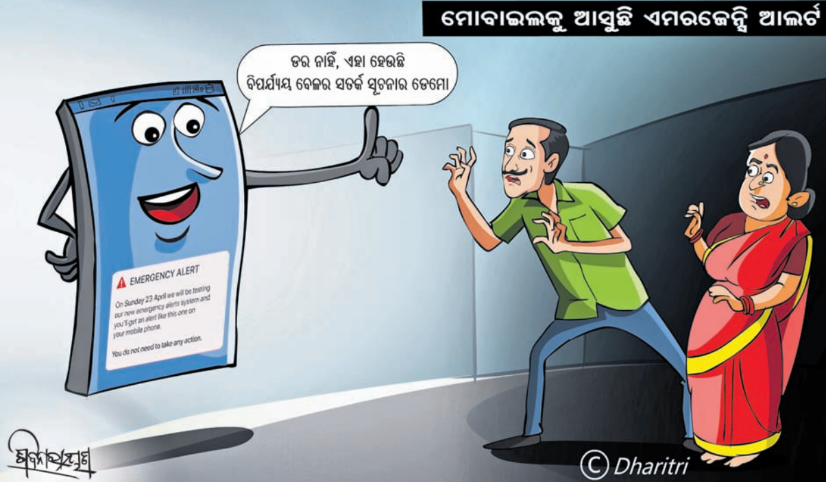
ମୋବାଇଲକୁ ଆସୁଛି ଏମରଜେନ୍ସି ଆଲର୍ଟ