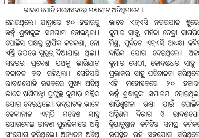
ରାସୋଳ ପୋଲିସ୍ ମହୋତ୍ସବରେ ମହାସାଧନ ଅତିଥିମାନେ।

ହୋଇଥିଲେ। ଯାତ୍ରାରେ ୫୦ ହଜାରରୁ ଊର୍ଦ୍ଧ୍ୱ ଶୁଭାକୂଳ ସମଗାମ ହୋଇଥିଲା। ପୋଲିସ୍ ପକ୍ଷରୁ ଗ୍ରାମିକ କଟକଣା, ନୋ ଏଣ୍ଟ୍ରୀ ଉପରେ ଗୁରୁତ୍ୱ ଦିଆଯାଇ ଥିଲା। ସହରର ପ୍ରବେଶ ପଥକୁ ଭାରିପଦା ଚଳାଚଳ ବନ୍ଦ ରହିଥିଲା। ସେହିପରି ରାସୋଳପୋଲିସ୍ ଉତ୍ସବରେ ମୁଖ୍ୟ ଅତିଥି ଭାବେ ଖଣିମନ୍ତା ପ୍ରଫୁଲ୍ଲ କୁମାର ମଲିକ ଯୋଗ ଦେଇଥିଲେ। ଉଦ୍‌ଯୋଗ ଭାବେ ଦେଙ୍କାନାଳ ଏମିତି ମହେଶ ସାହୁ ଯୋଗଦେଇ ରାସୋଳ ପୁଲିକାରେ ଅଗ୍ର ବଣିକାରାଙ୍କ ଚଳନ୍ତି ପ୍ରତିମା ସାମଲ ହୋଇଥିଲେ। ଉଦ୍‌ଯୋଗ ଭାବେ ଦେଙ୍କାନାଳ ଏମିତି ମହେଶ ସାହୁ ଯୋଗଦେଇ ରାସୋଳ ପୁଲିକାରେ ଅଗ୍ର ବଣିକାରାଙ୍କ ଚଳନ୍ତି ପ୍ରତିମା ସାମଲ ହୋଇଥିଲେ।