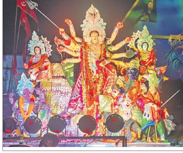
ଅନୁଗୋଳ ସୁଲୁସୁସିଂହା ମେଡ଼ ।