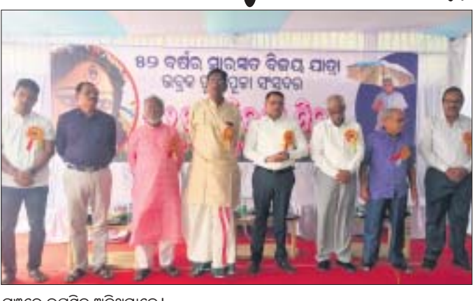
ମଞ୍ଚରେ ଉପସ୍ଥିତ ଅତିଥିମାନେ।