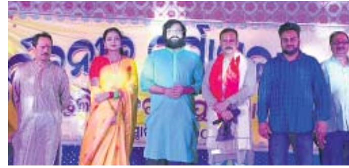
ମଞ୍ଚରେ ଓଲିଉଡ଼ ଷ୍ଟାର ଦମ୍ପତିଙ୍କ ସହ ଅନ୍ୟ ଅତିଥି ବୃନ୍ଦ।