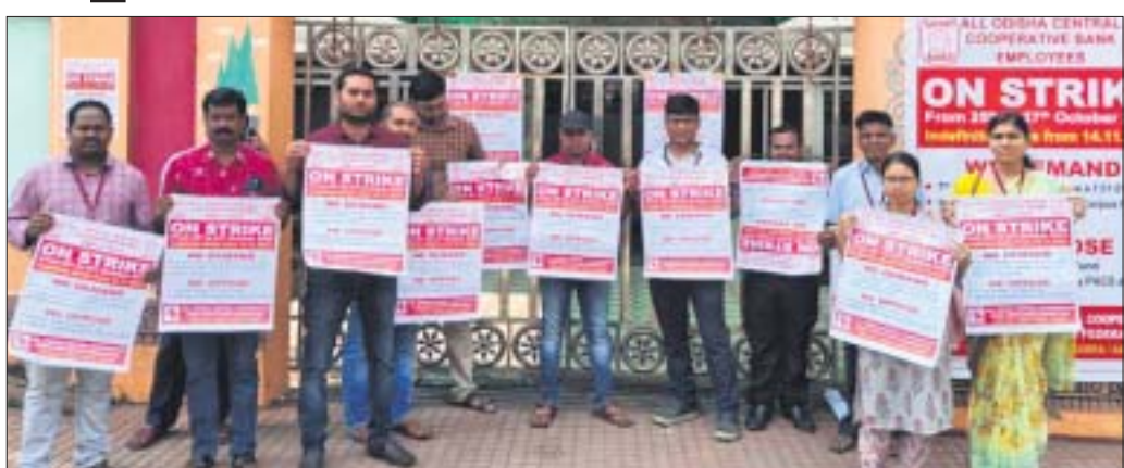
ଜିଲ୍ଲା କେନ୍ଦ୍ରୀୟ ସମବାୟ ବ୍ୟାଙ୍କ କର୍ମକର୍ତ୍ତା।

କେନ୍ଦ୍ର, ୨୫୧୦(ନରେଶ ଚନ୍ଦ୍ର ପଟ୍ଟନାୟକ/ବାସକ ମିଶ୍ର) ବେତନ କମିଶନ ପ୍ରକାରେ ୨୦୧୬ ରୁ ବେତନ ଦେବାକୁ ନିର୍ଦ୍ଦେଶନା ଥିଲେ ମଧ୍ୟ ତାହା କାର୍ଯ୍ୟକାରୀ ହୋଇନାହିଁ। ୨୦୧୪ ପରଠାରୁ ଯେଉଁମାନେ ବ୍ୟାଙ୍କରେ ଚାକିରି କରିଛନ୍ତି, ସେମାନେ ଅବସର ନେଇ କେନ୍ଦ୍ରରେ କେନ୍ଦ୍ର ସମବାୟ ବ୍ୟାଙ୍କ କର୍ମଚାରୀ ଆନ୍ଦୋଳନକୁ ଓହ୍ଲାଇଛନ୍ତି। ଦାବି ପୂରାବଦ୍ଧ, ବହୁ ଆଲୋଚନା ଓ ଧର୍ମତ୍ୟାଗ ପରେ କେନ୍ଦ୍ର ସମବାୟ କର୍ମଚାରୀ ସମୂହ