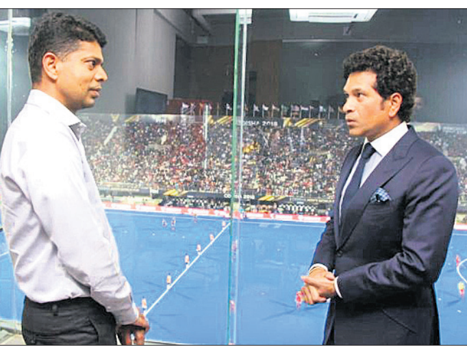
କଳିଙ୍ଗ କ୍ଷୁଦ୍ରିୟମଠାରେ ସର୍ତ୍ତନେତୃତ୍ୱ ସହ