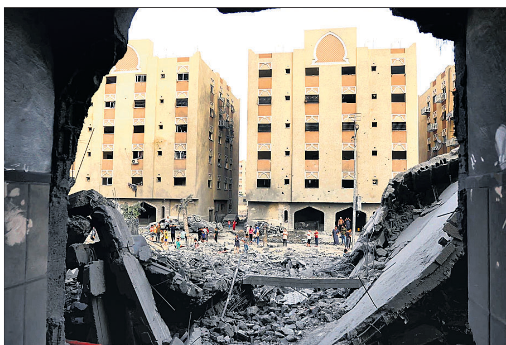
ଇସ୍ରାଏଲର ରକେଟ ମାଡ଼ରେ ବିଧ୍ୱସ୍ତ ଗାଜାର ଖାନ୍ ଯୁନିସ୍ ସହର।

ଆକାଶମାର୍ଗରୁ ଦୂରକୁ ଦୂରା ଉଡ଼େଇବା ପାଇଁ ଆକାଶରେ ଧୂଆଁ ଧାସ୍ତକ ପାଳିବାକୁ ଗାଜା ଶ୍ରେୟ। ଆହତକୁ ହସ୍ତିଚାଳରେ ଭର୍ତ୍ତି କରାଯାଇଛି। ନିରୁତ୍ତରଖାନାରେ ଲାଙ୍ଗେ ନାହିଁ କି ସେମାନଙ୍କ ଚିକିତ୍ସା ପାଇଁ ବ୍ୟାଞ୍ଚକ ମଧ୍ୟ ନାହିଁ। ଏକ ଛିଡ଼ିରେ ଗାଜାବାସୀ ନାହିଁ ନ ଥିବା ଦୂର୍ଦ୍ଦଶା ଭୋଗୁଛନ୍ତି। ଇସ୍ରାଏଲ ଯୋଗୁ ଗାଜା ପାଟିକୁ ଚିଲିପି ସାମଗ୍ରୀ ପହଞ୍ଚାଇବାରେ ଅସୁବିଧା ହେଉଛି ବୋଲି କାଟିସଂଘ ପକ୍ଷରୁ କୁହାଯାଇଛି। ସେପଟେ କାଟିସଂଘ ମହାସଚିବ ଆଣ୍ଟୋନିଓ ଗୁଟେରସ୍‌ଙ୍କ ଏକ ମନ୍ତବ୍ୟକୁ ଇସ୍ରାଏଲ କଡ଼ା ବିରୋଧ କରିଛି। ବୁକ୍‌ସ୍ ଡିପାର୍ଟମେଣ୍ଟରୁ କହିଥିଲେ, ହମାସ୍ ଖାଲିଗାରେ ଆକ୍ରମଣ କରୁନାହିଁ। ନିଜ ଭୃତ୍ୟରେ ବସବାସ ପାଇଁ ପାଲେଷ୍ଟିନୀୟମାନେ ଦୀର୍ଘ ୫୬ ବର୍ଷ ଧରି ସଂଘର୍ଷ କରୁଛନ୍ତି। ଏହାକୁ ନେଇ ଗୁଟେରସ୍ ତୁରନ୍ତ ନିଜ ପଦକୁ ଇସ୍ତଫା ଦିଅନ୍ତୁ ବୋଲି ଇସ୍ରାଏଲ ଦାବି କରିଛି। କେବଳ ଏତିକି ନୁହେଁ, କାଟିସଂଘ ଅଧିକାରୀମାନଙ୍କୁ ଜିନା ଦେବା ପାଇଁ ମଧ୍ୟ ଇସ୍ରାଏଲ ମନା କରିଦେଇଛି। ଲେବାନନ୍‌ର ସମସ୍ତ ଗୋଷ୍ଠୀ ହେଉଛନ୍ତି ବୋଲି ମୂଖ୍ୟ ପାଲେଷ୍ଟିନୀୟ ଆତଙ୍କବାଦୀ