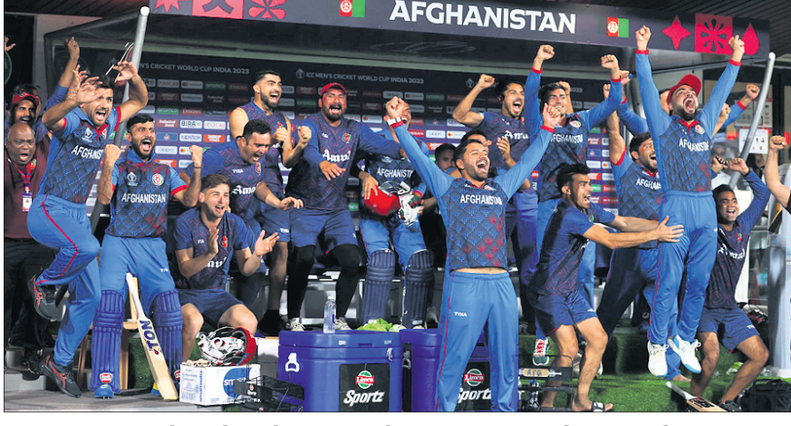
ପାକିସ୍ତାନ ବିପକ୍ଷ ବିଜୟ ପରେ ଖୁସିରେ ଆମ୍ବୁହରା ଆଫଗାନିସ୍ତାନ ଖେଳାଳି