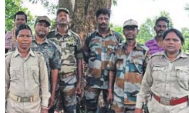
ନୀଳଗିରି, ୨୫।୧୦(ପ୍ରଶାନ୍ତ ବିଶ୍ୱାଳ) ବଣପାହାଡ଼ ଘର ୨୭.୨୫ ବର୍ଗ କି.ମି. ପରିସରକୁ କୁଲଡ଼ିହା ଅଭୟାରଣ୍ୟରେ ଶତାଧିକ ହାତୀ, ଭାଲୁ, ଗୟଳ, କୁଚାରୀ, ସମ୍ବର, ହରିଣ ଆଦି ବିଭିନ୍ନ ପ୍ରଜାତିର ବନ୍ୟଜନ୍ତୁ ବସବାସ କରନ୍ତି। ଏହି ଅଭୟାରଣ୍ୟ ସହ ମୟୂରଭଞ୍ଜ ଜିଲାର ଶିମିଳିପାଳ ଓ କେନ୍ଦୁଝର ଜିଲାର ହବନଡ଼ ରେଖିତ ପ୍ରସାର ମୂର୍ଦ୍ଧିଳ ଚତ୍ୱାବଧାନରେ ଉଚ୍ଚ ଅଭୟାରଣ୍ୟ ଭିତରେ ୧୪ଟି ଦିନରେ ୪୨ଜଣ ବନ କର୍ମଚାରୀଙ୍କ ଦ୍ୱାରା ଅଲଗା ଅଲଗା ଚିମ୍ କରି ଅଭୟାରଣ୍ୟରେ ବାଘ ଗଣନା ଓ ବାଘକ ଗତିବିଧି ଉପରେ ନଜର ରଖାଯାଇଛି। ଯଦି କେନ୍ଦୁଠାରେ ବାଘର ସମ୍ପାନ ମିଳେ ତା’ହେଲେ ସେହି ଅଞ୍ଚଳରେ ଗ୍ରାମ କ୍ୟାମେରା ବସିବ ବୋଲି କୁହାଯାଇଛି।