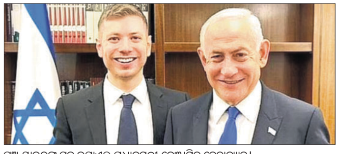
ପୁଅ ଯାଇଁ ସହ ଇସ୍ରାଏଲ ପ୍ରଧାନମନ୍ତ୍ରୀ ବେଞ୍ଜାମିନ୍ ନେତାମଣ୍ଡଳ।

ଇସ୍ରାଏଲ ପ୍ରଧାନମନ୍ତ୍ରୀ ବେଞ୍ଜାମିନ୍ ନେତାମଣ୍ଡଳଙ୍କୁ ଦୃଢ଼ ସମର୍ଥକ ତାଙ୍କ ପୁଅ ଯାଇଁ ଅନେକ ସମୟରେ ସୋସିଆଲ ମିଡ଼ିଆରେ ନିଜ ଇସ୍ରାଏଲ ବିରୋଧୀ ପୋଷ୍ଟ ପାଇଁ ବିବାଦୀୟ ହୋଇଆସିଛି। ଅକ୍ଟୋବର ୭ରେ ଗାଜାର ହମାସ୍ ଆତଙ୍କବାଦୀମାନେ ଇସ୍ରାଏଲକୁ ଚାର୍ଜେଜ୍ କରିବା ପରେ ପ୍ରାୟ ୪ ଲକ୍ଷ ଯୁବତୀମାନଙ୍କୁ ଦେଶରୁ ଏହି ଲକ୍ଷେଇକୁ ସମର୍ଥନ କରୁଛନ୍ତି। କିନ୍ତୁ ୩୨ ବର୍ଷୀୟ ଯାଇର୍ ଇସ୍ରାଏଲରେ ନ ଥିବାରୁ ଅନେକ ପ୍ରଶ୍ନ ଉଠାଇଛନ୍ତି। ଡିପୋର୍ଟ ଅନୁସାରେ ସେ