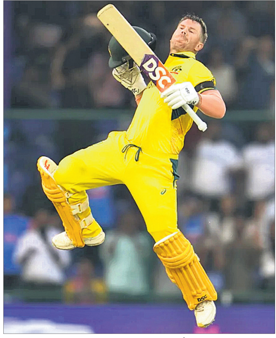
ଶତକ ହାସଲ ପରେ ଉଲ୍ଲସିତ ଟେଡିଭି ଡିନିସ୍