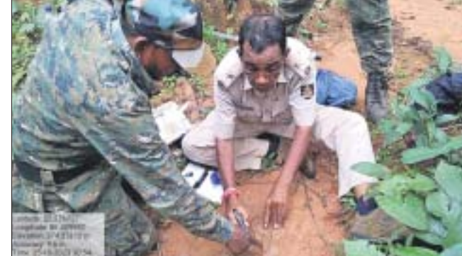
ବନ କର୍ମଚାରୀମାନେ ମହାବଳ ପାଦ ଚିହ୍ନଟ କରୁଛନ୍ତି।