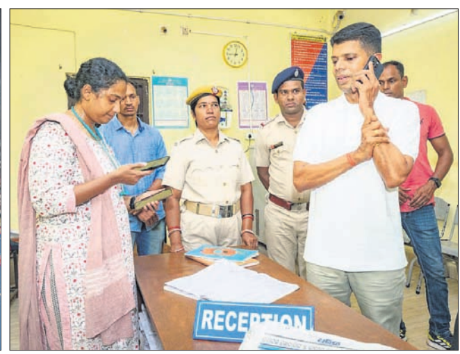
ଗଜପତି ଜିଲା ଗସ୍ତ ସମୟରେ ବିକଳପାତ ଗାଈରେ ପାରଳାଖେମୁଣ୍ଡି ଆମା ପରିବର୍ତ୍ତନ କରି ସମସ୍ୟା ଦୂରୀକୃତ