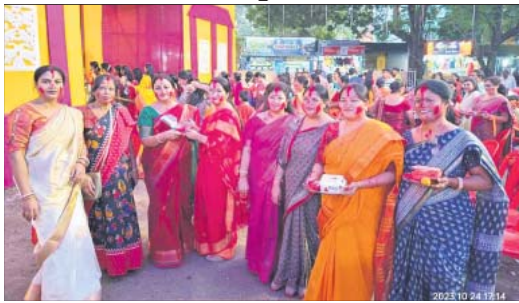
ମହିଳାମାନେ ସିନ୍ଦୂର ଖେଳ ଖେଳୁଛନ୍ତି।

୧୦ ବର୍ଷରେ ପଦାର୍ପଣ କରିଥିବା ଶହୀଦ ପଡ଼ିଆ ପୂଜା ମଞ୍ଚପରେ ସଂସ୍କୃତି ଓ ପରମ୍ପରାକୁ ନେଇ ମହିଳାଙ୍କ ଭିଡ଼ ପରିଲକ୍ଷିତ ହୋଇଥିଲା। ମହିଳାମାନେ ମା'ଙ୍କୁ ପାନ ପତ୍ରରେ ବରଣ କରିବା ସହ ସିନ୍ଦୂର ଲଗାଇବା ପରେ ସେହି ସିନ୍ଦୂରକୁ ପରସ୍ପର ମଧ୍ୟରେ ଲଗାଇଥିଲେ। ବିସର୍ଜନ ସମୟରେ ରାସ୍ତା ପାର୍ଶ୍ୱରେ ଥିବା ଶ୍ରଦ୍ଧାଳୁମାନଙ୍କୁ ଲଢ଼ୁ ବଖନ କରାଯାଇଥିଲା। ଏହି ପୂଜା ମଞ୍ଚପରେ ମୟୂରଭଞ୍ଜ ରାଜ ପରିବାର ପକ୍ଷରୁ ରାଜବାଟୀରେ ବାରିପଦାର ପ୍ରଥମେ ଦୁର୍ଗାପୂଜା ହୋଇଆସୁଥିଲା। ତତ୍କାଳୀନ ମହାରାଜାଙ୍କ ଆଦେଶ କ୍ରମେ ୧୯୩୪ରେ ଶହୀଦ ପଡ଼ିଆରେ ଦୁର୍ଗାପୂଜା