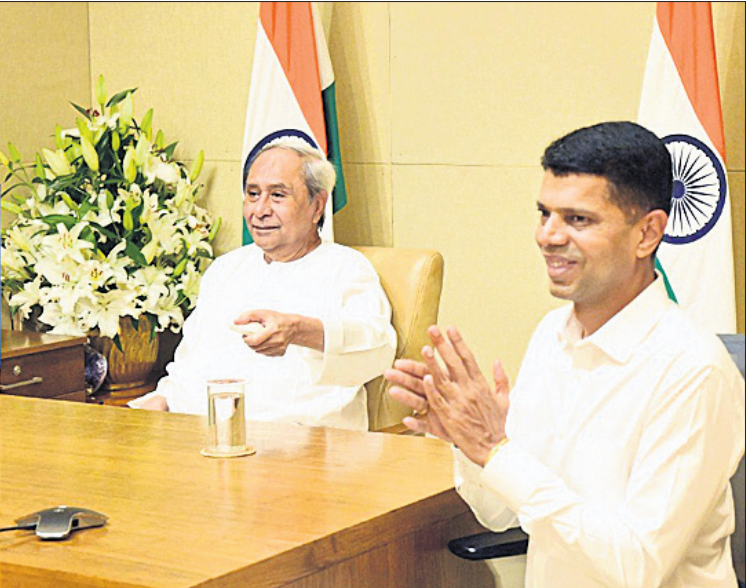
ପୁଣ୍ୟମନ୍ତ୍ରୀ ନବୀନ ପଟ୍ଟନାୟକଙ୍କ ଦ୍ୱାରା କଟକ ଜିଲାର ବିଭିନ୍ନ ପ୍ରକଳ୍ପ ଉଦ୍‌ଘାଟନ ଅବସରରେ ଉପସ୍ଥିତ ୫-ଟି ସର୍ତ୍ତ ଉପରେ ପାଠିଆନ