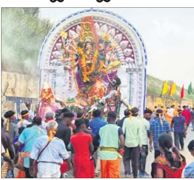
ମା'ଙ୍କୁ ପରୁଆରେ ନିଆଯାଇଛି।