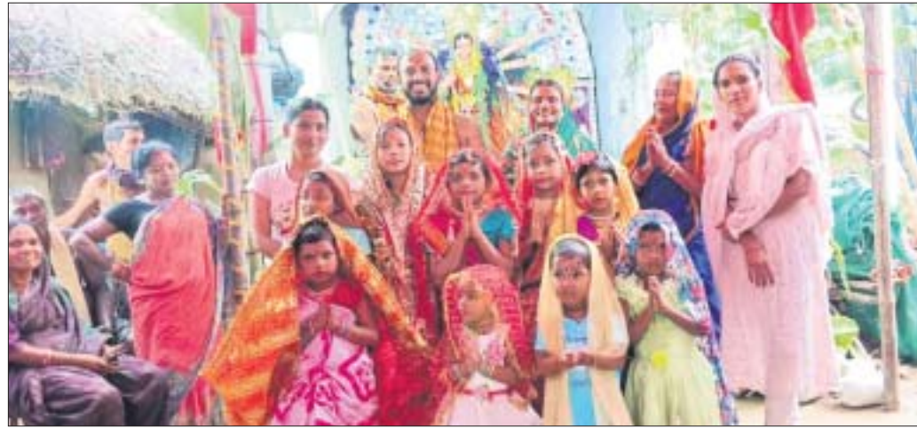
ରୁଦ୍ରପାଳ ଦୁର୍ଗାଙ୍କ ପାଠରେ ନବକୁମାରୀଙ୍କୁ ପୂଜା କରାଯାଇଛି।