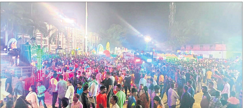
ଜଗତସିଂହପୁର ଜିଲ୍ଲାପାଳଙ୍କ ପଡ଼ିଆରେ ଅନୁଷ୍ଠିତ ଭସାଣି ମେଲାଣିରେ ଲୋକଙ୍କ ଭିଡ଼।