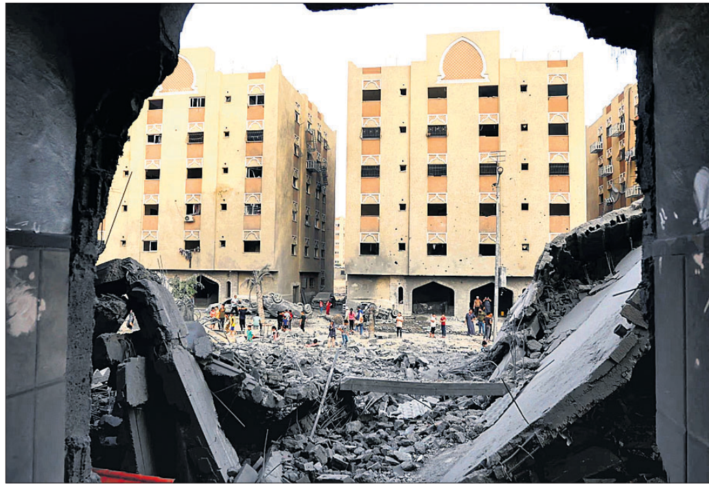
ଇସ୍ରାଏଲର ରକେଟ୍ ମାଡ଼ରେ ବିଧ୍ୱସ୍ତ ଗାଜାର ଖାନ୍ ସୁନିୟ୍ ସହର ।

ଆକାଶମାର୍ଗରୁ ଦୁହାକୁ ବୁଝା ରକେଟ୍ ମାଡ଼ି । ଆକ୍ରମଣରେ ଧ୍ୱଂସସ୍ତୁପ ପାଲଟିଗଲାଣି ଗାଜା ଖୁସ୍ । ଆହତକୁ ହସିଗଲରେ ଭର୍ତ୍ତି କରାଯାଇଛି । ନିରୁତ୍ତରଖାନାରେ ଲାଲ୍ ନାହିଁ କି ସେମାନଙ୍କ ଚକ୍ରାଧାର ପାଇଁ ବ୍ୟାଖ୍ୟାକ ମଧ୍ୟ ନାହିଁ । ଏଭଳି ସ୍ଥିତିରେ ଗାଜାବାସୀ ନାହିଁ ନ ଥିବା ଦୂର୍ଦ୍ଦଶା ଭୋଗୁଛନ୍ତି । ଇସ୍ରାଏଲ ଯୋଗୁ ଗାଜା ପାଡ଼ିତକୁ ରିଲିଫ୍ ସାମଗ୍ରୀ ପହଞ୍ଚାଇବାରେ ଅସୁବିଧା ହେଉଛି ବୋଲି ଇତିହାସ ପଞ୍ଚମକୁ କୁହାଯାଇଛି । ସେପଟେ ଇତିହାସ ମହାସତ୍ତା ଆହେନିଓ ଗୁପ୍ତରେଖ୍ ଏକ ମତ୍ରବ୍ୟକ୍ତ ଇସ୍ରାଏଲ କଡ଼ା ବିରୋଧ କରିଛି । ବୁଲ୍ ସିଡି ତଳେ ଗୁପ୍ତରେଖ୍ କହିଥିଲେ, ହମାସ୍ ଖାଲିଗାରେ ଆକ୍ରମଣ କରୁନାହିଁ । ନିଜ ଭୃତ୍ୟରେ ବସବାସ ପାଇଁ ପାଲେଷ୍ଟିନୀୟମାନେ ଦୀର୍ଘ ୫୭ ବର୍ଷ ଧରି ସଂଘର୍ଷ କରୁଛନ୍ତି । ଏହାକୁ ନେଇ ଗୁପ୍ତରେଖ୍ ତୁରନ୍ତ ନିଜ ପଦକୁ ଇସ୍ତଫା ଦିଅନ୍ତୁ ବୋଲି ଇସ୍ରାଏଲ ଦାବି କରିଛି । କେବଳ ଏତିକି ନୁହେଁ, ଇତିହାସ ଅଧିକାରୀମାନଙ୍କୁ ଭିକା ଦେବା ପାଇଁ ମଧ୍ୟ ଇସ୍ରାଏଲ ମନା କରିଦେଇଛି । ଲେବାନନ୍ ଦରାସ୍ ସମସ୍ତ ଗୋଷ୍ଠୀ ହେଉଛନ୍ତି ବୋଲି ପୂର୍ଣ୍ଣ ପାଲେଷ୍ଟିନୀୟ ଆତଙ୍କବାଦୀ