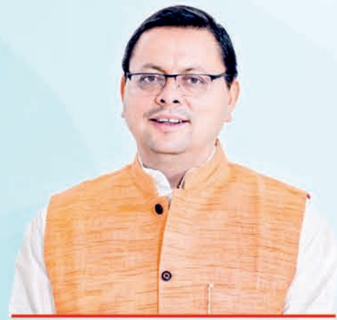
Pushkar Singh Dhami Chief Minister, Uttarakhand