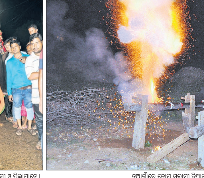
ମା'ଙ୍କ ଶୋଭାଯାତ୍ରାରେ ସାମିଲ ଗ୍ରାମବାସୀ ଓ ପିଲାମାନେ ।