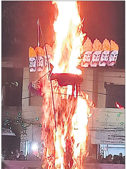
ଜଗତସିଂହପୁର ଜିଲ୍ଲାପାଳଙ୍କ ପଡ଼ିଆରେ ରାବଣଯୋଡ଼ି।