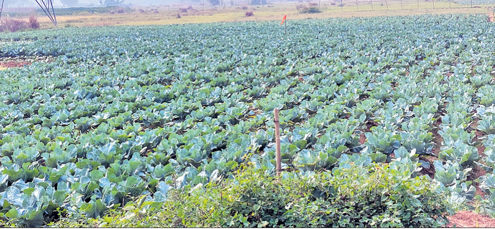
ଅମଳ କରିବାକୁ ଗଣ୍ୟ ଲକ୍ଷ୍ୟ ରଖୁଥାନ୍ତି।

ରସୁଲପୁର ରୁକ୍ ଅଞ୍ଚଳ ଏକ କୃଷି ପ୍ରଧାନ ରୁକ୍ ଭାବେ ପରିଚିତ। ପରିବା ଗଣ ପାଇଁ ରାଜ୍ୟରେ ଏହି ଅଞ୍ଚଳର ସ୍ୱତନ୍ତ୍ର ପରିଚୟ ରହିଛି। ବାରବାଟୀ ଅଞ୍ଚଳରୁ ଉତ୍ପାଦିତ କୋଭି ବ୍ୟବସାୟ ଉଦ୍ଦେଶ୍ୟରେ ରାଜ୍ୟର ବିଭିନ୍ନ ପ୍ରାନ୍ତକୁ ପରିବହନ ହୋଇଥାଏ। ସେହି ଅନୁଯାୟୀ ଗଣ୍ୟ ରବି ରଠୁରେ କୋଭି ଫସଲ ଆରୁଖା ଗଣ୍ୟ କରିଥାନ୍ତି। ଏଥର କିନ୍ତୁ କୋଭି ଗଣ୍ୟକୁ ନିରାଶ କରିଛି ଉଷ୍ଣ ଜଳବାୟୁ। ଚଳିତ ଋତୁର ଜଳବାୟୁ କୋଭି ପାଇଁ ଅନୁକୂଳ ନୁହେଁ ବୋଲି ଗଣ୍ୟ ମତ ରଖିଛନ୍ତି। କୋଭି ଗଣ୍ୟ ପାଇଁ ବାୟୁମଣ୍ଡଳରେ ଦିନର ତାପମାତ୍ରା ୩୦ ଡିଗ୍ରୀରୁ କମ୍ ରହିବା ଉଚିତ। ଏଥର କିନ୍ତୁ ଛିତି ଭିନ୍ନ ରହିଛି। ବାୟୁମଣ୍ଡଳର ତାପମାତ୍ରା ଏବେ ୩୫ଡିଗ୍ରୀ ଉପରେ। ଏଭଳି ଛିତିରେ କୋଭି ଗଣ୍ୟ ବଢ଼ି ପାରୁନାହିଁ। ରାତିରେ ଆଶାମୁଖ୍ୟ କାନ୍ଦ ଓ ଅଣ୍ଡା ଅନୁଭୂତ ହେଉ ନ ଥିବାରୁ କୋଭି ଫସଲ ଠିକ୍ରେ ପ୍ରସ୍ତୁତ ହୋଇପାରିବା ସମ୍ଭାବନା କମିଯାଇଛି। କୋଭି ଚାରା ଲାଗାଇବାର ୨ ମାସ ମଧ୍ୟରେ କୋଭି