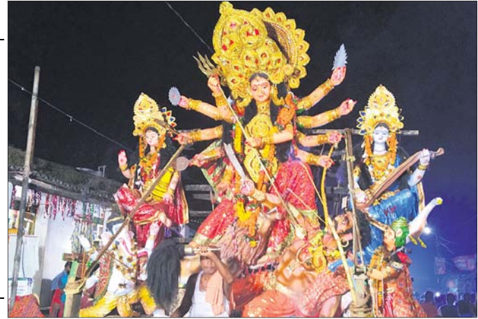
ଗରବପୁର ବୁକ ପାଠକୂଳରେ ଦୁର୍ଗାଙ୍କୁ ଭସାଣି ପାଇଁ ନିଆଯାଇଛି।