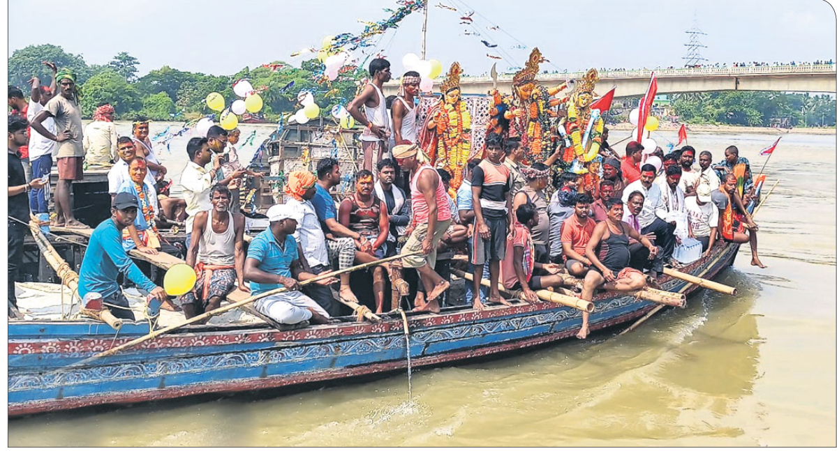
ମା'ଦୁର୍ଗାଙ୍କୁ ହଂସୁଆ ନଦୀରେ ନୌକାରେ ନିଆଯାଇ ୬ଘେରା ଚାପ ଖେଳାଇବା ପରେ ବିସର୍ଜନ କରାଯାଇଛି।