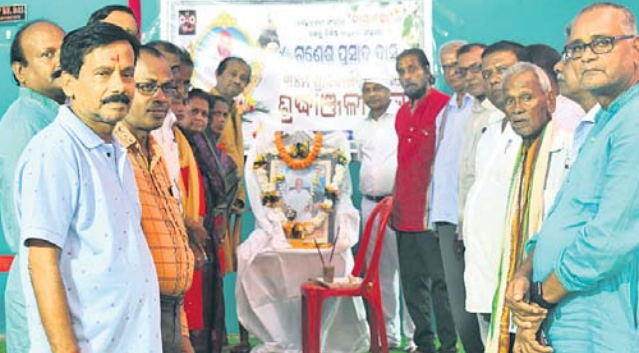
ସ୍ୱାଧୀନତା ସଂଗ୍ରାମୀ ଗଣେଶ ପ୍ରସାଦ ଦାସଙ୍କ ଶ୍ରାଦ୍ଧ ବାର୍ଷିକୀରେ ଅତିଥି ଶ୍ରଦ୍ଧାଞ୍ଜଳି ଦେଉଛନ୍ତି।