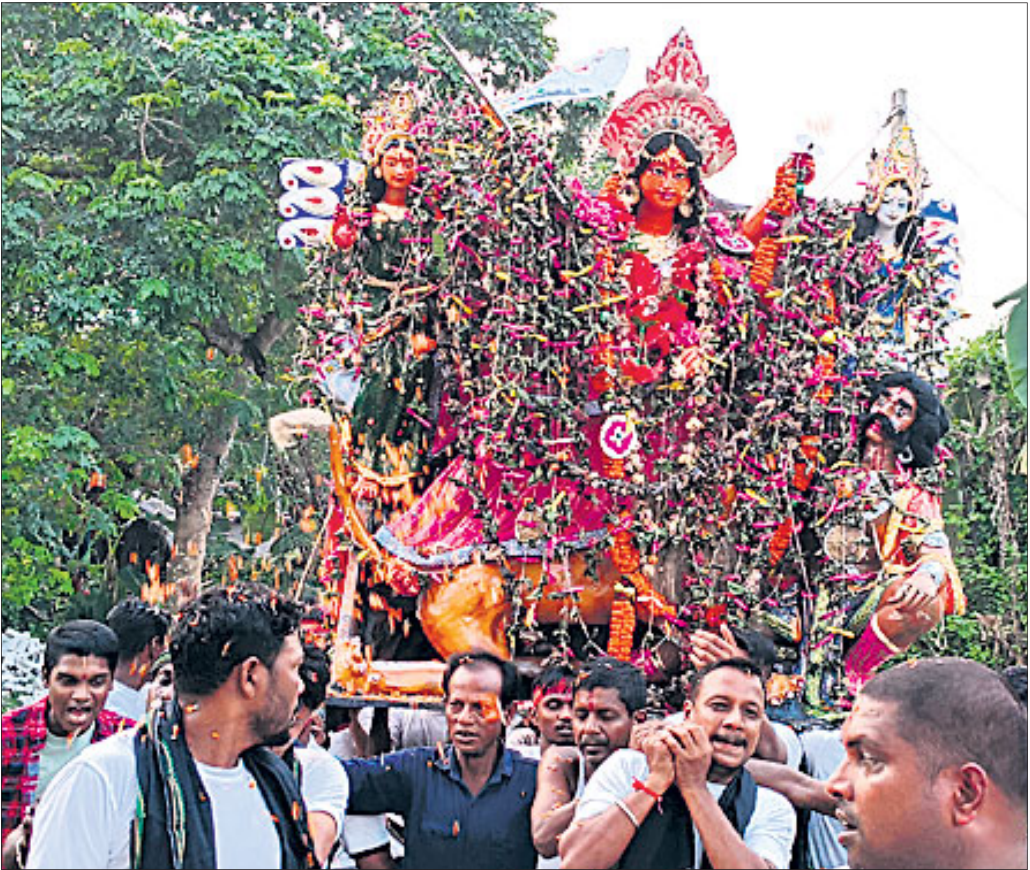
ଧର୍ମଶାଳା ବୁକ ବଡ଼କାଏନା ପଞ୍ଚାୟତ ଶେରପୁର ଗ୍ରାମର ମା'ଦୁର୍ଗାଙ୍କୁ ବିସର୍ଜନ ପାଇଁ ଶୋଭାଯାତ୍ରାରେ ନିଆଯାଇଛି।