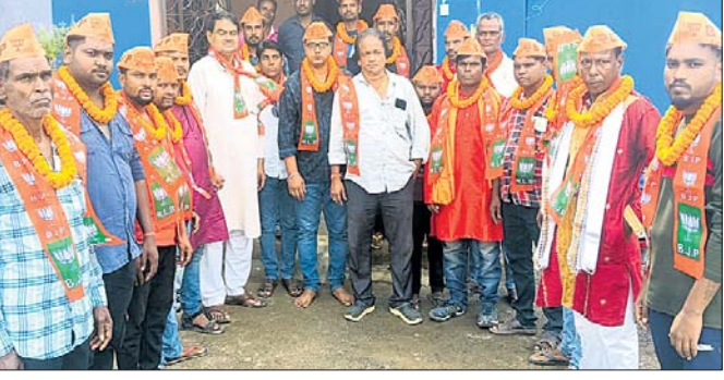
ଭାଜପାରେ ସାମିଲ ହୋଇଥିବା କର୍ମୀମାନେ।