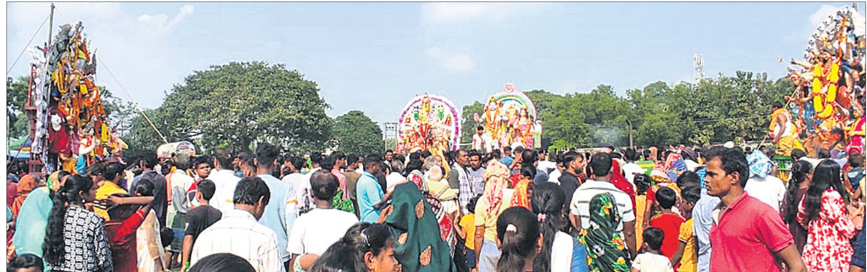
ଯାଜପୁର ବୁକ ଅଧୀନ ମହେଶ୍ୱରପୁର ପଞ୍ଚାୟତର କବିରପୁର ବଣହରା ପଡ଼ିଆରେ ଭସାଣି ଶୋଭାଯାତ୍ରାରେ ସାମିଲ ହୋଇଥିବା ବିଭିନ୍ନ ମଣ୍ଡପର ମେଡ଼।

ସେଲ୍ଫି କର୍ମର ଧରିତ୍ରୀ ଆମକୁ ପଠାନ୍ତୁ ଆପଣଙ୍କ ସେଲ୍ଫି metroselffie@gmail.com