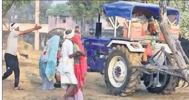
ଯାଇଥିଲେ । ପରେ ଅତରଳ ପରିବାର ସେଠାରେ ଦୁଇ ପରିବାର ମଧ୍ୟରେ ଲୋକେ ସେଠାରେ ପହଞ୍ଚିଥିଲେ । ସେଠାରେ ସଂଘର୍ଷ ହୋଇଥିଲା । ସେମାନେ

ଜମି ବିବାଦକୁ କେନ୍ଦ୍ର କରି ଜଣେ ବ୍ୟକ୍ତି ନିଜ ଭାଇଙ୍କ ଉପରେ ୮ ଥର ଟ୍ରାକ୍ଟର ଚଢ଼ାଇ ହତ୍ୟା କରିଛନ୍ତି । ଭାଇଙ୍କୁ ନିର୍ବାସନ କରିବା ପାଇଁ ଉଚ୍ଚ ନିର୍ଦ୍ଦେଶ ଦେଇଛନ୍ତି । ଭାଇଙ୍କୁ ନିର୍ବାସନ କରିବା ପାଇଁ ଉଚ୍ଚ ନିର୍ଦ୍ଦେଶ ଦେଇଛନ୍ତି । ଭାଇଙ୍କୁ ନିର୍ବାସନ କରିବା ପାଇଁ ଉଚ୍ଚ ନିର୍ଦ୍ଦେଶ ଦେଇଛନ୍ତି ।