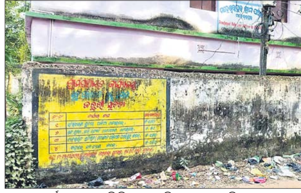
ପଞ୍ଚାୟତ କାର୍ଯ୍ୟାଳୟ ପାଟେରି ନିକଟରେ ଅଳିଆ ଗଦା ହୋଇଛି।

ରସୁଲପୁର ରୁକ୍ ମହେଶ୍ୱରପୁର ପଞ୍ଚାୟତରେ ନାନା ସମସ୍ୟା ଲାଗି ରହିଛି। ୧୩ ଖାର୍ତ୍ତର ୫ ହଜାରରୁ ଊର୍ଦ୍ଧ୍ୱ ଜନସାଧାରଣଙ୍କୁ ନେଇ ଗଠିତ ଏହି ପଞ୍ଚାୟତ କାର୍ଯ୍ୟାଳୟଟି ୪ ନମ୍ବର ଖାର୍ତ୍ତର ନବରସା ମସଜିଦ ନିକଟରେ ଅବସ୍ଥିତ। ପଞ୍ଚାୟତ କାର୍ଯ୍ୟାଳୟଟି ଏବେ ଭୂତକୋଠି ପାଲଟିଛି। ବର୍ଷବର୍ଷ ଧରି ଏହାକୁ ସଫା କରାଯାଇ ନ ଥିବାରୁ ବର୍ଷାହେଲେ ଅଞ୍ଚଳଟି ଦୁର୍ଗନ୍ଧରେ ପାଟି ପଡ଼ୁଛି। ଏନେଇ ଗ୍ରାମବାସୀ ସରପଞ୍ଚଙ୍କୁ ବାରମ୍ବାର କହିବା ପରେ ବି ଏହାକୁ ସଫା କରାଯାଇ ନ ଥିବା ଅଭିଯୋଗ ହୋଇଛି। ସେହିପରି ସରକାର ବିଦ୍ୟୁତ ଚଳା ଖର୍ଚ୍ଚକରି ଗାଁରେ ୨ଟି ଲେଖାଏ ଅଳିଆ ବୁହା ଗାଡ଼ି ଯୋଗାଇ ଦେଇଛନ୍ତି। ହେଲେ ଏଠି ଅଳିଆ ବୁହା ଗାଡ଼ି ବ୍ୟବହାର ନ ହୋଇ ପଞ୍ଚାୟତ ଅଫିସ ପରିସରରେ ପଡ଼ିରହିଛି। ପଞ୍ଚାୟତ ଅଫିସ ପରିସରରେ ଷ୍ଟ୍ରିଟ ଲାଇଟ୍ ଅଛି, ହେଲେ ଜଳୁନାହିଁ। ପଞ୍ଚାୟତ ଘର ଅଳସୁରେ ପରିଚ୍ଛନ୍ନ। ଅଫିସ ସମ୍ମୁଖରେ