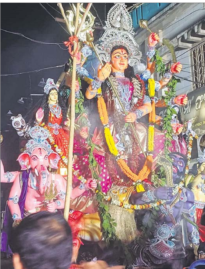
ଯାଜପୁର ସହରର ବଡ଼ବନ୍ଦାର ମେଡ଼କୁ ବିଚରଣା ନଦୀର ଦେବୀଗଡ଼ା ଘାଟକୁ ନିଆଯାଇଛି।

ସେଲ୍ଫି ପଠାଇବା ସମୟରେ ନିଜର ନାମ ଏବଂ ମୋବାଇଲ ନମ୍ବର ଦେବାକୁ ଭୁଲିବୁ ନାହିଁ। ଯୋଗ୍ୟବିବେଚିତ ଫଟୋ ପ୍ରକାଶ ପାଇବ।