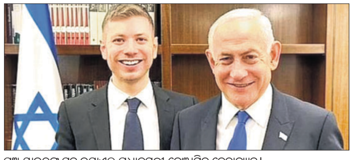
ପୁଅ ଯାଭିରଙ୍କ ସହ ଇସ୍ରାଏଲ ପ୍ରଧାନମନ୍ତ୍ରୀ ବେଞ୍ଜାମିନ୍ ନେତାମ୍ୟାହୁ ।

ଇସ୍ରାଏଲ ପ୍ରଧାନମନ୍ତ୍ରୀ ବେଞ୍ଜାମିନ୍ ନେତାମ୍ୟାହୁଙ୍କ ଦୁର୍ଭିକ୍ଷ ଉପରେ ଟ୍ରାକ୍ଟର ଚଢ଼ାଇ ହତ୍ୟା କରିବା ପରେ ପ୍ରାୟ ୪ ଲକ୍ଷ ଯୁବାଧିକାରୀଙ୍କୁ ଦେଶରୁ ବାହାର କରିବା ପାଇଁ ଇସ୍ରାଏଲ ସରକାର ଏହି ନିଷ୍ପତ୍ତି ନେଇଛନ୍ତି ।