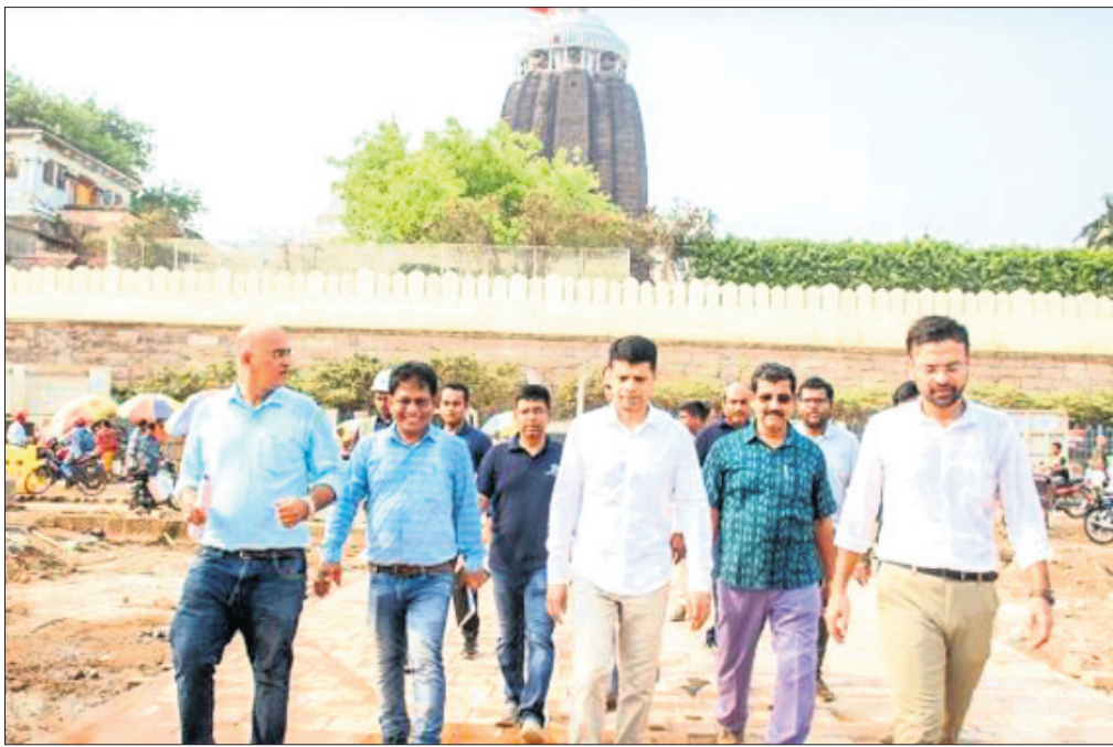
ଶ୍ରୀମନ୍ଦିର ପରିକ୍ରମା ପ୍ରକଳ୍ପକୁ ବୁଲି ଦେଖୁଛନ୍ତି ଭି.କେ. ପାଣ୍ଡିଆନ