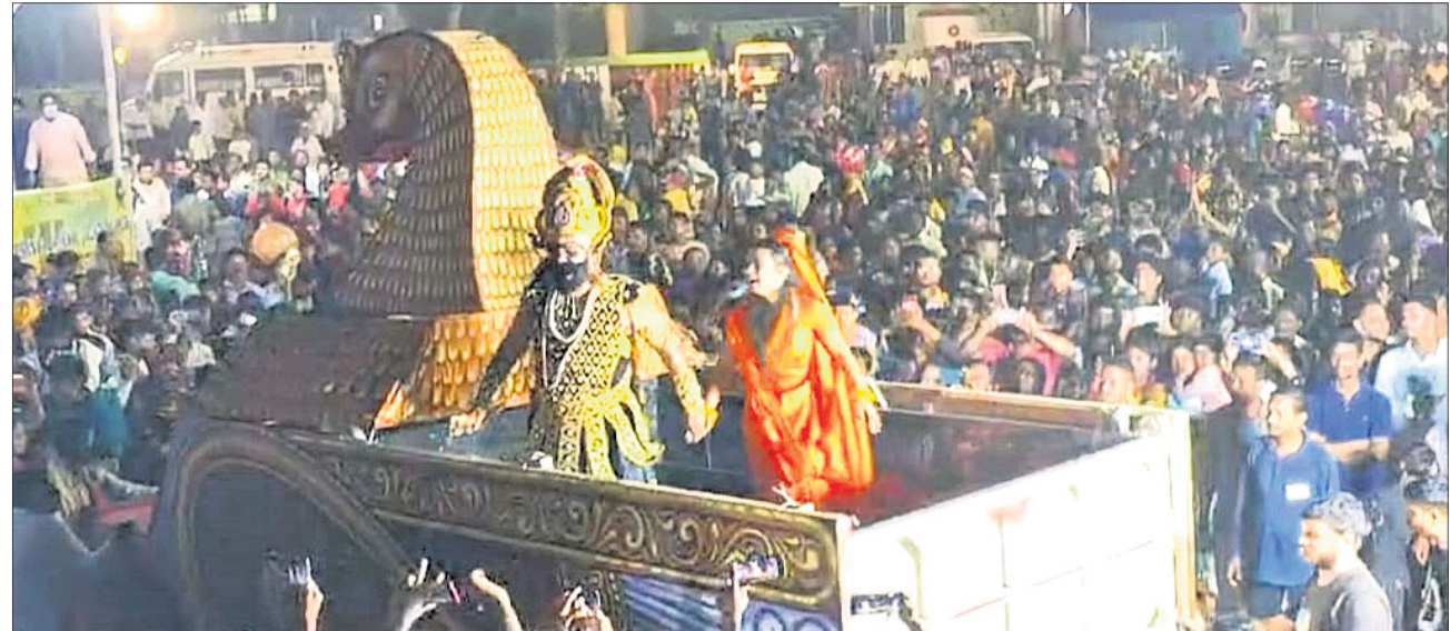
ମଙ୍ଗଳବାର ଶ୍ରୀରାମ କୁଳ୍ ପକ୍ଷରୁ ଅନୁଷ୍ଠିତ 'ରାବଣଙ୍କ ସାଗା ହରଣ' ଦୃଶ୍ୟ।