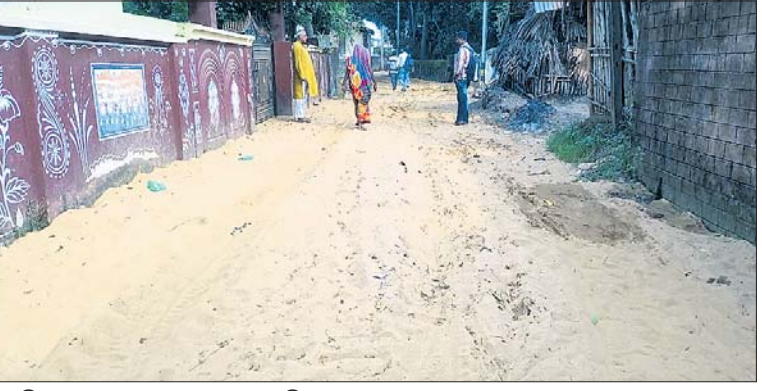
ବାଲି ପକାଯାଇ ରାସ୍ତା ଉଚ୍ଚା କରାଯାଇଛି।