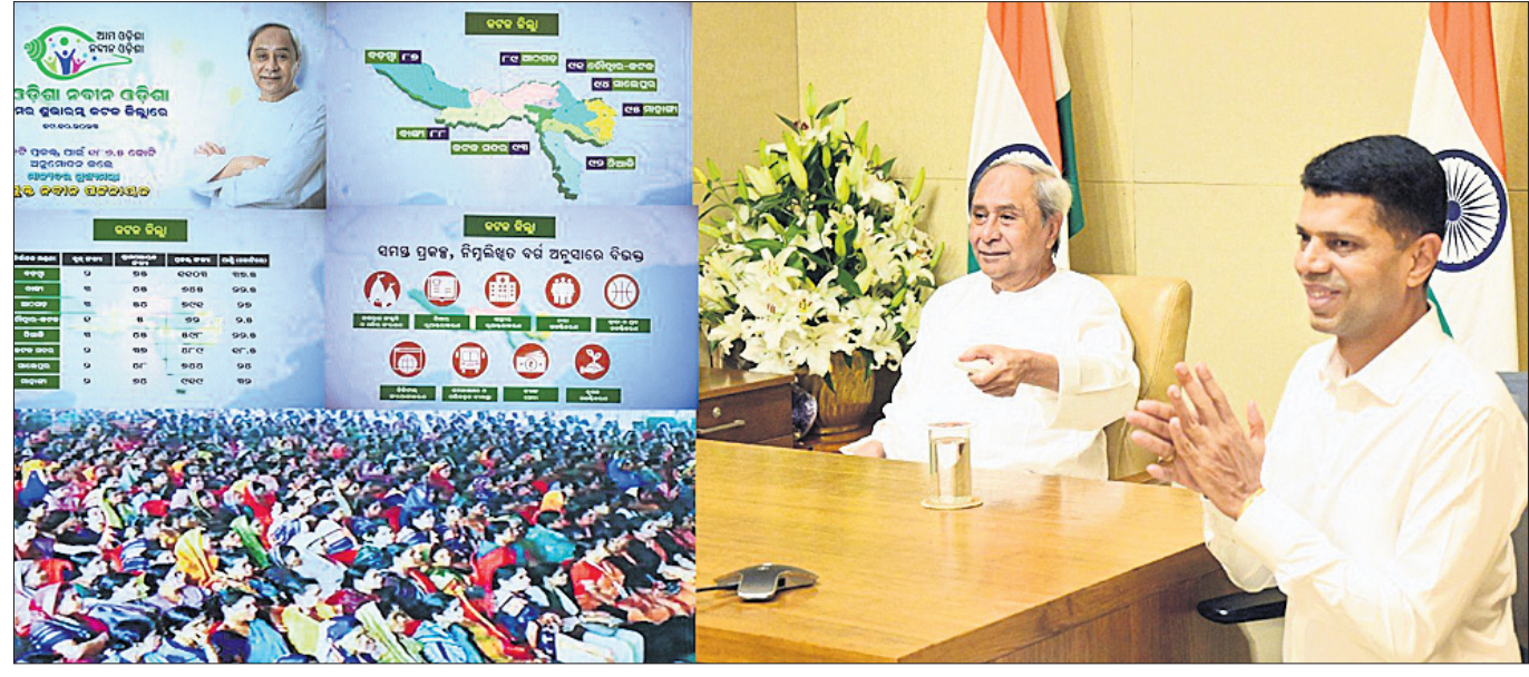
ମୁଖ୍ୟମନ୍ତ୍ରୀ ନବୀନ ପଟ୍ଟନାୟକଙ୍କ ଦ୍ୱାରା କଟକ ଜିଲାର ବିଭିନ୍ନ ପ୍ରକଳ୍ପ ଉଦ୍‌ଘାଟନ ଅବସରରେ ଉପସ୍ଥିତ ୫-ଟି ସର୍ତ୍ତ ଭି.କେ. ପାଣ୍ଡିଆନ

ଜିଲାପାଳ ଭାବେ ଯୋଗ ଦେଇଥିଲେ। ଜିଲାପାଳ ଥିବାବେଳେ ସଫଳତାର ସହ ଜାତୀୟ ଗ୍ରାମାଣ ନିକ୍ଷିତ କର୍ମନିଯୁକ୍ତି ଯୋ.ଜ.ନ।(ଏ.ଏ.ଆ.ଇ.ଏ.ସ୍) କାର୍ଯ୍ୟକାରୀ କରିବା ଯୋଗୁ ଗଞ୍ଜାମ ଜିଲାକୁ ଜାତୀୟ ପୁରସ୍କାର ମିଳିପାରିଥିଲା। ଏହୁସହିତ ଶ୍ରମିକମାନଙ୍କୁ ସେମାନଙ୍କର ପ୍ରାପ୍ୟ ବ୍ୟାଙ୍କ ଆକାରଣ କରିଥିଲେ। ପ୍ରଦାନ କରିବା ପାଇଁ ଏକ ଅଭିନବ ପଦକ୍ଷେପ ଆରମ୍ଭ କରିଥିଲେ। ଏହାକୁ ସମଗ୍ର ରାଜ୍ୟ ଓ ଦେଶରେ ଗ୍ରହଣ କରାଯାଇଛି। ହଜାର ହଜାର ଶ୍ରମିକମାନଙ୍କର ବ୍ୟାଙ୍କ ଆକାରଣକୁ ଆଇଏଏସ୍ ଅଫିସର ଭାବେ ନିଯୁକ୍ତ ହେବା ପରେ ରାଜ୍ୟର ବିକାଶ ପାଇଁ ସେ ନିଜକୁ ଉତ୍ସର୍ଗ କରି ଆସିଛନ୍ତି। ୨୦୦୨ରେ ସେ ଧର୍ମଗଡ଼ ଉପଜିଲାପାଳ ଭାବେ ଯୋଗଦେଇ ରାଜ୍ୟର ରାଜସ୍ୱ ବୃଦ୍ଧି କରି ନିଜ କାର୍ଯ୍ୟକ୍ଷେତ୍ରରେ ପରିଚୟ ଦେଇଛନ୍ତି। ଏହାପାଇଁ ମୁଖ୍ୟମନ୍ତ୍ରୀ ତାଙ୍କୁ ପ୍ରଶଂସା କରିବା ସହ ସମର୍ଥନ କରିଥିଲେ। ଦେଶର ସର୍ବକନିଷ୍ଠ ଜିଲାପାଳ ଭାବେ ୨୦୦୫ରେ ସେ ରାଜ୍ୟର ବୃହତ୍ ଜିଲା ମୟୂରଭଞ୍ଜର ଦାୟିତ୍ୱ ଗ୍ରହଣ କରିଥିଲେ। ତାଙ୍କର ଦୂରମ ଅଞ୍ଚଳକୁ ନିରନ୍ତର ଗସ୍ତ ଜିଲାର ବିକାଶକୁ ଦ୍ରବୀକୃତ କରିଛି। ଭିକ୍ଷାମୁକ୍ତି ଯୋଜନା ଅଧୀନରେ କ୍ଷେତ୍ରରେ ମୟୂରଭଞ୍ଜ ଜିଲା କାତାୟ ପୁରସ୍କାର ପାଇଥିଲା। ପରବର୍ତ୍ତୀ ସମୟରେ ଏହାକୁ ରାଜ୍ୟର ନୀତି ଭାବେ ଗ୍ରହଣ କରାଯାଇଛି। ଏହୁପାଇଁ ପାଣ୍ଡିଆନ ସମ୍ମାନଜନକ 'ହେଲେନ କୋଲର' ପୁରସ୍କାରରେ ସମ୍ମାନିତ ହୋଇଥିଲେ। ଜିଲାପାଳ ଥିବାବେଳେ ସଫଳତାର ସହ ଜାତୀୟ ଗ୍ରାମାଣ ନିକ୍ଷିତ କର୍ମନିଯୁକ୍ତି ଯୋଜନା (ଏନ୍.ଆର.ଇ.ଏସ୍) କାର୍ଯ୍ୟକାରୀ କରିବା ଯୋଗୁ ଗଞ୍ଜାମ ଜିଲାକୁ ଜାତୀୟ ପୁରସ୍କାର ମିଳିପାରିଥିଲା। ପରେ ସେ ୨୦୦୭ରେ ଗଞ୍ଜାମ