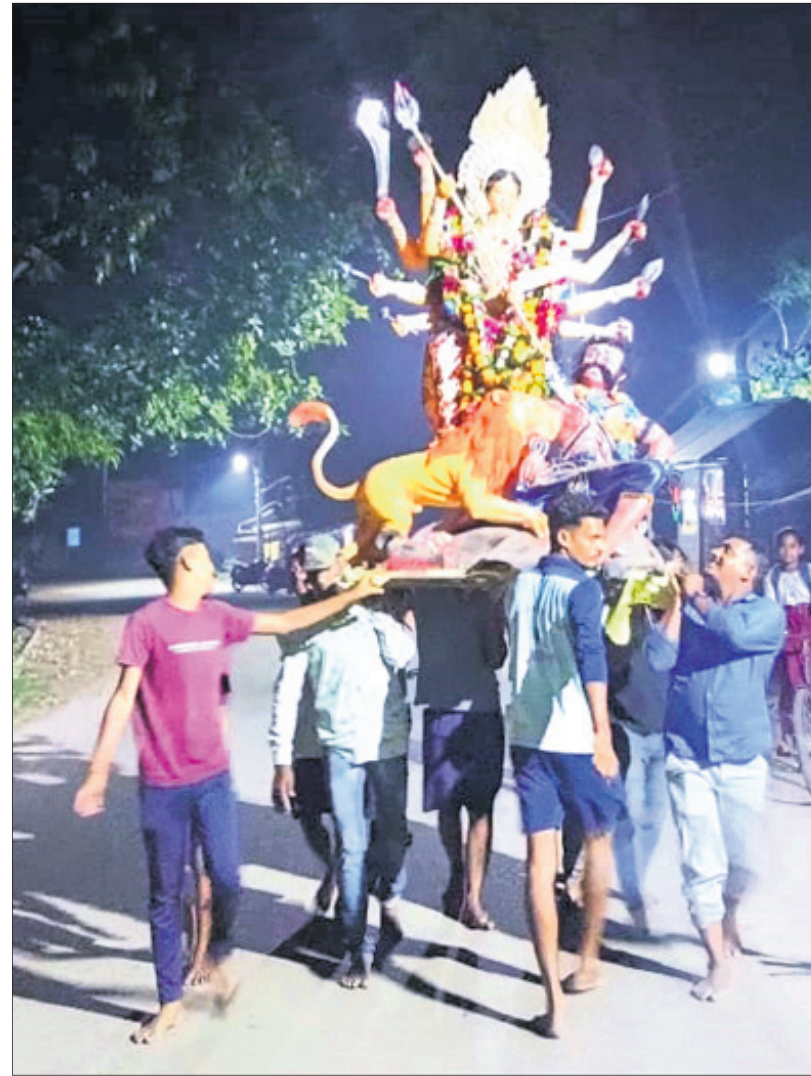
ନୟାଗଡ଼ରେ ଭସାଣି ଶୋଭାଯାତ୍ରାରେ ସାମିଲ ଦକ୍ଷିଣକାଳୀ ମନ୍ଦିର ସମ୍ମୁଖ ହରଗୌରୀ ମେଡ଼ ।