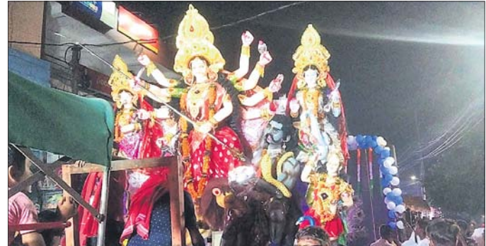
ପଟ୍ଟାପୁଣ୍ଡାଲ ବୁକ କଟେରି ଦୁର୍ଗାଙ୍କୁ ଭସାଣି ଶୋଭାଯାତ୍ରାରେ ଯାଉଛନ୍ତି।