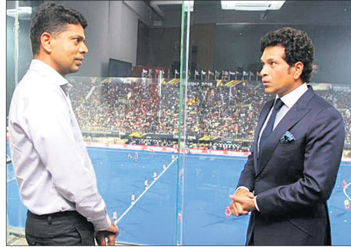
କଳିଙ୍ଗ କ୍ଷୁଦ୍ରିୟମଠାରେ ସଚିନ ଚେନ୍ଦ୍ରିକରଙ୍କ ସହ