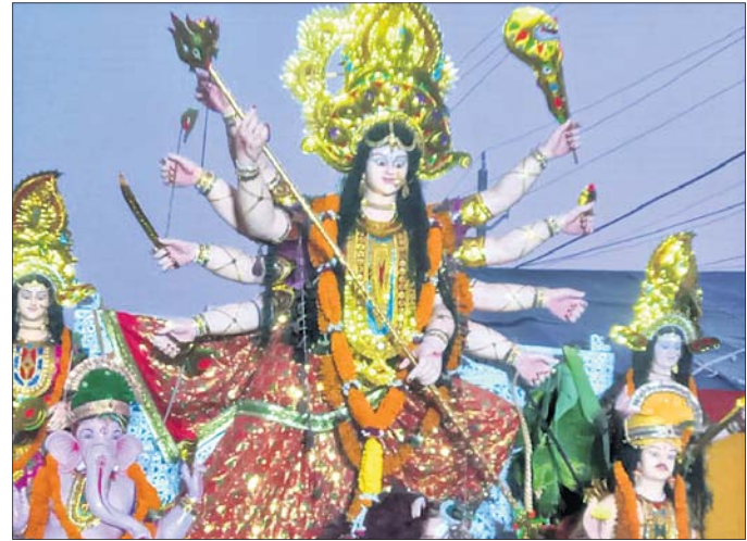
ଶୋଭାଯାତ୍ରାରେ ଭାରତୀୟ ଧର୍ମଶାଳା ମହୋତ୍ସବ ପୂଜା କର୍ମଚିର ମେଡ଼।