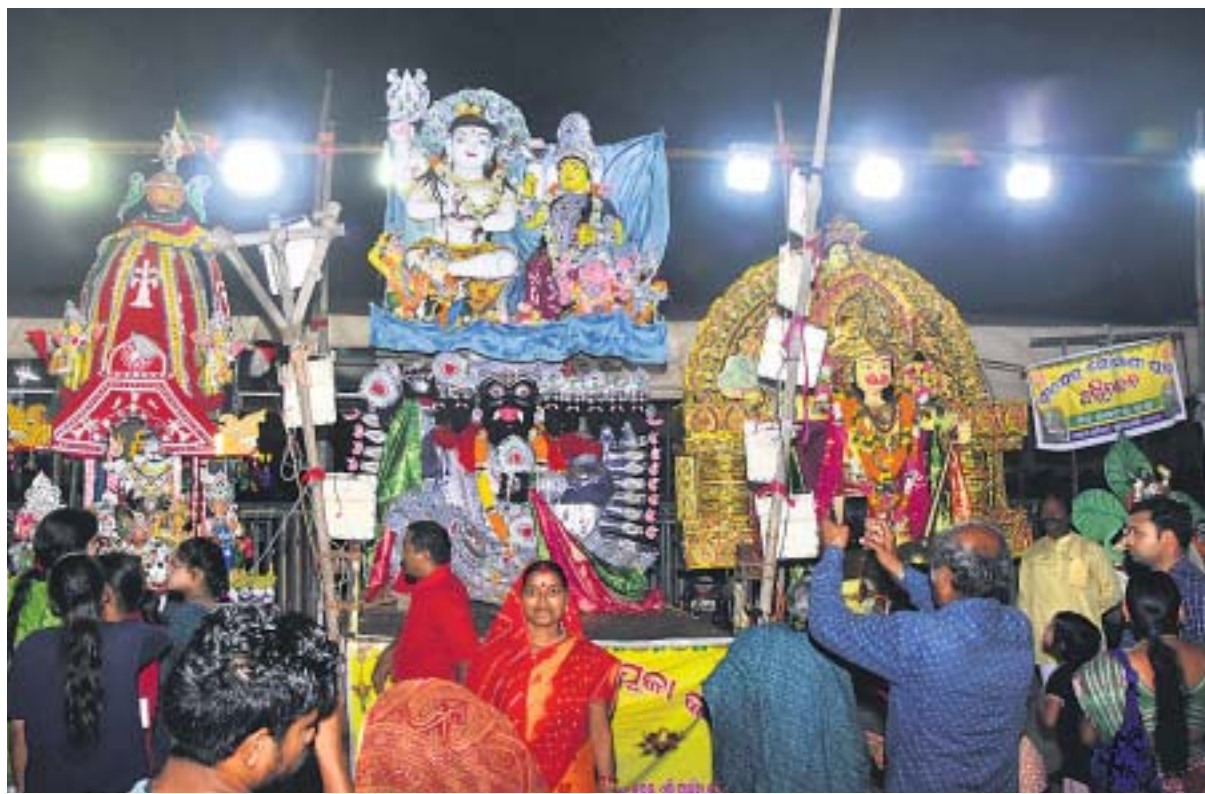
ଭବାଣି ଅବସରରେ ଦେବୀମାନଙ୍କୁ ସିଂହଦ୍ୱାର ସମ୍ମୁଖ ଦେବସଭାକୁ ନିଆଯାଇଛି ।