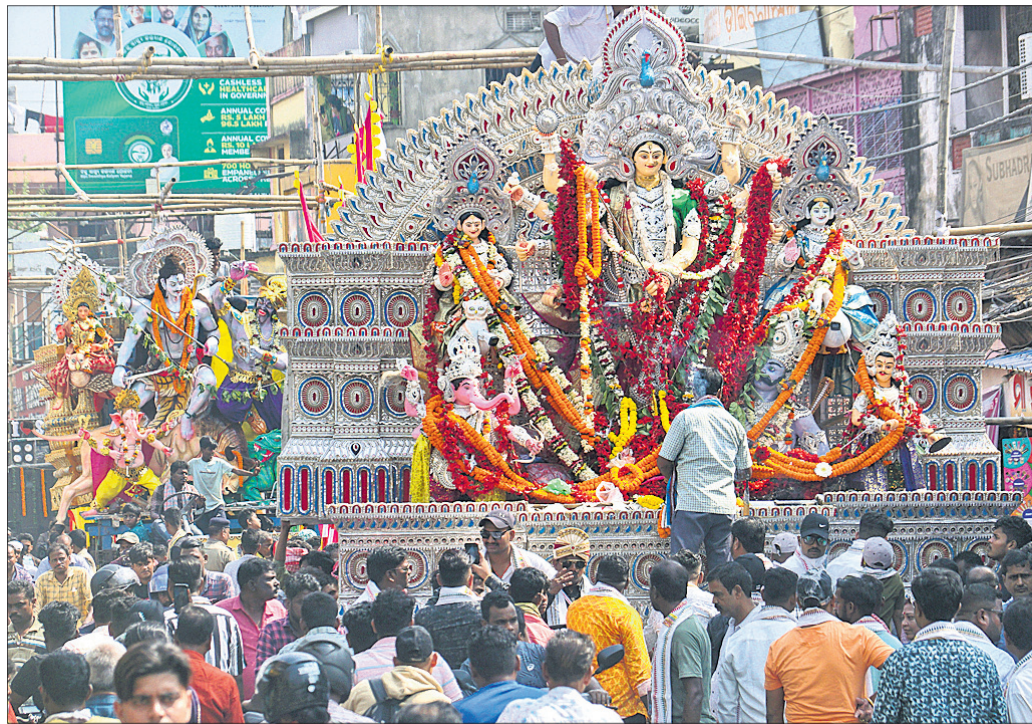
ବିସର୍ଜନ ପାଇଁ ପୁଣ୍ୟମ୍ଭୂମି ଶୋଭାଯାତ୍ରାରେ ନିଆଯାଇଛି ।