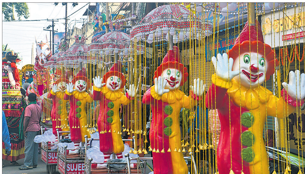
ଭବାଣି ଶୋଭାଯାତ୍ରାରେ ଭଲେକ୍ଟୁ ସାଙ୍କସଜା ।