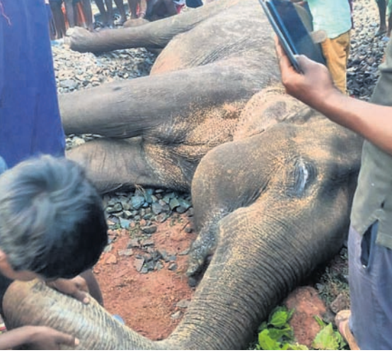
ତ୍ରେନ୍ ଧକ୍କାରେ ମୃତ ମାଇହାତୀ।