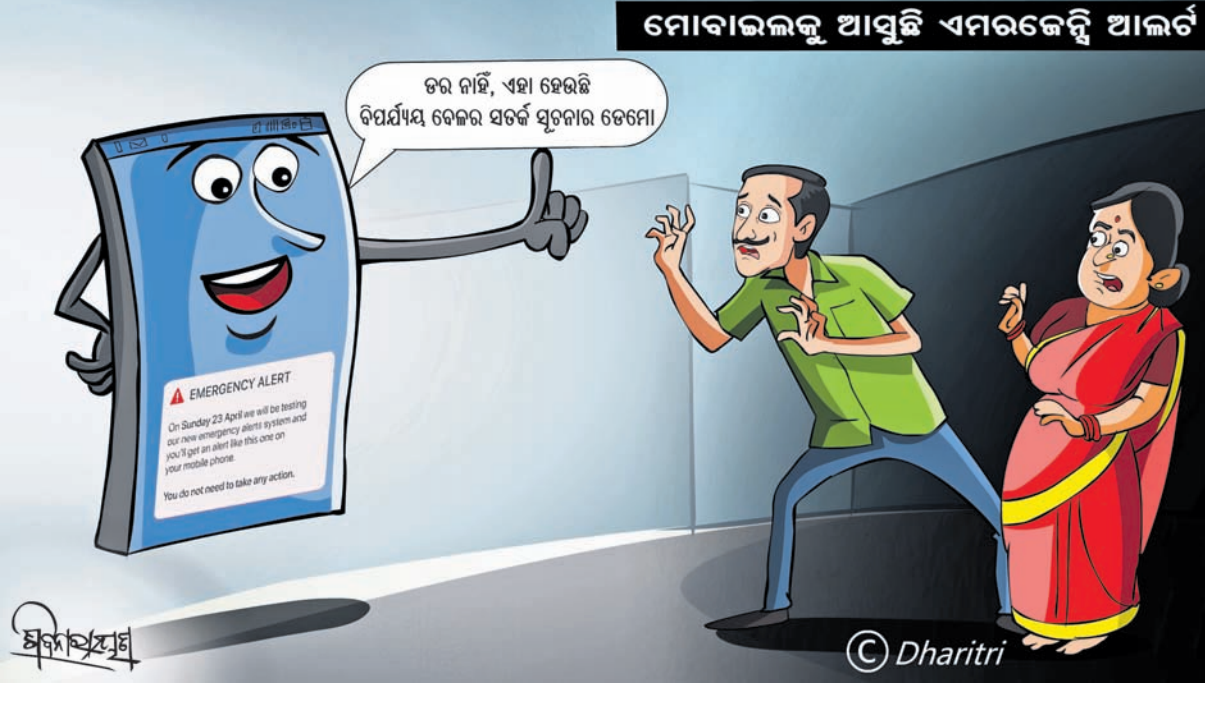
ମୋବାଇଲକୁ ଆସୁଛି ଏମରଜେନ୍ସି ଆଲର୍ଟ

ଢିକି ପେଟ ତଳେ ଗାତ ଧରିଥିଲି ସୁନାଫୁଲିଆ ହାତ ଚେକା ପାଣି ଚେକା ଭାତ। ବାହାସାହା ହୋଇ ଘରକୁ ଆଣିଥିବା ଘରଣୀ ଆଣି କର୍ମ କୁଶଳତା ନୁହେଁ। ଭଲକୁ ଆଖିରା କରି ଭେଲ। ଘରକୁ ଘରଣୀ ଆସିଲେ ମନ ଜାଣି ରାନ୍ଧିବାକୁ ପରସି ଦେବ ବୋଲି ଆଶା ରଖୁଥିବା ସ୍ୱାମୀ ନିକର ଆଶା ଆଶାରେ ରହିପାଉଥିବା ଦେଖି ମନ ଭଣା କରିବସୁଥିବା ଅର୍ଥରେ ଏଭଳି ଉଚ୍ଛିତ୍ତ ଭଲେଶ କରାଯାଇଛି। ଭୋଲ ପୂରିଲେ ବୋଲମାନେ ଉପାସେ ଶୋଇଥାଏ କବାଟ କୋଣେ। ସାଧାରଣତଃ ପେଟ ପୁରିଲେ ମଣିଷ ଚେଳି ଭରୋ ବା ସକାର ହୋଇଯାଏ। ତା' ନ ହେଲେ କାମ କରିବା ପାଇଁ ସେ ଇଚ୍ଛା କରେନାହିଁ ବୋଲି ଏଠାରେ ପ୍ରକାଶ କରାଯାଇଛି। ଓଡ଼ିଆ ଜଗତମାଳି ଓ ରୁଚି ପ୍ରୟୋଗ - ଏ.କେ. ମିଶ୍ର ପରିଶ୍ରମ ପ୍ରାଃଲିଃ