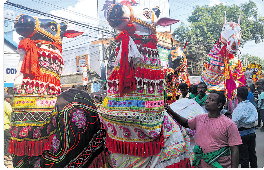
ଭବାଣି ଶୋଭାଯାତ୍ରାରେ ସାମିଲ ଘୋଡ଼ାମାନ ।