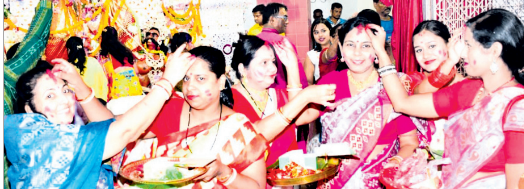
ଏକ କଲୋନୀରେ ମା'ଙ୍କ ସମ୍ମୁଖରେ ବିଭିନ୍ନ ସମ୍ପ୍ରଦାୟର ମହିଳାମାନେ ସିନ୍ଦୂରଖେଳୁଛନ୍ତି।

ସ୍ତ୍ରୀ ନାଟକ 'କରମାବାଇ' ମଞ୍ଚସ୍ଥ ହୋଇଥିଲା। ବିକୟା ଦଶମୀରେ ପୂର୍ଣ୍ଣାହୁତି ପରେ ବଙ୍ଗୀୟ ମହିଳା ଶ୍ରଦ୍ଧାଙ୍କୁ ମା'ଙ୍କୁ ମିଠା, ପାନ ଅର୍ପଣ କରିଥିଲେ।