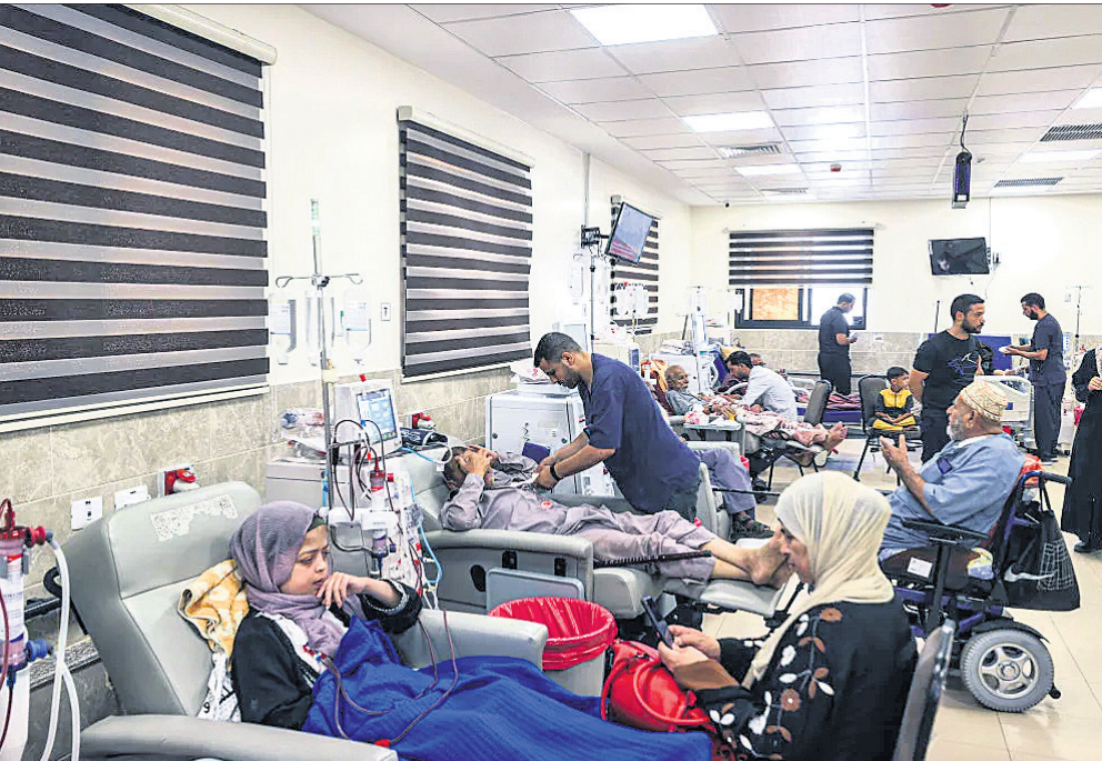
ଗାଜାର ଖାନ୍ ଯୁଦ୍ଧର ସହଯୋଗୀ ଏକ ହସ୍ତିଗାଳରେ ଚିକିତ୍ସାଧୀନ ଆହତମାନେ।

ବସବାସ ପାଇଁ ପାଲେଷ୍ଟିନୀୟମାନେ ଦୀର୍ଘ ୫୬ ବର୍ଷ ଧରି ସଂଘର୍ଷ କରୁଛନ୍ତି। ଏହାକୁ ନେଇ ରୁଚେରସ୍ ଭୂରନ୍ତ ନିକ ପଦରୁ ଇସ୍ରାଏଲ ଦିଆରୁ ବୋଲି ଇସ୍ରାଏଲ ଦାବି କରିଛି।