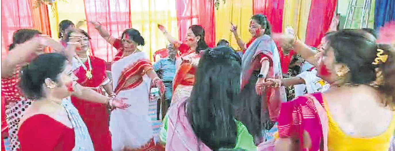
ଜଟଣୀ: ବନ୍ୟା ସମ୍ପ୍ରଦାୟର ମହିଳାମାନେ ପାରମ୍ପରିକ ନାଚ ଗୀତ ସହ ପରସ୍ପରକୁ ସିନ୍ଦୂର ଲଗାଇଛନ୍ତି।

ନିଖଳ ଓଡ଼ିଶା କେନ୍ଦ୍ର ସମବାୟ ବ୍ୟାଙ୍କ କର୍ମଚାରୀ ଫେଡେରେଶନର ଆହ୍ୱାନକ୍ରମେ ଅକ୍ଟୋବର ୨୫ରୁ ୨୭ ତାରିଖ ପର୍ଯ୍ୟନ୍ତ ଧର୍ମଘର ଜାରି ରହିବ।