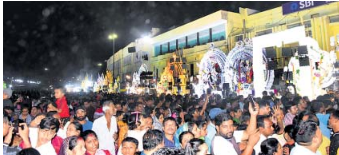
ସିଂହଦ୍ୱାର ସମ୍ମୁଖରେ ଦେବୀ ମିଳନ ଅବସରରେ ଲୋକଙ୍କ ଭିଡ଼ ।