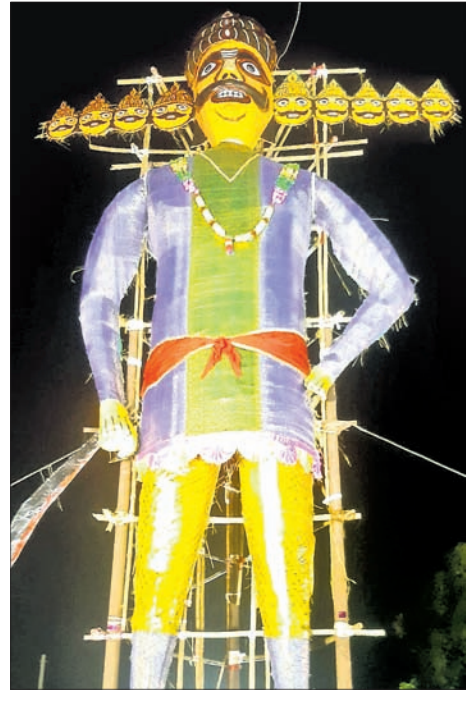
ବାଲିଯାତ୍ରା ଚଳପଡ଼ିଆରେ ସର୍ବଧର୍ମ ସାଂସ୍କୃତିକ ପରିଷଦ ପକ୍ଷରୁ ଅନୁଷ୍ଠିତ ରାବଣପୋଡ଼ି ଉତ୍ସବ ।