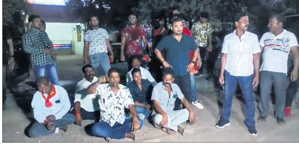
ମଞ୍ଚେଶ୍ୱର ଥାନା ସମ୍ମୁଖରେ ଉତ୍ତ୍ୟକ୍ତ ଲୋକେ ଧାରଣା ଦେଇଛନ୍ତି।

ରାଜଧାନୀରେ ଦୁର୍ଗାପୂଜା ଭସାଣି ଶୋଭାଯାତ୍ରା କେବଳ ହିନ୍ଦୀ ଦେଖିବାକୁ ମିଳିଛି।