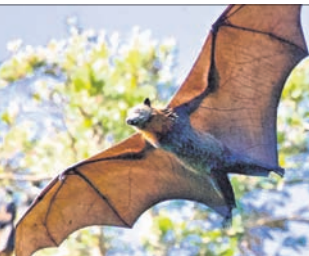
ଥୁଲୁଆନକପୁରମ, ୨୫ ଅକ୍ଟୋବର

କେରଳର ଖାୟନାପୁର ଥିବା ବାପୁଜୀମାନଙ୍କଠାରେ ନିଧା ଭାଇରସ୍ ଚିହ୍ନଟ ହୋଇଥିବା ଜଣାପଡ଼ିଛି।