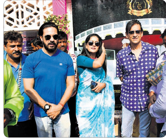
ମଙ୍ଗଳବାଗ୍ ପୂଜା କମିଟିର ୭୫ ବର୍ଷ ପୂର୍ଣ୍ଣ କାର୍ଯ୍ୟକ୍ରମରେ ଅଭିନେତା ସିଦ୍ଧାନ୍ତ ମହାପାତ୍ର, ଦେବାଶିଷ ପାତ୍ର ଓ ଅଭିନେତ୍ରୀ ଅନୁ ଚୌଧୁରୀଙ୍କୁ କମିଟି ପକ୍ଷରୁ ସମ୍ବର୍ଦ୍ଧିତ କରାଯାଇଛି ।