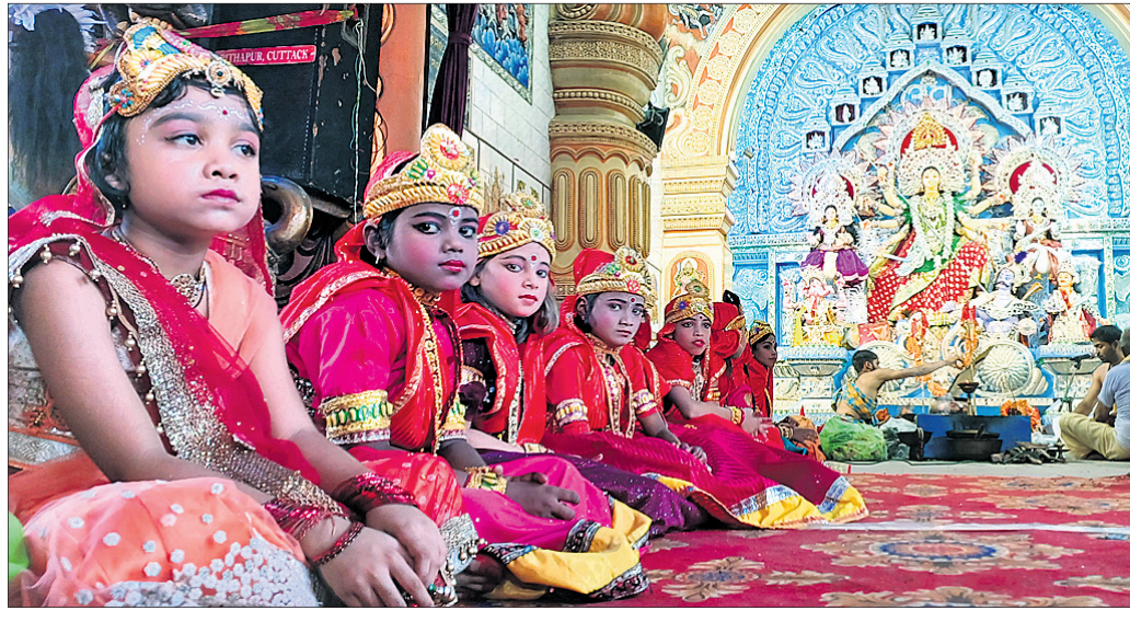
ମହାନଗରରେ ହରିପୁର-ବୋକପୁଣ୍ୟର ପୂଜାମଣ୍ଡପରେ ଅନୁଷ୍ଠିତ ପାରମ୍ପରିକ କୁମାରୀ ପୂଜା ।