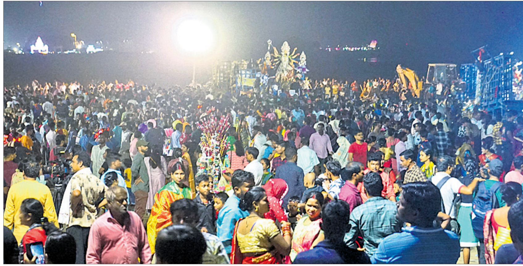
ଭବାଣି ଉତ୍ସବ ଦେଖିବା ପାଇଁ କାଠଯୋଡ଼ି ନଦୀର ଦେବୀଗଡ଼ାରେ ଲୋକଙ୍କ ଭିଡ଼ ।