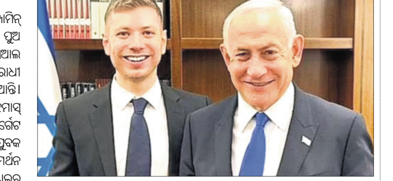
ପୁଅ ଯାଇଁ ସହ ଇସ୍ରାଏଲ ପ୍ରଧାନମନ୍ତ୍ରୀ ବେଞ୍ଜାମିନ୍ ନେତାନ୍ୟାହୁ।

କେଲ ଆଇଭ, ୨୫ ଅକ୍ଟୋବର: ଇସ୍ରାଏଲ ପ୍ରଧାନମନ୍ତ୍ରୀ ବେଞ୍ଜାମିନ୍ ନେତାନ୍ୟାହୁଙ୍କ ଦୁଇ ସମର୍ଥକ ତାଙ୍କ ପୁଅ ଯାଇଁ ଅନେକ ସମୟରେ ସୋସିଆଲ ମିଡିଆରେ ନିଜ ଇସ୍ରାଏଲ ବିରୋଧୀ ପୋଷ୍ଟ ପାଇଁ ବିବାଦୀୟ ହୋଇଥାଆନ୍ତି।