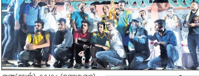
ଗଜା(ଖୋର୍ଦ୍ଧା), ୨୫।୧୦ (ରତ୍ନାଧି ପାଠକ)

ରାଜଧାନୀ ଉପକଣ୍ଠ ଅଞ୍ଚଳରେ ମା' ଦୁର୍ଗାଙ୍କୁ ଭାବପୂର୍ଣ୍ଣ ଭାବରେ ମେଲାଇ ଦିଆଯାଇଛି।