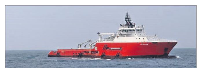
ପକ୍ଷରୁ ସୂଚନା ମିଳିଛି। କୋଷ୍ଠଗାର୍ତ୍ ପକ୍ଷରୁ ଜାହାଜ ଓ ସେଥିରେ ଥିବା ୨୫ ଜଣ ନାବିକ ବିପଦମୁକ୍ତ ବୋଲି କୋଷ୍ଠଗାର୍ତ୍ ନାଭିଗୋଶନ ସମ୍ପର୍କରେ ତର୍କନା କରିଥାଏ। ରାତି ୨୨ ଓ ୨୩ ତାରିଖ ମଧ୍ୟରାତ୍ରରେ ସମୁଦ୍ର କୌପୁତ ଜାହାଜରେ ଯାନ୍ତ୍ରିକ ତ୍ରୁଟି ଦେଖାଦେଇଥିଲା। ଏହି ସମୟରେ ବାତ୍ୟା ହମ୍ବୁର୍ ମୋଗୁ ସମୁଦ୍ର ଅଞ୍ଚଳ ହୋଇଯାଇଥିଲା। ସେମାନେ ତୁରନ୍ତ କୋଷ୍ଠଗାର୍ତ୍ ସହାୟତା ଲୋଡ଼ିଥିଲେ। କୋଷ୍ଠଗାର୍ତ୍ ପାଟୋଲି ଜାହାଜ ଅମୋୟ ସେହି ବାତ୍ୟା ମଧ୍ୟରେ ସମୁଦ୍ର ଭିତରକୁ ଯାଇ ୩୫ ନଟିକାଳ ମାଲକ ସୂତରୁ ସମୁଦ୍ର କୌପୁତକୁ ଚାଣିଚାଣି ଆଣିଥିଲା। ପାରାଦୀପ ବନ୍ଦର ମଧ୍ୟରେ ବର୍ଷ ପରେ ମରାମତି ହେବ ବୋଲି ଜଣାପଡ଼ିଛି।

ପାରାଦୀପ, ୨୫।୧୦(ରଚନା ନାୟକ) ପାରାଦୀପ ତଟଠାରୁ ୩୫ ନଟିକାଳ ମାଲକ (୬୩ କିମି) ସମୁଦ୍ରରେ ବିପଦରେ ରହିଥିବା ରିସର୍ଚ୍ଚ ଜାହାଜ 'ସମୁଦ୍ର କୌପୁତ' କୁଧିବାବର ସହାୟତା ପାରାଦୀପ ପାଖରେ ପହଞ୍ଚିଛି। ଯେଉଁ ସ୍ଥାନରେ ସମୁଦ୍ର କୌପୁତ ରହିଛି ତାକୁ ଆକରଣ ଅଞ୍ଚଳ ବୋଲି କୁହାଯାଇଛି। କୁଳ ପାଖକୁ ଆସିବା ପରେ ଜାହାଜ ଓ ସେଥିରେ ଥିବା ୨୫ ଜଣ ନାବିକ ବିପଦମୁକ୍ତ ବୋଲି କୋଷ୍ଠଗାର୍ତ୍