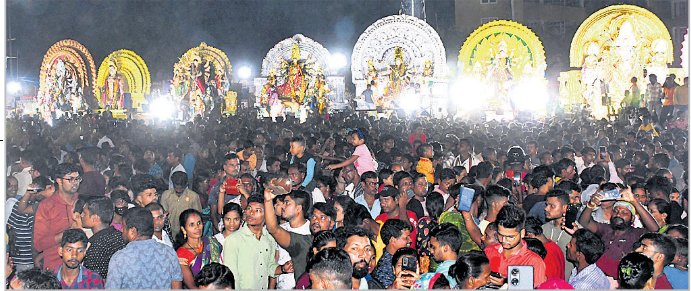
ନୟାପଲ୍ଲୀ ଭସାଣି ଉତ୍ସବରେ ଶ୍ରଦ୍ଧାଳୁଙ୍କ ମେଳରେ ଧାଡ଼ିରେ ରହିଥିବା ମେଡ଼।

ପ୍ରାଚୀନ ପୋଲିସ୍ ଫୋର୍ସ୍ ମୁତୟନ କରାଯାଇଥିଲା। ଭିଡ଼ ନିୟନ୍ତ୍ରଣ ତଥା ଯାତାୟାତ ଯେପରି ବାଧାପ୍ରାପ୍ତ ନ ହୁଏ ସେଥିପାଇଁ ଭସାଣି ପାଇଁ ନିର୍ଦ୍ଦିଷ୍ଟ ରୂପରେ ଭସାଣି ଯାତ୍ରାର ଆୟୋଜନ କରାଯିବ। ସହ ସମ୍ପୂର୍ଣ୍ଣ ରାସ୍ତାରେ ଯାନାବାହନ ଚଳାଚଳ ବନ୍ଦ କରାଯାଇ ବିକଳ ରାସ୍ତାରେ ଯାତାୟାତ ହୋଇଥିଲା। ଭସାଣି କାର୍ଯ୍ୟକୁ ତିସିପି ପ୍ରତୀକ ସଂ ଚଦାରଖ କରିଥିଲେ।