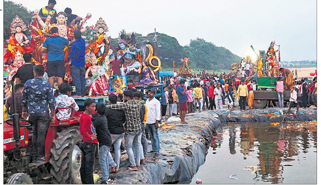
କାଠଯୋଡ଼ି ନଦୀର ଅସ୍ଥାୟୀ ପୋଖରୀରେ ମା' ଦୁର୍ଗାଙ୍କୁ ବିସର୍ଜନ କରାଯାଇଛି ।