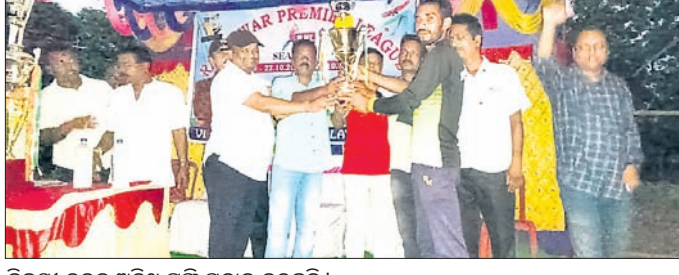
ବିଜୟୀ ଦଳକୁ ଅତିଥି ଟ୍ରଫି ପ୍ରଦାନ କରୁଛନ୍ତି।