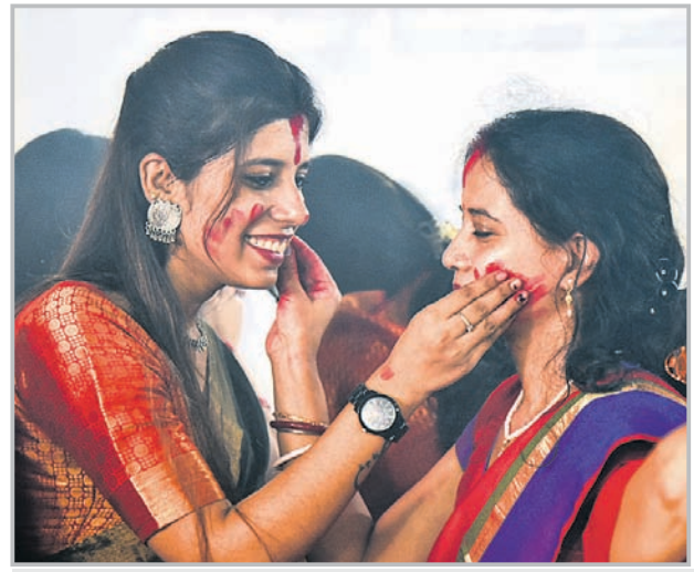
କାଳିବାଡ଼ି ପୂଜା ମଣ୍ଡପରେ ମା'ଙ୍କୁ ପୂଜାର୍ଚ୍ଚନା ସହ ମହିଳାମାନେ ସିନ୍ଦୂର ଖେଳୁଛନ୍ତି।

କଟପା ବେଶଭୂଷାରେ ଶୋଭାଯାତ୍ରାରେ ଯାଉଥିବା ସୁନାମ ମହାନନ୍ଦକୁ ବେଷ୍ଟିବାକୁ ବେଶ୍ ଭିଡ଼ କମିଥିଲା। ଦୟା ବ୍ରିକ୍ ଉପରେ ବିଏମ୍‌ସି ଏନପୋର୍ଟମେଣ୍ଟ ସ୍ଥାତ୍ଵ କରି ରହିଥିବାବେଳେ ଅନାଧିକାରୀମାନେ ଛୋଟ ଛୋଟ ମୂର୍ତ୍ତିକୁ ନିଜାନ୍ତୁପକାରଥିବା ବେଷ୍ଟିବାକୁ ମିଳିଥିଲା। ଅନେକ ମଣ୍ଡପର କର୍ମଚାରୀ ମା' ଦୁର୍ଗାଙ୍କ ମୂର୍ତ୍ତିକୁ ଅଶାଳୀନ ଭାବେ ବିସର୍ଜନ କରୁଥିବା ନଜରକୁ ଆସିଥିଲା।