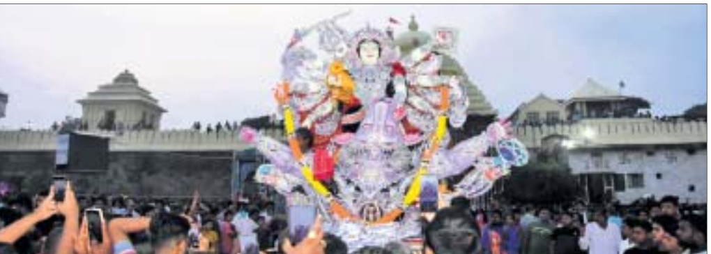
ଠାକୁରାଣୀଙ୍କୁ ସିଂହଦ୍ୱାର ସମ୍ମୁଖ ଦେବସଭାକୁ ନିଆଯାଇଛି ।