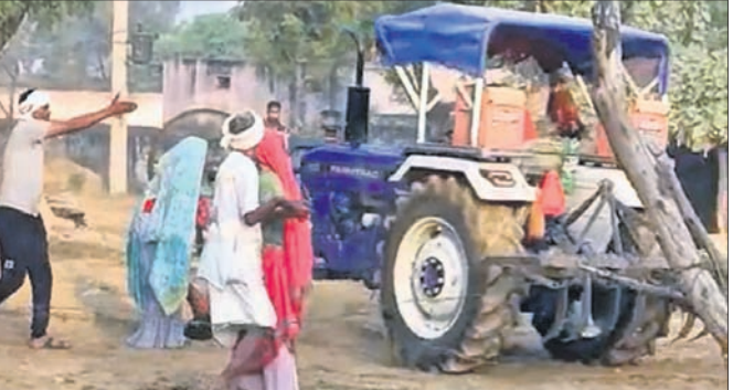
ଯାଇଥିଲେ। ପରେ ଅତରଳ ପରିବାର ଲୋକେ ସେଠାରେ ପହଞ୍ଚିଥିଲେ।

ମଧ୍ୟପ୍ରଦେଶର ସେଠି ଅଭିଯୁକ୍ତେ ଯାଇଥିଲା। ଅପରାହ୍‌ନା ୪୫ରେ ଆଗ୍ରା ଷ୍ଟେଶନ୍ ଛାଡ଼ିବାବେଳକୁ ଏହି ଅଗ୍ନିକାଣ୍ଡ ଘଟିଥିଲା।