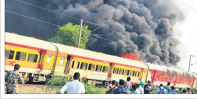
ନୂଆଦିଲ୍ଲୀ, ୨୫ ଅକ୍ଟୋବର

କରିବା ଦେହାଦ୍ରାଜ ଶେୟାର କରିଥିବା ଦସ୍ତାବିଜଗୁଡ଼ିକର ତଥ୍ୟ ଭିତ୍ତିରେ ନିଶିକାନ୍ତ ଲୋକ ସଭା ବାଚସ୍ପତି ଓଏମ୍‌ଲିଙ୍କ ନିକଟକୁ ମହୁଆଙ୍କ ବିରୋଧରେ କାର୍ଯ୍ୟାନୁଷ୍ଠାନ ପାଇଁ ପତ୍ର ଲେଖିଥିଲେ।