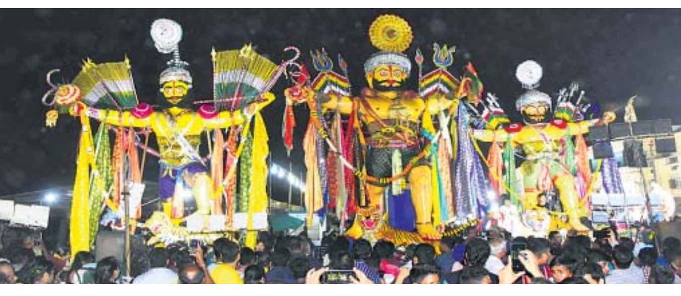
ଦେବୀ ମେଳନରେ ନାଗାମେଡ଼ ।