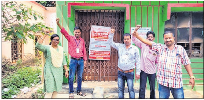
ଧର୍ମଘରରେ ସାମିଲ ହୋଇଥିବା ବ୍ୟାଙ୍କ କର୍ମଚାରୀ।