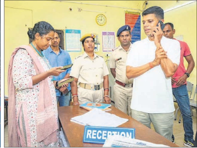
ଗଜପତି ଜିଲା ଗସ୍ତ ସମୟରେ ବିକଳପାତ ଗାଡିରେ ପାରଳାଖେମୁଣ୍ଡି ଆମା ପରିବର୍ତ୍ତନ କରି ସମସ୍ୟା ଦୂରୀକୃତି