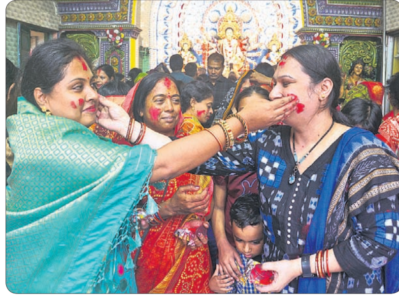
ଦୁର୍ଗାପୂଜାରେ କଟକ ଶେଖ ବଜାର ପୂଜାମଣ୍ଡପ ସମ୍ମୁଖରେ ମହିଳାଙ୍କ ସିନ୍ଦୂର ଖେଳ ।