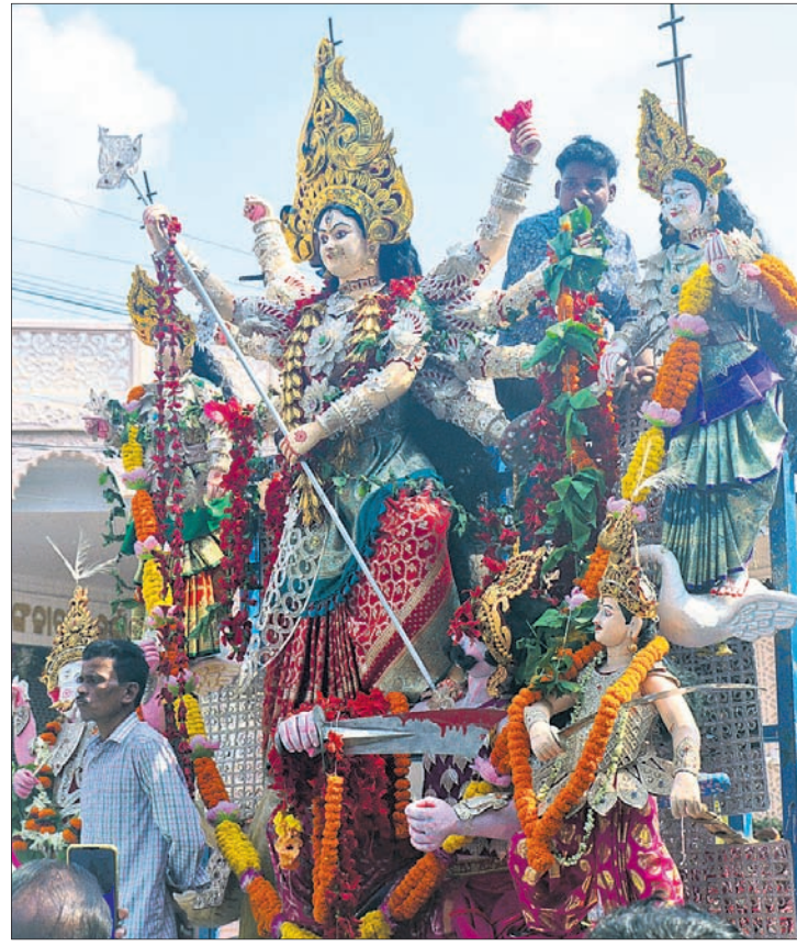
ଭବାଣି ଶୋଭାଯାତ୍ରାରେ ସାମିଲ ହୋଇଥିବା ଦୁର୍ଗାମେଡ଼ି ।