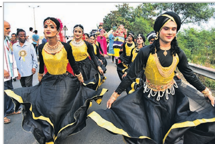
ଭସାଣି ଶୋଭାଯାତ୍ରାରେ ବିଭିନ୍ନ ରାଜ୍ୟର ଲୋକନୃତ୍ୟ ଦଳ ଓ କଳାକାରମାନେ କଳା ପ୍ରଦର୍ଶନ କରୁଛନ୍ତି।