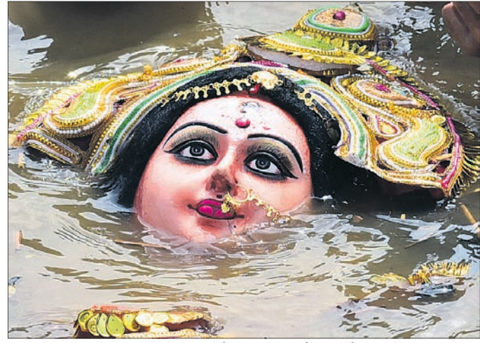
କୁଆଖାଇ ଅସ୍ଥାୟୀ ପୁଖାରିଣୀରେ ମା' ଦୁର୍ଗାଙ୍କ ମୂର୍ତ୍ତିକୁ ବିସର୍ଜନ କରାଯାଇଛି।