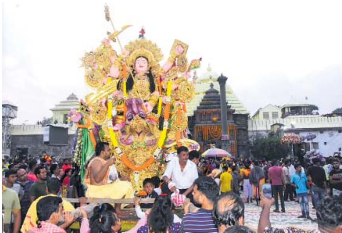
ସିଂହଦ୍ୱାର ସମ୍ମୁଖରେ ଗେଲବାଇ ।