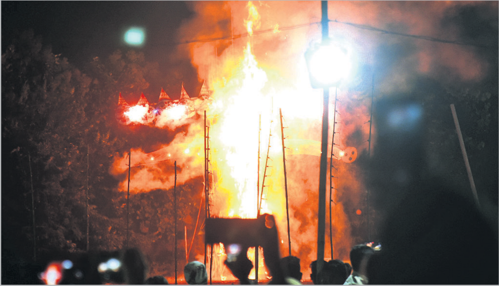
ବରପୁଣ୍ଡା ଦୁର୍ଗା ପୂଜା ସମିତି ପକ୍ଷରୁ ଅନୁଷ୍ଠିତ ରାବଣା ପୋଡ଼ି।