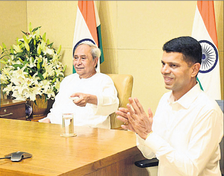
ମୁଖ୍ୟମନ୍ତ୍ରୀ ନବୀନ ପଟ୍ଟନାୟକଙ୍କ ଦ୍ୱାରା କଟକ ଜିଲାର ବିଭିନ୍ନ ପ୍ରକଳ୍ପ ଉଦ୍‌ଘାଟନ ଅବସରରେ ଉପସ୍ଥିତ ୫-ଟି ସର୍ତ୍ତ ଭି.କେ. ପାଣ୍ଡିଆନ