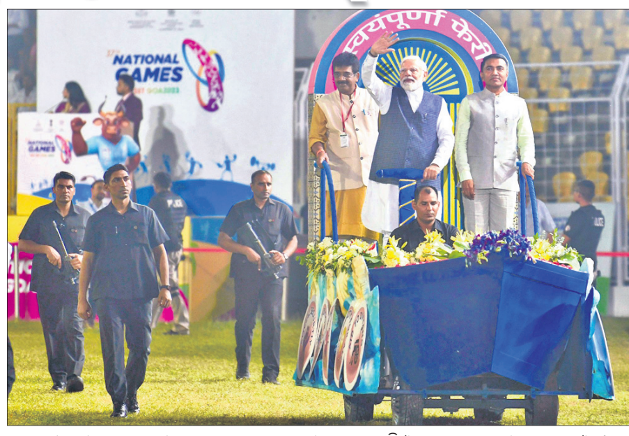
ଜାତୀୟ କ୍ରୀଡ଼ା ଉଦ୍‌ଘାଟନା ସମାରୋହରେ ପ୍ରଧାନମନ୍ତ୍ରୀ ନରେନ୍ଦ୍ର ମୋଦି ଓ ଗୋଆ ମୁଖ୍ୟମନ୍ତ୍ରୀ ପ୍ରମୋଦ ସାହୁ।

ଗାଢ଼ିତେ ଓ ପର୍ଯ୍ୟଟନ ବିଭାଗର ରାଷ୍ଟ୍ରମନ୍ତ୍ରୀ ଶ୍ରୀପଦ ନାୟକ ପ୍ରମୁଖ ଅତିଥି ଭାବରେ ଯୋଗ ଦେଇଥିଲେ। ୨୮ ରାଜ୍ୟର ୧୦ ହଜାରରୁ ଅଧିକ କ୍ରୀଡ଼ାବିତ ୪୩ଟି କ୍ରୀଡ଼ା ଲଭେଷ୍ଟରେ ଅଂଶଗ୍ରହଣ କରୁଛନ୍ତି। ଏହା ମଧ୍ୟରୁ ୪୯ ପ୍ରତିଶତ ମହିଳା ପ୍ରତିଯୋଗୀ ରହିଛନ୍ତି। ଆସନ୍ତା ନଭେମ୍ବର ୯ ତାରିଖ ପର୍ଯ୍ୟନ୍ତ ଏହି ଚୁନାମେଣ୍ଟ ଜାରି ରହିବ। ମାପୁସା, ମାଗାଓ, ପଞ୍ଜିମ, ପୋଖା, କାଞ୍ଚୋର ୨୮ ଜେନ୍ତୁରେ ଏହି ଚୁନାମେଣ୍ଟ ଆୟୋଜିତ ହେବ। ୧୯୨୪ରେ ଆୟୋଜିତ ପ୍ରଥମ ନ୍ୟାଶନାଲ ଗେମ୍ସ ମୋଟୋ 'ଗେମ୍ସ ସେଟ୍ ପୁଏ' ରହିଥିବା ବେଳେ ଚଳିତ ସଂସ୍କରଣର ମୋଟୋ 'ଗେମ୍ସ ସେଟ୍ ଗୋଆ' ରଖାଯାଇଛି।