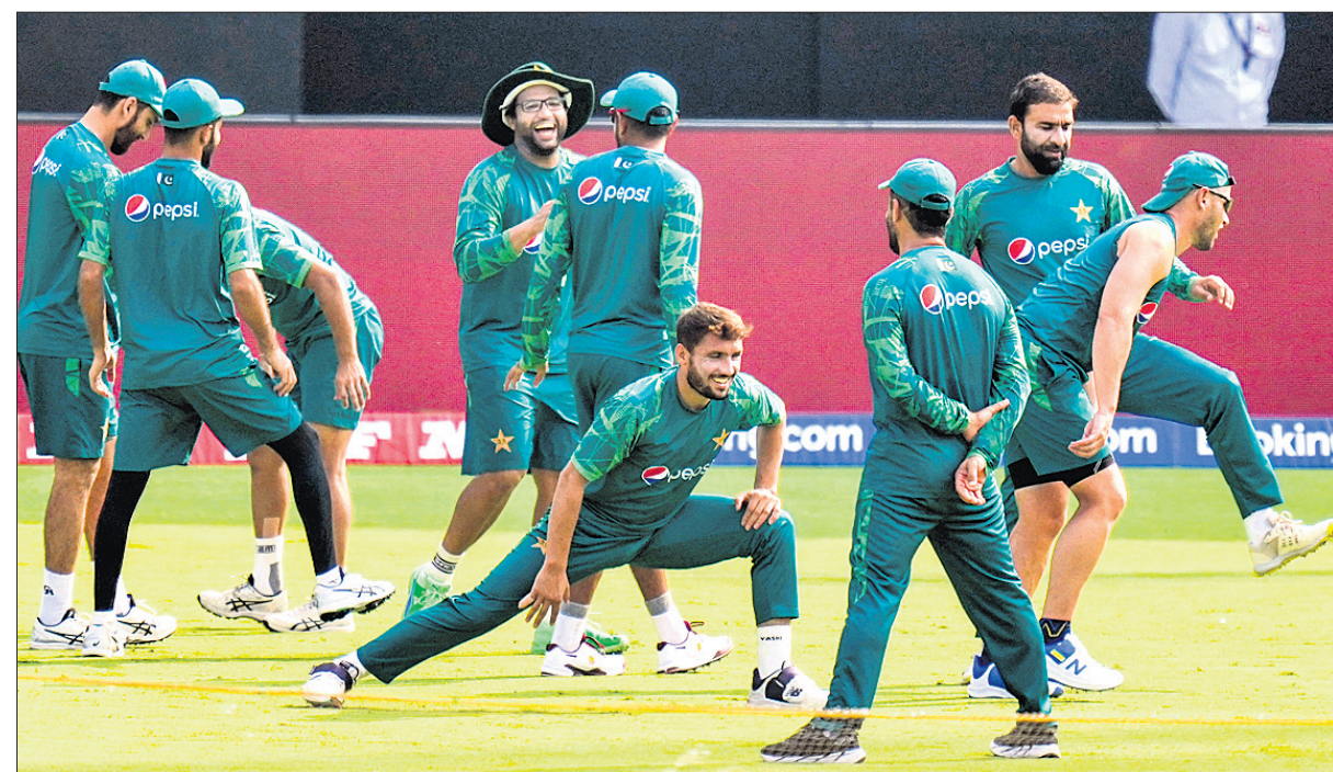
ଚେନ୍ନାଇରେ ଗୁରୁବାର ପାକିସ୍ତାନ କ୍ରିକେଟ ଦଳର ଅଭ୍ୟାସ ।