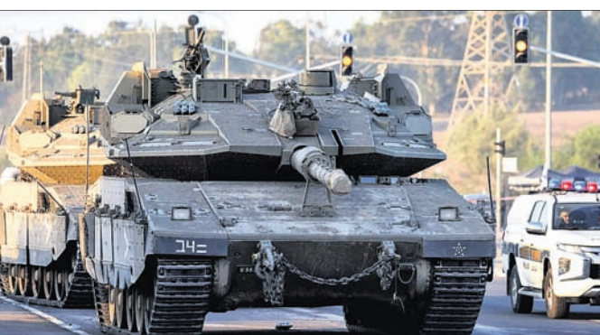
ଉତ୍ତର ଗାଜାରେ ଇସ୍ରାଏଲର ବ୍ୟାଙ୍କ ପ୍ରବେଶ କରୁଛି।