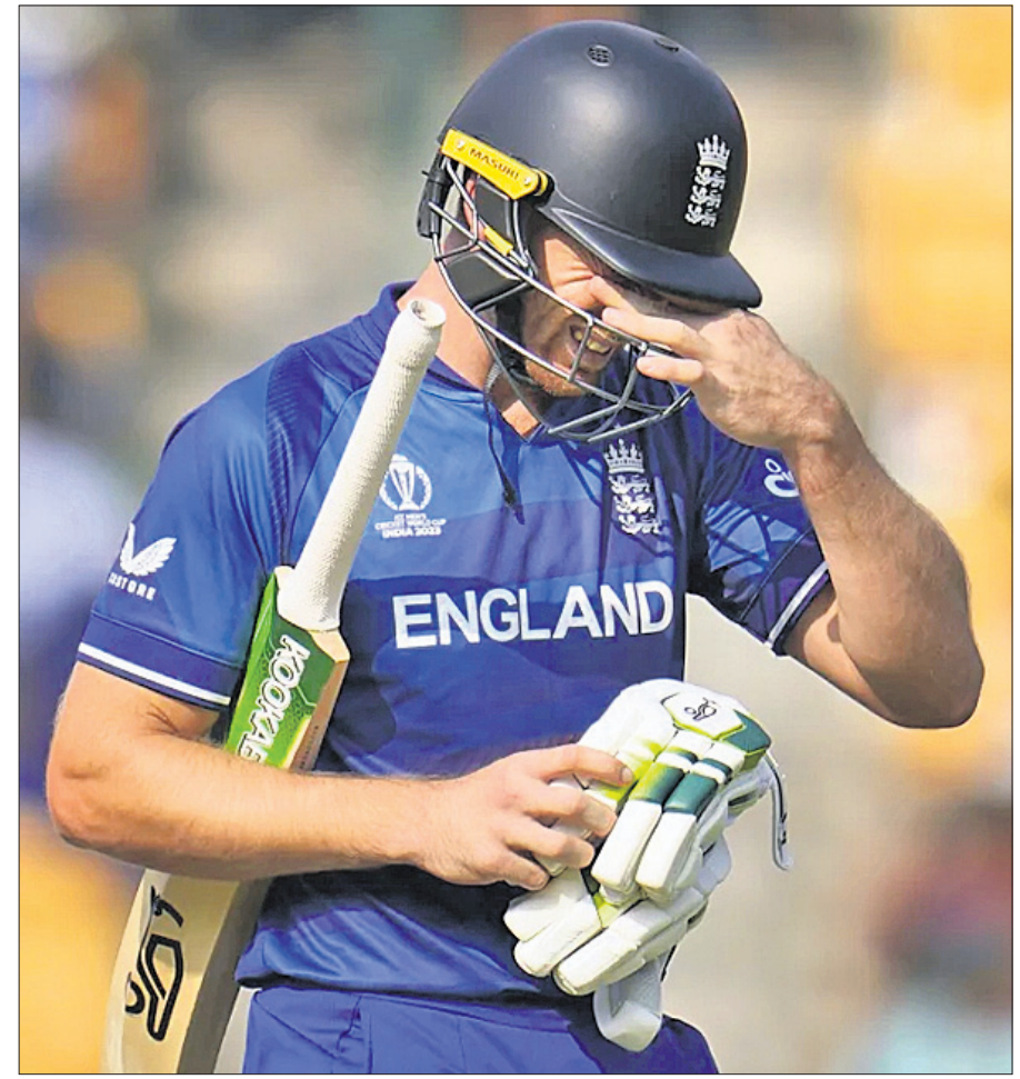
ଆଉଟ ହେବାପରେ ଦୁଃଖାଳିଭୂତ ଇଂଲଣ୍ଡ ଅଧିନାୟକ କୋଶ୍ ବଟଲର ।

ଇଂଲଣ୍ଡ ବିପକ୍ଷରେ ଶ୍ରୀଲଙ୍କାର କ୍ରମାଗତ ୫ଟି ବିଜୟ