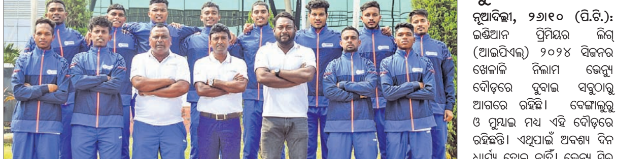
ସପୋର୍ଟ ଷ୍ଟାଫ୍ ସହ ଓଡ଼ିଶା ବିର୍ ପୁରୁଷ ଦଳ।