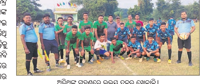
ଅତିଥିକ ଗହଣରେ ଉଭୟ ଦଳର ଖେଳାଳି ।

ଖଣ୍ଡପଡ଼ା, ୨୬ ଅକ୍ଟୋବର (ଅକ୍ଷୟ କୁମାର ମହାରଣା) ଖଣ୍ଡପଡ଼ା ବ୍ଲକ ଅଧୀନ କର୍ଷିଲୋ ନାଳମାଧବ ସ୍ନୋଡ଼ା ଆସୋସିଏଶନ ପକ୍ଷରୁ କର୍ଷିଲୋ ପଲଟନ ପଡ଼ିଆରେ ଆରମ୍ଭ ହୋଇଥିବା ୧୨ତମ ରାଜ୍ୟସ୍ତରୀୟ ଫୁଟବଲ ଚୁନାମେଣ୍ଟର ଗୁରୁବାର ହେଉଛି ଛଅ ଦିନ ପ୍ରଥମ ସେମିଫାଇନାଲ ମ୍ୟାଚରେ ଏସ୍ ଏସ୍ ବାଲୁଗାଁ (ଖେରା) ଫୁଟବଲ ଆସୋସିଏଶନ ୩-୦ ଗୋଲରେ ଖୁଣ୍ଟୁକଟା କ୍ରୀଡ଼ା ପରିଷଦ ଆଠଗଡ଼କୁ ହରାଇ ପ୍ରତ୍ୟେକ ଦିନରେ ଉଭୟ ଦଳର ଖେଳାଳି ଭାବେ ଯୋଗଦେଇଥିଲେ।