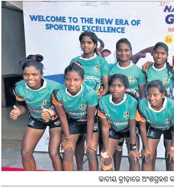
ଜାତୀୟ କ୍ରୀଡ଼ାରେ ଅଂଶଗ୍ରହଣ କରିଥିବା ଓଡ଼ିଶା ମହିଳା ରଗର୍ବା ଦଳ।

କରିଛି। ଗୁରୁବାର କ୍ୱାର୍ଟର ଫାଇନାଲରେ ପୁରୁଷ ଦଳ ବିହାରକୁ ୧୯-୪ରେ ହରାଇଥିବାବେଳେ ମହିଳା ଦଳ ୬୪-୦ରେ କର୍ନାଟକକୁ ପରାସ୍ତ ପରାସ୍ତ କରିଛି। ସେମିଫାଇନାଲରେ ଓଡ଼ିଶା ପୁରୁଷ ଦଳ ମହାରାଷ୍ଟ୍ରକୁ ଏବଂ ମହିଳା ଦଳ ବଙ୍ଗୋରୁକୁ ହରାଇବେ ବୋଲି କ୍ୱାର୍ଟର ଫାଇନାଲ ପୂର୍ବରୁ ପୂର୍ଣ୍ଣ