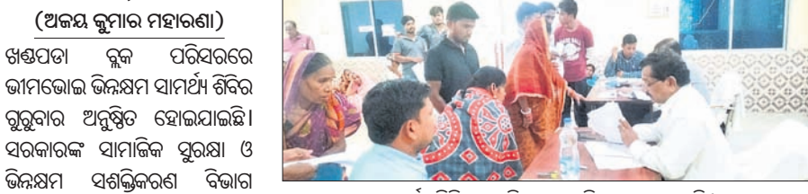
ସାମର୍ଥ୍ୟ ଶିବିରରେ ଭିନକ୍ଷମକୁ ଚିହ୍ନଟ କରାଯାଇଛି ।