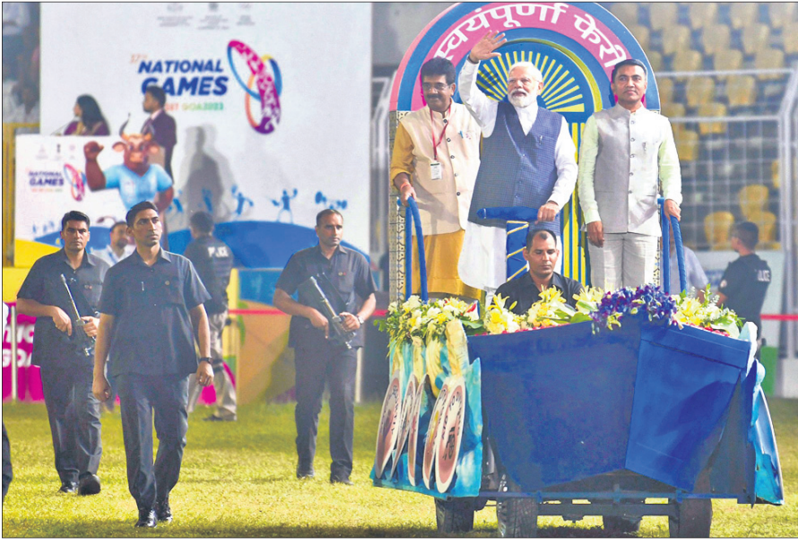
ଜାତୀୟ କ୍ରୀଡ଼ା ଉଦ୍‌ଘାଟନା ସମାରୋହରେ ପ୍ରଧାନମନ୍ତ୍ରୀ ନରେନ୍ଦ୍ର ମୋଦି ଓ ଗୋଆ ମୁଖ୍ୟମନ୍ତ୍ରୀ ପ୍ରମୋଦ ସାହୁ।

ଗାଡ଼ିତେ ଓ ପର୍ଯ୍ୟଟନ ବିଭାଗର ରାଷ୍ଟ୍ରମନ୍ତ୍ରୀ ଶ୍ରୀପଦ ନାୟକ ପ୍ରମୁଖ ଅତିଥି ଭାବରେ ଯୋଗ ଦେଇଥିଲେ। ୨୮ ରାଜ୍ୟର ୧୦ ହଜାରରୁ ଅଧିକ କ୍ରୀଡ଼ାବିତ ୪୩ଟି କ୍ରୀଡ଼ା ଲଭେଷ୍ଟରେ ଅଂଶଗ୍ରହଣ କରୁଛନ୍ତି। ଏହା ମଧ୍ୟରୁ ୪୯ ପ୍ରତିଶତ ମହିଳା ପ୍ରତିଯୋଗୀ ରହିଛନ୍ତି। ଆସନ୍ତା ନଭେମ୍ବର ୯ ତାରିଖ ପର୍ଯ୍ୟନ୍ତ ଏହି ଚୁର୍ଣ୍ଣମେଷ୍ଟ ଧାରୀ ରହିବ। ମାପୁସା, ମାଗାଓ, ପଞ୍ଜିମ, ପୋଖା, ଭାଷ୍କୋର ୨୮ ଭେଦ୍ୟରେ ଏହି ଚୁର୍ଣ୍ଣମେଷ୍ଟ ଆୟୋଜିତ ହେବ। ୧୯୨୪ରେ ଆୟୋଜିତ ପ୍ରଥମ ନ୍ୟାଶନାଲ ଗେମ୍ସ ମୋଡେର 'ଗେଟ୍ ସେଟ୍ ପ୍ଲେ' ରହିଥିବା ବେଳେ ଚଳିତ ସଂସ୍କରଣର ମୋଡେର 'ଗେଟ୍ ସେଟ୍ ଗୋଆ' ରଖାଯାଇଛି।