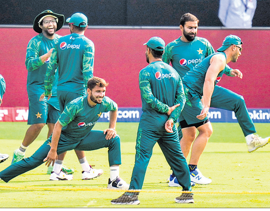
ଚେନାଇରେ ଚୁରୁବାର ପାକିସ୍ତାନ କ୍ରିକେଟ ଦଳର ଅଭ୍ୟାସ ।

ବିଜୟ ଲାଭ୍ୟ ବହୁ ନ ଥିଲେ ମଧ୍ୟ ଶ୍ରୀଲଙ୍କା ମାତ୍ର ୨୩ ରନ ମଧ୍ୟରେ କୁସାଳ ପେରେରା (୪) ଓ ଅଧିନାୟକ କୁସାଳ ମେନ୍ଦିସ (୧୧)ଙ୍କ ଉଇକେଟ ହରାଇ ପ୍ରାରମ୍ଭିକ ଖେଳ ଖାଲିଥିଲା । ମାତ୍ର ନୟାକ ଓ ସମରବିକ୍ରମା ଗାପର କପ୍ତନ ରଜିଥା ୨୮ ବଲ୍ରେ ୨୫ ରନକରି ୨ ଓଭରରେ ବିଜୟ ଲାଭ କରିଥିଲେ । ଦୁହେଁ ଅପମାତ୍ର ତୃତୀୟ ଉଇକେଟ ଯୋଡ଼ିରେ ୧୨୨ ବଲ୍ରେ ୧୩୭