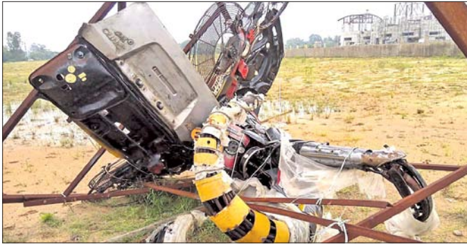
ନିର୍ମାଣାଧୀନ ଉଦ୍ୟାନ ଉତ୍କର୍ଷ କେନ୍ଦ୍ର ।

■ ପାଣିରେ ପଡ଼ିପାରେ ୧୪.୧୧ କୋଟି ଟଙ୍କାର ପ୍ରକଳ୍ପ ■ ଡିଏମ୍‌ଏସ୍ ପାଣିରୁ ଅନୁଦାନ ମଞ୍ଜୁର