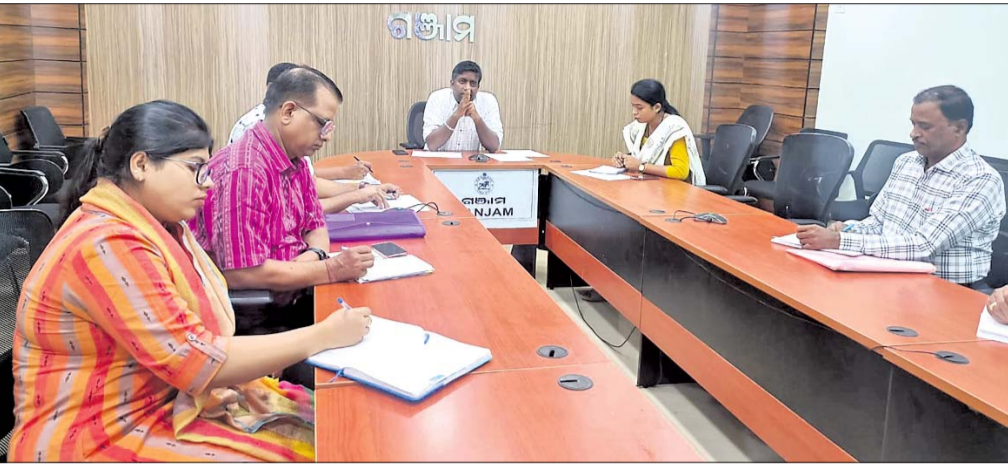
ବୈଠକରେ ଜିଲ୍ଲାପାଳଙ୍କ ସହ ଅନ୍ୟ ଅଧିକାରୀମାନେ ।