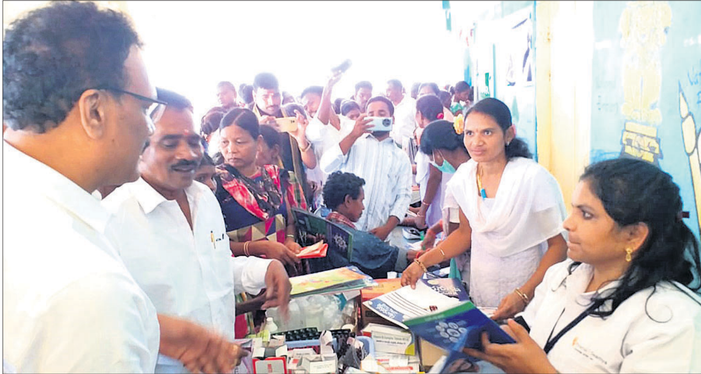
ଆନ୍ଧ୍ର ପ୍ରଦେଶ ସରକାରଙ୍କ ଦ୍ୱାରା ଆୟୋଜିତ ସ୍ୱାସ୍ଥ୍ୟସେବା ଶିବିରରେ ନାମ ପଞ୍ଜୀକରଣ ଲାଗି କୋରାପୁଟ ଜିଲ୍ଲା ପଞ୍ଚାଙ୍ଗି ବୁକ୍ ଧୂଳିପଦର ଗ୍ରାମରେ ଲୋକଙ୍କ ଭିଡ଼।