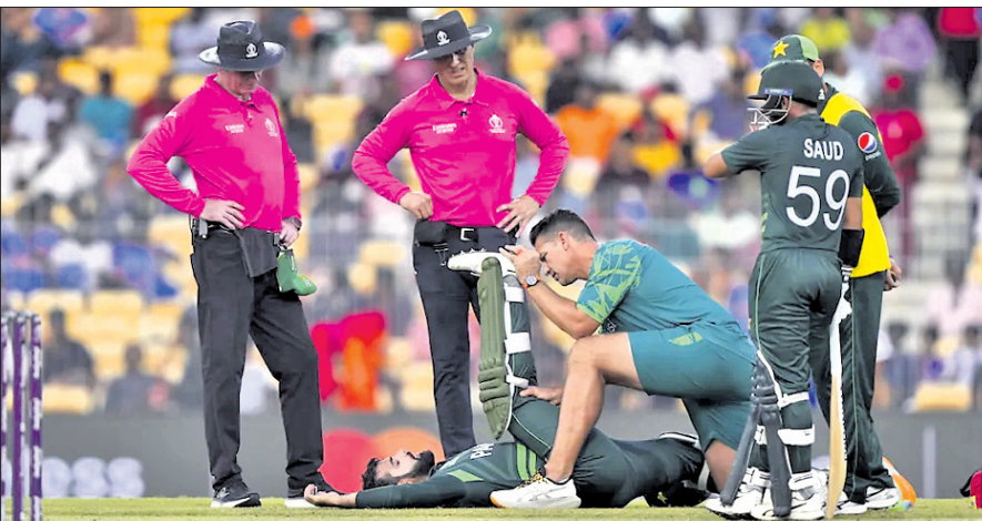
ମୁଣ୍ଡରେ ବଲ୍ ବାଜିବା ପରେ ସବାବ ଖାଁକୁ ଡାକ୍ତରୀ ବିକିଆ କରାଯାଇଛି।