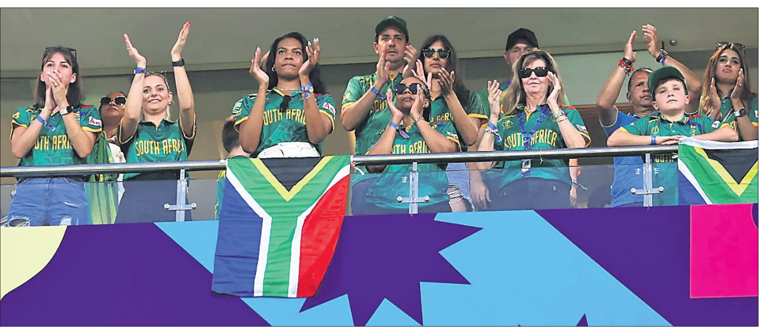
ମ୍ୟାଚ ଉପଭୋଗ ଅବସରରେ ଦକ୍ଷିଣ ଆଫ୍ରିକା ପ୍ରଶଂସକ।