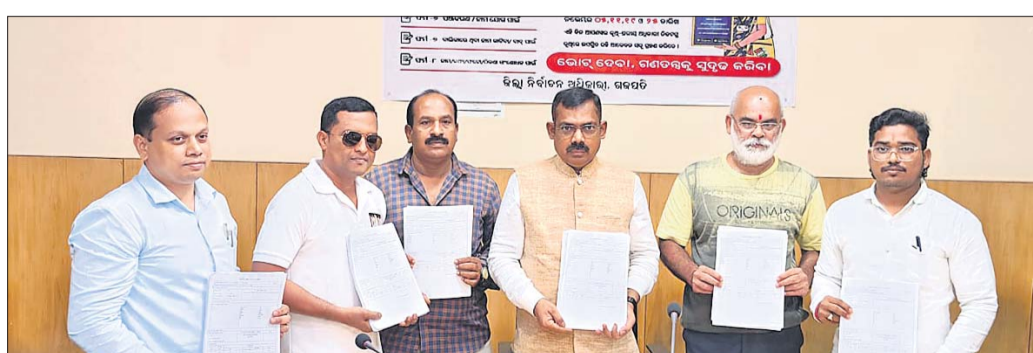
ଜିଲ୍ଲାପାଳ ଓ ଅନ୍ୟ ଅଧିକାରୀମାନେ ସଂକ୍ଷିପ୍ତ ଭୋଟର ତାଲିକା ପ୍ରକାଶ କରୁଛନ୍ତି ।