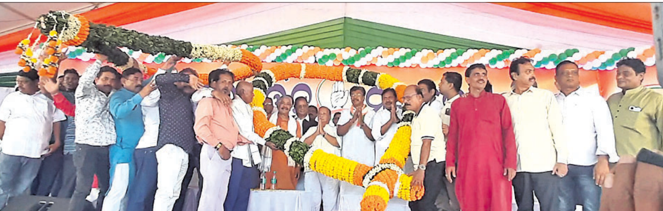
ଖୋର୍ଦ୍ଧାଠାରେ ଆୟୋଜିତ କଂଗ୍ରେସର ପରିବର୍ତ୍ତନ ସମାବେଶରେ ଉପସ୍ଥିତ ନେତୃତ୍ୱମାନେ