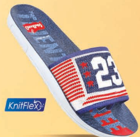
[ WG5477 | ₹ 299.00* ]

*MRP (inclusive of all taxes) mentioned is price per pair. For sizes - Gents (06X10) & Ladies (05X09)