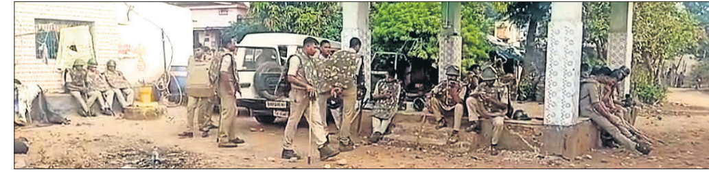
ଭୁବନେଶ୍ୱର, ୨୮.୧୦(ସତ୍ୟଜିତ ରାଉତ)