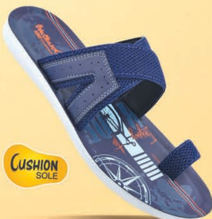
[ WG5519 | ₹ 299.00* ]