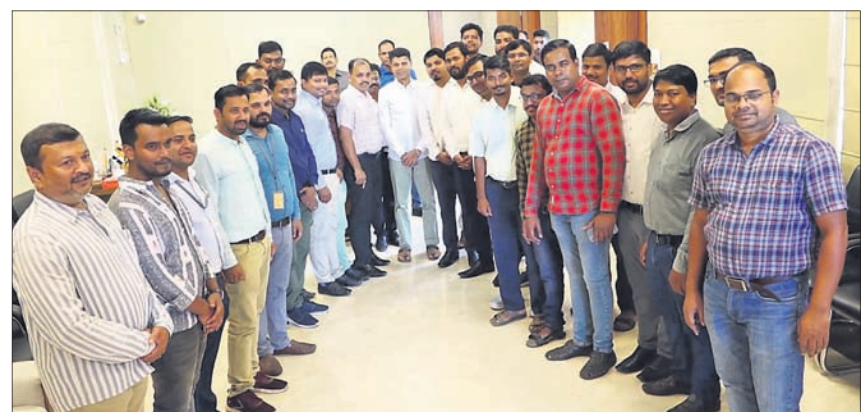
ନବୀନ ନିବାସରେ ଶୁକ୍ରବାର ୪-ଟି ନବୀନ ଓଡ଼ିଶା ଅଧ୍ୟକ୍ଷ ଭି.କେ. ପାଣିଗ୍ରାହୀଙ୍କୁ ବିଭିନ୍ନ ସରକାରୀ କର୍ମଚାରୀ ସଂଘର କର୍ମକର୍ତ୍ତାମାନେ ସାକ୍ଷାତ କରୁଛନ୍ତି।