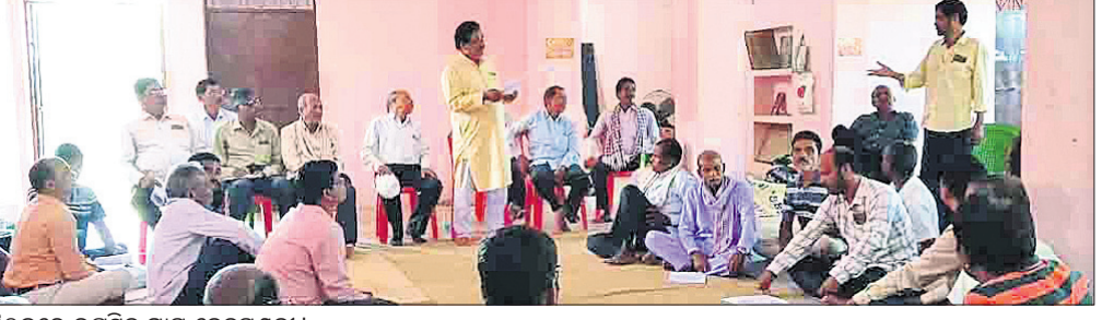
ବୈଠକରେ ଉପସ୍ଥିତ ଗ୍ରାମ ନେତୃମଣ୍ଡଳ।

ଅନୁଗୋଳ, ୨୭।୧୦ (ଅମିତ କୁମାର ସାମଲ) ଅନୁଗୋଳ ଜିଲ୍ଲାର ୯୨ଖଣ୍ଡ ରାଜ୍ୟ ଗ୍ରାମରୁ ଚଳବନ୍ଦି ଉଲ୍ଲେଦ ଦାବି କୋର ଧରିଛି। ଏ ନେଇ ଆସନ୍ତା ୧୫ ତାରିଖରୁ ଜିଲ୍ଲାପାଳଙ୍କ କାର୍ଯ୍ୟାଳୟ ସମ୍ମୁଖରେ ଗଣଧାରଣା ଦିଆଯିବ ବୋଲି ଗୁରୁବାର ଅନୁଷ୍ଠିତ ଏକ ବୈଠକରେ ନିଷ୍ପତ୍ତି ନିଆଯାଇଛି। ଅନୁଗୋଳ ଜିଲ୍ଲା ଚାଷୀ ସୁରକ୍ଷା