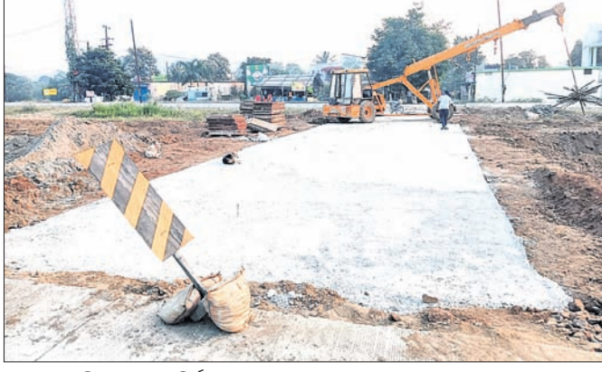
କଲ୍ୟାଣ ନେଟିକାଳିଠାରେ ନିର୍ମାଣ ହେଉଥିବା ଅକ୍ଟରପାସ୍।

ଅନୁଗୋଳ ଜିଲ୍ଲା କଳଶାରନଗର ରୁକ୍ମର ବ୍ୟବସାୟିକ କେନ୍ଦ୍ରସ୍ଥଳ ବଜାଣ ବଜାରର ବ୍ୟବସାୟୀମାନଙ୍କ ତିନି ବର୍ଷକୁ କଲ୍ୟାଣରେ ୫୫୫୦୮. ଜାତୀୟ ରାଜପଥ ଉପରେ ଫ୍ଲାଟୱାର୍କ୍ରିକ୍ ନିର୍ମାଣ ହେଉଥିବାବେଳେ ତଳେ ଯାତାୟତ ପାଇଁ ମାତ୍ର ଗୋଟିଏ ଅକ୍ଟରପାସ୍ କରାଯାଇଛି। ଯଦି ଅକ୍ଟରପାସ୍ ସଂଖ୍ୟା ୩୩ ବଡ଼ା ନ ଯାଏ ତାହେଲେ ଏହି ବ୍ୟବସାୟିକ ପୋଷ୍ଟକ୍ଷମତର ବ୍ୟବସାୟୀମାନେ ଅକ୍ଟରପାସ୍ ଶତାଧିକ ବ୍ୟବସାୟୀ ଯିବି ସହିତେ। ବଜାରରେ ଯାତାୟତ ବାଧାପ୍ରାପ୍ତ ହେବ। ତେଣୁ ଏଠାରେ ୩ଟି ଅକ୍ଟରପାସ୍ ନିର୍ମାଣ ପାଇଁ ବହୁ ପୂର୍ବରୁ ବଜାଣବାସୀ ଦାବି କରିଆସିଛନ୍ତି। ପ୍ରଶାସନ, ବିଧାନସଭା ଦାବିପତ୍ର ଦେଇଛନ୍ତି। ହେଲେ ଏଯାଏଁ ସେ ଦିଗରେ ପଦକ୍ଷେପ ନିଆଯାଇ ନାହିଁ। ଏପରି କି ବିଧାନସଭା ନିର୍ଦ୍ଦେଶକୁ