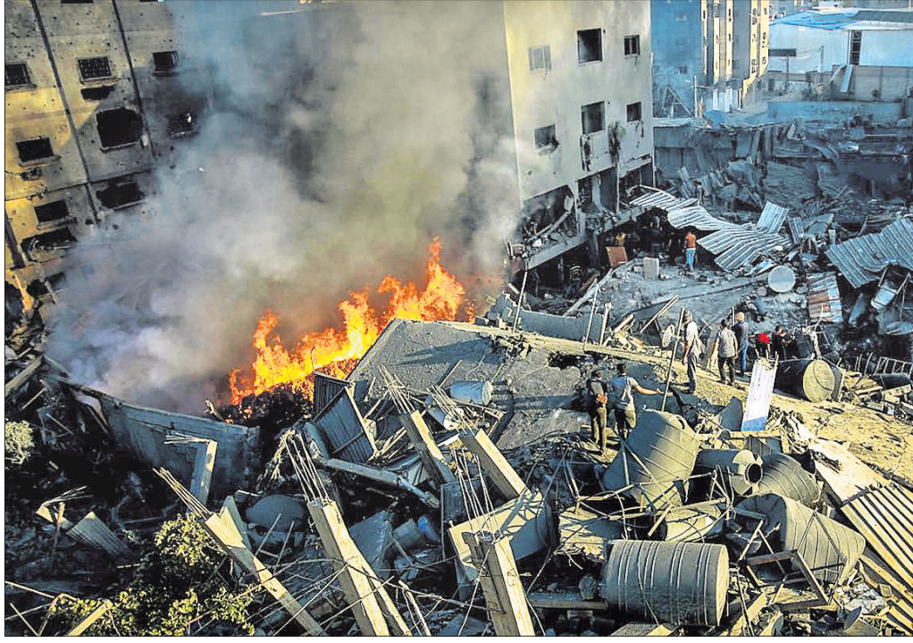
ଗାଜାସ୍ତ୍ରୀର ଏକ ଉପାଡ଼ ଅଞ୍ଚଳରେ ଇସ୍ରାଏଲ୍ ସେନାର ବୋମାପାଡ଼ ।