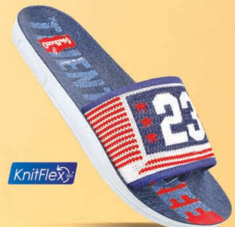
[ WG5477 | ₹ 299.00* ]

*MRP (inclusive of all taxes) mentioned is price per pair. For sizes - Gents (06X10) & Ladies (05X09)