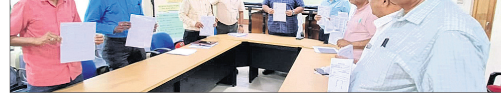
ଡିଠା ଭୋଟର ତାଲିକାକୁ ଉନ୍ନୋତନ କରାଯାଇଛି।