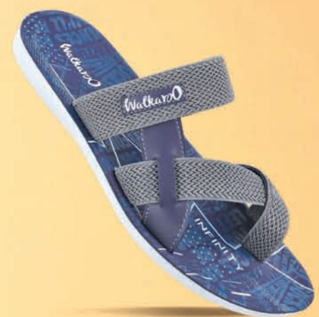
[ WG5515 | ₹ 299.00* ]