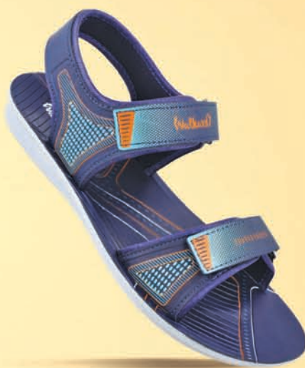
[ WG5783 | ₹ 329.00* ]