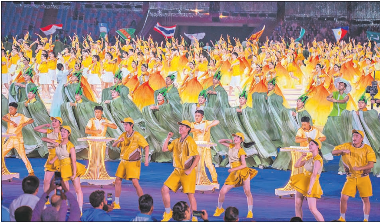
ହାଇଡ୍ରାବାଦରେ ଶନିବାର ଏସିଆନ୍ ପାରା ଗେମ୍ସ ଉଦ୍‌ଘାଟନା ଉତ୍ସବରେ ରଜାରାଜ କାର୍ଯ୍ୟକ୍ରମ।