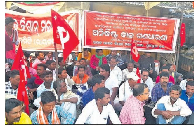
କିସାନ ମନ୍ଦିରର ସଭା ପସରୁ ଧାରଣାରେ ବସିଥିବା କର୍ମଚାରୀ।

ପୁନିଗଡ଼ା, ୨୮।୧୦(ରାଧେଶ୍ୟାମ ଅଗ୍ରୱାଲ) ରାୟଗଡ଼ା ଜିଲ୍ଲା ପୁନିଗଡ଼ା ବ୍ଲକ ପାଠଶାଳା ପଞ୍ଚାୟତରେ ଏମ୍‌ଜିଏମ୍‌ଆର୍‌ଇଜିଏସ୍‌ରେ ହୋଇଥିବା ଦୁର୍ନୀତିର ଭିଜିଲାସ୍ ତଦନ୍ତ ଆରମ୍ଭ ହୋଇଛି।