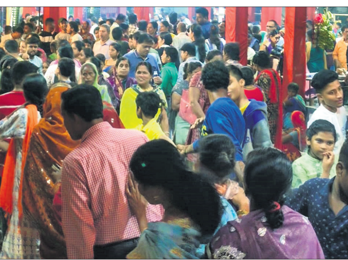
ମନ୍ଦିରରେ ଭକ୍ତଙ୍କ ଭିଡ଼।

ବ୍ରହ୍ମପୁର ଗୋଷାଣୀ ନୂଆଗାଁର ପ୍ରସିଦ୍ଧ ମା' କାଳୁଆ ଠାକୁରାଣୀ ଯାତ୍ରା ଶନିବାର ତଥା କୁମାର ପୂର୍ଣ୍ଣିମାରେ ସମାପନ ହୋଇଯାଇଛି। ଆଶ୍ୱିନ ମହାଳୟା ଅମବାସ୍ୟା ରାତିରୁ ଆରମ୍ଭ ହୋଇଥିବା ଏହି ଯାତ୍ରା ୧୫ ଦିନ ଧରି ଅନୁଷ୍ଠିତ ହୋଇଥିଲା। ଚନ୍ଦ୍ରଗ୍ରହଣ ଯୋଗୁ ଅତି ସମ୍ଭାବ୍ୟରେ କାଳୁଆଙ୍କ ଆକାଶିୟ ଯାତ୍ରା ହୋଇନଥିଲା ଏବଂ ପୂଜା ମଣ୍ଡପରେ ତାଙ୍କ ପକାଯାଇଥିଲା। ଶନିବାର ଭୋର ୪ଟାରେ ବାହୁଡ଼ାଣି ଯାତ୍ରା ଆରମ୍ଭ କରାଯାଇଥିଲା। ସୂତନାଯୋଗ୍ୟ ମହାଳୟା ଅମବାସ୍ୟାରେ ନିକ୍ଷେପ ମନ୍ଦିରରୁ ବିରାଟ ପଟୁଆରରେ ମା'ଙ୍କୁ ପୂଜା ମଣ୍ଡପକୁ ଅଣାଯାଇଥିଲା। ବ୍ରହ୍ମପୁର ବୁଡ଼ା ଠାକୁରାଣୀ ଯାତ୍ରାରେ ପ୍ରତ୍ୟହ ରାତ୍ର ବଡ଼ ଓ ସାନବଜାର ଏବଂ ପୁରୁଣା ବ୍ରହ୍ମପୁର ଲଲାକାରେ ସାହିମାନଙ୍କରେ ଘଟ ପରିକ୍ରମା ହୋଇଥାଏ। ତେବେ କାଳୁଆ ଯାତ୍ରାର ପରମ୍ପରା ନିଆରା। କାଳୁଆ କେବଳ ପୂଜା ମଣ୍ଡପରେ ଭକ୍ତଙ୍କୁ ଦର୍ଶନ