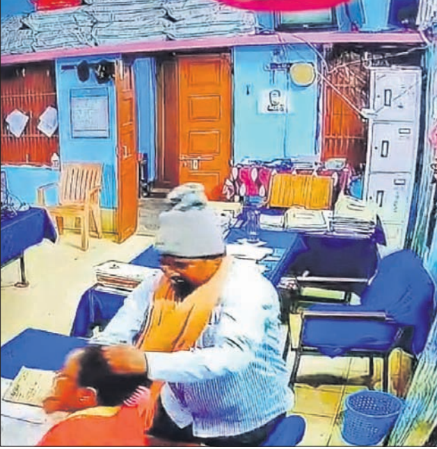
ଅଭିଯୁକ୍ତ ଥାନା ଅଧିକାରୀଙ୍କ ଗଳା କାଟୁଥିବା ସିଦ୍ଧିଚିତ୍ରି ଦୃଶ୍ୟ।