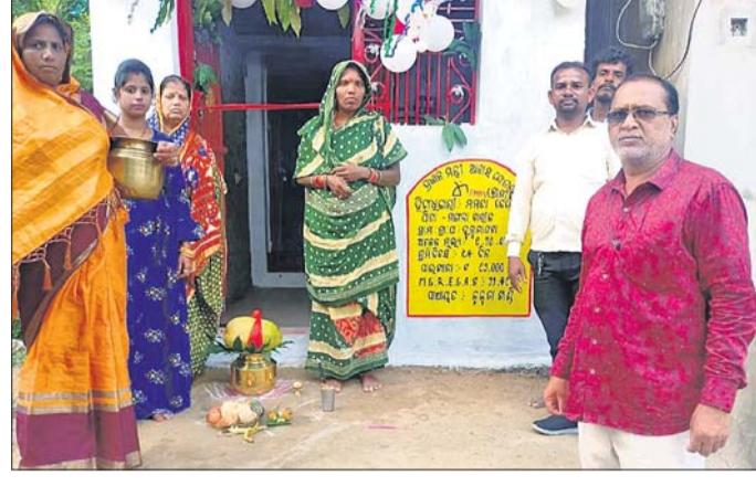
ଗୃହ ପ୍ରବେଶ ଉତ୍ସବ।

କରାଯାଇଥିଲା। ଆହୁରି ଜଣାଯାଇଛି ଯେ ନିର୍ଦ୍ଧାରିତ ୪ ମାସ ମଧ୍ୟରେ ଉକ୍ତ ଆବାସ ରୂପକର ନିର୍ମାଣ ସରିଥିବାରୁ ପ୍ରତ୍ୟେକ ହିତାଧିକାରୀଙ୍କୁ ୨୦ ହଜାର ଟଙ୍କା ଲେଖାଏଁ ସ୍ୱତନ୍ତ୍ର ପ୍ରୋସ୍ତାହନ ରାଶି ରାଜ୍ୟ ସରକାରଙ୍କ ପକ୍ଷରୁ ପ୍ରଦାନ କରାଯିବ ବୋଲି ସୂଚନା ଦିଆଯାଇଛି। ପ୍ରଧାନମନ୍ତ୍ରୀ ଆବାସ ଯୋଜନାରେ ଆବାସ ନିର୍ମାଣ ପାଇଁ ପରିତା ସୂଚନା ଦେବା ସହ ଶୁଭେଚ୍ଛା ଜଣାଇଛନ୍ତି। ଏପରିକି ଉକ୍ତ ଆବାସରୁପକ ମାତ୍ର ୪ ମାସ ମଧ୍ୟରେ ନିର୍ମାଣ କାର୍ଯ୍ୟ ଶେଷ ହୋଇଥିଲା। ଏହି ପରିବେଷଣରେ ବଶହତା ପୂଜାରେ ନୂତନ ଭାବେ ନିର୍ମିତ ଆବାସରେ ହିତାଧିକାରୀଙ୍କ ପରିବାରଙ୍କ ପାଇଁ ସ୍ୱତନ୍ତ୍ର ଗୃହ ପ୍ରବେଶ ଉତ୍ସବର ଅବସ୍ଥାରେ ଦୁନିଆଙ୍କ ମୃତ୍ୟୁ ଘଟିଥିଲା।