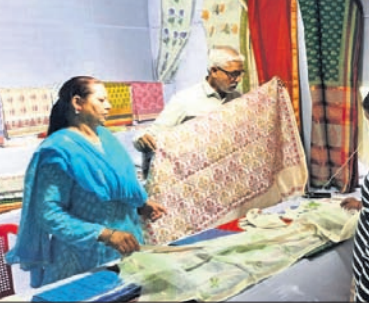
ମଧ୍ୟପ୍ରଦେଶ ସରକାରଙ୍କ ଦ୍ୱାରା ଚଳୁଥିବା ମଧ୍ୟପ୍ରଦେଶ ହସ୍ତତନ୍ତ ଓ ହସ୍ତଶିଳ୍ପ ମହୋତ୍ସବ ଚଳିଛି। ଏହା ୩୧ ତାରିଖ ପର୍ଯ୍ୟନ୍ତ ଏହି ମହୋତ୍ସବ ଚଳିବ। ଏହା ୩୧ ତାରିଖ ପର୍ଯ୍ୟନ୍ତ ଏହି ମହୋତ୍ସବ ଚଳିବ। ଏହା ୩୧ ତାରିଖ ପର୍ଯ୍ୟନ୍ତ ଏହି ମହୋତ୍ସବ ଚଳିବ।

ଏବଂ ମହିଳାଙ୍କ ପାଇଁ ଚର୍ଯ୍ୟ କୃତ୍ତି, ପାଲାଇ, ମାଲିରେ ତିଆରି ଅଳଙ୍କାର ସହ ଅନ୍ୟାନ୍ୟ ମନୋହରୀ ସାମଗ୍ରୀ ମଧ୍ୟ ମିଳୁଛି। ମଧ୍ୟପ୍ରଦେଶର ବିଭିନ୍ନ ପ୍ରାନ୍ତରୁ ପ୍ରାୟ ୨୫ ଜଣ କାରିଗର ସେମାନଙ୍କର ପାରମ୍ପରିକ କଳାକୃତି ଉତ୍ସାହ ପ୍ରଦର୍ଶନ ପାଇଁ ଆସିଛନ୍ତି। ଉତ୍ସାହପୂର୍ଣ୍ଣ ଭାବେ ଏହି ମହୋତ୍ସବ ପ୍ରଦର୍ଶନ କରିବା ସହ ରାଜ୍ୟର କାରିଗରମାନଙ୍କୁ ବଜାର ଚାହିଦା ଅଧିକ କରିବାରେ ସାହାଯ୍ୟ କରିବାକୁ ଲକ୍ଷ୍ୟ ରଖାଯାଇଛି। ଏହା ଗ୍ରାହକଙ୍କ ଚାହିଦା ଅନୁଯାୟୀ ସେମାନଙ୍କ ଉତ୍ପାଦକୁ ପରିଚର୍ଚ୍ଚନା କରିବାରେ ସାହାଯ୍ୟ କରିବ।