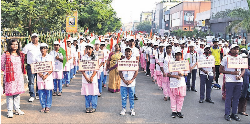
ଓଡ଼ିଶାରେ ସାମିଲ ଛାତ୍ରାଛାତ୍ରୀ ଓ ଅନ୍ୟମାନେ ସଚେତନତା ବାର୍ତ୍ତା ଦେଉଛନ୍ତି ।