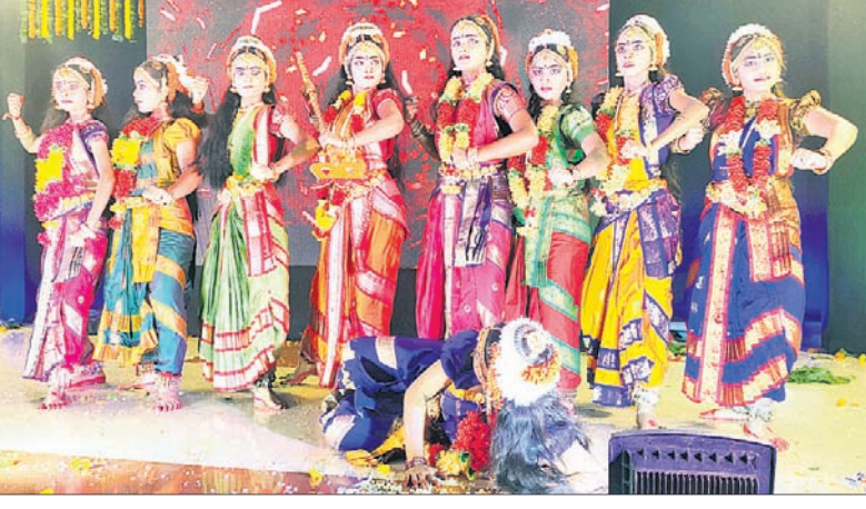
ଆକ୍ଷୁ ନୃତ୍ୟଶିଳ୍ପୀଙ୍କ ଦ୍ୱାରା ନୃତ୍ୟ ପରିବେଷଣ।