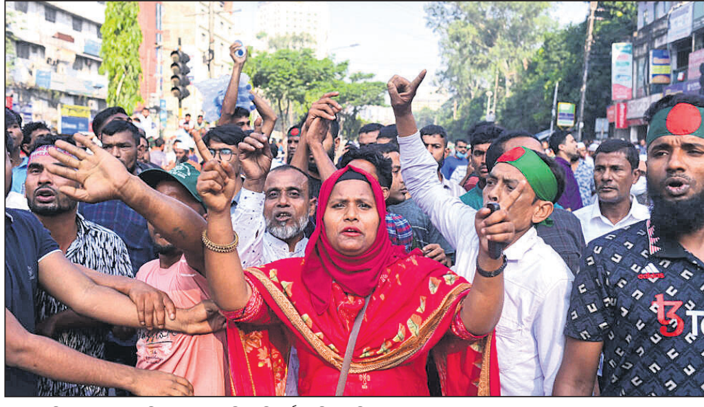
ଶେଖ୍ ହାସିନାଙ୍କ ଲଗ୍ଗିଂସ୍ ଡାକିବେ ବିଏନ୍ପି କର୍ମୀଙ୍କ ବିଶାଳ ବିକ୍ଷୋଭ।

ବାଂଲାଦେଶରେ ଆସନ୍ତାବର୍ଷ ସାଧାରଣ ନିର୍ବାଚନ ହେବାକୁ ଥିବାରୁ ଏକ ଦିନ ବିରୋଧୀ ଆନ୍ଦୋଳନ ଶନିବାର ହିଂସାମୂଳକ ରୂପ ନେଇଛି। ପ୍ରଧାନମନ୍ତ୍ରୀ ଶେଖ୍ ହାସିନାଙ୍କ ଲଗ୍ଗିଂସ୍ ଡାକିବେ ବିରୋଧୀ ଦଳଗୁଡ଼ିକ ପକ୍ଷରୁ ରାଜଧାନୀ ଭାଙ୍ଗାରେ ଜୋରଦାର ବିକ୍ଷୋଭ ପ୍ରଦର୍ଶନ କରାଯାଇଥିଲା। ପ୍ରଧାନମନ୍ତ୍ରୀଙ୍କ ବିରୋଧରେ ଏହା ସବୁଠୁ ବଡ଼ ବିକ୍ଷୋଭ ବୋଲି କୁହାଯାଇଛି। ବିରୋଧୀ ଦଳ କର୍ମୀ ଏବଂ ପୋଲିସ୍ ମଧ୍ୟରେ ସଂଘର୍ଷ ଘଟି ଜଣେ କନ୍ଢୁକେଲ ମୃତ୍ୟୁ ଘଟଣା ସହ ଶତାଧିକ ଆହତ