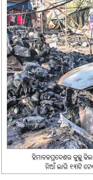
ହିମାଚଳପ୍ରଦେଶର କୁଲୁ ଜିଲ୍ଲାରେ ସଂଘର୍ଷରେ କୁଲୁ ଦଶହରା ଉତ୍ସ ବେଳେ ଶୁକ୍ରବାର ରାତିରେ ନିଆଁ ଲାଗି ୧୩ଟି ଟେଣ୍ଡି ଓ ଏକ କାର୍ ଜଳିଯାଇଛି। ଏହି ଅଭିଯୋଗରେ ୨ ଜଣ ଆହତ ହୋଇଛନ୍ତି।