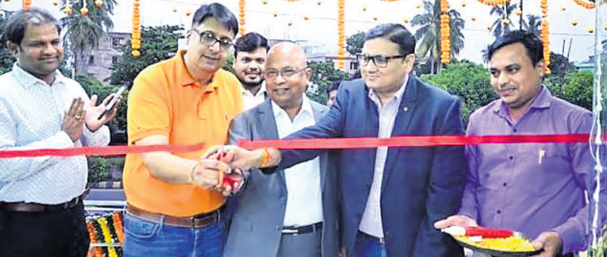
ପୁରୀରେ ଖୋଲିଲା ପାତ୍ର ଇଲେକ୍ଟ୍ରୋନିକ୍ସର ୩୧ତମ ଷ୍ଟୋର। ଏହା କମ୍ପାନୀର ୩୨ତମ ଷ୍ଟୋର ହୋଇଥିବା ବେଳେ ଭୁବନେଶ୍ୱରରେ ସମସ୍ତ ଷ୍ଟୋର ଗାଲାକ୍ସିରେ ଉଦ୍ଘାଟିତ ହେବେ।

ଲାଲଟାନ୍ ଉପକରଣ, ବିଦ୍ୟୁତ୍ ଚାର୍ଜର, ଏନିଏସ୍ ଏବଂ ଲକ୍ଷପତି ପ୍ରାୟ ୧୯୯୯ ଲକ୍ଷ ଲକ୍ଷପତି ପ୍ରାପ୍ତ ହେବେ। ଏଥିରେ ଲକି ଡ୍ର ମାଧ୍ୟମରେ ୨୯୯୯ ଲକ୍ଷ ଲକ୍ଷପତି ପ୍ରାପ୍ତ ହେବେ। ଏଥିରେ ଲକି ଡ୍ର ମାଧ୍ୟମରେ ୨୯୯୯ ଲକ୍ଷ ଲକ୍ଷପତି ପ୍ରାପ୍ତ ହେବେ। ଏଥିରେ ଲକି ଡ୍ର ମାଧ୍ୟମରେ ୨୯୯୯ ଲକ୍ଷ ଲକ୍ଷପତି ପ୍ରାପ୍ତ ହେବେ।