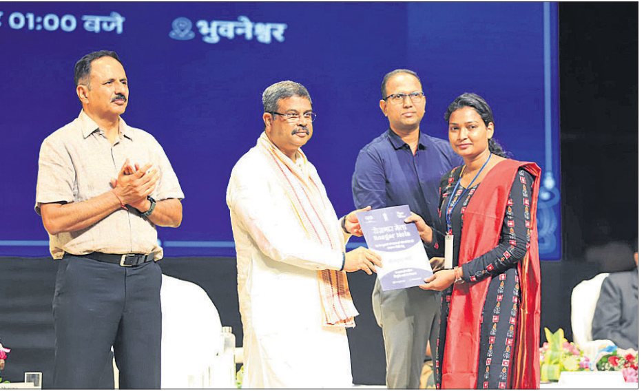
ଭୁବନେଶ୍ୱରରେ 'ରାଷ୍ଟ୍ରୀୟ ରୋଜଗାର ମେଳା'ର ଶୁଭାରମ୍ଭ ଅବସରରେ କେନ୍ଦ୍ରମନ୍ତ୍ରୀ ଧର୍ମେନ୍ଦ୍ର ପ୍ରଧାନ ଜଣେ ପ୍ରାର୍ଥୀଙ୍କୁ ନିୟୁକ୍ତିପତ୍ର ପ୍ରଦାନ କରୁଛନ୍ତି।