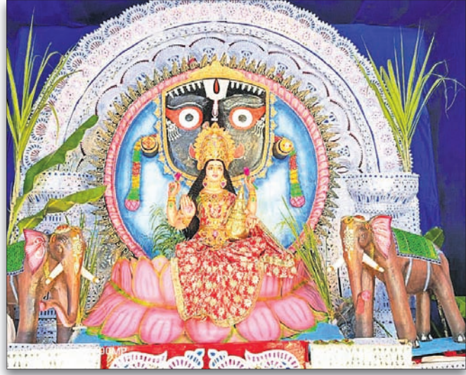
ପାରଳାଖେମୁଣ୍ଡି ଭଞ୍ଜାରି ସାହି ଛକ