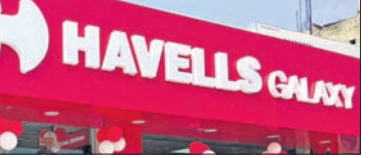
ହାଭେଲ୍ସ ଗାଲାକ୍ସି ଷ୍ଟୋର ଉଦ୍ଘାଟିତ ହେଉଛି। ଏହା କମ୍ପାନୀର ୩୨ତମ ଷ୍ଟୋର ହୋଇଥିବା ବେଳେ ଭୁବନେଶ୍ୱରରେ ସମସ୍ତ ଷ୍ଟୋର ଗାଲାକ୍ସିରେ ଉଦ୍ଘାଟିତ ହେବେ।

ଲାଲଟାନ୍ ଉପକରଣ, ବିଦ୍ୟୁତ୍ ଚାର୍ଜର, ଏନିଏସ୍ ଏବଂ ଲକ୍ଷପତି ପ୍ରାୟ ୧୯୯୯ ଲକ୍ଷ ଲକ୍ଷପତି ପ୍ରାପ୍ତ ହେବେ। ଏଥିରେ ଲକି ଡ୍ର ମାଧ୍ୟମରେ ୨୯୯୯ ଲକ୍ଷ ଲକ୍ଷପତି ପ୍ରାପ୍ତ ହେବେ। ଏଥିରେ ଲକି ଡ୍ର ମାଧ୍ୟମରେ ୨୯୯୯ ଲକ୍ଷ ଲକ୍ଷପତି ପ୍ରାପ୍ତ ହେବେ। ଏଥିରେ ଲକି ଡ୍ର ମାଧ୍ୟମରେ ୨୯୯୯ ଲକ୍ଷ ଲକ୍ଷପତି ପ୍ରାପ୍ତ ହେବେ।