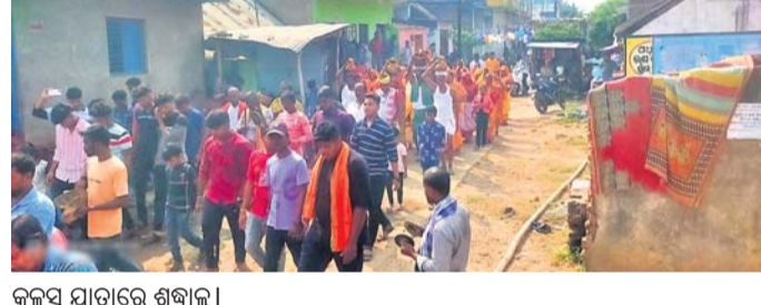
କଳସ ଯାତ୍ରାରେ ଶ୍ରଦ୍ଧାଳୁ।