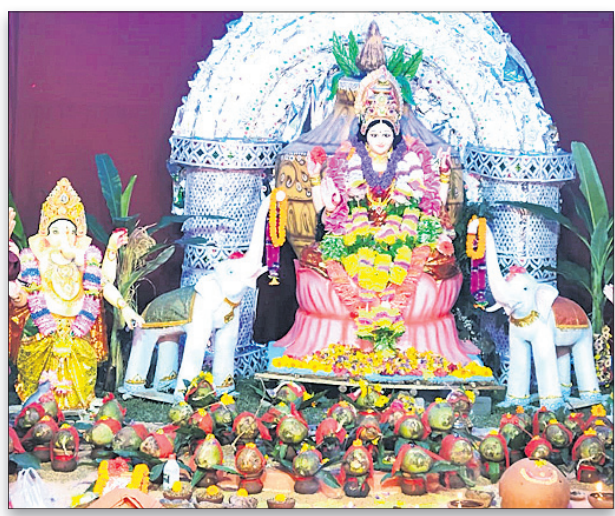
କନ୍ଧମାଳ ଲଲା ଚି. ଉଦୟଗିରି