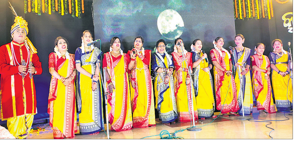
କଣ୍ଠଶିଳ୍ପୀଙ୍କ ଦ୍ୱାରା ସଂଗୀତ ପରିବେଷଣ।