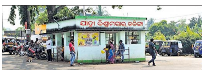
କଳିଙ୍ଗା ପ୍ରତ୍ୟେକ ଦିନ ଏହି ସ୍ଥଳ ବେଳେ ଶହ ଶହ ବ୍ୟକ୍ତି ଯିବା ଆସିବା କରିବା ସଙ୍ଗେ ସଙ୍ଗେ ଶହ ଶହ ମାଲବାହି ଟ୍ରକ୍, ମିନି ଟ୍ରକ୍ ଏବଂ ମିନି ବସ୍ ଚାଲି ଯାଉଥିବା ବେଳେ ପ୍ରଶାସନ ପକ୍ଷରୁ ଏହି ସ୍ଥଳ ନିମନ୍ତେ କୌଣସି ବ୍ୟବସ୍ଥା ନଥିବା ଅଞ୍ଚଳବାସୀ

ଜି.ଉଦୟଗିରି, ୨୮୧୦ (ଶିଶିର ପଞ୍ଚମାୟକ) ଗଞ୍ଜାମ ଓ କନ୍ଧମାଳ ଜିଲ୍ଲାର ପ୍ରବେଶ ଦ୍ୱାର ଓ ଜିଲ୍ଲାର ପ୍ରମୁଖ ପର୍ଯ୍ୟଟନ ସ୍ଥଳ କଳିଙ୍ଗାଠାରେ ଶୌଚାଳୟ ନଥିବା ଏବଂ ପାନୀୟ ଜଳ ଯୋଗାଣରେ ଅବ୍ୟବସ୍ଥା ଯୋଗୁଁ ପର୍ଯ୍ୟଟକମାନେ ଅସୁବିଧାରେ ପଡୁଛନ୍ତି। ପୂର୍ବ କଳିଙ୍ଗା ସ୍ଥଳରେ ଭବାନୀପାଟଣା, ବଳାଙ୍ଗୀର ଓ ବ୍ରହ୍ମପୁର ପାଇଁ ରାସ୍ତା ଥିବା ଯୋଗୁଁ ଏହି ସ୍ଥଳ ସବୁବେଳେ ଜନଗହଳ ହୋଇଥିବା ବେଳେ ପ୍ରତ୍ୟେକ ଦିନ ଶହ ଶହ ଲୋକ ନିକଟିକ ଗନ୍ତବ୍ୟକ୍ଷେତ୍ରକୁ ଯିବା ଆସିବା କରିବା ନିମନ୍ତେ ଏହି ସ୍ଥଳରେ ବସକୁ ଅପେକ୍ଷା