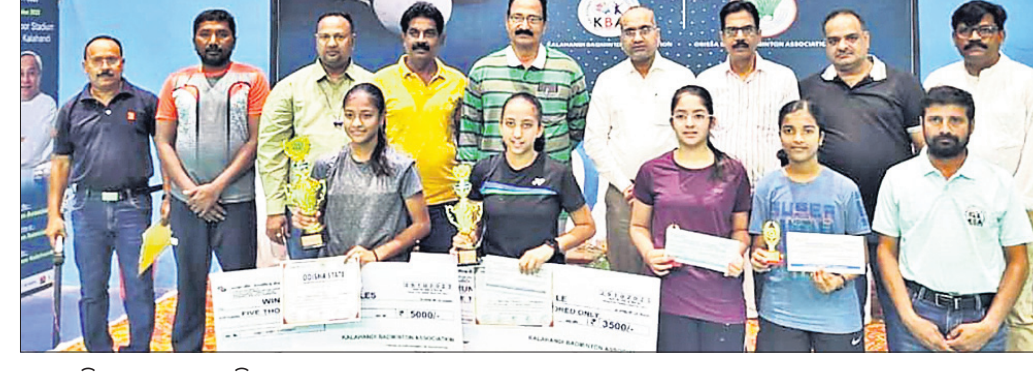
କୃତୀ ପ୍ରତିଯୋଗୀଙ୍କ ସହ ଅତିଥିମାନେ।