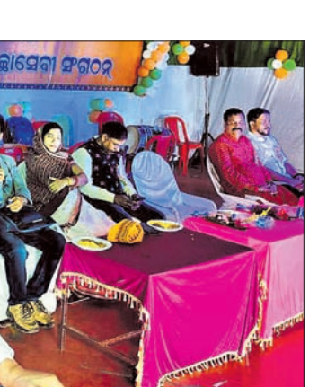
ବଲାଙ୍ଗୀର ସ୍ୱେଚ୍ଛାସେବୀ ସଙ୍ଗଠନର ସମର୍ପଣ ଉତ୍ସବରେ ମଞ୍ଚାସନ ଅତିଥି।