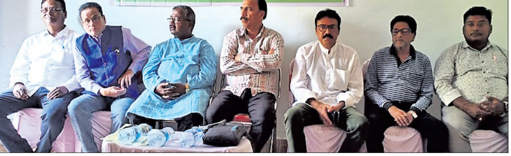
ବୈଠକରେ ଏନ୍‌ଏଫ୍‌ଆଇଟିମ୍ପୁର କର୍ମକର୍ତ୍ତା ।

ଦରବାର ଓ ବିଭିନ୍ନ ସାଂସ୍କୃତିକ ଦଳ ନୂତନ ପରିବେଷଣ କରିଥିଲେ । ସୂଚନାଯୋଗ୍ୟ ଯେ, ଚୂଡ଼ାଖାଇ ପାହାଡ଼ ଓ ଏହାର ସଂସ୍କୃତିକୁ ଓଡ଼ିଶା ସରକାର ପର୍ଯ୍ୟଟନସ୍ଥଳୀର ମାନ୍ୟତା ଦେବାପରେ ୨୦୧୯ମସିହାରେ ଆରମ୍ଭ ହୋଇଥିଲା ଚୂଡ଼ାଖାଇ ତଙ୍ଗର ଲୋକ ମହୋତ୍ସବ । ତଙ୍ଗର ପାଦବେଶରେ ରୁଧିରାଠାରୁ ଆରମ୍ଭ ହୋଇଥିଲା ଚୂଡ଼ାଖାଇ ତଙ୍ଗର ଲୋକ ମହୋତ୍ସବ ।