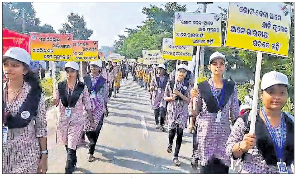
ବାରମହାରାଜପୁରରେ ଖାକାଥନ ଅବସରରେ ଛାତ୍ରାଛାତ୍ରୀ ଓ ଅନ୍ୟମାନେ ।