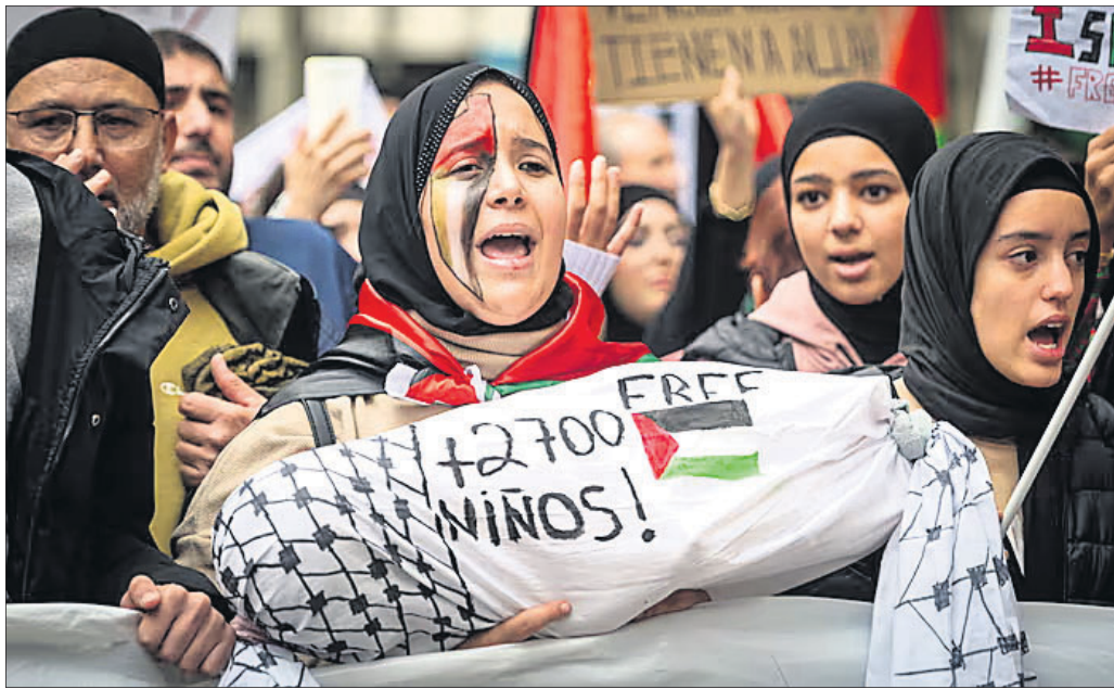
ଯୁଦ୍ଧ ବିରତି ଦାବିରେ ପାଲେଷ୍ଟିନୀୟଙ୍କ ବିକ୍ଷୋଭ ।