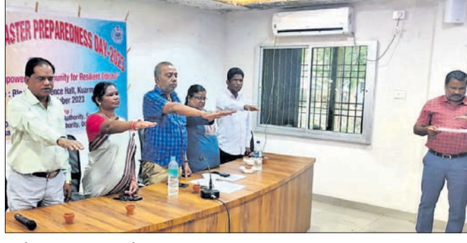
କର୍ମଚାରୀମାନଙ୍କୁ ବିପର୍ଯ୍ୟୟ ପ୍ରସ୍ତୁତି ଦିବସ ଶପଥ ପାଠ କରାଯାଇଛି।

ଭୁବନେଶ୍ୱର ଜିଲ୍ଲା କୁଆଁରମୁଣ୍ଡା ବ୍ଲକ ସମ୍ମିଳନୀ କକ୍ଷରେ ରବିବାର ମହାହର ଓଡ଼ିଶା ବିପର୍ଯ୍ୟୟ ପ୍ରସ୍ତୁତି ଦିବସ ଉପଲକ୍ଷେ ଏକ ସଚେତନତା କାର୍ଯ୍ୟକ୍ରମ ଅନୁଷ୍ଠିତ ହୋଇଥିଲା। ଏଥିରେ ଅଗ୍ରଣୀୟ ବିଭାଗ କର୍ମଚାରୀମାନେ ଉପସ୍ଥିତ ରହି ବାତ୍ୟା, ବନ୍ୟା, ଭୂମିକମ୍ପ, ବଜ୍ରପାତ, ଘରପୋତି ଇତ୍ୟାଦି ସମୟରେ କିଭଳି ନିଜକୁ ପ୍ରସ୍ତୁତ କରାଯାଇ ଉଚ୍ଚ ବିପର୍ଯ୍ୟୟର ଉପସ୍ଥିତ ପୂଜାବିଳା କରାଯାଇ ପାରିବ ସେ ସମ୍ପର୍କରେ ବିଭିନ୍ନ ପ୍ରକାରର କୌଶଳ ପ୍ରଦର୍ଶନ