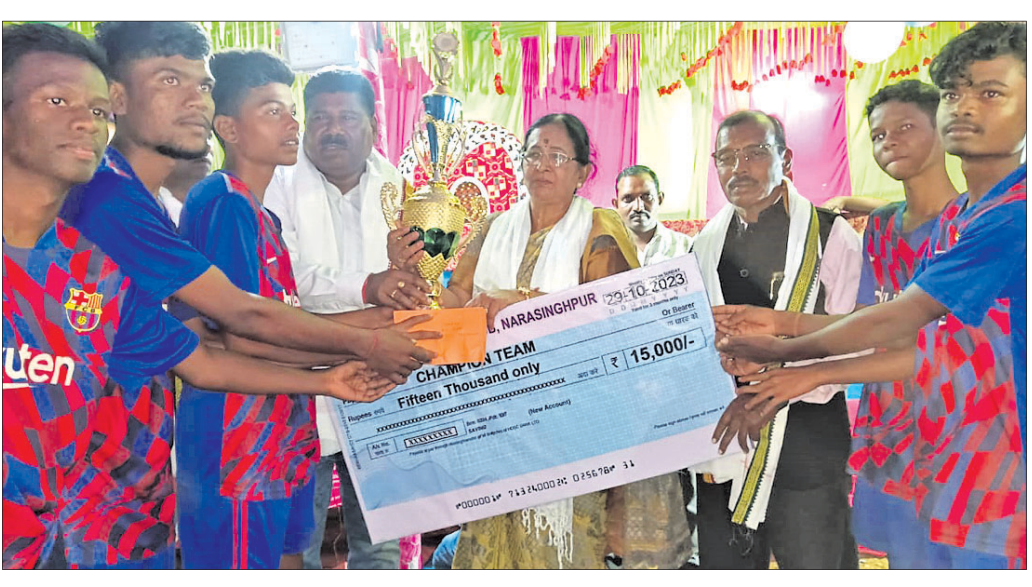
ଫୁଟବଲ୍ ପ୍ରତିଯୋଗିତାର ଖେଳାଳିଙ୍କୁ ପୁରସ୍କୃତ କରାଯାଇଛି।