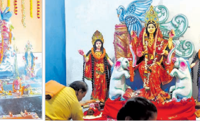
ଭୁବନେଶ୍ୱର ଜିଲ୍ଲା କୁଆଁରମୁଣ୍ଡା ବ୍ଲକ ଅଞ୍ଚଳରେ ଗଜଲକ୍ଷ୍ମୀ ପୂଜା କରୁଥିବା ବେଳେ ବିଭିନ୍ନ ମଣ୍ଡଳରେ ମା'ଙ୍କ ପୂଜା ଶୋଭାପାଉଛି। କୁଆଁରମୁଣ୍ଡା ବ୍ଲକ ଲିଭା ରୋଡ଼ ପୂଜା ମଣ୍ଡଳ (ବାମ), ବେକେନେସ୍ ହଳ ଗଜଲକ୍ଷ୍ମୀ ପୂଜା ମଣ୍ଡଳରେ ମା'ଙ୍କ ପୂଜା କରାଯାଉଛି।