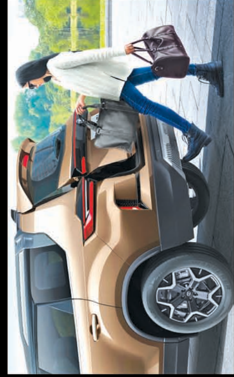
GESTURE CONTROLLED POWERED TAILGATE