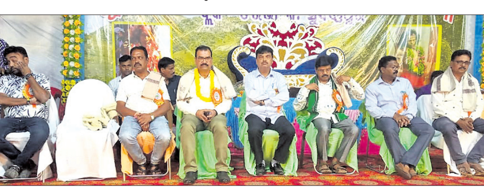
ଚୂଡ଼ାଖାଇ ଲୋକ ମହୋତ୍ସବର ଉଦ୍‌ଯାପନୀ ସନ୍ଧ୍ୟାରେ ମହାସାଧନ ଅତିଥି ।