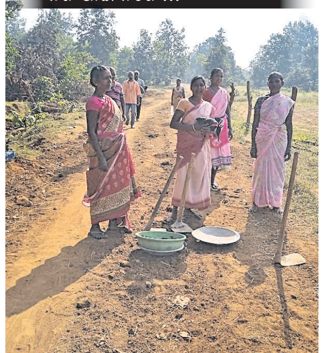
ସମ୍ବଳପୁର ଜିଲ୍ଲା ସୁନ୍ଦରଗଡ଼ ପଞ୍ଚାୟତ ବୃତ୍ତିବେଶୀ ଯୋସେଫପଡା ରାସ୍ତାକୁ ରବିବାର ଗ୍ରାମବାସୀ ଶ୍ରମଦାନ କରି ନିର୍ମାଣ କରୁଛନ୍ତି।