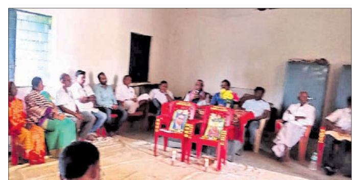
ଆଲୋଚନାଚକ୍ରରେ ଉପସ୍ଥିତ ଅତିଥିମାନେ।

କ୍ଷୟାଧିକ ଟଙ୍କା ସାରି ଆଲୋଚନାକରଣ କରିଥିଲେ। କିନ୍ତୁ ଆଜି ଅନ୍ଧାରରେ ଉକ୍ତ ଛକ ଜିଲ୍ଲା ପ୍ରଶାସନକୁ ମାନିବାକୁ ପଡ଼ିବ। ଏଥିପ୍ରତି ସକାଗ ନ ହେବା ଓ ଧ୍ୟାନ ନ ଦେବା ସମସ୍ତଙ୍କୁ ଚକିତ କରିଛି। ତେଣୁ ଆଗାମୀ ଦିନରେ ତୁରନ୍ତ ଏହାର କିଛି ସମାଧାନ କରା ନ ଯାଏ, ଜନସାଧାରଣ ଆନ୍ଦୋଳନ କରିବେ ବୋଲି ଜଣାପଡ଼ିଛି।