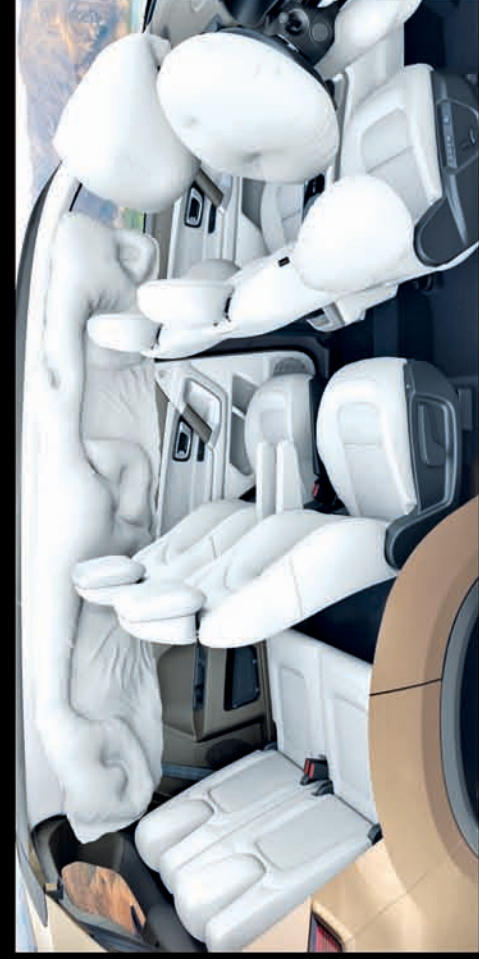
FORTIFIED WITH 7 AIRBAGS