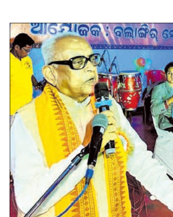
ବଲାଙ୍ଗୀର ସ୍ୱେଚ୍ଛାସେବୀ ସଙ୍ଗଠନର ସମର୍ପଣ ଉତ୍ସବରେ ମଞ୍ଚାସନ ଅତିଥି।