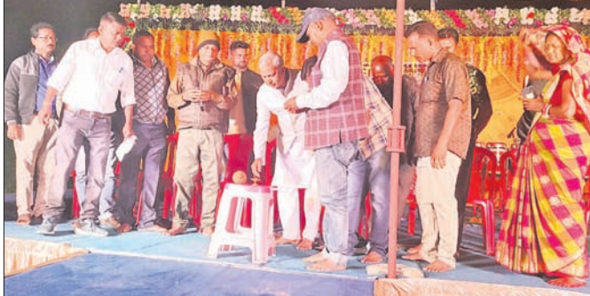
ପାମରା ଗ୍ରାମରେ ଆୟୋଜିତ କାର୍ଯ୍ୟକ୍ରମକୁ ଅତିଥିମାନେ ଉଦ୍‌ଘାଟନ କରୁଛନ୍ତି।