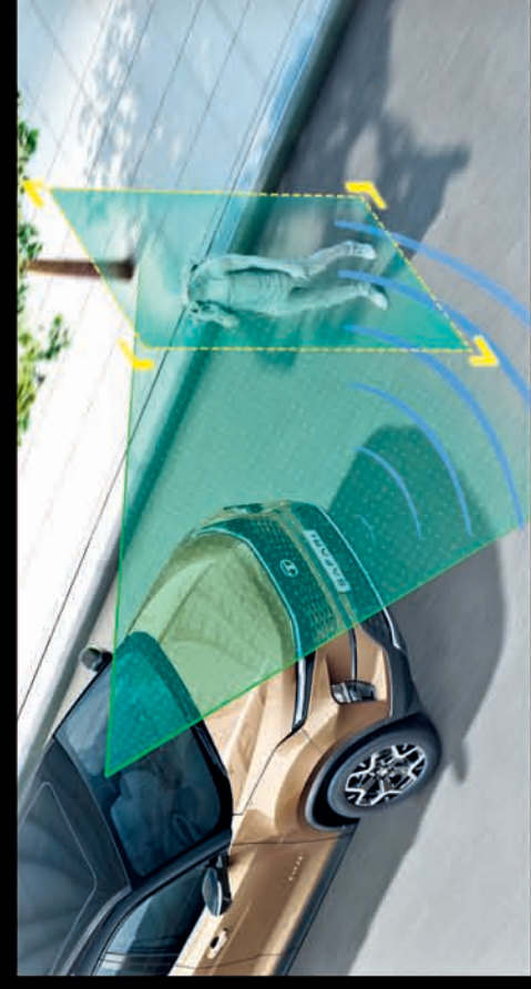
ADVANCED DRIVER ASSISTANCE SYSTEM WITH 11 KEY FUNCTIONS

12.3" (31.24CM) HARMAN™ TOUCHSCREEN INFOTAINMENT VENTILATED FRONT AND SECOND ROW SEATS** LED DRLs WITH WELCOME AND GOODBYE ANIMATION 10 SPEAKER JBL™ MUSIC SYSTEM WITH AUDIOWORX