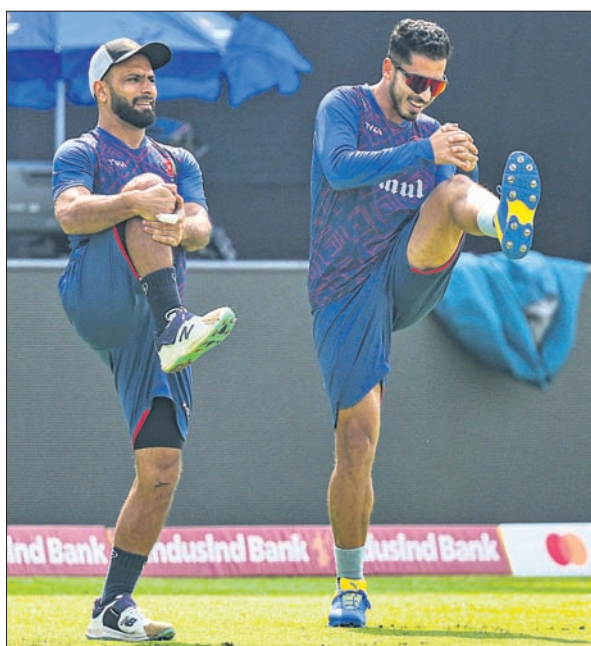
ନେଟ୍ ସେସନରେ ଆଫଗାନିସ୍ତାନର ୨ ଖେଳାଳି ଅଭ୍ୟାସ କରୁଛନ୍ତି ।

ପୁଣେ, ୨୯ ଅକ୍ଟୋବର (ପି.ଟି.) ବିଶ୍ୱକପର ୧୯୯୭ ସଂସ୍କରଣ ଚାମ୍ପିୟନ ଶ୍ରୀଲଙ୍କା ଓ ଅଣ୍ଡର ଡଗ ଆଫଗାନିସ୍ତାନ ସୋମବାର ପୁଣେରେ ପରସ୍ପର ମୁକାବିଲାରେ ଅବତୀର୍ଣ୍ଣ ହେବେ। ଉଭୟ ଦଳ ଦୁଇଟି ଲେଖାଏ ମ୍ୟାଚ୍ ବିଜୟ ହୋଇଥିବା ବେଳେ ପୁଣେରେ ଯେ କୌଣସି ଗୋଟିଏ ଦଳର ଆଗକୁ ବଢିବାର ରାସ୍ତା ଯିବା ହେବ। ଉଭୟ ଦଳ ବିଜୟ ହୋଇ ଆଗକୁ ବଢିବାକୁ ପ୍ରୟାସ କରିବେ। ତେବେ ମ୍ୟାଚ୍‌ଟି ଶ୍ରୀଲଙ୍କା ପାଇଁ ସହଜ ହେବ ନାହିଁ। ଆଫଗାନିସ୍ତାନ ଚଳିତ ବିଶ୍ୱକପରେ ତିନୋଟି ଚାମ୍ପିୟନ ଇଂଲଣ୍ଡ ଓ ପାକିସ୍ତାନ ଭଳି ବଡ଼ ଟିମ୍‌କୁ ପରାସ୍ତ କରି ସମ୍ପୂର୍ଣ୍ଣ ଆମ୍‌ବିଶ୍ୱାସରେ ରହିଛି। ଅନ୍ୟପକ୍ଷରେ ଶ୍ରୀଲଙ୍କା ଦଳ ଆହତ ସମସ୍ୟା ଦେଇ ଗତି କରୁଛି। କ୍ରମାଗତ ୩ ପରାଜୟ ପରେ ଗୋଟିଏ ମ୍ୟାଚ୍ ଜିତିଥିଲେ ମଧ୍ୟ ଦଳ ଆଫଗାନିସ୍ତାନକୁ ହାଲୁକା ଭାବରେ ନେବ ନାହିଁ। ଶୁଖିଳିତ ବୋଲିଂ ଓ ଫିଲ୍ଡିଂ ପାଇଁ ଶ୍ରୀଲଙ୍କା ଏହାର ଶେଷ ମ୍ୟାଚ୍ ଜିତିଥିଲେ ମଧ୍ୟ ସ୍ୱାର୍ ଖେଳାଳି ଲାହିରୁ କୁମାରା ଆହତ ହୋଇ ଚିନ୍ତା ବାଦ ପଡିଛି। ଭେଟେରାନ୍ ଅଲରାଉଣ୍ଡର ଆଖେଲୋ ମାଧୁସକ