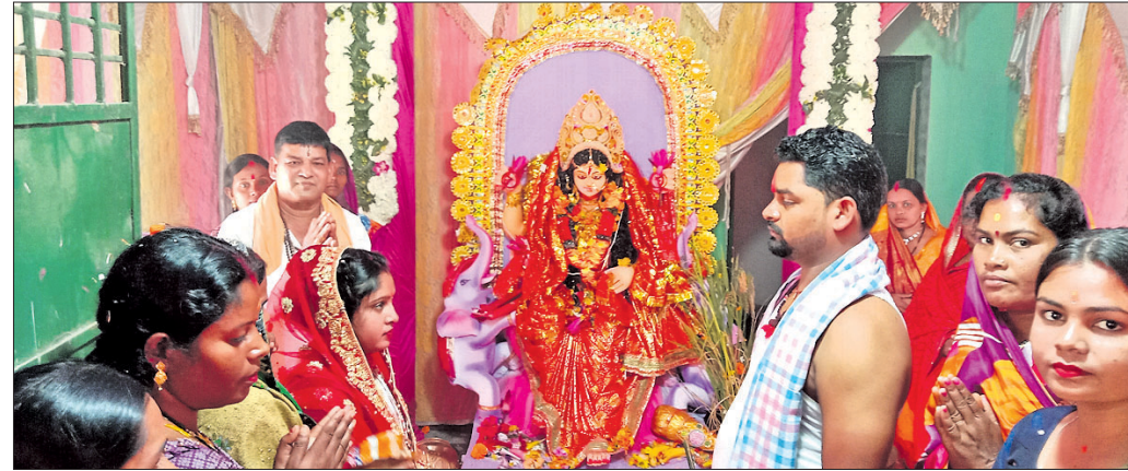
ଲକ୍ଷ୍ମୀପଡ଼ା ଅଞ୍ଚଳରେ ପୂଜାମଣ୍ଡପରେ ଶ୍ରଦ୍ଧାଳୁ ମା' ଗଜଲକ୍ଷ୍ମୀଙ୍କ ଦର୍ଶନ କରୁଛନ୍ତି।

ଭୁବନେଶ୍ୱର ଜିଲ୍ଲା ଲକ୍ଷ୍ମୀପଡ଼ା ବ୍ଲକ ଅନ୍ତର୍ଗତ ବିଭିନ୍ନ ଗ୍ରାମରେ ମା' ଗଜଲକ୍ଷ୍ମୀଙ୍କ ପୂଜା ଅନୁଷ୍ଠିତ ହୋଇଯାଇଛି। ଏଥିପାଇଁ ସମଗ୍ର ଅଞ୍ଚଳ ଚଳଚଞ୍ଚଳ ହୋଇଉଠିଛି। ପୂଜକ ଗୋରଣ ସାଙ୍ଗକୁ ରଞ୍ଜନ ଆଲୋକନାମାରେ ସୁସଜ୍ଜିତ ପ୍ରତ୍ୟେକ ପୂଜାମଣ୍ଡପ। ଚଳିତବର୍ଷ ଚନ୍ଦ୍ର ଗ୍ରହଣ ଯୋଗୁ କେତେକ ପୂଜା ମଣ୍ଡପରେ ଶନିବାର ଅପରାହ୍ନ ୪ଟା ପୂର୍ବରୁ ମା' ଗଜଲକ୍ଷ୍ମୀଙ୍କ ପୂଜା ଅନୁଷ୍ଠିତ ହୋଇଥିବାବେଳେ ଅନ୍ୟ କେତେକ ପୂଜା ମଣ୍ଡପରେ ରବିବାର ପୂଜା ସମ୍ପନ୍ନ ହୋଇଥିଲା। ଲକ୍ଷ୍ମୀପଡ଼ା ପଞ୍ଚାୟତ ଶୁକପାଳି ଗ୍ରାମରେ ରବିବାର ପୂଜା ଅନୁଷ୍ଠିତ ହୋଇଥିଲା। ସକାଳୁ ଗ୍ରାମର ମହିଳାମାନେ ପୂର୍ଣ୍ଣକଳସ ଆଣି ପୂଜା ମଣ୍ଡପକୁ ଆସିଲା ପରେ କଳସ ସ୍ଥାପନ ହେବା ସହିତ ପୂଜାର୍ଚ୍ଚନା କାର୍ଯ୍ୟକ୍ରମ ଅନୁଷ୍ଠିତ ହୋଇଥିଲା। ପୂଜକ