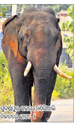
ସୁବର୍ଣ୍ଣପୁର ସହର ପାଣିସିଆଳି ନିକଟରେ ହାତୀ ।

ଜଙ୍ଗଲରୁ ବାହାରି ସୁବର୍ଣ୍ଣପୁର ରାସ୍ତାରେ ବୁଲୁଥିବା ଦନ୍ତାହାତୀ । ଜନବସତିରେ ହଠାତ୍ ହାତୀକୁ ଦେଖି ଲୋକେ ଆତଙ୍କିତ ହୋଇ ପଡିଛନ୍ତି । ଅନୁପକ୍ଷେ ହାତୀକୁ ଜଙ୍ଗଲକୁ ଡାକିବାକୁ ଯାଇ ବନବିଭାଗ ନିୟାନ୍ତ୍ରକ ହୋଇଛି । ଖବର ଲେଖା ହେବା ବେଳକୁ ଦନ୍ତାହାତୀ ସୁବର୍ଣ୍ଣପୁର ବନଖଣ୍ଡ ଅନ୍ତର୍ଗତ ଉଲୁଣ୍ଡା ରେଞ୍ଜର କୋଟସମଲାଇ ଜଙ୍ଗଲରେ ବିଚରଣ କରୁଛି । ସୂଚନା ଅନୁଯାୟୀ ଏକ ପ୍ରାୟ ବୟସ୍କ ଦନ୍ତାହାତୀ ଶନିବାର ବଳାଙ୍ଗୀର ଜିଲ୍ଲା ଲୋଇସିଂହା ଜଙ୍ଗଲରେ ଥିଲା । ସନ୍ଧ୍ୟା ପରେ ଏହି ହାତୀ ସୁବର୍ଣ୍ଣପୁର ଜିଲ୍ଲା ଲଞ୍ଜିପୁର ଫରେଷ୍ଟ