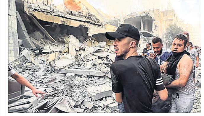
ଗାଜା ସିଟିରେ କଣେ ଆହତକୁ ଉଦ୍ଧାର କରି ନିଆଯାଉଛି ।

ଇସ୍ରାଏଲୀ-ହମାସ୍ ଯୁଦ୍ଧ ଯୋଗୁ ପୁରାଣା ଏବଂ ମାନବୀୟ ଛିନ୍ନିତ ଦେଖାଦେଇଥିବା ଅବନତିକୁ ନେଇ ପ୍ରଧାନମନ୍ତ୍ରୀ ନରେନ୍ଦ୍ର ମୋଦି ଇଣ୍ଡିଆ ରାଷ୍ଟ୍ରପତି ଆବଦେଲ୍ ଫତେହ ଏଲ୍-ସିସିଙ୍କ ସହ ଆଲୋଚନା କରିଛନ୍ତି । ଉକ୍ତ ଅଞ୍ଚଳରେ ଭୂତତ ଶାନ୍ତି ଓ ସୁରକ୍ଷା ଫେରାଇ ଆଣିବାର ଆବଶ୍ୟକତା ଉପରେ ଉଭୟ ସହମତ ହୋଇଛନ୍ତି । ଭୁଲ୍‌ନେତା ଫୋନ୍ ଯୋଗେ ଆଲୋଚନା କରିବା ଅବସରରେ ଆତଙ୍କବାଦ, ହିଂସା ଓ ସାଧାରଣ ନାଗରିକଙ୍କ ମୃତ୍ୟୁକୁ ନେଇ ତତ୍ତ୍ୱା