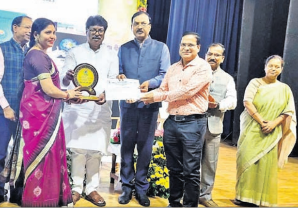
ଜୁନାଗଡ଼ ବ୍ଲକ ଅଧ୍ୟକ୍ଷା, ବିତ୍ତିଠା ମନ୍ତ୍ରାଳୟରୁ ପୁରସ୍କାର ଗ୍ରହଣ କରୁଛନ୍ତି।