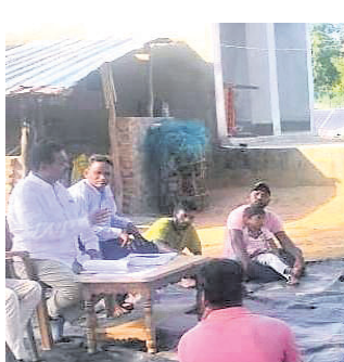
ଆଦିବାସୀ ମହାସଂଘର ବୈଠକରେ ଉପସ୍ଥିତ କର୍ମକର୍ତ୍ତା।