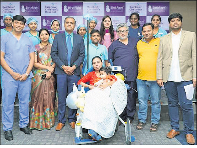
ଭୁବନେଶ୍ୱର, ୨୯୧୦ (ଅନୁରାଧା ମହାରଣା)

ଦିନୋଦିନ ଆମ ସମାଜରେ ରୋଗୀଙ୍କ ସଂଖ୍ୟା ବୃଦ୍ଧି ପାଇଁ ଚିଲ୍ଡ୍ରେନ୍ ହସ୍ପିଟାଲର ଉପସ୍ଥିତି ଉପଯୋଗୀ ହେଉଛି।