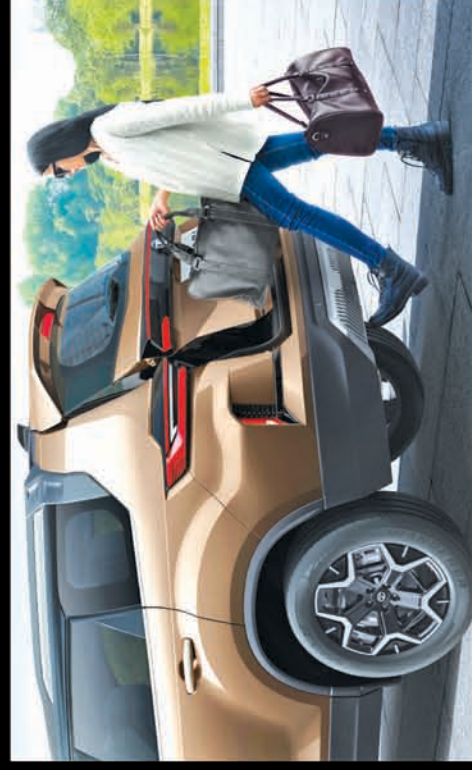
GESTURE CONTROLLED POWERED TAILGATE