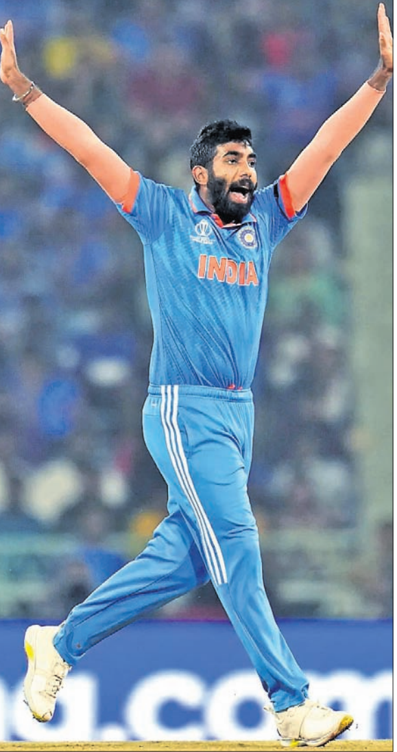
କୋ ରୁଟ୍ ଭଜକେଟ ନେବାପରେ ଭଜକେଟ ଯଶପ୍ରାପ୍ତ ହୁଏ।