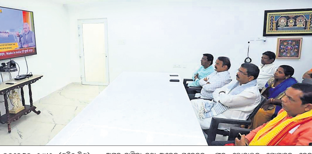
ଭୁବନେଶ୍ୱର, ୨୯୧୦