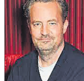
କୋର୍ଟେନି କକ୍ସ, ମାଟ୍ ଲୋଗୁଲ୍, ଲିଆ କୁଡ୍ରୋ ଏବଂ ତାଉରୁସ୍ କିରକ୍‌ସ୍‌ଙ୍କୁ ବିପକ୍ଷରେ ଅଭିଯୋଗ କରିଛନ୍ତି। ଜଣେ ଅଭିନେତା

ଭାବେ ମାଥ୍ୟୁ ଅବିଶ୍ୱସନୀୟ ଉପହାସ ଥିଲେ। ସେ ଖ୍ରୀଷ୍ଟିୟାନ ଚର୍ଚ୍ଚକ ଚେଲ୍‌ସିଜିନ ଟ୍ରୁପ୍ ପରିବାରର ଅଭିଭାବକ ଅଟନ୍ତି। ତାଙ୍କୁ ହାସ୍ୟାଭିନୟ ସାଥୀ ବିଶ୍ୱରେ ଅନୁକୃତ ହେଉଥିଲା, ଯାହାକି ଲିଗାସି ଅନେକଙ୍କ ହୃଦୟରେ ଅମର ହୋଇ ରହିବ ବୋଲି କମ୍ପାନୀ ପକ୍ଷରୁ ଏକ ବିବୃତିରେ କୁହାଯାଇଛି। ମାଥ୍ୟୁ ନିଜ ବାସଭବନରେ ଥିବା ସୁଇଚିଂ ପୁଲ୍‌ରେ ସମସତଃ ବୁଡ଼ିଯାଇ ପ୍ରାଣ ହରାଇଥିବା ସନ୍ଦେହ କରାଯାଇଛି। ତାଙ୍କ ଅକାଳ ମୃତ୍ୟୁର କାରଣ ସମ୍ପର୍କରେ ପୋଲିସ ତଦନ୍ତ ଚଳାଇଛି।