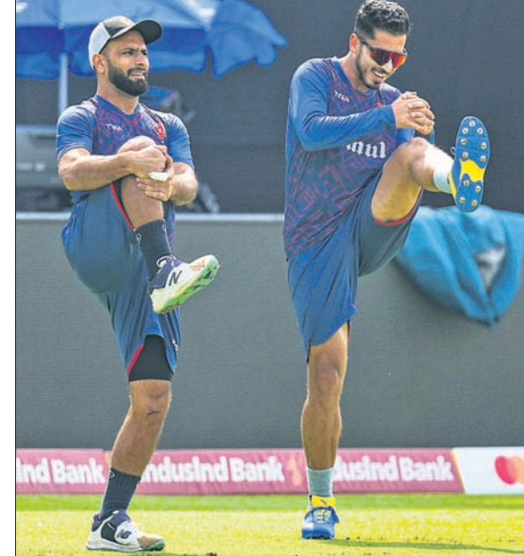
ନେଟ୍ ସେସନରେ ଆଫଗାନିସ୍ତାନର ୨ ଖେଳାଳି ଅଭ୍ୟାସ କରୁଛନ୍ତି।

ପୁଣେ, ୨୯/୧୦ (ପି.ଟି.) ବିଶ୍ୱକପର ୧୯୯୭ ସଂସ୍କରଣ ଚାମ୍ପିୟନ ଶ୍ରୀଲଙ୍କା ଓ ଅଭିଭବ ଆଫଗାନିସ୍ତାନ ସୋମବାର ପୁଣେରେ ପରସ୍ପର ମୁକାବିଲାରେ ଅବତୀର୍ଣ୍ଣ ହେବେ।