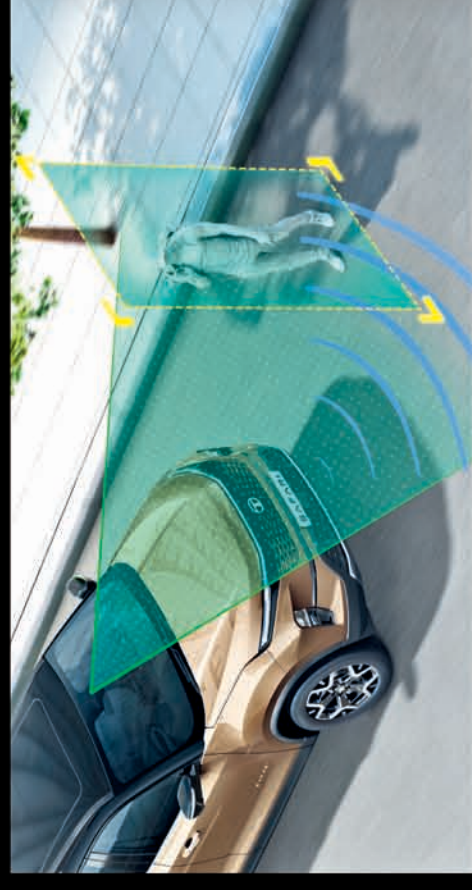
ADVANCED DRIVER ASSISTANCE SYSTEM WITH 11 KEY FUNCTIONS

12.3" (31.24CM) HARMAN™ TOUCHSCREEN INFOTAINMENT VENTILATED FRONT AND SECOND ROW SEATS** LED DRLs WITH WELCOME AND GOODBYE ANIMATION 10 SPEAKER JBL™ MUSIC SYSTEM WITH AUDIOWORX