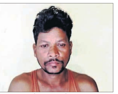
ଅଭିଯୁକ୍ତ ବାପା ଜିଉ ରୁହୁ।

ବର୍ଷକ ପୁଅକୁ କାଢ଼ିକି ମୃତ୍ୟୁ ଘଟିଥିଲା। ସ୍ୱାମୀଙ୍କ ମୃତ୍ୟୁ ପରେ ଝିଅ ଆସି ଘରେ ରହୁଥିଲେ। ମାତ୍ର ଝିଅ ଏବେ ୫ ମାସର ଗର୍ଭବତୀ ଥିବା ଶୁଣିବା ପରେ ଲୋକଲଜ୍ଜା ଭୟରେ ବାପା ନାରକାୟ କାଠ ଘଟାଇଛନ୍ତି। ଗର୍ଭବତୀ ଝିଅଙ୍କ ପେଟକୁ ଗୋଇଁଠା ମାରିବା ସହ ମାତୃ ମାରି ହତ୍ୟା କରିଛନ୍ତି। ଘଟଣାକୁ ଚପାଇଦେବାକୁ ଉଦ୍ୟମ କରୁଥିବା ବେଳେ ପୋଲିସ୍ ଜାଣିପାରି ମୃତଦେହ ଜବତ କରିଛି। ଅଭିଯୁକ୍ତ ବାପାଙ୍କୁ ଗିରଫ କରି ଚବନ୍ଦ ଆରମ୍ଭ କରିଛି। ଏଭଳି ଘଟଣା ମୟୂରଭଞ୍ଜ ଜିଲ୍ଲା କସ୍ତିପଦା ଥାନା ଅଧୀନ ପଥରଖଣି ଗ୍ରାମରେ ଘଟିଛି। ଯାହା ଅଞ୍ଚଳରେ ଚର୍ଚ୍ଚାର ବିଷୟ ପାଲଟିଛି।