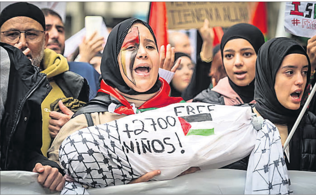
ହମାସ ବିରୁଦ୍ଧ ଦାବିରେ ପାଲେଷ୍ଟିନୀୟଙ୍କ ବିକ୍ଷୋଭ।

ହମାସର ଅଣରଗ୍ରାହଣ ଟାର୍ଗେଟ ଉପରେ ଇସ୍ରାଏଲର ବୋମାବର୍ଷା