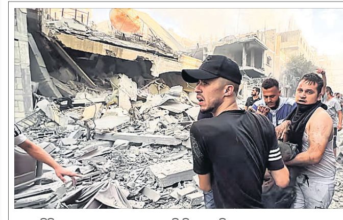
ଗାଜା ସିଟିରେ ଜଣେ ଆହତଙ୍କୁ ଉଦ୍ଧାର କରି ନିଆଯାଉଛି।

ପ୍ରକଟ କରିଥିଲେ। ଗାଜା ଜନସାଧାରଣଙ୍କ ନିକଟରେ ମାନବୀୟ ସହାୟତା ପହଞ୍ଚାଇବା ଉପରେ ଉଭୟ ଗୁରୁତ୍ୱାରୋପ କରିଥିଲେ। ଗତ ୬ ଚାରିକ୍ଷେତ୍ର ହମାସ୍ ଆତଙ୍କବାଦୀମାନେ ଇସ୍ରାଏଲ ଉପରେ ଦେବାକୁ ପାଇ ଇସ୍ରାଏଲ ଗାଜା ଷ୍ଟ୍ରିଟ୍ ଉପରେ ବୋମାଫାଟ୍ କରିବା ସହ ଗୁଳି ମୁହଁକୁ ଗୋଡ଼ାବାର କରିଛି। ପୂର୍ବରୁ ପ୍ରଧାନମନ୍ତ୍ରୀ ଉପରେ ଉଭୟ ସହମତ ହୋଇଛନ୍ତି। ଉଭୟ ଗୋଡ଼ାବାର ଆରମ୍ଭକାରୀ ହିସାବରେ ଉଭୟ ସହମତ ହୋଇଛନ୍ତି। ଉଭୟ ଗୋଡ଼ାବାର ଆରମ୍ଭକାରୀ ହିସାବରେ ଉଭୟ ସହମତ ହୋଇଛନ୍ତି।