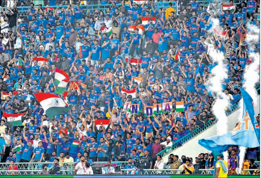
ଭାରତ-ଇଂଲଣ୍ଡ ମ୍ୟାଚ ଅବସରରେ ଦର୍ଶକରେ ଭରପୂର ଲକ୍ଷ୍ଣୋ ସ୍ଥିତିୟମ।

ଲକ୍ଷ୍ଣୋ, ୨୯/୧୦. ଚଳିତ ଦିନିକିଆ କ୍ରିକେଟ ବିଶ୍ୱକପରେ ଚିନ୍ତା ଲକ୍ଷ୍ଣୋର ବିଜୟ ଧାରା ଅବ୍ୟାହତ ରହିଛି। ପୂର୍ବରୁ ଅଷ୍ଟ୍ରେଲିଆ, ଆଫଗାନିସ୍ତାନ, ପାକିସ୍ତାନ, ବାଂଲାଦେଶ ଓ ନ୍ୟୁଜିଲାଣ୍ଡକୁ ହରାଇଥିବା ଭାରତ ରବିବାର ଡିଫେଣ୍ଡିଂ ଚାମ୍ପିୟନ ଇଂଲଣ୍ଡକୁ ୧୦୦ ରନରେ ହରାଇ ଅପରାଜେୟ ରହିଛି।