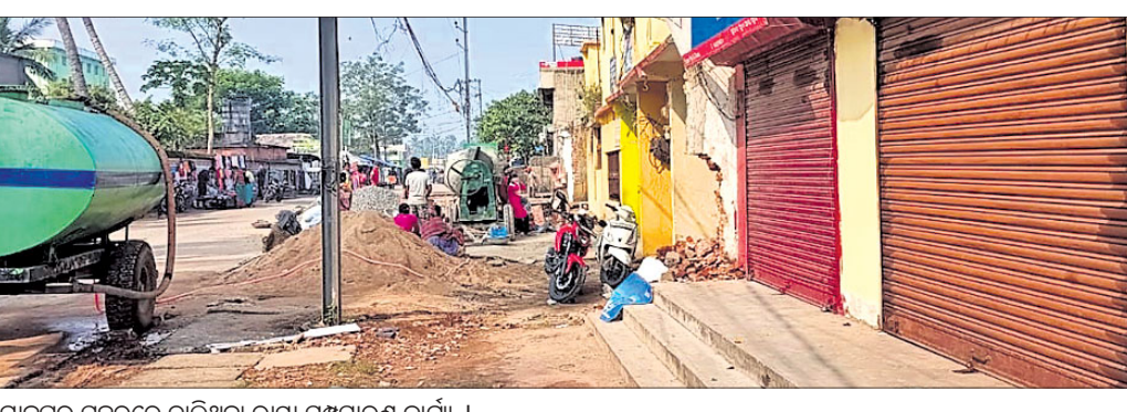
ଯାଜପୁର ସହରରେ ଚାଲିଥିବା ରାସ୍ତା ସମ୍ପ୍ରସାରଣ କାର୍ଯ୍ୟ ।

ଯାଜପୁର ସହରର ରାସ୍ତା ଓସରିଆ ସହ ବିଭିନ୍ନ ଉନ୍ନୟନକର୍ମ କାର୍ଯ୍ୟ ଚାଲିଛି । କେଉଁଠି ମେଡିକାଲ କଲେଜ ରୁହି ନିର୍ମାଣ କାର୍ଯ୍ୟ ଚାଲିଛି ତ ଆଉ କେଉଁଠି ସ୍ତୁତିଭଣ୍ଡା । ଗତ ୫୦ ବର୍ଷ ମଧ୍ୟରେ ଯାହା ବିକାଶ ହୋଇ ନ ଥିଲା ତାହା ଏଇ ହାତଗଣତି କେଜିଏ ବର୍ଷ ମଧ୍ୟରେ ସମ୍ପଦ ହୋଇପାରିଛି । ରାସ୍ତା ପ୍ରଶସ୍ତାକରଣ, ମେଡିକାଲ କଲେଜ ନିର୍ମାଣ ପ୍ରକୃତି ଉନ୍ନୟନ କାର୍ଯ୍ୟ ପାଇଁ ଲୋକଙ୍କ ଯତନ ଅଧିଗ୍ରହଣ କରାଯାଇ କ୍ଷତିପୂରଣ ପ୍ରଦାନ କରାଯାଉଛି । ହେଲେ କେତେକ ପରିବାର ନିଜର ଭିକାମାଟି ହରାଇଥିବା ସତ୍ତ୍ୱେ ଏଯାବତ୍ କ୍ଷତିପୂରଣ ପାଇ ନ ଥିବା ସୂଚନା ମିଳିଛି । ଏହାବଦ୍ଧ ଯାଜପୁର ସହରରେ ଚାଲିଥିବା ବିଭିନ୍ନ ବିକାଶ କାର୍ଯ୍ୟକୁ ସମ୍ପୂର୍ଣ୍ଣରୂପେ ସାଗତ କରାଯାଇଛି । କିନ୍ତୁ ଏହି ବିକାଶର ଦ୍ରାହି ଦେଇ କେତେକ ସରକାରୀ କର୍ମଚାରୀ ବିପୁଳ କୋର୍ଟି ଟଙ୍କା ଲୁଚିବାରେ ଲାଗିଛନ୍ତି । ପୂର୍ଣ୍ଣତଃ ଜମି ଅଧିଗ୍ରହଣ ଦାୟିତ୍ୱରେ ଥିବା ଜଣେ ଅଧିକାରୀ ଓ ତାଙ୍କର ସହଯୋଗୀମାନେ ଏହିସବୁ କାର୍ଯ୍ୟକୁ ମନ୍ତ୍ରୀ ଘଡ଼ାଜ ଓ ଦାନଗଦିର ଲୋକମାନେ ପ୍ରଶଂସା କରିଥିଲେ ।