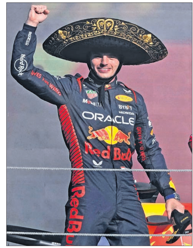
ଟ୍ରଫି ସହ ମାକ୍ସ ଉର୍ଷ୍ଟାପେନ୍।

ମେକ୍ସିକୋ ସିଟି, ୩୦୧୦ (ଏପି) ରେଡବୁଲ୍ ମାକ୍ସ ଉର୍ଷ୍ଟାପେନ୍ ଫର୍ମୁଲାର୍ ପ୍ରତିଯୋଗିତାରେ ସିଟି ଗ୍ରାଁ ପ୍ରି ଜିତିଛନ୍ତି। ସିଟିରେ ଏହା ହେଉଛି ତାଙ୍କର ଚତୁର୍ଥ ୧୬ତମ ବିଜୟ।