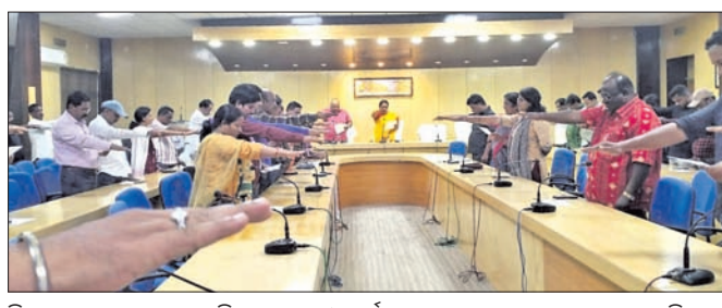
ଜିଲାପାଳ ପାଠୁଳ ପଟ୍ଟାୟାରି ଅଧିକାରୀ ଓ କର୍ମଚାରୀମାନଙ୍କୁ ଶପଥ ପାଠ କରାଉଛନ୍ତି।

ଶପଥପାଠ ଆଭାସୀ ମାଧ୍ୟମରେ କରାଯିବ। ଅର୍ଥାତ୍ ନିଜର ଆଚରଣରେ ଏହି ଅନୁସାଧୀ ଜଗତସିଂହପୁର ଜିଲ୍ଲାରେ କାର୍ଯ୍ୟକ୍ରମ କରାଯାଇଛି। ଏହି ଦିବସ ନିଷ୍ପତ୍ତି ହୋଇଛି। ବ୍ୟବସ୍ଥାରେ ସ୍ୱଚ୍ଛତା ପାଇଁ ମୁଖ୍ୟମନ୍ତ୍ରୀ ନବୀନ ପଟ୍ଟନାୟକଙ୍କ ଦ୍ୱାରା ଦୁର୍ନୀତି ନିବାରଣ ସଚେତନତା