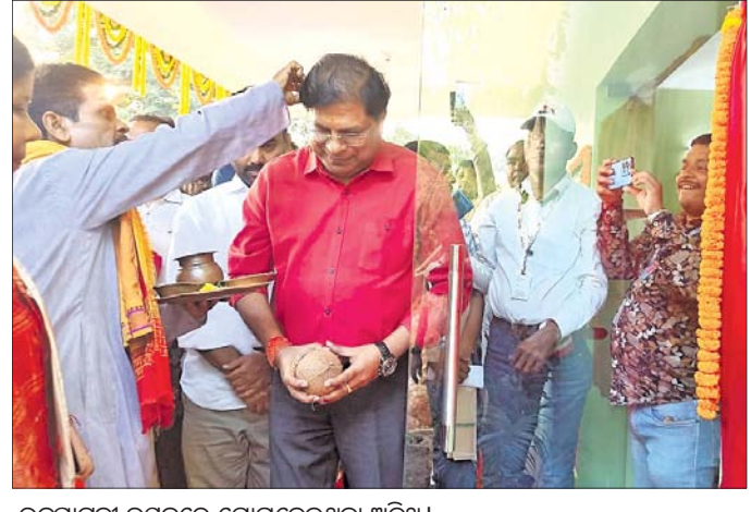
ଉଦ୍‌ଘାଟନା ଉତ୍ସବରେ ଯୋଗଦେଇଥିବା ଅତିଥି ।

କଳିଙ୍ଗନଗର, ୩୦.୧୦ (ଶୁଭାଶିଷ ରାଉତ) : କଳିଙ୍ଗନଗରରୁ ଭିଦିଆ ସ୍ଥିଳ କାରଖାନା ପରିପାର୍ଶ୍ୱ ଉନ୍ନୟନ ଅନୁଦାନରେ ନିର୍ମିତ ହୋଇଥିବା ଦାନଗଦି ଗୋଷ୍ଠୀ ସ୍ୱାସ୍ଥ୍ୟକେନ୍ଦ୍ର ପ୍ରଶାସନିକ ଭବନ ସୋମବାର ଅପରାହ୍ନରେ ଲୋକାର୍ପିତ ହୋଇଛି । ପ୍ରାୟ ୮୫ ଲକ୍ଷ ଟଙ୍କା ଅନୁଦାନରେ ନିର୍ମିତ ଏହି ବୁଲ ମହଲା କୋଠାରେ ଅଧ୍ୟକ୍ଷକଙ୍କ କାର୍ଯ୍ୟାଳୟ, ଜନସମୂହ ପଞ୍ଜୀକରଣ ଓ ମେଡିକାଲ ପ୍ରଶାସନିକ ଦପ୍ତର କାର୍ଯ୍ୟକ୍ଷମ ହୋଇଛି । ଗ୍ରାମ୍ୟ ଉନ୍ନୟନ ମନ୍ତ୍ରୀ ପ୍ରତିରଞ୍ଜନ