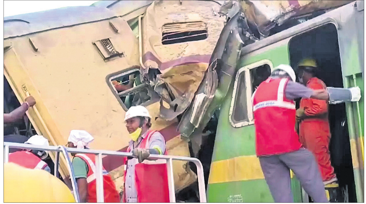
ଉଦ୍ଧାର କାର୍ଯ୍ୟରେ ଅଗ୍ନିଶମ, ଓଡ୍ରାଫ୍ ଓ ଅନ୍ୟ କର୍ମଚାରୀମାନେ ନିଯୋଜିତ ହୋଇଛନ୍ତି ।