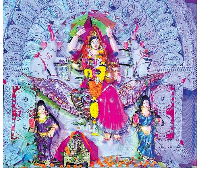
ଗୋଡ଼ିପାଟଣାଠାରେ ପୂଜା ପାଉଥିବା ମା' ଗଜଲକ୍ଷ୍ମୀ ।