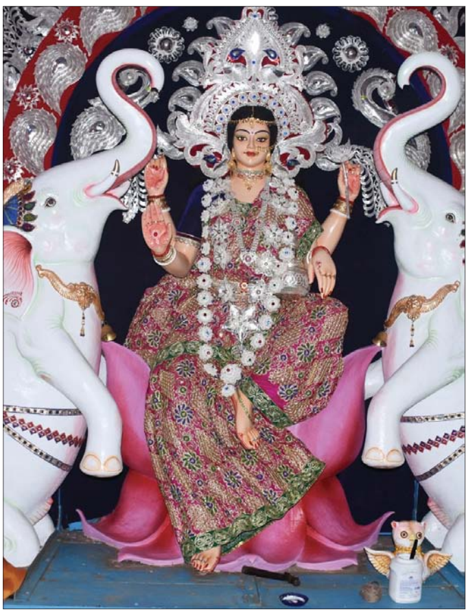
ବିନକାଳ ମଣ୍ଡପରେ ମା' ଗଜଲକ୍ଷ୍ମୀ ।