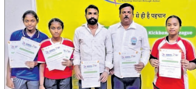
ମହିଳା କିମ୍ବଦନ୍ତୀରେ ସଫଳତା ପାଇଥିବା ଜଗତସିଂହପୁର ୩ ଛାତ୍ରୀ ଓ ଅନ୍ୟମାନେ।