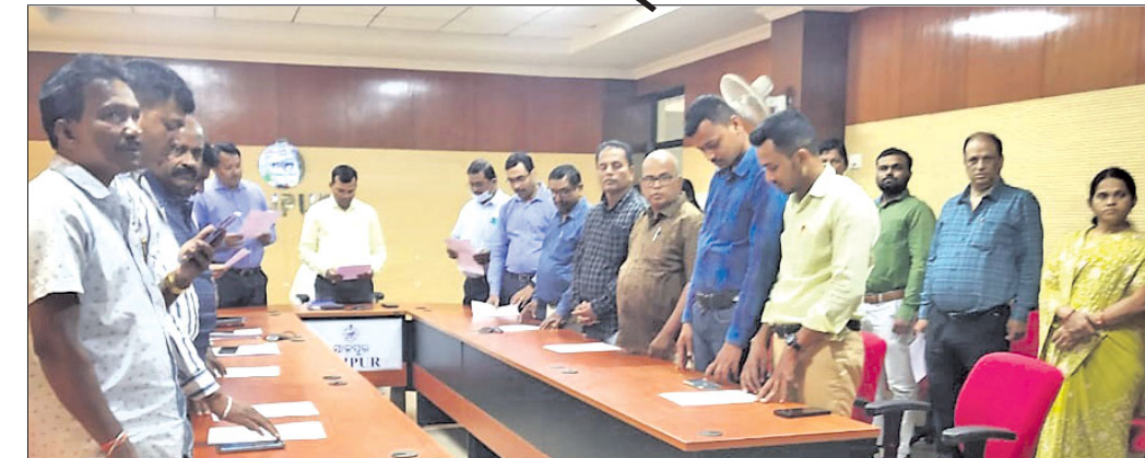
ପ୍ରଶାସନିକ ଅଧିକାରୀମାନେ ଦୁର୍ନୀତି ନିବାରଣ ପାଇଁ ଶପଥ ଗ୍ରହଣ କରୁଛନ୍ତି ।