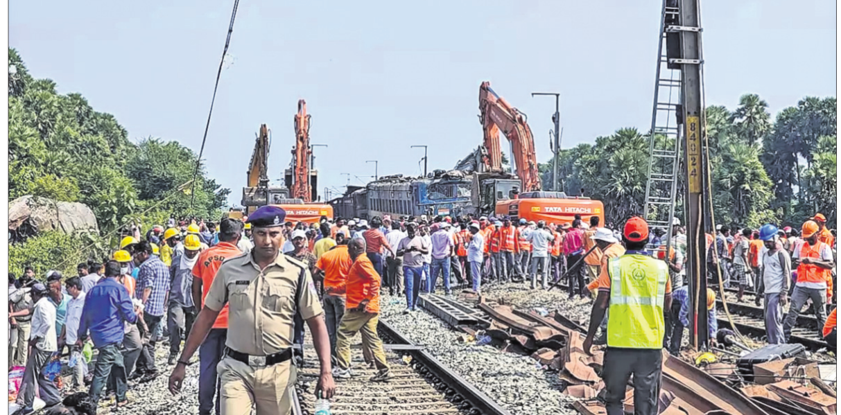
ଟ୍ରେନ୍ ଦୁର୍ଘଟଣାସ୍ଥଳରେ କେବିବି ସାହାଯ୍ୟରେ ଉଦ୍ଧାର କାର୍ଯ୍ୟ ଜାରି ରହିଛି ।