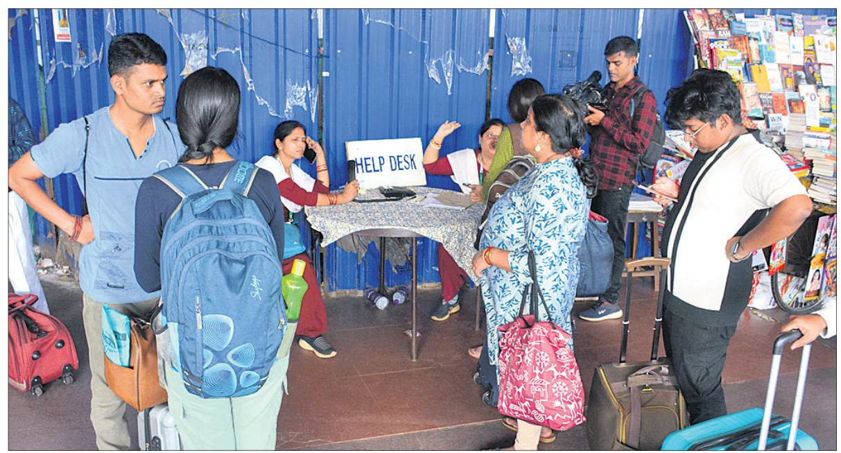
ଭୁବନେଶ୍ୱର ରେଳ ଷ୍ଟେସନଠାରେ ଖୋଲାଯାଇଥିବା ହେଲ୍ପ ଡେସ୍କ ।