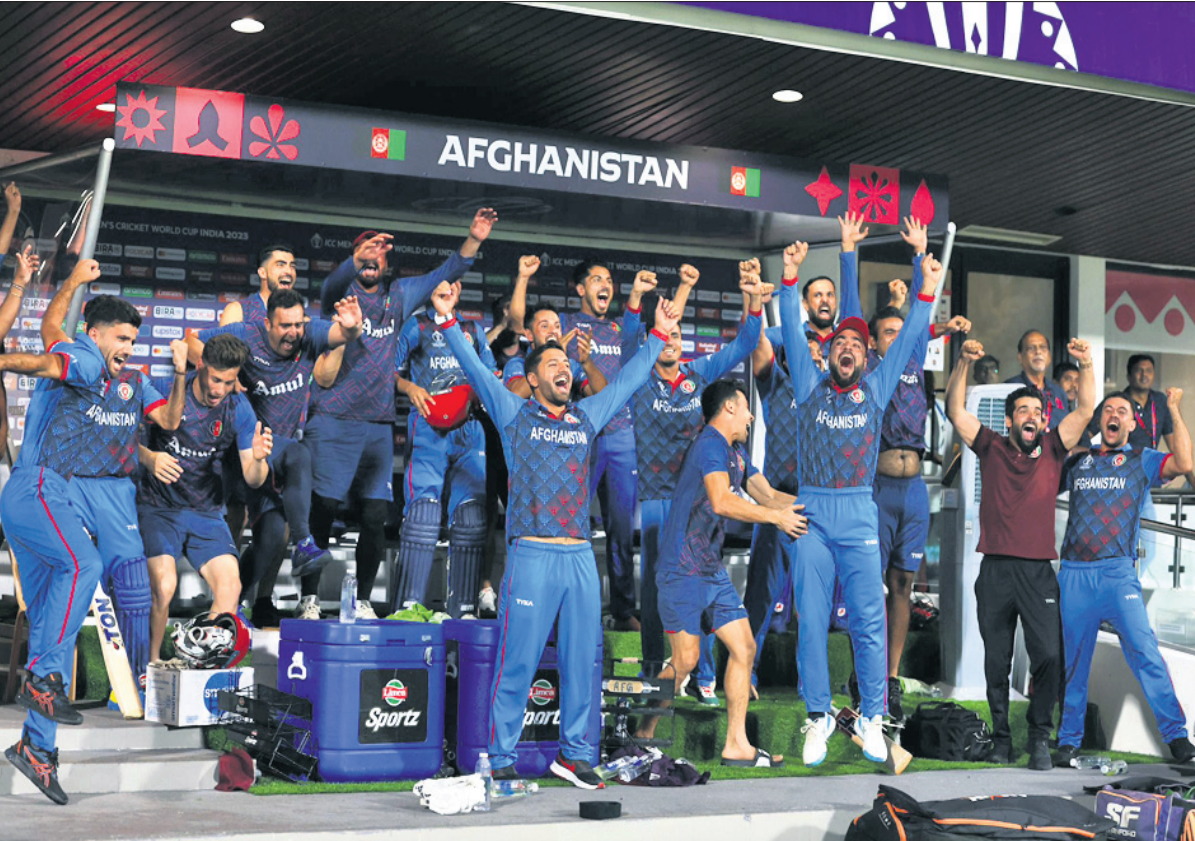
ଶ୍ରୀଲଙ୍କାକୁ ହରାଇବା ପରେ ଆଫଗାନିସ୍ତାନ ଦଳର ବିଜୟ ଉତ୍ସାହ ।