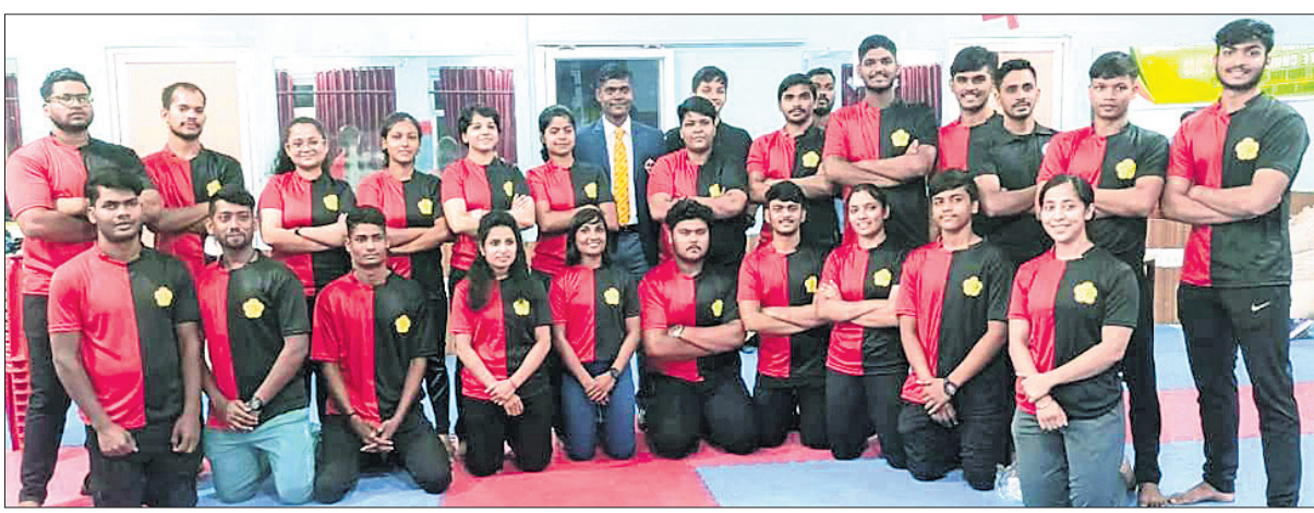
ରାଜ୍ୟ ସର୍ବଭାରତୀୟ କରାଟେରେ ଦଳଗତ ଚାମ୍ପିୟନ ଭୁବନେଶ୍ୱର ଟିମ୍।

ଭୁବନେଶ୍ୱର, ୩୦୧୦ (ତପନ ସ୍ୱାଇଁ) ଓଡ଼ିଶା ରାଜ୍ୟ କରାଟେ ଆସୋସିଏସନ୍ ଆନୁକୁଲ୍ୟରେ ଆୟୋଜିତ ସର୍ବଭାରତୀୟ କରାଟେ ପ୍ରତିଯୋଗିତା ଶେଷ ହୋଇଛି।