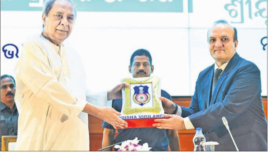
ରାଜ୍ୟସ୍ତରୀୟ ଦୁର୍ଗତି ନିବାରଣ ସଚେତନତା ସପ୍ତାହ ପାଳନ ଅବସରରେ ପୁଖ୍ୟମନ୍ତ୍ରୀ ନବୀନ ପଟ୍ଟନାୟକ ଭିଲିଲାସ୍ ଡାଲରେକ୍ଟର ଓ.ଏ.କେ. କେ.ପି.ସି.କୁ ସମର୍ପଣ କରୁଛନ୍ତି।