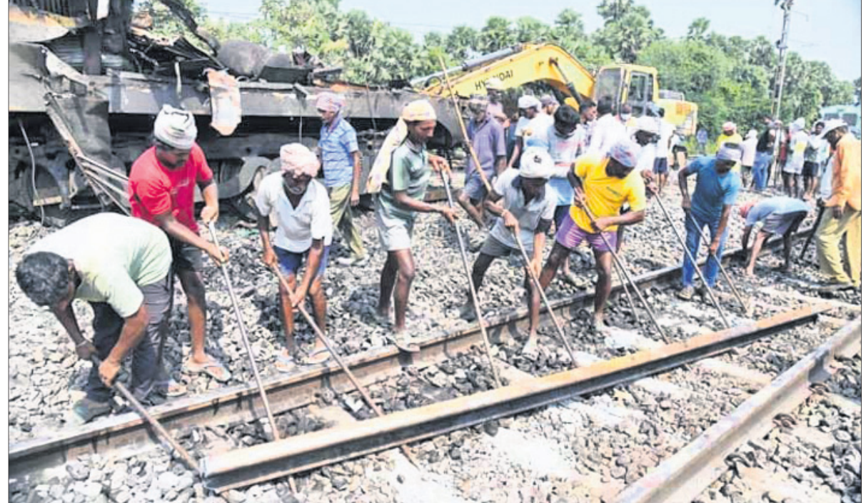
କର୍ମଚାରୀଙ୍କ ଦ୍ୱାରା ରେଳ ଲାଇନ୍ ମରାମତି କରାଯାଇଛି ।