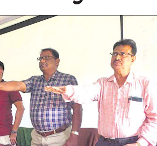
ଅତିଥିମାନେ ଶପଥପାଠ କରୁଛନ୍ତି ।