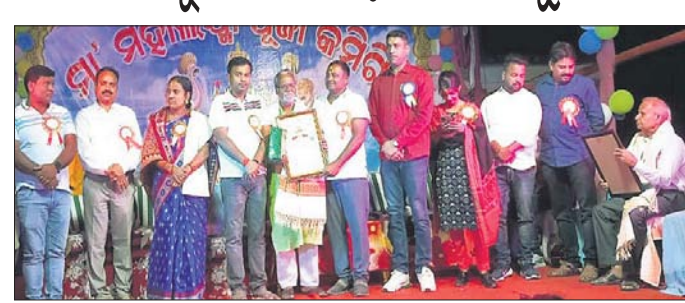
ଗଜଲକ୍ଷ୍ମୀ ପୂଜା ଅବସରରେ ବରିଷ୍ଠ ନାଗରିକଙ୍କୁ ସମ୍ବର୍ଦ୍ଧିତ କରାଯାଇଛି ।