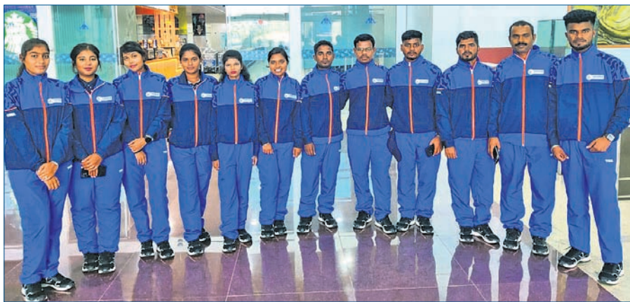
ଜାତୀୟ କ୍ରୀଡା ପାଇଁ ମନୋନୀତ ଓଡ଼ିଶା ଲନ୍‌ବୋଲ୍ ଦଳ।

ଭୁବନେଶ୍ୱର, ୩୦୧୦ (ତପନ ସ୍ୱାଇଁ) ଗୋଆରେ ଚାଲିଥିବା ୩୭ତମ ଜାତୀୟ କ୍ରୀଡା ପାଇଁ ସୋମବାର ଓଡ଼ିଶା ଲନ୍‌ବୋଲ୍ ଦଳ ଘୋଷିତ ହୋଇଛି।