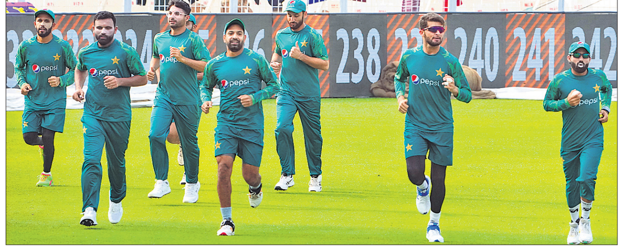
କୋଲକାତାରେ ସୋମବାର ପାକିସ୍ତାନ କ୍ରିକେଟ ଦଳର ଅଭ୍ୟାସ ।