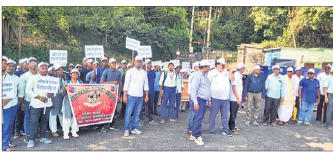
ସଚେତନତା କାର୍ଯ୍ୟକ୍ରମ ଚାଲିଛି ।