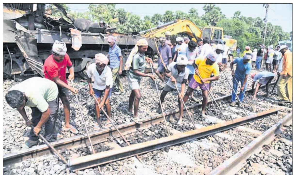
କର୍ମଚାରୀଙ୍କ ଦ୍ୱାରା ରେଳ ଲାଇନ୍ ମରାମତି କରାଯାଇଛି ।