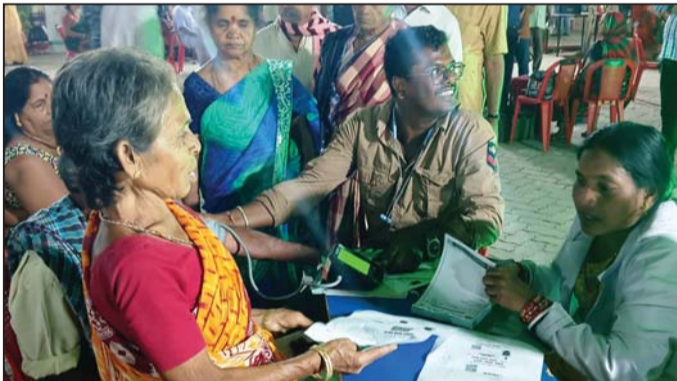
ତୀର୍ଥଯାତ୍ରାଙ୍କ ସାକ୍ଷ୍ୟ ପରୀକ୍ଷା କରାଯାଇଛି ।

ରାଜ୍ୟ ସରକାରଙ୍କ ବରିଷ୍ଠ ନାଗରିକ ତୀର୍ଥ ଯାତ୍ରା ଯୋଜନାରେ ଗଞ୍ଜାମ ଜିଲ୍ଲାରୁ ୧ ହଜାର ତୀର୍ଥ ଯାତ୍ରୀ ବ୍ରହ୍ମପୁର ରେଳ ଷ୍ଟେଶନଠାରୁ କନ୍ୟାକୁମାରୀ-ତ୍ରିଭେନୁସା ଯାତ୍ରା କରିବେ । ଏ ନେଇ ଜିଲ୍ଲା ପ୍ରଶାସନ ପକ୍ଷରୁ ବ୍ରହ୍ମପୁରର ଗୁଡ଼ସରୋଡ଼ସ୍ଥିତ ଏକ ସରକାରୀ କ୍ଷୁଦ୍ର ତୀର୍ଥ ଯାତ୍ରାଙ୍କ ରହଣି ନିମନ୍ତେ ସ୍ୱତନ୍ତ୍ର ବ୍ୟବସ୍ଥା କରାଯାଇଛି । ତୀର୍ଥଯାତ୍ରାଙ୍କ ନିମନ୍ତେ ଖାଇବା, ସାକ୍ଷ୍ୟ ପରୀକ୍ଷା ସମେତ ସମସ୍ତ ସୁବିଧା ସୁଯୋଗ ପ୍ରଦାନ କରାଯାଇଛି । ଆସନ୍ତାକାଲି