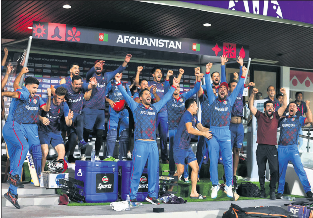
ଶ୍ରୀଲଙ୍କାକୁ ହରାଇବା ପରେ ଆଫଗାନିସ୍ତାନ ଦଳର ବିଜୟ ଉତ୍ସାହ ।