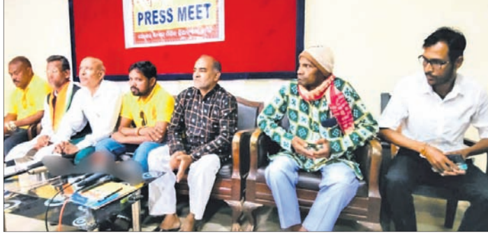
ବଲାଙ୍ଗୀର ସାମାଜିକ ଭବନରେ ଅନୁଷ୍ଠିତ ଖବରଦାତା ସମ୍ମିଳନୀରେ କୋଶଳ ରାଏଲ୍ ମିଲିଟ୍ କ୍ରିୟାନୁଷ୍ଠାନ କମିଟି ସଭ୍ୟମାନେ

କୋଶଳ ରାଏଲ୍ ମିଲିଟ କ୍ରିୟାନୁଷ୍ଠାନ କମିଟିର ଖବରଦାତା ସମ୍ମିଳନୀ