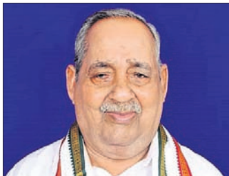
ପ୍ରାନ୍ତର ବିଧାୟକ ରବି ଲାବଣ୍ୟ

ଧାର୍ମିକ, ସାମାଜିକ, ଶିକ୍ଷା, ଯାଜପୁର ଜିଲ୍ଲା ଧର୍ମଶାଳୀ ପ୍ରାନ୍ତର ବିଧାୟକ ରବି ଲାବଣ୍ୟ (୮୬)ଙ୍କ ଯୋଗ୍ୟତା ପରଲୋକ ହୋଇଯାଇଛି। ଧର୍ମଶାଳୀ ଜିଲ୍ଲା ନିର୍ବାଚନ ପଞ୍ଚାୟତ ଅରଜାବାଦ ଗ୍ରାମର ରବି ଲାବଣ୍ୟ ୧୯୭୭ରେ ଧର୍ମଶାଳୀ ନିର୍ବାଚନପଞ୍ଚାୟତ ଜନତା ଦଳ ଚିତ୍ତେଇରେ ବିଜୟ ହୋଇ ବିଧାୟକ ହୋଇଥିଲେ।