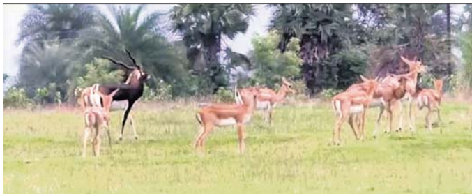
ମୃଗମାନେ ଜମିରେ ବିଚରଣ କରୁଛନ୍ତି ।

ଗଞ୍ଜାମ ଜିଲ୍ଲାରେ କୃଷ୍ଣସ୍ୱାମୀ ମୃଗଙ୍କ ସଂଖ୍ୟା ବଢ଼ିବାରେ ଲାଗିଛି । ଗତ ୧୨ ବର୍ଷ ଭିତରେ ୧୨୭୩ ମୃଗ ବଢ଼ିଛନ୍ତି । ମୃଗ ସଂଖ୍ୟା ବଢ଼ୁଥିଲେ ବି ସଚେତନତା ଓ ସୁରକ୍ଷା ଜରୁରୀ ବୋଲି ପରିବେଶବିତମାନେ କହିଛନ୍ତି । ବିଶେଷ କରି ଚରାଚୁଲା ଅଞ୍ଚଳ ସଂକ୍ରମିତ ହେଉଥିବାରୁ ମୃଗଙ୍କ ଜୀବନ ପ୍ରତି ବିପଦ ଦେଖାଦେଇଛି ।