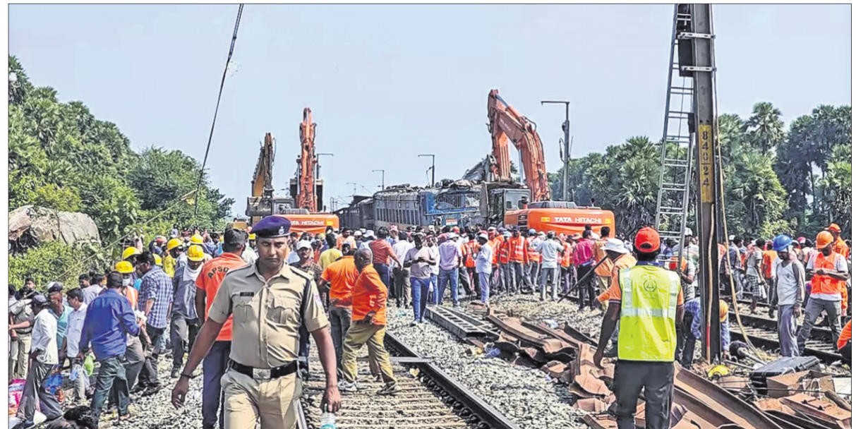
ଟ୍ରେନ୍ ଦୁର୍ଘଟଣାସ୍ଥଳରେ କେବିବି ସାହାଯ୍ୟରେ ଉଦ୍ଧାର କାର୍ଯ୍ୟ ଜାରି ରହିଛି ।