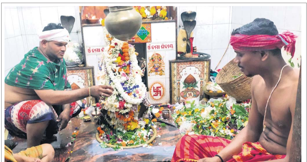
କାର୍ତ୍ତିକ ମାସର ପ୍ରଥମ ସୋମବାର କମ୍ପାନୀ ବିଦ୍ୟନୀଅଥେଶ୍ୱର ଠାରେ ଯାତ୍ରାଭିଷେକ କରାଯାଇଛି ।

ତିପିଏସ୍‌ଓଡିଏଲ୍ ପକ୍ଷରୁ ସୋମବାରଠାରୁ ଆସନ୍ତା ୫ ତାରିଖ ଯାଏଁ ଦୁର୍ନୀତି ନିବାରଣ ସଚେତନତା ସପ୍ତାହ ପାଳନ କରାଯାଇଛି । ଏହି ସଚେତନତା ସପ୍ତାହରେ ଦୁର୍ନୀତିକୁ ନାହିଁ କୁହୁଛନ୍ତି ବୋଲି ପ୍ରତିବଦ୍ଧ କୁହୁଛନ୍ତି ନେଇ ଏକ ବାର୍ତ୍ତା ରହିଛି । ବ୍ରହ୍ମପୁର ଡିପିଏସ୍‌ଓଡିଏଲ୍ ମୁଖ୍ୟ କାର୍ଯ୍ୟାଳୟଠାରେ ଏହି ସଚେତନତା ସପ୍ତାହ ଉଦଘାଟିତ ହୋଇଯାଇଛି । ଏହି ସପ୍ତାହ ବ୍ୟାପୀ କାର୍ଯ୍ୟକ୍ରମରେ କଂପାନୀର ସମସ୍ତ ମୁଖ୍ୟ ଓ ବରିଷ୍ଠ ଅଧିକାରୀମାନେ ଯୋଗ ଦେବେ । ଏଥିସହ ୧୦ଟି ପଞ୍ଚାୟତରେ ଜାଗରଣ ଶିବିର ଅନୁଷ୍ଠିତ ହେବ । ଶିବିର