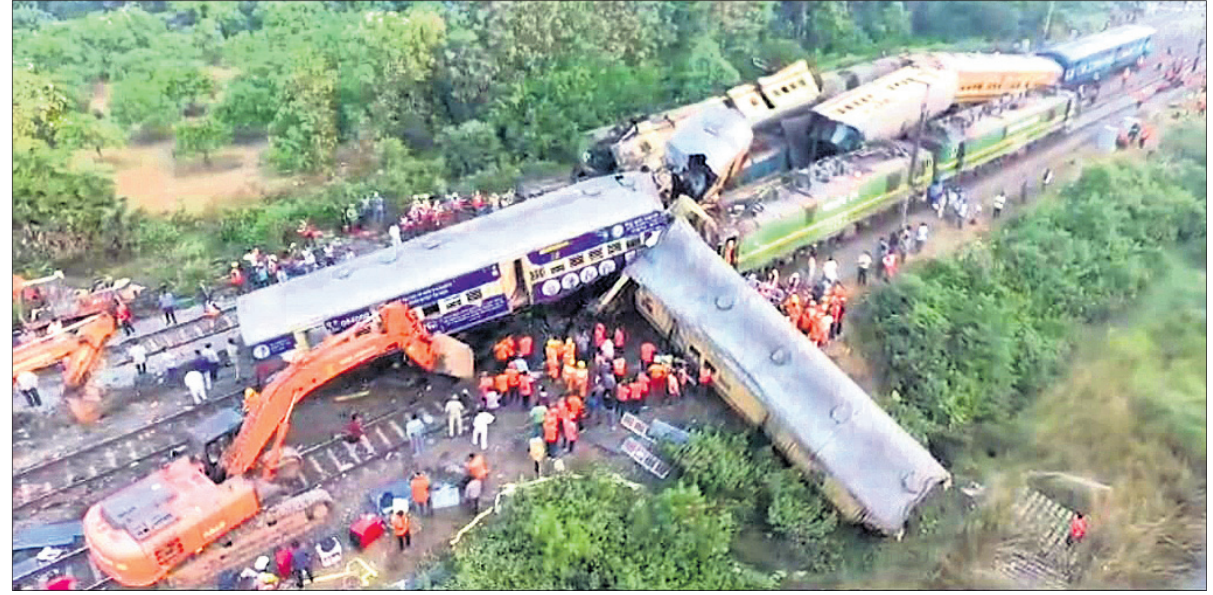
ଦୁର୍ଘଟଣାଗ୍ରସ୍ତ ବନ୍ଧୁକେ ଯିବାପଥରେ ରେଳଧାରଣାରୁ ଉଠାଯାଇଛି ।