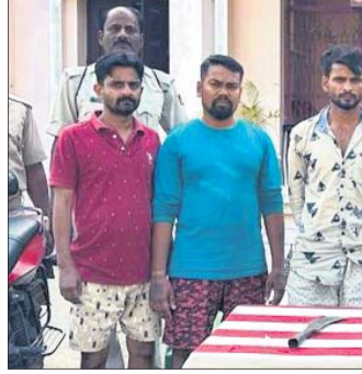
ଗିରଫ ଅଭିଯୁକ୍ତ ସହ ଜବତ ମାରଣାସ୍ତ୍ର ।

ସାହି ଫୋରାର ଥିବା ଜଣାପଡ଼ିଛି । ଚିକିତ୍ସା କାଟିବା ପାଇଁ ଯେଉଁକାଟି ବ୍ୟବହାର ହେଉଛି ସେଭଳି କାଟି ତିଆରି କରିଥିଲେ ଅଭିଯୁକ୍ତ । ହତ୍ୟାକାଣ୍ଡରେ ପୂର୍ବଶତ୍ରୁତା ମୁଖ୍ୟ କାରଣ ବୋଲି ଏସପି ପ୍ରେସ୍ ବିବୃତିରେ ଦର୍ଶାଯାଇଛି । ବିଭିନ୍ନ କାରଣକୁ ନେଇ ଦୁର୍ଘଟଣା ସାହୁ ଓ ଅଭିଯୁକ୍ତଙ୍କ ଭିତରେ ଶତ୍ରୁତା ଲାଗି ରହିଥିଲା । ଗତ ୨୫ତାରିଖରେ ଫାୟରଗ୍ଗ ନିକଟରେ କୋରା ରାଉଳଙ୍କୁ କେତେକଣା ଦୁର୍ଘଟଣା ଅପହରଣ କରି