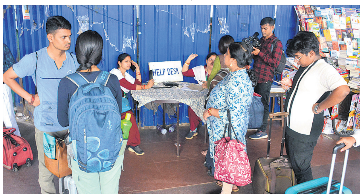
ଭୁବନେଶ୍ୱର ରେଳ ଷ୍ଟେସନଠାରେ ଖୋଲାଯାଇଥିବା ହେଲ୍ପ ଡେସ୍କ ।