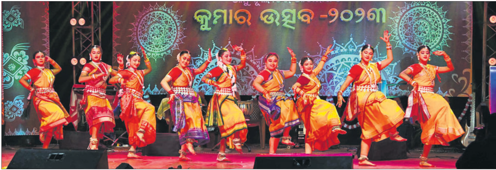
ରାଉରକେଲା ସିଦ୍ଧିକ ସେକ୍ଟରରେ ଆୟୋଜିତ କୁଆଁର ପୂର୍ଣ୍ଣିମା ଉତ୍ସବରେ କଳାକାରଙ୍କ ଦ୍ୱାରା ନୃତ୍ୟ ପରିବେଷଣ କରାଯାଇଛି।