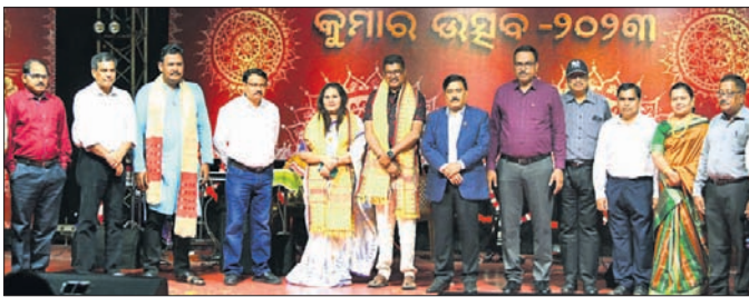
ପ୍ରେମ୍ ଆନନ୍ଦ ଓ ଇତି ସାମନ୍ତଙ୍କୁ କୁମାର ଉତ୍ସବ ସମ୍ମାନରେ ସମ୍ମାନିତ କରାଯାଇଛି।