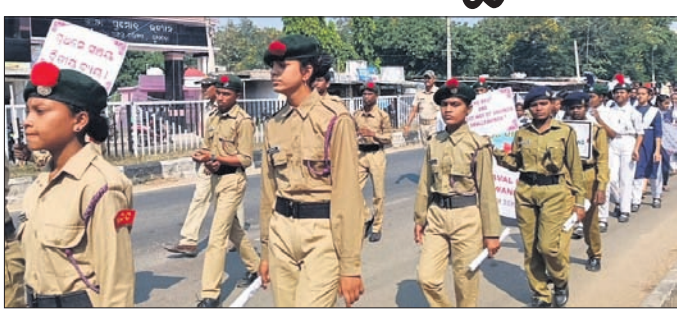
ସ୍ୱଳ୍ପ ସଞ୍ଚୟ ରଥ ଶୁଭାରମ୍ଭ।

ସ୍ୱଳ୍ପ ସଞ୍ଚୟ ରଥ ଶୁଭାରମ୍ଭ। ସ୍ୱଳ୍ପ ସଞ୍ଚୟ ରଥ ଶୁଭାରମ୍ଭ ପାଇଁ ଉପକରଣରେ କୃଷି ସମ୍ପଦ ସମ୍ପତ୍ତି କର୍ମଚାରୀମାନେ କମିଶ୍ନ ଜରିା ଯାଇ ସର୍ବେ ସମ୍ପତ୍ତି କର୍ମଚାରୀମାନେ କମିଶ୍ନ ଜରିା ଯାଇ ସର୍ବେ