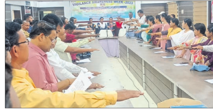
ଦୁର୍ନୀତି ନିବାରଣ ପାଇଁ ଶପଥ ପାଠ କରାଯାଇଛି।

ନୂଆପଡ଼ା ଜିଲ୍ଲା ଖଡ଼ିଆଳ ଅଞ୍ଚଳରେ ପାର୍ବଣ ରତ୍ନରେ ଭୂଆଁ ଖେଳକୁ ନେଇ ସହରବାସୀଙ୍କ ମଧ୍ୟରେ ଅସନ୍ତୋଷ ଦେଖାଦେଇଛି। ପାର୍ବଣ ରତ୍ନ ଚାଲିଥିବା ବେଳେ ଏହାର ପ୍ରୟୋଗ ନେଇ କିଛି ପ୍ରଭାବଶାଳୀ ବ୍ୟକ୍ତି ଭୂଆଁ ଖେଳ (ସ୍ୱେଡ଼ି ଖେଳ) ଖୁଲିମଖୁଲି ଖେଳି ଗାରି ରଖିଛନ୍ତି।