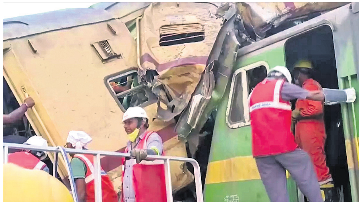
ଉଦ୍ଧାର କାର୍ଯ୍ୟରେ ଅଗ୍ନିଶମ, ଓଡ୍ରାଫ୍ ଓ ଅନ୍ୟ କର୍ମଚାରୀମାନେ ନିଯୋଜିତ ହୋଇଛନ୍ତି ।