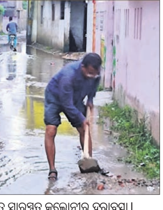
ସମ୍ବଲପୁର ମହାନଗର ନିଗମ ଅନ୍ତର୍ଗତ ସାରସ୍ୱତ କଲୋନୀର ଦୂରାବସ୍ଥା।

ସମ୍ବଲପୁର ମହାନଗର ନିଗମ ଅନ୍ତର୍ଗତ ସାରସ୍ୱତ କଲୋନୀରେ ପ୍ରବାହ ଯୋଗୁଁ ଲୋକମାନଙ୍କୁ ଅନିୟମିତ ଭାବରେ ବ୍ୟାଧିଗ୍ରସ୍ତ କରିବା ପାଇଁ ନିଗମ ପକ୍ଷରୁ ପ୍ରତିକାର ଗ୍ରହଣ କରିବାକୁ ନିଗମ ପକ୍ଷରୁ ପଦକ୍ଷେପ ଗ୍ରହଣ କରାଯାଇଛି। ଏଥିରେ ଆଗାମୀ ୨ଦିନ ଧରି ବିଭିନ୍ନ କ୍ଷେତ୍ରର କାର୍ଯ୍ୟକ୍ରମରେ ବିଭିନ୍ନ ପ୍ରକାରର ସଚେତନତା ପ୍ରଥମ ଦିବସରେ ପୁଞ୍ଜୀ କାର୍ଯ୍ୟକ୍ରମ ପରିଷଦରେ ପ୍ରକାଶ କରାଯାଇଛି। ଏଥିରେ ଆଗାମୀ ୨ଦିନ ଧରି ବିଭିନ୍ନ କ୍ଷେତ୍ରର କାର୍ଯ୍ୟକ୍ରମରେ ବିଭିନ୍ନ ପ୍ରକାରର ସଚେତନତା ପ୍ରଥମ ଦିବସରେ ପୁଞ୍ଜୀ କାର୍ଯ୍ୟକ୍ରମ ପରିଷଦରେ ପ୍ରକାଶ କରାଯାଇଛି।