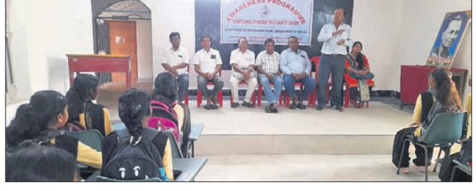
ସଚେତନତା ଶିବିରରେ ଉପସ୍ଥିତ ଅତିଥି।

ରାଉରକେଲା ଗୁରୁକୂଳ ସଂସ୍କୃତ ମହାବିଦ୍ୟାଳୟ ପରିସରରେ ଯୋଗବାର ଜାତୀୟ ଖେଳ ହକିର ପ୍ରଚାର ପ୍ରସାର ପାଇଁ ଏକ ସଚେତନତା ଶିବିର ଅନୁଷ୍ଠିତ ହୋଇଯାଇଛି।