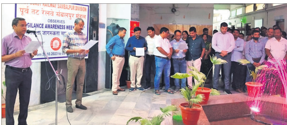
ରେଳ ମନ୍ତ୍ରାଳୟରେ କର୍ମଚାରୀଙ୍କ ଶପଥ ଗ୍ରହଣ କରାଯାଇଛି।

ପୂର୍ବରୁ ଯେଉଁସବୁ କର୍ମଚାରୀଙ୍କୁ ଶପଥ ଗ୍ରହଣ କରିବାକୁ ନିର୍ଦ୍ଦେଶ ଦିଆଯାଇଥିଲା, ସେଗୁଡ଼ିକର ସମୀକ୍ଷା କରାଯାଇଛି। ଏଥିରେ ଆଗାମୀ ୨ଦିନ ଧରି ବିଭିନ୍ନ କ୍ଷେତ୍ରର କାର୍ଯ୍ୟକ୍ରମରେ ବିଭିନ୍ନ ପ୍ରକାରର ସଚେତନତା ପ୍ରଥମ ଦିବସରେ ପୁଞ୍ଜୀ କାର୍ଯ୍ୟକ୍ରମ ପରିଷଦରେ ପ୍ରକାଶ କରାଯାଇଛି। ଏଥିରେ ଆଗାମୀ ୨ଦିନ ଧରି ବିଭିନ୍ନ କ୍ଷେତ୍ରର କାର୍ଯ୍ୟକ୍ରମରେ ବିଭିନ୍ନ ପ୍ରକାରର ସଚେତନତା ପ୍ରଥମ ଦିବସରେ ପୁଞ୍ଜୀ କାର୍ଯ୍ୟକ୍ରମ ପରିଷଦରେ ପ୍ରକାଶ କରାଯାଇଛି।