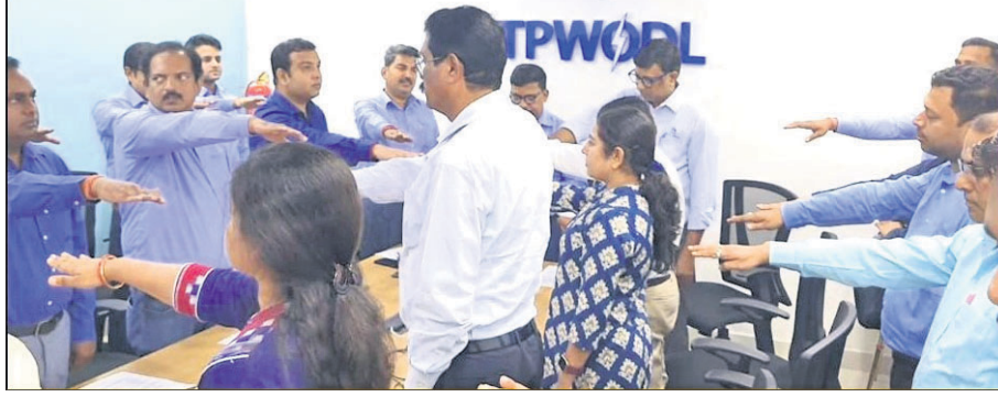
ଟିପ୍ପଣୀକରଣ ପଦ୍ଧତି ଦୁର୍ନୀତି ନିବାରଣ ସଚେତନତା ସମ୍ବନ୍ଧରେ ଶୁଭାରମ୍ଭ କରାଯାଉଛି।

ଟିପ୍ପଣୀକରଣ ପଦ୍ଧତି ଦୁର୍ନୀତି ନିବାରଣ ସଚେତନତା ସମ୍ବନ୍ଧରେ ଶୁଭାରମ୍ଭ କରାଯାଇଛି। ଏଥିରେ ଆଗାମୀ ୨ଦିନ ଧରି ବିଭିନ୍ନ କ୍ଷେତ୍ରର କାର୍ଯ୍ୟକ୍ରମରେ ବିଭିନ୍ନ ପ୍ରକାରର ସଚେତନତା ପ୍ରଥମ ଦିବସରେ ପୁଞ୍ଜୀ କାର୍ଯ୍ୟକ୍ରମ ପରିଷଦରେ ପ୍ରକାଶ କରାଯାଇଛି। ଏଥିରେ ଆଗାମୀ ୨ଦିନ ଧରି ବିଭିନ୍ନ କ୍ଷେତ୍ରର କାର୍ଯ୍ୟକ୍ରମରେ ବିଭିନ୍ନ ପ୍ରକାରର ସଚେତନତା ପ୍ରଥମ ଦିବସରେ ପୁଞ୍ଜୀ କାର୍ଯ୍ୟକ୍ରମ ପରିଷଦରେ ପ୍ରକାଶ କରାଯାଇଛି। ଏଥିରେ ଆଗାମୀ ୨ଦିନ ଧରି ବିଭିନ୍ନ କ୍ଷେତ୍ରର କାର୍ଯ୍ୟକ୍ରମରେ ବିଭିନ୍ନ ପ୍ରକାରର ସଚେତନତା ପ୍ରଥମ ଦିବସରେ ପୁଞ୍ଜୀ କାର୍ଯ୍ୟକ୍ରମ ପରିଷଦରେ ପ୍ରକାଶ କରାଯାଇଛି।