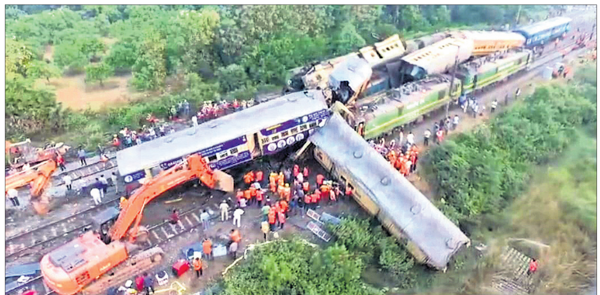
ଦୁର୍ଘଟଣାଗ୍ରସ୍ତ ବସିକୁ କେବିବି ସାହାଯ୍ୟରେ ରେଳଧାରଣାରୁ ଉଠାଯାଉଛି ।