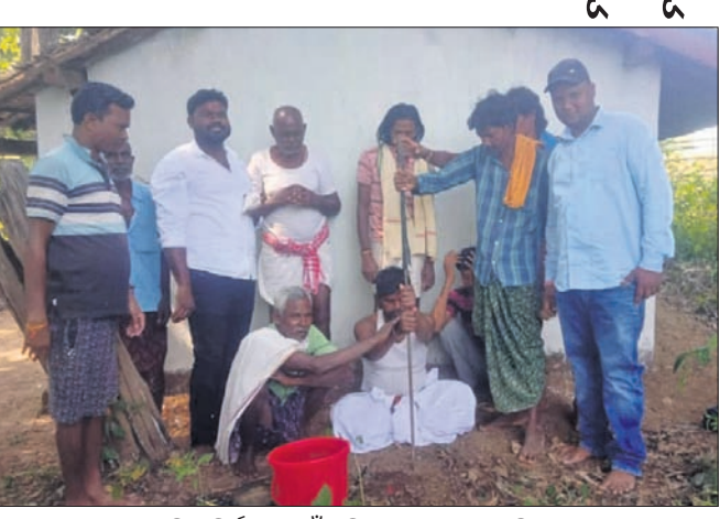
ମନ୍ଦିର ନିର୍ମାଣ ପାଇଁ ଭୂମି ପୂଜନ କରାଯାଇଛି।