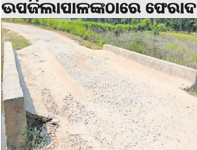
ରାସ୍ତା କଳାକାର, କଂକ୍ରିଟ୍ ନିର୍ମାଣର ଅଭିଯୋଗ

ରାସ୍ତା କଳାକାର, କଂକ୍ରିଟ୍ ନିର୍ମାଣର ଅଭିଯୋଗ କରାଯାଇଛି। ଏଥିରେ ଆଗାମୀ ୨ଦିନ ଧରି ବିଭିନ୍ନ କ୍ଷେତ୍ରର କାର୍ଯ୍ୟକ୍ରମରେ ବିଭିନ୍ନ ପ୍ରକାରର ସଚେତନତା ପ୍ରଥମ ଦିବସରେ ପୁଞ୍ଜୀ କାର୍ଯ୍ୟକ୍ରମ ପରିଷଦରେ ପ୍ରକାଶ କରାଯାଇଛି। ଏଥିରେ ଆଗାମୀ ୨ଦିନ ଧରି ବିଭିନ୍ନ କ୍ଷେତ୍ରର କାର୍ଯ୍ୟକ୍ରମରେ ବିଭିନ୍ନ ପ୍ରକାରର ସଚେତନତା ପ୍ରଥମ ଦିବସରେ ପୁଞ୍ଜୀ କାର୍ଯ୍ୟକ୍ରମ ପରିଷଦରେ ପ୍ରକାଶ କରାଯାଇଛି। ଏଥିରେ ଆଗାମୀ ୨ଦିନ ଧରି ବିଭିନ୍ନ କ୍ଷେତ୍ରର କାର୍ଯ୍ୟକ୍ରମରେ ବିଭିନ୍ନ ପ୍ରକାରର ସଚେତନତା ପ୍ରଥମ ଦିବସରେ ପୁଞ୍ଜୀ କାର୍ଯ୍ୟକ୍ରମ ପରିଷଦରେ ପ୍ରକାଶ କରାଯାଇଛି।