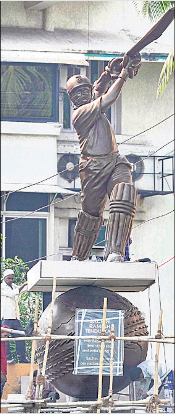
ଓଫିସ୍ରେ ଉନ୍ନତ ଅପେକ୍ଷାରେ ସଚିନ ଟେନ୍ଡୁଲକରଙ୍କ ପ୍ରତିମୂର୍ତ୍ତି।