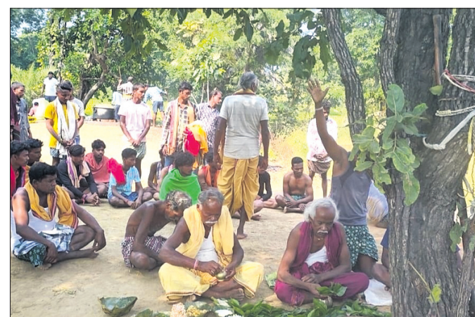
ନାଗଦେବତାଙ୍କ ପୂଜା କରାଯାଉଛି ।