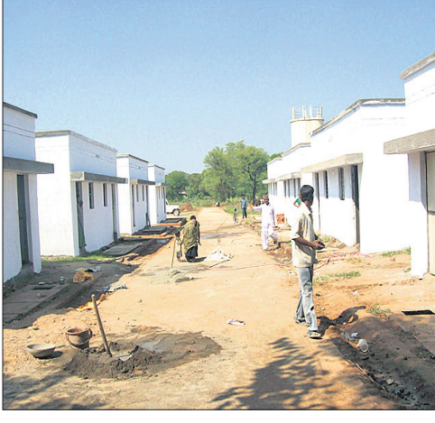
ପୂର୍ବ ଦର୍ଶାଇ ଗୋଟିଏ ପରିବାରରେ ତିନି ଚାରି ଜଣ ଏହି ଯୋଜନାରେ ଅନ୍ତର୍ଭୁକ୍ତ ହୋଇ ଦୃତଳ ବା ତ୍ରୁତକ କୋଠାଘର କରିଥିବା ଉଦାହରଣର ଅଭାବ ନାହିଁ । ଏହି ଯୋଜନା କେବଳ ରାଜନୈତିକ ଦଳକୁ ବା ଦଳାଲଙ୍କୁ ଫାଇଦା ଦେଇନାହିଁ ବରଂ ଉପରୁ ତଳ ପ୍ରଥମ ପର୍ଯ୍ୟାୟ ସମ୍ପୂର୍ଣ୍ଣ ସମସ୍ତ ସରକାରୀ ଅଧିକାରୀ ଓ କର୍ମଚାରୀମାନେ ଯଥେଷ୍ଟ ଆର୍ଥିକ ଲାଭ ପାଇଛନ୍ତି । ଯୋଜନା ଆରମ୍ଭ ହେବାର କିଛି ବର୍ଷ ପରେ ନିଷ୍ପତ୍ତି ଅନୁଯାୟୀ ବ୍ଲକ ମାଧ୍ୟମରେ ହିତାଧିକାରୀମାନଙ୍କୁ ଅଗ୍ରମ ସିନେଷ୍ଟ, ଆକର୍ଷଣୀୟ ଦେବା ପାଇଁ ସମ୍ପୂର୍ଣ୍ଣ କମ୍ପାନୀ ସହ ରୁଦ୍ଧି କରାଗଲା । ହିତାଧିକାରୀମାନଙ୍କୁ ସେଇ ସିନେଷ୍ଟ ଓ ଆକର୍ଷଣୀୟ ସହ ଅର୍ଥ ଏବଂ ଅନ୍ୟ କିଛି ବ୍ଲକରେ ଲୁହାବରଣା

ଆମ ରାଜ୍ୟରେ ଥିବା ପ୍ରତ୍ୟେକ ବ୍ଲକରେ ୧୯୮୦ ମସିହା ପୂର୍ବରୁ ହିସାବ ଦେଖିଲେ ଜଣାଯିବ ଯେ ସମସ୍ତ ବ୍ଲକରେ ଗ୍ରାମୀଣ ଗୃହ ଯୋଜନାରେ କିଛି ବ୍ୟକ୍ତିଙ୍କୁ ରଣ ଦିଆଯାଇଥିଲା । ରଣ ଗ୍ରହାଣମାନେ ଘର ତିଆରି କରି ମୂଳ ସହ ସୁଧ ବି ପଇଠ କରୁଥିଲେ । ୧୯୮୦ ମସିହାରେ ଇନ୍ଦିରା ଗାନ୍ଧୀ ପୁନଃ ଭାରତର ପ୍ରଧାନମନ୍ତ୍ରୀ ହେବା ପରେ ଗୃହହୀନ ପରିବାର ପାଇଁ ସମସ୍ତ ଗୃହନିର୍ମାଣ ଯୋଜନା ଆରମ୍ଭ କରିଥିଲେ । ପ୍ରତ୍ୟେକ ଜିଲ୍ଲାରେ ବାସହୀନ ପରିବାର ପାଇଁ ଏହି ଯୋଜନାରେ ପ୍ରଥମେ ଏକଶହ ଆଦର୍ଶ ଗୃହ ନିର୍ମାଣ କରାଯାଇ ଆବଶ୍ୟକ କରାଗଲା । କିନ୍ତୁ ଆନୁଷ୍ଠାନିକ ବ୍ୟବସ୍ଥା ନ ଥାଇ ଜନସଂସ୍ପର୍ଶକୁ ଦୂରରେ ନିର୍ଦ୍ଧିତ ଘରେ ଚିହ୍ନଟ ହୋଇଥିବା ଉପଭୋକ୍ତାମାନେ ରହିବା ପରିବର୍ତ୍ତେ ଗୃହରେ ବ୍ୟବହୃତ ଉପକରଣକୁ ବିକି ବା ସ୍ଥାନାନ୍ତର କରିଦେଲେ । ତା'ପରେ କେବଳ ଘରବାଡ଼ି ଜାଗା ଥାଇ ଘର ନ ଥିବା ଗରିବଙ୍କ ପାଇଁ ବ୍ୟକ୍ତିଗତ ଗୃହ ନିର୍ମାଣ କରାଗଲା । ଶାସନ ପରିବର୍ତ୍ତନରେ ଯୋଜନାର ନାମ ବଦଳାଯାଇ ଇନ୍ଦିରା ଆବାସ ଯୋଜନାକୁ ରାଜ୍ୟ ଆବାସ ଯୋଜନା, ଏବେ ବିକ୍ଷୁ ପକ୍ଷାଘର ଯୋଜନା ଓ ପ୍ରଧାନମନ୍ତ୍ରୀ ଆବାସ ଯୋଜନା କାର୍ଯ୍ୟକାରୀ ହେଉଛି । ପ୍ରଥମେ ପ୍ରତ୍ୟେକ ଘର ପ୍ରତି ତତ୍କାଳୀନ ମୂଲ୍ୟ ସୂଚୀ ଅନୁଯାୟୀ ଅନୁଦାନ ଛଅ ହଜାରରୁ ଏବେ ଦୁଇ ଲକ୍ଷ ପଚାଶ ହଜାରକୁ ବୃଦ୍ଧି ହୋଇଛି । ଯୋଜନାରେ ବି ଅନେକ ପରିବର୍ତ୍ତନ ହୋଇ ପୂର୍ବରୁ ଆକର୍ଷଣୀୟ ଘର ପରିବର୍ତ୍ତେ ଏବେ କୋଠାଘର ପାଇଁ ଅର୍ଥ ମଞ୍ଜୁର ହେଉଛି । ଭୂମିହୀନ ଲୋକଙ୍କୁ ସରକାରୀ ଜାଗା ଦିଆଯାଇ ଘର ତିଆରି ପାଇଁ ଅର୍ଥ ଦିଆଯାଉଛି । କିନ୍ତୁ ଆଶାଯାକ ସଂଖ୍ୟା ବୃଦ୍ଧି । ଏହି ଯୋଜନା ନିକଟ ଭବିଷ୍ୟତରେ ଶେଷ ନ ହୋଇ ଦୀର୍ଘକାଳ ପର୍ଯ୍ୟନ୍ତ ଚାଲୁ ରହିବା ରାଜନୈତିକ ଓ ପ୍ରଶାସନିକ ଆଭିମୁଖ୍ୟରୁ କ୍ଷୟ ହେଉଛି । ଏହା ସତ୍ୟ ଯେ ଯେଉଁମାନେ ପ୍ରଥମ ପର୍ଯ୍ୟାୟରେ ଏହି ଯୋଜନାରେ ଅନ୍ତର୍ଭୁକ୍ତ ହୋଇଥିଲେ ଦ୍ୱିତୀୟ ପର୍ଯ୍ୟାୟରେ ତାଙ୍କ ଉତ୍ତରାଧିକାରୀ(ସୁଅ) ଓ ଏବେ ତାଙ୍କର ତୃତୀୟ ପୁରୁଷ (ନାତି) ଏହି ଯୋଜନାର ହିତାଧିକାରୀ