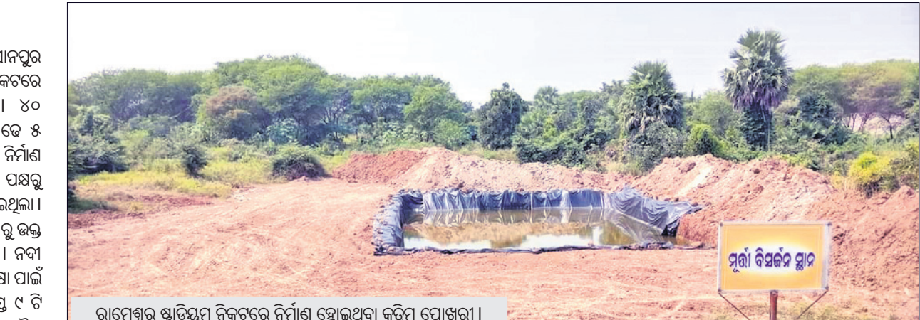
ରାମେଶ୍ୱର ଷ୍ଟାଡ଼ିୟମ ନିକଟରେ ନିର୍ମାଣ ହୋଇଥିବା କୃତ୍ରିମ ପୋଖରୀ।

ମା' ଦୁର୍ଗାଙ୍କ ମୂର୍ତ୍ତି ବିସର୍ଜନ ପାଇଁ ସୋନପୁର ସହରର ରାମେଶ୍ୱରସ୍ଥିତ ଷ୍ଟାଡ଼ିୟମ ନିକଟରେ ନିର୍ମାଣ ହୋଇଥିଲା କୃତ୍ରିମ ପୋଖରୀ। ୪୦ ଫୁଟ ଲମ୍ବ ୫୦ଫୁଟ ଓସାରର ପ୍ରାୟ ଯାତେ ୫ ଫୁଟ ଗଭୀର ବିଶିଷ୍ଟ ଏହି ପୋଖରୀ ନିର୍ମାଣ ହୋଇଛି। ସୁବର୍ଣ୍ଣପୁର ପୂର୍ବ ପରିଷଦ ପକ୍ଷରୁ ତେଲ ନଦୀ କୂଳରେ ଏହା ନିର୍ମାଣ ହୋଇଥିଲା। ନିର୍ଦ୍ଧାରିତ ସମୟରେ ଅଗ୍ନିଶମ ବିଭାଗ ପକ୍ଷରୁ ଉକ୍ତ ପୋଖରୀରେ ପାଣି ଭର୍ତ୍ତି କରାଯାଇଥିଲା। ନଦୀ କଳ ପ୍ରଦୃଶ୍ୟ ରୋକିବା, ଜଳଜୀବଙ୍କ ସୁରକ୍ଷା ପାଇଁ ଏହି କୃତ୍ରିମ ପୋଖରୀରେ ସହରର ସମସ୍ତ ୯ ଟି ଦୁର୍ଗା ମୂର୍ତ୍ତି ବିସର୍ଜନ ପାଇଁ ନିଷ୍ପତ୍ତି ହୋଇଥିଲା। ପୌର ପରିଷଦ ପକ୍ଷରୁ ଏ ସମ୍ପର୍କରେ ଗତ ୨୦ ତାରିଖରେ ରୁକ୍ମ ଛକ, ପଟାଭାତି, ଘୋଡ଼ାଘାଟପଡ଼ା, ବଡ଼ବଜାର ଅନ୍ତରାମ ମଣ୍ଡପ, ଚିକିତ୍ସା, ପୌର ରୁକ୍ଷିତା ମନ୍ଦିର, ଥନାପତିପଡ଼ା, କୁସାରପଡ଼ା