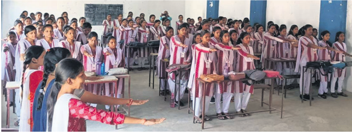
ମଙ୍ଗଳବାର ବରପାଲି ଜଗବନ୍ଧୁ ଦାଶ ସ୍ମାରକ ମହିଳା ମହାବିଦ୍ୟାଳୟରେ ଭିଜିଲାନ୍ସ ସଚେତନତା ଓ ଜାତୀୟ ଏକତା ଦିବସରେ ଛାତ୍ରୀମାନେ ଶପଥପାଠ କରୁଛନ୍ତି।