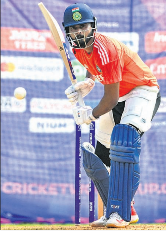
ଶ୍ରେୟସ ଆୟରଙ୍କ ବ୍ୟାଟିଂ ଅଭ୍ୟାସ।

ପୁଣା, ୩୧।୧୦ (ପି.ଟି.) ମଙ୍ଗଳବାର ଭାରତର ୪ ନମ୍ବର ବ୍ୟାଟର ଶ୍ରେୟସ୍ ଆୟର ଶର୍ତ୍ତ ବଲ୍ ଖେଳିବାର ଅଭ୍ୟାସ କରିଥିଲେ। ଶର୍ତ୍ତ ବଲ୍ ଖେଳିବାର ଆୟରକୁ ଅଧିକାର ସମ୍ପୂର୍ଣ୍ଣ ହେବାକୁ ପଡୁଛି। ବିପକ୍ଷ ଦଳ ସର୍ବଦା ଏହାର ଫାଇଦା ଉଠାଇଛନ୍ତି। ଆସନ୍ତା ଭୁବନେଶ୍ୱର ମୁହାଁଇରେ ଓଫିସ୍ରେ ଷ୍ଟାଡ଼ିୟମରେ ଭାରତ ଏହାର ପରବର୍ତ୍ତୀ ମ୍ୟାଚ୍ ଶ୍ରୀଲଙ୍କା ବିପକ୍ଷରେ ଖେଳିବ। ଏହି ମ୍ୟାଚ୍ ପୂର୍ବରୁ ଆୟରକୁ ଶର୍ତ୍ତ ବଲ୍ ବିପକ୍ଷରେ ଅଭ୍ୟାସ କରୁଥିବାର ବେଶ୍ ବାବୁ ମିଳିଥିଲା। ମଙ୍ଗଳବାରର ଏହି ଅଭ୍ୟାସ ସେସନ୍ ଇଭାଧାନ ରହିଥିବା ବେଳେ ବିରାଟ କୋହଲି, ଶୁବମାନ ରିଲ୍ ଓ ରୋହିତ ଶର୍ମାଙ୍କ ପରି ଖେଳାଳି ଏହାକୁ ସିୟ କରିଥିଲେ। ଡେବେ ଆୟର ଏହି ସେସନ୍ରେ ଅଂଶଗ୍ରହଣ କରିବା ସହିତ ଶର୍ତ୍ତ ବଲ୍ ବିପକ୍ଷରେ ଦୀର୍ଘ ସମୟ ଧରି ଅଭ୍ୟାସ କରିଥିଲେ। ଭାରତ ଏହାର ଅଭିମୁଖ୍ୟ ମ୍ୟାଚ୍ରେ ଇଂଲଣ୍ଡକୁ ୧୦୦ ରନରେ ପରାସ୍ତ କରିଥିବା ବେଳେ ଏହି ମ୍ୟାଚ୍ରେ ମଧ୍ୟ ଆୟର ବିରାଟର ଛଙ୍ଗରେ ଆଉଟ ହୋଇଥିଲେ। ଭାରତର ପ୍ରୋ ଡାଉନ୍ ସେସିଆଲିଷ୍ଟି ମାନେ ଆୟରକୁ ପ୍ରାୟ ୨ ଘଣ୍ଟା ଧରି ବୋଲିଂ କରିଥିଲେ। ଏହା ସହିତ କିଛି ସ୍ଥାନୀୟ ବୋଲର ମଧ୍ୟ ସାମିଲ ହୋଇ ବୋଲିଂ