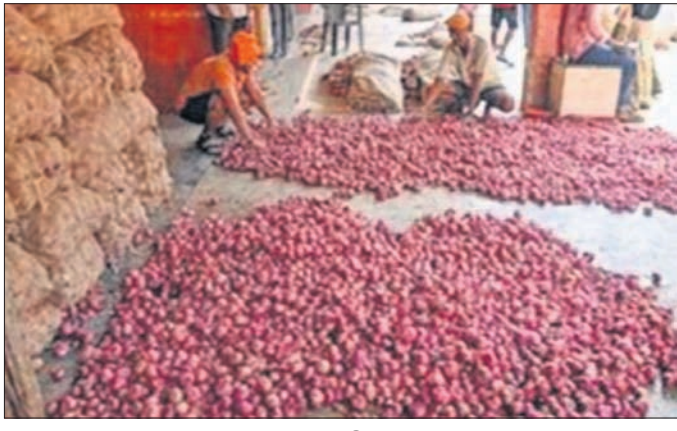
ରାଜରକେଲା ପ୍ଲାଣ୍ଟସାଇଟ୍ ବଜାରରେ ଥିବା ପିଆଜ ଗୋଦାମ।

ରାଜରକେଲା, ୩୧।୧୦ (ବିପ୍ଳବ ରଞ୍ଜନ ଦାଶ) ରାଜରକେଲା ବଜାରରେ ଗତ ୭ ଦିନ ମଧ୍ୟରେ ପିଆଜ ଦର ହୁ ହୁ ହୋଇ ବଢ଼ିବାରେ ଲାଗିଛି। ସେହିପରି ମସଲା ଓ ତାଳି ଜାତୀୟ ଦ୍ରବ୍ୟର ଦର ମଧ୍ୟ ଅନୁରୂପ ଭାବେ ବଢ଼ିଛି। ଫଳରେ ସହରର ଗରିବ ଓ ମଧ୍ୟବିତ୍ତ ଶ୍ରେଣୀର ଖାଉଟିମାନଙ୍କ ଉପରେ ଏହାର ସିଧାସଳଖ ପ୍ରଭାବ ପଡ଼ିଛି। ଗତ ୮ଦିନ ତଳେ ରାଜରକେଲା ସହରର ଖୋଲା ବଜାରରେ ପିଆଜ କିଲୋ ପ୍ରତି ୩୦ରୁ ୩୫ଟଙ୍କା ଥିବାବେଳେ ବର୍ତ୍ତମାନ ତାହା ୫୫ରୁ ୬୦ଟଙ୍କାରେ ବୃଦ୍ଧି ହେଉଛି। ରାଜରକେଲା ପରିବା ବଜାରକୁ ପୂର୍ବରୁ ବୈଦିକ ୧୫୦ରୁ ୨୦୦ଟଙ୍କା ପିଆଜ ମହାରାଷ୍ଟ୍ର ନାସିକରୁ ଆସୁଥିଲା। ମାତ୍ର ଏବେ ସେଠାରୁ ମାତ୍ର ୫୫ଟଙ୍କା ପିଆଜ ଆସୁଛି। ଏଥିସହ ମସଲା ଜାତୀୟ ଦ୍ରବ୍ୟର ଦର ମଧ୍ୟ ଦ୍ରୁତଗତି ହୋଇଛି। କିଛି ଦିନ ତଳେ ଜିରା କିଲୋ ପ୍ରତି ୩୫ଟଙ୍କା ଥିବା ବେଳେ ବର୍ତ୍ତମାନ