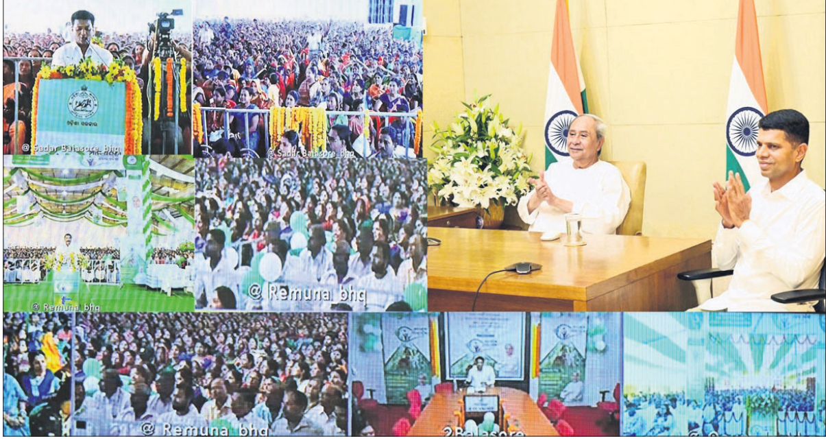
ଭୁବନେଶ୍ୱର, ୩୧.୧୦ (ଅନିଲ ଦାସ) 'ଆମ ଓଡ଼ିଶା ନବୀନ ଓଡ଼ିଶା' ଯୋଜନାରେ ମଙ୍ଗଳବାର କାର୍ଯ୍ୟକ୍ରମର ୨ମ ଦିବସରେ ପୁଞ୍ଜ୍ୟମନ୍ତ୍ରୀ ନବୀନ ପଟ୍ଟନାୟକ ଭୁବନେଶ୍ୱରକୁ ଆଗାଧି ଯୋଗେ ବାଲେଶ୍ୱର ଏବଂ ବଲାଙ୍ଗୀର ଜିଲ୍ଲାରେ ଏହାର ଶୁଭାରମ୍ଭ କରିଛନ୍ତି ।