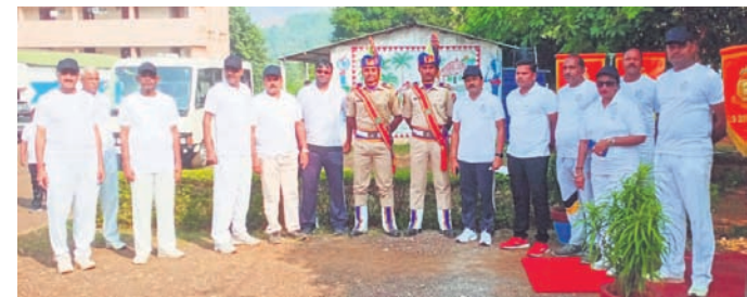
ଅଧିକାରୀମାନେ ଗଣଦୌଡ଼ରେ ସାମିଲ ହୋଇଛନ୍ତି।