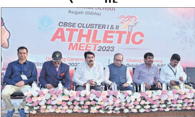
ଉଦ୍‌ଯାପନା ସମାରୋହରେ ମଞ୍ଚାଧୀନ ଅତିଥିବୃନ୍ଦ।

ବରଗଡ଼, ୩୧।୧୦(ପ୍ରେମାନନ୍ଦ ଖମରା) ବରଗଡ଼ ବିକାଶ ଆବାସିକ ବିଦ୍ୟାଳୟରେ ଅତିଥିବୃନ୍ଦ କୃଷ୍ଣର ୧ ଓ ୨ ଆଧୁନିକ ମିର୍ ଯୋଗଦାନ ଉଦ୍‌ଯାପିତ ହୋଇଛି। ପ୍ରତିଯୋଗିତାରେ ଭାରତ ପୂର୍ଣ୍ଣାଙ୍ଗକ ୧୧ରାଜ୍ୟର ୧୫ଜଣରୁ ଉର୍ଦ୍ଧ୍ୱ ପ୍ରତିଯୋଗୀ ଅଂଶଗ୍ରହଣ କରିଥିଲେ। ଉଦ୍‌ଯାପନା ସମାରୋହ ଆରମ୍ଭରେ ବିକାଶ