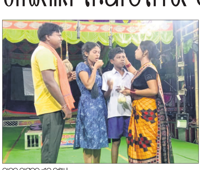
ଦାଦନ ନାଟକର ଏକ ଦୃଶ୍ୟ।