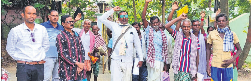
ଶ୍ରମିକମାନେ ପାଉଣା ଦାବିରେ ଜିଲାପାଳଙ୍କୁ ଫେରାଦ ହେବାକୁ ଯାଉଛନ୍ତି।