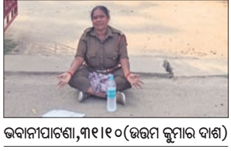
ଭବାନୀପାଟଣା, ୩୧୧୧୦ (ଭରମ କୁମାର ଦାଶ)

ନ୍ୟାୟ ପାଇଁ ଥାନା ଆଗରେ ବସିଲେ ମହିଳା ଗୃହରକ୍ଷା