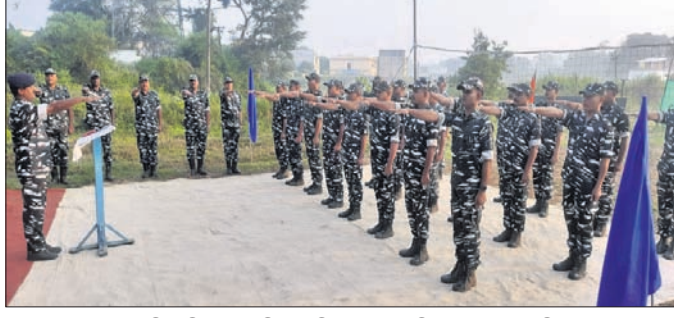
ପାଇକମାଳ ଛିତ୍ର ତି ୧୮୯ ସିଆର୍ପିଏସ୍ ବାଟାଲିୟନ କ୍ୟାମ୍ପ ପରିସରରେ ଯବାନମାନେ ଶପଥପାଠ କରୁଛନ୍ତି।