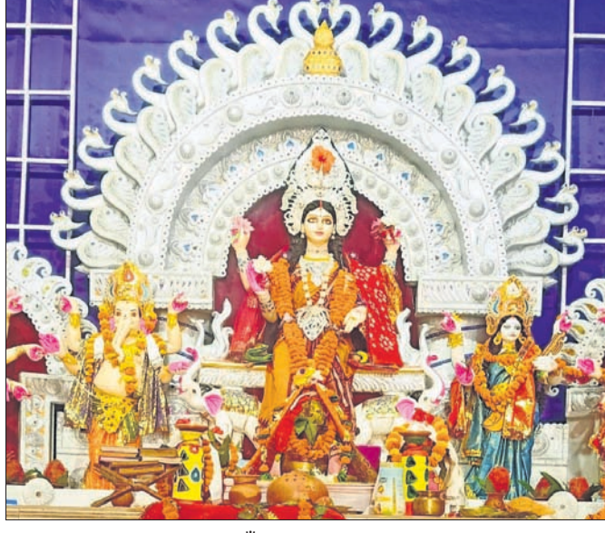
ଶକ୍ତି ନଗରରେ ପୂଜା ପାଠଥିବା ମାଁ ଗଜଲକ୍ଷ୍ମୀ।