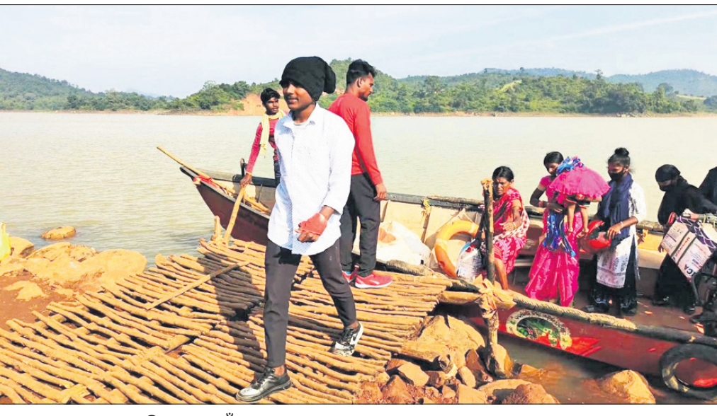
ତଙ୍ଗାରେ ଯାତାୟାତ କରୁଛନ୍ତି ଜଳବନ୍ଦୀ ଗାଁ ଲୋକେ ।

ମରୀଚିକା ପାଲଟିଛି ଇନ୍ଦ୍ରାବତୀ ସେତୁ ନିର୍ମାଣ କାମ । ଯେଉଁମାନେ ଇନ୍ଦ୍ରାବତୀ ଜଳ ଭଣ୍ଡାର ପାଇଁ ନିଜ ଭିତାମାଟି, ଘରଦ୍ୱାର, ସୁନାର ଫସଲ ଦେଉଥିବା କ୍ଷେତ ଛାଡି ଦେଲେ, ସେମାନଙ୍କ ବିକାଶ ଆଜି ପର୍ଯ୍ୟନ୍ତ ହୋଇପାରି ନାହିଁ । ଇନ୍ଦ୍ରାବତୀ ଜଳଭଣ୍ଡାର ନିର୍ମାଣ ହୋଇ ବୁଲି ଦଶନ୍ଧି ବିତିଯାଇଥିଲେ ମଧ୍ୟ ଆଜି ପର୍ଯ୍ୟନ୍ତ ନିଜ ଭିତାମାଟି ଛାଡିଥିବା ଲୋକଙ୍କ ଗମନାଗମନ ପାଇଁ ବ୍ରିଜ୍‌ଟିଏ ମଧ୍ୟ ନିର୍ମାଣ ହୋଇ ପାରିନାହିଁ । ଫଳରେ ଆଜି ବି ଲୋକମାନଙ୍କୁ ତଙ୍ଗା ସାହାଯ୍ୟରେ ନଦୀପାର ହେବାକୁ ପଡୁଛି । କଳାହାଣ୍ଡି ଜିଲ୍ଲା ଥୁଆମୁଳ ରାମପୁର ବ୍ଲକ ଭୌଗୋଳିକ ପରିସୀମା ମଧ୍ୟରେ ଇନ୍ଦ୍ରାବତୀ ଜଳଭଣ୍ଡାର ସୃଷ୍ଟି ହେଲା । ଏଥିରେ ବ୍ଲକର ଗୋପାଳୀପୁର, ଅଡ୍ର, ମାଳିଗାଁ, ପାତେପଦର, ଘୁଟୁଣାଳ ଆଦି ପଞ୍ଚାୟତ ଅନେକାଂଶ ଲୋକାକା ଜଳଭଣ୍ଡାର ମଧ୍ୟରେ ବିଲୀନ ହେଲା । ପରେ ଲୋକଙ୍କୁ ବିସ୍ଥାପିତ କରାଗଲା । ଯେଉଁମାନେ ଇନ୍ଦ୍ରାବତୀ ଜଳ ଭଣ୍ଡାର ପାଇଁ କୌଣସି ଦ୍ୱିଧା ନ ରଖି ନିଜ ଭିତାମାଟି, ଘରଦ୍ୱାର, ସୁନାର ଫସଲ ଦେଉଥିବା କ୍ଷେତ ଛାଡି ଦେଲେ । ଇନ୍ଦ୍ରାବତୀ ଜଳଭଣ୍ଡାରର ୧୧୦ ବର୍ଗ କି.ମି. ପ୍ରଶସ୍ତ ଜଳବାଣୀ ମଧ୍ୟରେ ବିଲିନ ହୋଇଗଲା ୨୪୫୫ ପରିବାର । ବିସ୍ଥାପିତ ହୋଇଗଲେ ୬୩୩୩ ପରିବାର । ବିସ୍ଥାପିତ ପରେ କିଛିପରିବାର ଅନ୍ୟ ସ୍ଥାନକୁ ଯାଇ ରହିଥିବା ବେଳେ କିଛି ପରିବାର ତାଙ୍କର ପୁରୁଣା ସ୍ମୃତିକୁ