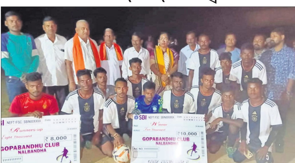
ପୁଟବଲ ପ୍ରତିଯୋଗିତା ଉଦ୍‌ଯାପନାରେ ଖେଳାଳିଙ୍କୁ ପୁରସ୍କୃତ କରାଯାଇଛି।