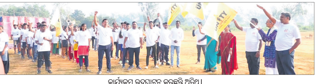
କାର୍ଯ୍ୟକ୍ରମ ଉଦ୍‌ଘାଟନ କରୁଛନ୍ତି ଅତିଥି ।