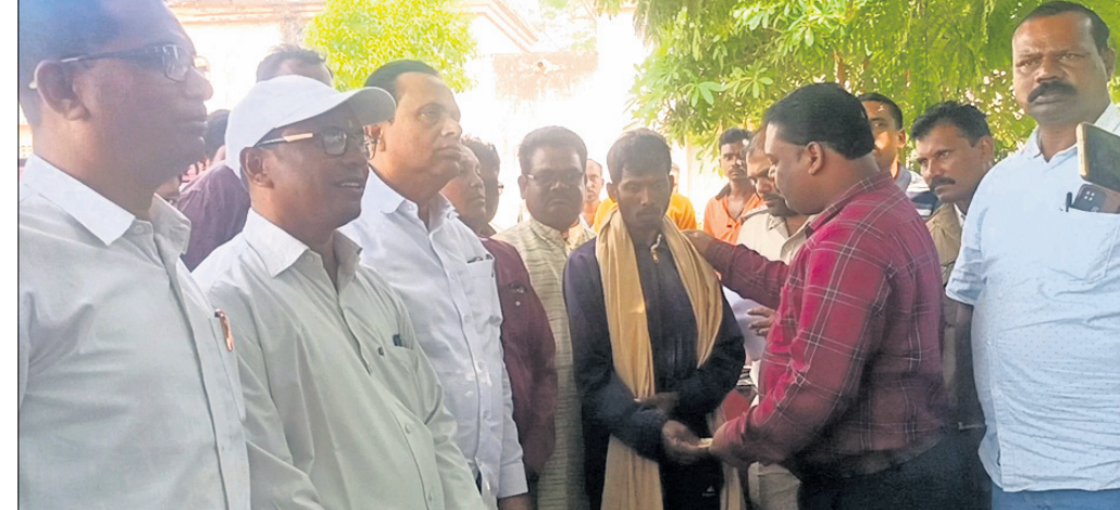
ମୃତକ ପରିବାରକୁ ନଗଦ ରାଶି ପ୍ରଦାନ କରାଯାଇଛି ।