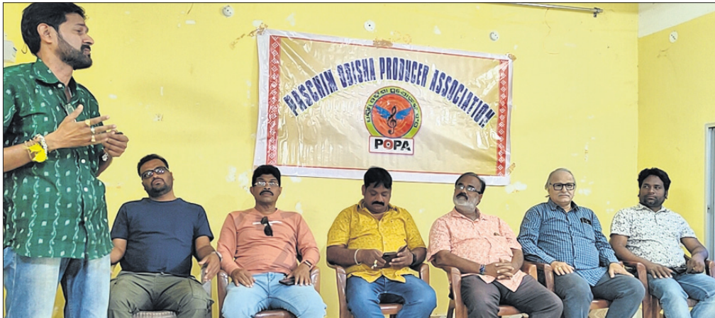
ବୈଠକରେ ଉପସ୍ଥିତ ପଶ୍ଚିମ ଓଡ଼ିଶା ପ୍ରଯୋଜକ ସଂଘ ସଦସ୍ୟମାନେ।