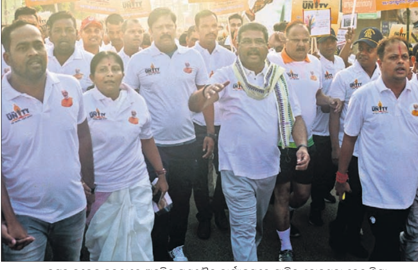
କଟକ କଲେଜ ଛକଠାରେ ଅନୁଷ୍ଠିତ ଗଣଦୌଡ଼ କାର୍ଯ୍ୟକ୍ରମରେ ସାମିଲ ହୋଇଥିବା କେନ୍ଦ୍ର ଶିକ୍ଷା ଓ ଦକ୍ଷତା ବିକାଶ ମନ୍ତ୍ରୀ ଧର୍ମେନ୍ଦ୍ର ପ୍ରଧାନଙ୍କ ସମେତ ଅନ୍ୟମାନେ ।

କଟକ, ୩୧.୧୦.୨୩ (ଶିଳ୍ପ ପ୍ରତିନିଧି) ଲୋକମାନଙ୍କ ସର୍ବଦା ବଳାଭାଗ ପଚେଲେ ଜୟନ୍ତୀରେ ଗଣଦୌଡ଼ ତଥା ରାଷ୍ଟ୍ରୀୟ ଏକତା ଦିବସ ଅବସରରେ ଭାଜପା କଟକ ନଗର ପକ୍ଷରୁ ମଙ୍ଗଳବାର ଗଣଦୌଡ଼ କାର୍ଯ୍ୟକ୍ରମ କଟକ କଲେଜ ଛକଠାରେ ଅନୁଷ୍ଠିତ ହୋଇଯାଇଛି ।