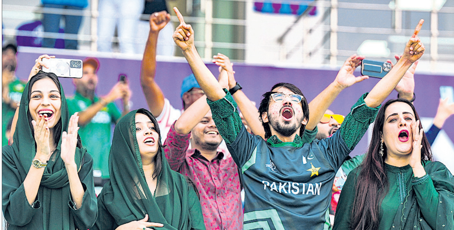
ବାଂଲାଦେଶ ବିପକ୍ଷରେ ପାକିସ୍ତାନ ବିଜୟରେ ଉଲ୍ଲାସିତ ପ୍ରଶଂସକ।

ପୁଣା, ୩୧।୧୦ (ପି.ଟି.) ସ୍ଥାନୀୟ ଓଫିସ୍ରେ ଷ୍ଟାଡ଼ିୟମରେ ଉନ୍ନତ ଅପେକ୍ଷାରେ ସଚିନ ଟେନ୍ଡୁଲକରଙ୍କ ପ୍ରତିମୂର୍ତ୍ତି ଉନ୍ନତ ହେବ। ବର୍ଷ ପ୍ରାରମ୍ଭରେ ଏହି ବିଷୟରେ ସୂଚନା ଦିଆଯାଇଥିଲା। ଟେନ୍ଡୁଲକର ଗତ ଏପ୍ରିଲରେ ୫୦ ବର୍ଷରେ ପଦାର୍ପଣ କରିଛନ୍ତି। ମଙ୍ଗଳବାର ଏହି ପ୍ରତିମୂର୍ତ୍ତିରେ ଶେଷ ସର୍ଗ ଦିଆଯାଇଛି। ଷ୍ଟେଡ଼ିୟମରେ ପ୍ରତିମୂର୍ତ୍ତି ସଚିନ ଟେନ୍ଡୁଲକର ଷ୍ଟାଡ଼ିୟମ ନିକଟରେ ରଖାଯାଇଛି। ଟେନ୍ଡୁଲକରଙ୍କ ମୂର୍ତ୍ତି ଉଦ୍ଘାଟନ ଉତ୍ସବରେ ମହାରାଷ୍ଟ୍ର ମୁଖ୍ୟମନ୍ତ୍ରୀ