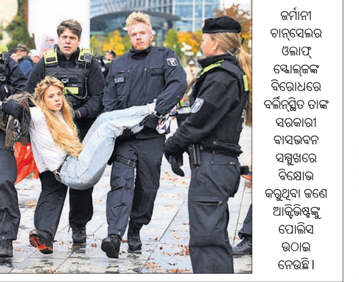
ଜର୍ମାନୀ ଚାନ୍ସେଲର ଓଲାଫ୍ ସୋଲଜ୍‌ଜକ୍ ବିରୋଧରେ ବର୍ଲିନସ୍ଥିତ ତାଙ୍କ ସରକାରୀ ବାସଭବନ ସମ୍ମୁଖରେ ବିରୋଧ କରୁଥିବା ଜଣେ ଆକ୍ଟିଭିଷ୍ଟଙ୍କୁ ପୋଲିସ ଉଠାଇ ନେଉଛି।

ଆଇଲାଣ୍ଡ, ୩୧।୧୦ ଆଇଲାଣ୍ଡ ଯିବାକୁ ହେଲେ ଭାରତୀୟମାନଙ୍କୁ ଆଉ କିଛି ଆବଶ୍ୟକ ହେବ ନାହିଁ। ବିନା ଭିଜାରେ ସେଠାରେ ଭାରତୀୟମାନେ ମାସେ ପର୍ଯ୍ୟନ୍ତ ରହିପାରିବେ। ୨୦୨୪ ମେ'ରୁ ଏହି ସୁବିଧା ପ୍ରଦାନ କରାଯିବ ବୋଲି ବ୍ୟାଙ୍କାକ୍ ପକ୍ଷରୁ ଜଣାଯାଇଛି। ଆଇଲାଣ୍ଡ ପର୍ଯ୍ୟଟନ ବଜାରରେ ବୃଦ୍ଧି ଉପ ହେଉଛି ଭାରତ। ମାଲଦିଭିଆ, ଚାଇନା ଓ ଦକ୍ଷିଣ କୋରିଆରୁ ସର୍ବାଧିକ ପର୍ଯ୍ୟଟକ ଆଇଲାଣ୍ଡ ଯାଇଥାନ୍ତି। ପ୍ରତିବର୍ଷ ୧.୨ ନିୟୁଟ ଭାରତୀୟ ଆଇଲାଣ୍ଡ ଗସ୍ତ କରିଥାଆନ୍ତି।