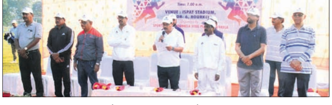
ଆର୍କସ୍‌ସପିରେ ଅନୁଷ୍ଠିତ କାର୍ଯ୍ୟକ୍ରମରେ ଏକତା ବାର୍ତ୍ତା ପ୍ରଦାନ କରାଯାଇଛି।

ରାଜରକେଲା, ୩୧।୧୦ (ବିପ୍ଳବ ରଞ୍ଜନ ଦାଶ) ଆର୍କସ୍‌ସପି କର୍ମଚାରୀ ସାମୁଦାୟିକ ଦ୍ୱାରା ମନାକବାର ରାଷ୍ଟ୍ରୀୟ ଏକତା ଦିବସ ପାଳିତ ହୋଇଯାଇଛି। ଏହି ଉପଲକ୍ଷେ ଶପଥ ଗ୍ରହଣ କରାଯିବା ସହ ସମସ୍ତେ ରତ୍ନ ଫର ୟୁନିଟିରେ ଭାଗ ନେଇଥିଲେ। ବୋକାରୋ ତଥା ଆର୍କସ୍‌ସପିର ଭାରପ୍ରାପ୍ତ ନିର୍ଦ୍ଦେଶକଙ୍କ ନେତୃତ୍ୱରେ ମହାନ ସମ୍ମିଳନୀ କକ୍ଷରେ ଅନୁଷ୍ଠିତ ଶପଥ ଗ୍ରହଣ ସମାରୋହ ସଭାରେ ବହୁ ବରିଷ୍ଠ