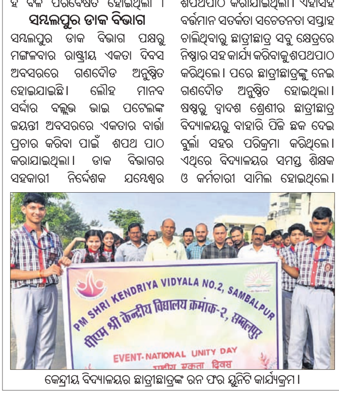
କେନ୍ଦ୍ରୀୟ ବିଦ୍ୟାଳୟର ଛାତ୍ରାଛାତ୍ରୀଙ୍କୁ ରନ ଫର ୟୁନିଟି କାର୍ଯ୍ୟକ୍ରମ ।