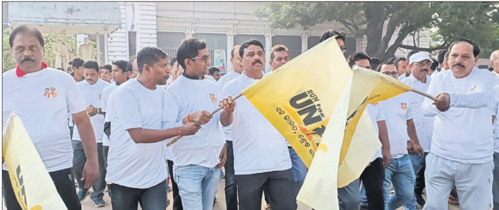
ଏକତା ପାଇଁ ଗଣଦୌଡ଼କୁ ଅତିଥିମାନେ ଶୁଭାଚରଣ କରୁଛନ୍ତି।

ଲୋହି ମାନବ ସର୍ବୋତ୍ତମ ଭାବ ପତେଲଙ୍କ ଜନ୍ମ ଦିବସ 'ରାଷ୍ଟ୍ରୀୟ ଏକତା ଦିବସ' ପାଳନ ଅବସରରେ ବିକାଶ ଫାଉଣ୍ଡେସନ ଟ୍ରଷ୍ଟ, ନେହେରୁ ଯୁବକେନ୍ଦ୍ର ସଙ୍ଗଠନ ଓ ଏନ୍‌ଏସ୍‌ଏସ୍ ପକ୍ଷରୁ ଦେବଗଡ଼ରେ 'ରନ୍ ଫର୍ ୟୁନିଟି' ବା ଏକତା ପାଇଁ ଗଣଦୌଡ଼ ଅନୁଷ୍ଠିତ ହୋଇଯାଇଛି।