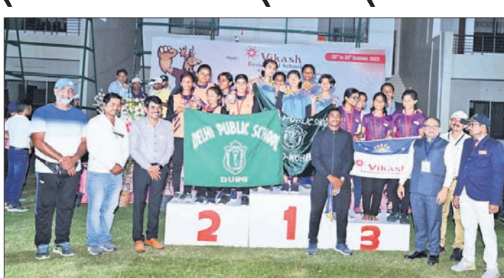
ପ୍ରତିଯୋଗିତାର କୃତୀ ପ୍ରତିଯୋଗୀବୃନ୍ଦ।

ବରଗଡ଼, ୩୧।୧୦(ପ୍ରେମାନନ୍ଦ ଖମରା) ବରଗଡ଼ ବିକାଶ ଆବାସିକ ବିଦ୍ୟାଳୟରେ ଅତିଥିବୃନ୍ଦ କୃଷ୍ଣର ୧ ଓ ୨ ଆଧୁନିକ ମିର୍ ଯୋଗଦାନ ଉଦ୍‌ଯାପିତ ହୋଇଛି। ପ୍ରତିଯୋଗିତାରେ ଭାରତ ପୂର୍ଣ୍ଣାଙ୍ଗକ ୧୧ରାଜ୍ୟର ୧୫ଜଣରୁ ଉର୍ଦ୍ଧ୍ୱ ପ୍ରତିଯୋଗୀ ଅଂଶଗ୍ରହଣ କରିଥିଲେ। ଉଦ୍‌ଯାପନା ସମାରୋହ ଆରମ୍ଭରେ ବିକାଶ