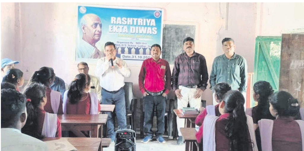
ଏସ୍‌ଏନ୍ କୁନିୟର କଲେଜରେ 'ରାଷ୍ଟ୍ରୀୟ ଏକତା ଦିବସ' ପାଳନ କାର୍ଯ୍ୟକ୍ରମରେ ଅତିଥି।