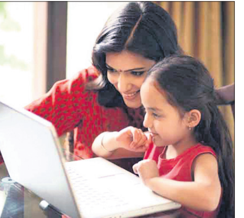
ଆମ ସମାଜର କିଛିତା ଦୃଶ୍ୟ କେବଳ ଦୃଷ୍ଟା ଦେଲି । ଆମ ଅଲକ୍ଷ୍ୟରେ ଆମେ ଏମିତି କାମସବୁ କରୁନାହିଁ କି ? ଆମେ ନିଜକୁ ପିଲାଙ୍କ ଉପରେ ଥୋପି ଚାଲିଚୋ । ସେ କ'ଣ ଖାଇବ, କେତେ ଶୋଇବ, କାହା ସାଥରେ ସାଙ୍ଗ ହେବ, କେମିତି କଥା ହେବ, କେତେ କଥା ହେବ ଇଚ୍ଚାଦି । ଆମେ ଶିକ୍ଷା ଦେବା । କିନ୍ତୁ ଆମେ ନିଜସ୍ୱ ଦାୟିତ୍ୱ ପିଲାଙ୍କ ଉପରେ ଲଦିଦେବା ଦ୍ୱାରା ପିଲେ ବୋଝରେ ଆକ୍ରାମାନ୍ତା ହୋଇ ସବୁବେଳେ ସେଇ ବେଞ୍ଚରେ