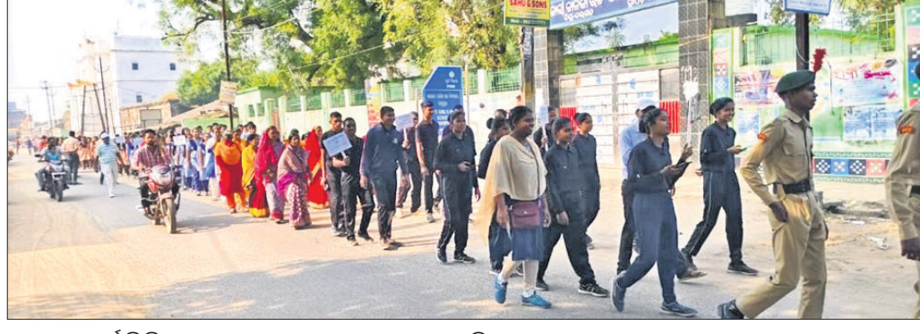
ପଦ୍ମପୁରରେ ଦୁର୍ନୀତି ନିବାରଣ ସଚେତନତା ଶୋଭାଯାତ୍ରା କରାଯାଇଛି।