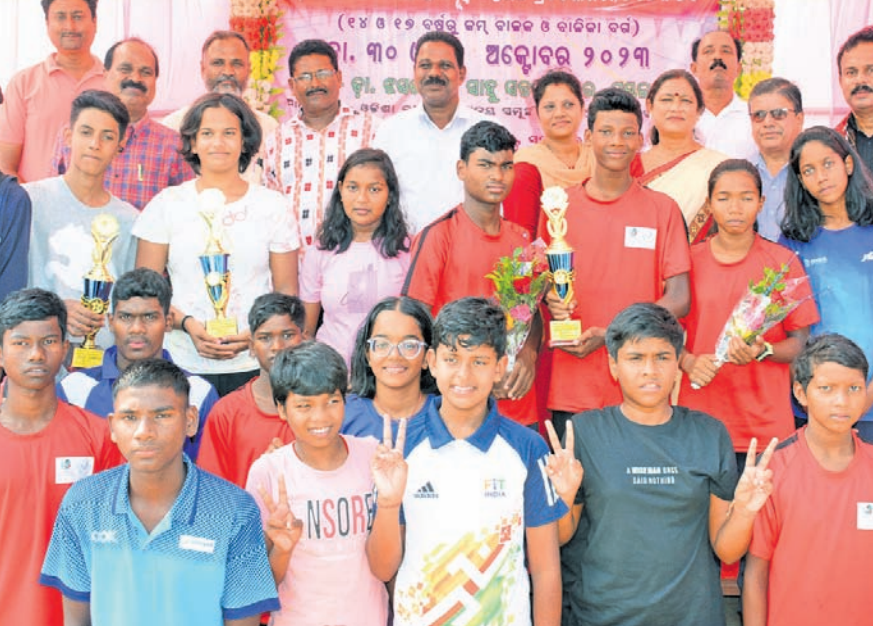
ଅତିଥିକ୍ଷେତ୍ରର ବନ୍ଦନାରେ ବିଜିତ ବର୍ଗରେ ଚାମ୍ପିୟନ ଭୁବନେଶ୍ୱର ଦଳ।

ସମ୍ବଲପୁର, ୩୧/୧୦ (ପି.ଟି.ଗଜ୍) ଓଡ଼ିଶା ରାଜ୍ୟ ବିଦ୍ୟାଳୟ ସମୂହ ସକ୍ୱରଣ ପ୍ରତିଯୋଗିତା ମଙ୍ଗଳବାର ସମ୍ବଲପୁରସ୍ଥିତ ଡା. ଝେକେଟନ ସାହୁ ସକ୍ୱରଣାଗାରରେ ଉଦ୍‌ଯାପିତ ହୋଇଯାଇଛି। ଏଥରେ ୧୪ ବର୍ଷରୁ କମ୍ ବାଳିକା ବର୍ଗରେ ସମ୍ବଲପୁର ଦଳ ଗତ ଚାମ୍ପିୟନ ହୋଇଛି। ସେହିପରି ୧୪ ବର୍ଷରୁ କମ୍ ବାଳକ, ୧୭ ବର୍ଷରୁ କମ୍ ବାଳିକା ଓ ବାଳକ ବର୍ଗରେ ଭୁବନେଶ୍ୱର ଦଳ ଗତ ଚାମ୍ପିୟନ ହୋଇଛି। ଓଡ଼ିଶା ରାଜ୍ୟ ବିଦ୍ୟାଳୟ ସମୂହ କ୍ରୀଡ଼ା ସଙ୍ଗଠନ ଓ ସମ୍ବଲପୁର ଜିଲ୍ଲା ଶିକ୍ଷା କାର୍ଯ୍ୟକ୍ରମ ମିଳିତ ଆୟୋଜିତ ରାଜ୍ୟସ୍ତରୀୟ ପ୍ରତିଯୋଗିତାରେ ମୋଟ ୧୦ ଜିଲ୍ଲାରୁ ୯୭ ଜଣ ପ୍ରତିଯୋଗୀ ଅଂଶଗ୍ରହଣ କରିଥିଲେ। ୨୮