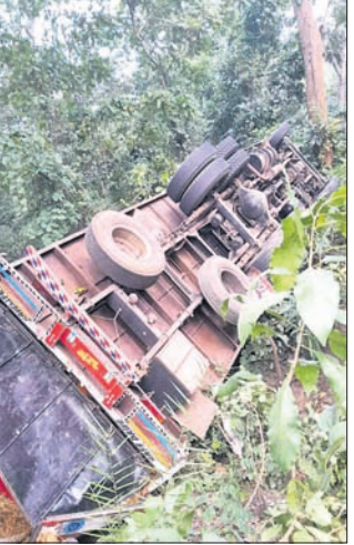
ଓଲଟି ପଡ଼ିଥିବା କଣ୍ଠେନର।