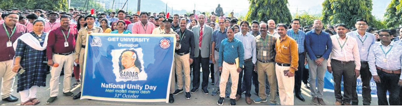
ଶୋଭାଯାତ୍ରାରେ ସାମିଲ ହୋଇଥିବା ଗୁଣପୁର ଜିଆଇଇଟି ବିଶ୍ୱବିଦ୍ୟାଳୟର ଛାତ୍ରଛାତ୍ରୀ, ଅଧ୍ୟାପିକା ଓ ଅଧ୍ୟାପକମାନେ।