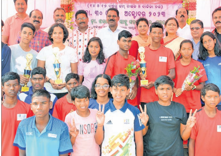
ଅତିଥିକ୍ଷେତ୍ର ଗହଣରେ ବିଭିନ୍ନ ବର୍ଗରେ ଚାମ୍ପିୟନ ଭୁବନେଶ୍ୱର ଦଳ।