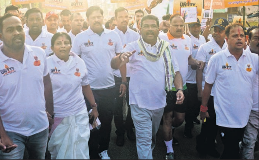
କଟକ କଲେଜ ଛକଠାରେ ଅନୁଷ୍ଠିତ ଗଣଦୌଡ଼ କାର୍ଯ୍ୟକ୍ରମରେ ସାମିଲ ହୋଇଥିବା କେନ୍ଦ୍ର ଶିକ୍ଷା ଓ ବକ୍ଷତା ବିକାଶ ମନ୍ତ୍ରୀ ଧର୍ମେନ୍ଦ୍ର ପ୍ରଧାନଙ୍କ ସମେତ ଅନ୍ୟମାନେ ।

ସର୍ବୋଚ୍ଚ ବିଚାରାଳୟ ପଟେଲଙ୍କ ଉଦ୍‌ଘାଟନାରେ ଗଣଦୌଡ଼