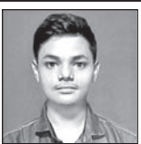
ଏସ୍.ଏନ୍. କାଗୁତି ପରିବାରବର୍ଗ