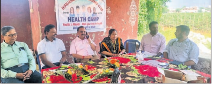
ସ୍ୱାସ୍ଥ୍ୟସେବା ଶିବିରରେ ଉପସ୍ଥିତ ଅଧିକାରୀ ଏବଂ କୁଳ ସଦସ୍ୟ।

ରାୟଗଡ଼ା ଝଞ୍ଜାବତୀ ମହିଳା ଖାକର୍ସ କୁଳର ପ୍ରତିଷ୍ଠା ଦିବସ ଅବସରରେ ମଙ୍ଗଳବାର ସହରର ଅଞ୍ଚଳଗୁଡ଼ା ନିକଟସ୍ଥ ଡେପ ସାହିରେ ଏକ ମାଗଣା ସ୍ୱାସ୍ଥ୍ୟ ଶିବିର ଅନୁଷ୍ଠିତ ହୋଇଛି।