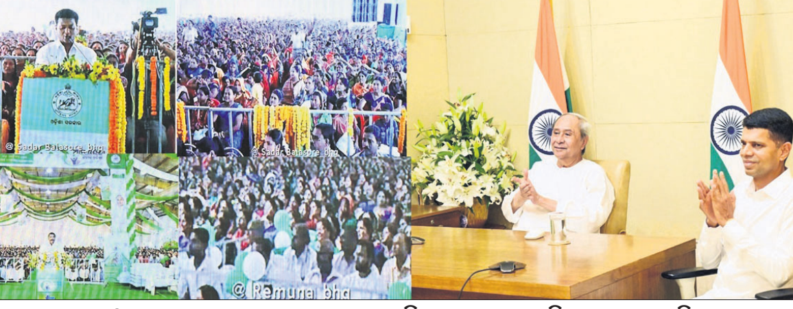
ଭୁବନେଶ୍ୱର, ୩୧।୧୦ (ଅନିଲ ଦାସ)

ବାଲେଶ୍ୱର, ବଲାଙ୍ଗୀର ଜିଲ୍ଲାରେ ଆମ ଓଡ଼ିଶା ନବୀନ ଓଡ଼ିଶା ଶୁଭାରମ୍ଭ