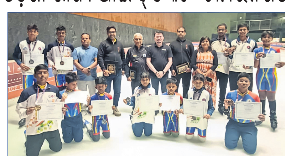
ରାଜ୍ୟ ଆଇସ୍ ସ୍କେଟିଂ ଚାମ୍ପିୟନଶିପ୍ରେ କୃତୀ ପ୍ରତିଯୋଗୀମାନେ ଅତିଥିଙ୍କୁ ଗହଣେ ।

ଭୁବନେଶ୍ୱର, ୩୧.୧୧.୨୦ (ତପନ ସ୍ୱାଇଁ) ଭାରତର ସର୍ବବୃହତ୍ ଇନ୍ଦରପୁର ଆଇସ୍ ସ୍କେଟିଂ ରିଙ୍ଗ୍ ଗୁରଗାଓରେ ଇସ୍କାଟିଂରେ ଓଡ଼ିଶା ରାଜ୍ୟ ଆଇସ୍ ସ୍କେଟିଂ ଚାମ୍ପିୟନଶିପ୍ ସଫଳତାର ସହ ଅନୁଷ୍ଠିତ ହୋଇଯାଇଛି ।