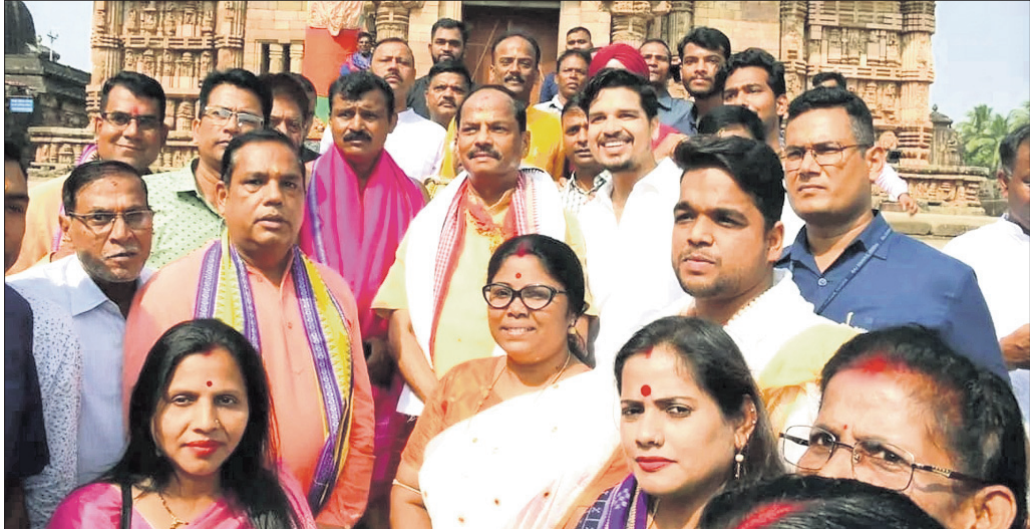
ପ୍ରଭୁ ଶ୍ରୀଲିଙ୍ଗରାଜଙ୍କୁ ଦର୍ଶନ ଅବସରରେ ନୂଆ ରାଜ୍ୟପାଳ ରଘୁବର ଦାସ ଏବଂ ଅନ୍ୟମାନେ।