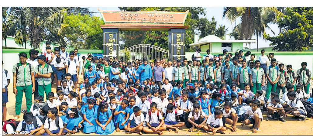
ସ୍କୁଲ ଫାଟକରେ ତାଲା ପକାଇ ଛାତ୍ରଛାତ୍ରୀମାନେ ଧାରଣାରେ ବସିଛନ୍ତି।