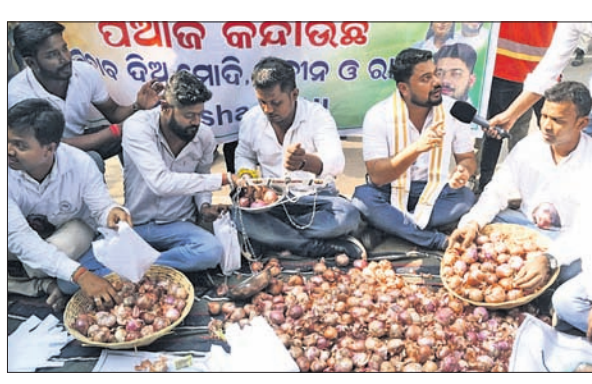
କୃଷିମନ୍ତ୍ରୀ ରଣେନ୍ଦ୍ର ପ୍ରତାପ ସାହୁଙ୍କ ବାସଭବନ ଆଗରେ ଛାତ୍ର କଂଗ୍ରେସ କର୍ମକର୍ତ୍ତା ଶସ୍ତ୍ରାରେ ପିଆଜ ବିକି କରୁଛନ୍ତି।