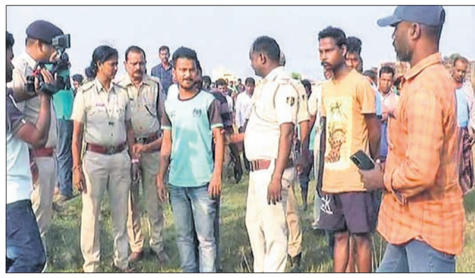
ଅଭିଯୁକ୍ତଙ୍କୁ ନେଇ ପୋଲିସ ଘଟଣାସ୍ଥଳରେ ସିନ୍ଦ୍ରିତ୍ୱିଏଶନ କରୁଛି।