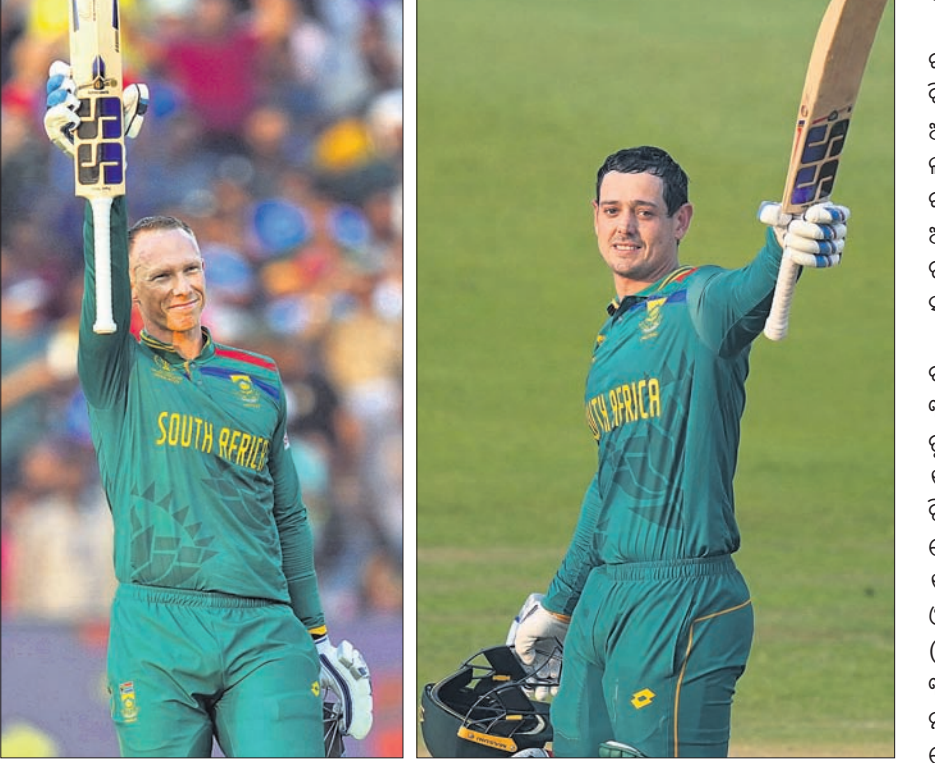
ଶତକ ହାସଲ ପରେ ଦକ୍ଷିଣ ଆଫ୍ରିକାର ରବି ଭାନ୍‌ଡର୍‌ ଡୁସେନ୍ ଓ କ୍ରିକେଟ ଡି'କକ୍।

ପରିବେଶ ପ୍ରଦୂଷଣକୁ ଦୂଷ୍ଟରେ ରଖି ବଡ଼ ନିଷ୍ପତ୍ତି ନେଇଛି ବିଦିଆଲ। ଦିଲ୍ଲୀ ଓ ମୁମ୍ବାଇର ବିଭିନ୍ନ କ୍ରିକେଟ ଷ୍ଟାଡ଼ିୟମରେ ଖେଳାଯିବାକୁ ଥିବା ମ୍ୟାଚଗୁଡ଼ିକ ପରେ ବାଣ୍ଟା ହେବନି। ଉଭୟ ସହରରେ ବାୟୁ ପ୍ରଦୂଷଣର ମାତ୍ରା ତେଜ ଅଧିକ ରହିଛି। ଫଳରେ ଏଠାରେ ଖେଳାଯିବାକୁ ଥିବା ମ୍ୟାଚଗୁଡ଼ିକରେ ଏଣିକି ଆତସବାଜି ବେଖୁବାରୁ ମିଳିବ ନାହିଁ। ଦିଲ୍ଲୀରେ ଆଉ ଗୋଟିଏ ମ୍ୟାଚ ବାକି ରହିଛି। ନଭେମ୍ବର ୬ ତାରିଖରେ ବାଂଲାଦେଶ ଓ ଶ୍ରୀଲଙ୍କା ମଧ୍ୟରେ ଏହି ମ୍ୟାଚ ଖେଳାଯିବ। ତେବେ ମୁମ୍ବାଇରେ ଆଉ ୩ ମ୍ୟାଚ ଖେଳାଯିବାକୁ ଅଛି। ନଭେମ୍ବର ୨, ନଭେମ୍ବର ୭ ତାରିଖରେ ଦୁଇଟି ଲିଗ