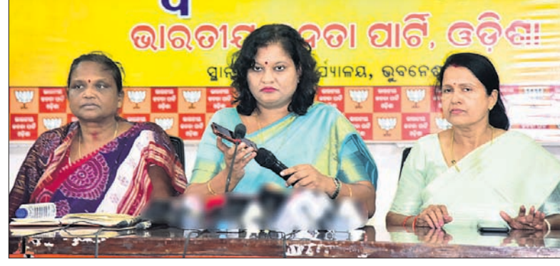
ଭାଜପା ରାଜ୍ୟ କାର୍ଯ୍ୟାଳୟରେ ମହିଳା ମୋର୍ଚ୍ଚା ପସରୁ ଆୟୋଜିତ ଖବରଦାତା ସମ୍ମିଳନୀ।

ଦୀର୍ଘ ୨୩ ବର୍ଷ ଧରି ଓଡ଼ିଶାରେ ବିଜେଡି ଶାସନ କରୁଥିଲେ ମଧ୍ୟ ମହିଳାମାନେ ଏଠାରେ ସମ୍ପୂର୍ଣ୍ଣ ଅସୁରକ୍ଷିତ। ଏନେଇ ଭାଜପା ବାରମ୍ବାର ଅଭିଯୋଗ କରିଆସୁଥିଲେ ମଧ୍ୟ ରାଜ୍ୟ ସରକାର କର୍ତ୍ତୃପକ୍ଷ କରୁନାହାନ୍ତି। ଓଡ଼ିଶା ଏଭଳି ଏକ ରାଜ୍ୟ ଯେଉଁଠି ପ୍ରତି ଅଢ଼େଇ ଘଣ୍ଟାରେ ଜଣେ ମହିଳା ବଳାକାରରେ ଶିକାର ହେଉଛି। ରାଜ୍ୟରେ ଆଇନଶୃଙ୍ଖଳା ପରିଚ୍ଛିନ୍ନ ସମ୍ପୂର୍ଣ୍ଣ ଭୁଲୁଥିବାଛାନ୍ତି।