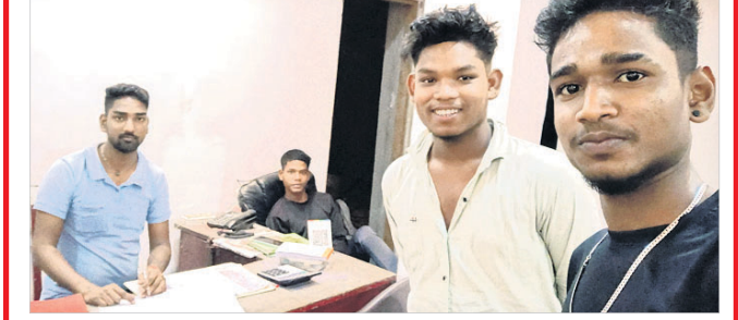
@ ଅଗସ୍ତି ନିଲୁ