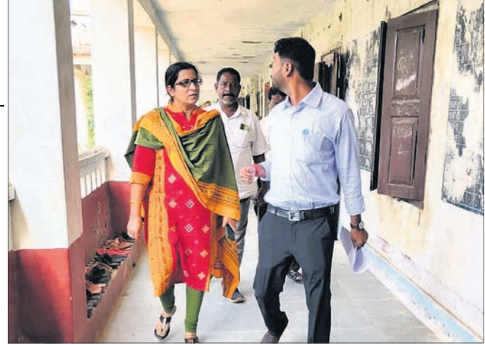
ବିତିଓ ଓ କନିଷ୍ଠ ଯତ୍ନା କୁଞ୍ଜବିହାରୀ ବାଲିକା ଉଚ୍ଚ ବିଦ୍ୟାଳୟ ବୁଲି ଦେଖୁଛନ୍ତି ।