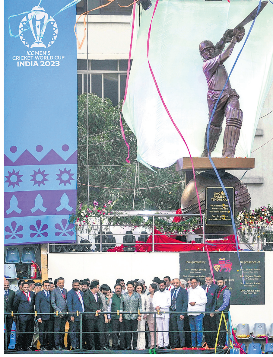
ମୁମ୍ବାଇର ଓ଼ିଆରେ ଷ୍ଟାଡ଼ିୟମରେ ରୁଧିର ସଚିନ୍ ତେନ୍ତୁଳକରଙ୍କ ପ୍ରତିମୂର୍ତ୍ତି ଉନ୍ମୋଚନ ଅବସରରେ ମହାରାଷ୍ଟ୍ର ମୁଖ୍ୟମନ୍ତ୍ରୀ ଏକନାଥ ସିନ୍ଧେ ଓ ଅନ୍ୟମାନେ।