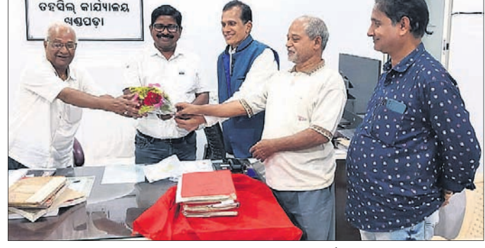
ନାଗରିକ ଫୋରମ ପକ୍ଷରୁ ତହସିଲଦାରଙ୍କୁ ସମ୍ବର୍ଦ୍ଧନା କରାଯାଇଛି ।