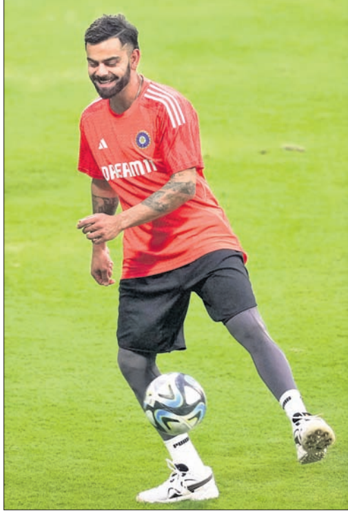
ରୁଧିର ଅଭ୍ୟାସ ଅବସରରେ ଶୁଭମନ ଗିଲ୍ ଓ ବିରାଟ କୋହଲି।