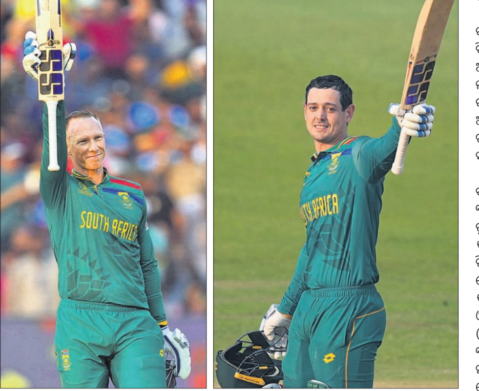
ଶତକ ହାସଲ ପରେ ଦକ୍ଷିଣ ଆଫ୍ରିକାର ରବି ଭାନ୍ ଡର୍ ଭୃସେନ ଓ କ୍ରିକେଟ ଡି'କକ୍।

ପରିବେଶ ପ୍ରଦୂଷଣକୁ ଦୂଷ୍ଟରେ ରଖି ବଡ଼ ନିଷ୍ପତ୍ତି ନେଇଛି ବିଦିଆଳା ଦିଲ୍ଲୀ ଓ ମୁମ୍ବାଇର ବିଜିଟ କ୍ରିକେଟ ଷ୍ୱାତିୟମରେ ଖେଳାଯିବାକୁ ଥିବା ମ୍ୟାଚଗୁଡ଼ିକ ପରେ ବାଣ ପୁଟା ହେବନି। ଉଭୟ ସହରରେ ବାୟୁ ପ୍ରଦୂଷଣର ମାତ୍ରା ତେଜ ଅଧିକ ରହିଛି। ଫଳରେ ଏଠାରେ ଖେଳାଯିବାକୁ ଥିବା ମ୍ୟାଚଗୁଡ଼ିକରେ ଏଣିକି ଆତସବାଜି ବେଖୁବାରୁ ମିଳିବ ନାହିଁ। ଦିଲ୍ଲୀରେ ଆଉ ଗୋଟିଏ ମ୍ୟାଚ ବାକି ରହିଛି। ନଭେମ୍ବର ୬ ତାରିଖରେ ବାଂଲାଦେଶ ଓ ଶ୍ରୀଲଙ୍କା ମଧ୍ୟରେ ଏହି ମ୍ୟାଚ ଖେଳାଯିବ। ତେବେ ମୁମ୍ବାଇରେ ଆଉ ୩ ମ୍ୟାଚ ଖେଳାଯିବାକୁ ଅଛି। ନଭେମ୍ବର ୨, ନଭେମ୍ବର ୭ ତାରିଖରେ ଦୁଇଟି ଲିଗ ମ୍ୟାଚ ଖେଳାଯିବ। ପରିବେଶ ପ୍ରଦୂଷଣକୁ ନେଇ ବିଦିଆଳା ସର୍ବଦା ଏହାର ପକ୍ଷ ରଖିଥାଏ। ଏହି ପ୍ରସଙ୍ଗରେ ଆମେ ଆଇସିସି ସହିତ ଆଲୋଚନା କରିବା ପରେ ଏହି ନିଷ୍ପତ୍ତି ଗ୍ରହଣ କରାଯାଇଥିବା କହିଛନ୍ତି ବିଦିଆଳା ସମ୍ପାଦକ ଜୟ ଶାହା। ବିଶ୍ୱକପରେ ଆମେ ରଜାରଙ୍ଗ କରିବା ପାଇଁ ଆଗ୍ରହୀ, କିନ୍ତୁ ସମସ୍ତଙ୍କ ସୁରକ୍ଷା ଆମ ପାଇଁ ଗୁରୁତ୍ୱପୂର୍ଣ୍ଣ। ଦିଲ୍ଲୀର ବାୟୁ ଗୁଣାବଳୀ ପୂର୍ବକାଳ କ୍ରମାଗତ ପଞ୍ଚମ ଦିନ ପାଇଁ ଅତ୍ୟନ୍ତ ଖରାପ ରହିଛି। ରୁଧିର ବାୟୁ ପ୍ରଦୂଷଣ ସୂଚକାଙ୍କ ୩୭୨ ରହିଥିଲା। ସମାନ ଭାବରେ ମୁମ୍ବାଇରେ ମଧ୍ୟ ସ୍ଥିତି ସମାନ ପରିମାଣରେ ଖରାପ।