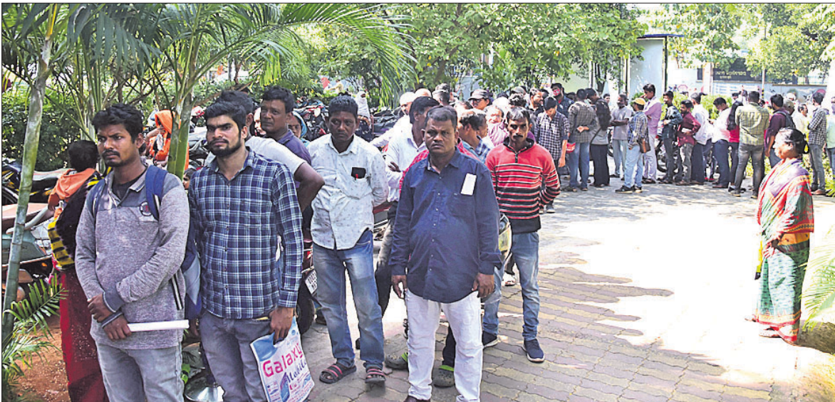
ରୂପବାର ଭୁବନେଶ୍ୱର ଆରବିଆର ପରିସରରେ ୨ହଜାରିଆ ନୋଟ ବଦଳାଇବାକୁ ଆସିଥିବା ଲୋକଙ୍କ ଭିଡ଼।

ଚଳା ବଦଳାଇବା ଘଟଣା ପଛରେ କିଏ ସବୁ ରହିଛି ତାହା ଜଣାପଡ଼ିବ ବୋଲି ଆଲୋଚନା ହେଉଛି। ସକାଳ ପ୍ରାୟ ୮ଟାରୁ ୨ହଜାର ଚଳିଆ ନୋଟ ବଦଳାଇବାକୁ ଆରବିଆର ସାମ୍ବାଦିକ ଶତାଧିକ ଲୋକଙ୍କ ଲକ୍ଷ୍ୟ ଧାଡ଼ି ଦେଖିବାକୁ