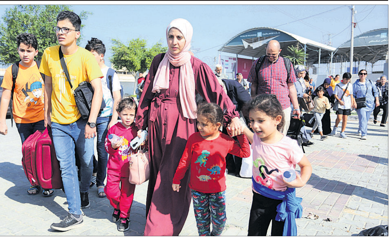
ଗାଜା ସ୍ଥିତ ସଂଲଗ୍ନ ରାସ୍ତାସହ ସାମାନ୍ୟ ଲୋକଙ୍କୁ ପ୍ରବେଶ କରୁଥିବା ସିନାଇରେ ଶରଣାପୀଣୀ