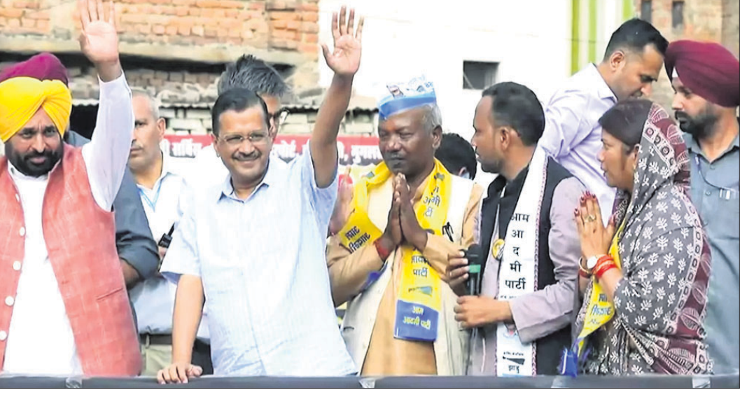
ମଧ୍ୟପ୍ରଦେଶ ସିଂଗଲି କିଲୋ ଅନୁଷ୍ଠାନର ଉପାଧ୍ୟକ୍ଷ ଡ. ଡି. କୁମାର ସିଂହଙ୍କୁ ଭେଟିବା ପାଇଁ ପ୍ରଦେଶ ସରକାରର ମୁଖ୍ୟମନ୍ତ୍ରୀ ଭାଗ୍ୟଲକ୍ଷ୍ମୀ ପ୍ରଧାନ ଓ ଦଳୀୟ ନେତୃତ୍ୱମ୍ବଳୀ