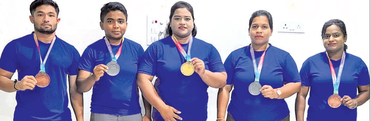
ପୂର୍ବାଞ୍ଚଳ ଶକ୍ତିଉତ୍ତୋଳନ ପ୍ରତିଯୋଗିତାରେ ପଦକ ବିଜୟୀ ଓଡ଼ିଶା ପ୍ରତିଯୋଗୀମାନେ।

ଭୁବନେଶ୍ୱର, ୨୧୧୧ (ବିଜୟ ରଣା) ବିହାରର ନାଳନ୍ଦାଠାରେ ଅନୁଷ୍ଠିତ ପୂର୍ବାଞ୍ଚଳ ଶକ୍ତି ଉତ୍ତୋଳନ ପ୍ରତିଯୋଗିତାରେ ଓଡ଼ିଶାର ପ୍ରତିଯୋଗୀମାନେ ବଡ଼ ସଫଳତା ହାସଲ କରିଛନ୍ତି। ସେମାନେ ୧ ସ୍ୱର୍ଣ୍ଣ, ୨ ରୌପ୍ୟ ଓ ୨ ବ୍ରୋଞ୍ଜ ସହ ମୋଟ ୫ ପଦକ ହାସଲ କରିଛନ୍ତି। ଅକ୍ଟୋବର ୨୯ରୁ