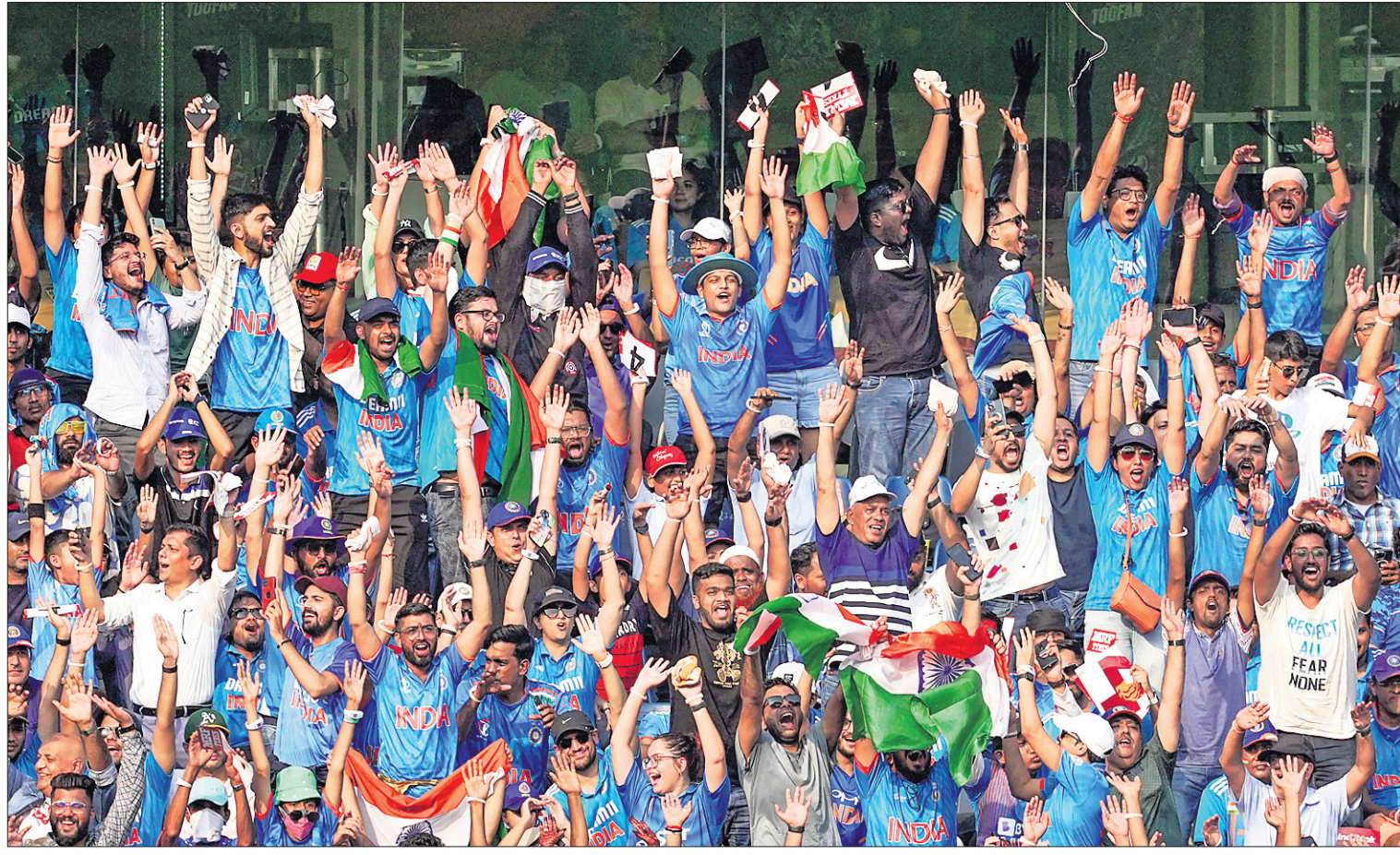
ମୁମ୍ବାଇର ଖୁସିରେ ଭାରିମୁଗ୍ଧ ଗୁରୁବାର ଅନୁଷ୍ଠିତ ଶ୍ରୀଲଙ୍କା ବିପକ୍ଷ ମ୍ୟାଚ ଅବସରରେ ଉଲ୍ଲାସିତ ଭାରତୀୟ ପ୍ରଶଂସକ।

କରିଛନ୍ତି। ଏହି ମ୍ୟାଚ ପୂର୍ବରୁ ଜାହିର ଓ ଶ୍ରୀନାଥଙ୍କ ସମକକ୍ଷ ହେବା ପାଇଁ ଶାମିଙ୍କୁ ୪ ଉଇକେଟର ଆବଶ୍ୟକତା ରହିଥିଲା। ଜାହିର ୨୩ ମ୍ୟାଚ ଖେଳି ଓ ଶ୍ରୀନାଥ ୩୪ ମ୍ୟାଚ ଖେଳି ୪୪ ଉଇକେଟ ନେଇଥିବା ବେଳେ ଶାମି ମାତ୍ର ୧୪ ମ୍ୟାଚରେ ତାଙ୍କୁ ଅତିକ୍ରମ କରିଛନ୍ତି। ବିଶ୍ୱକପ ପୂର୍ବରୁ ଶାମି ୧୧ ମ୍ୟାଚରୁ ୩୧ ଉଇକେଟ ନେଇ ଅନାଲ ଲୁମ୍ବଲେଙ୍କ ରେକର୍ଡର ସମକକ୍ଷ ହୋଇଥିଲେ। ପ୍ରଥମ ୪ ମ୍ୟାଚରେ ତାଙ୍କୁ ସୁଯୋଗ ମିଳି ନ ଥିବା ବେଳେ ଧର୍ମଶାଳାରେ ଦୁଇଟି ଉଇକେଟରେ ପ୍ରଥମ ମ୍ୟାଚ ଖେଳିଥିଲେ। ଏହି ମ୍ୟାଚରେ ୫ ଉଇକେଟ ନେଇଥିବା ବେଳେ ପରବର୍ତ୍ତୀ ମ୍ୟାଚରେ ୪ ଉଇକେଟ ନେଇଥିଲେ। ମୁମ୍ବାଇରେ ଗୁରୁବାର ନିଜ କ୍ୟାରିୟର ଶ୍ରେଷ୍ଠ ବୋଲି କରିବା ସହିତ ଶାମି ଚତୁର୍ଥ ଥର ପାଇଁ ୫ ଉଇକେଟ ସଫଳତା ହାସଲ କରିଥିଲେ। ଏହା ସହ ଜାଭାଗଲ ଶ୍ରୀନାଥଙ୍କ ସେ ପଛରେ ପକାଇଛନ୍ତି। ଚଳିତ ବିଶ୍ୱକପର ତୃତୀୟ ମ୍ୟାଚରେ ଏହା ଶାମିଙ୍କ ଦ୍ୱିତୀୟ ୫ ଉଇକେଟ ସଫଳତା। ୩ ମ୍ୟାଚରୁ ୧୪ ଉଇକେଟ ନେଇ ଚଳିତ ବିଶ୍ୱକପର ସର୍ବାଧିକ ଉଇକେଟ ହାସଲକାରୀ ବୋଲରଙ୍କ ମଧ୍ୟରେ ୬ ନମ୍ବର ସ୍ଥାନରେ ରହିଛନ୍ତି ଶାମି।