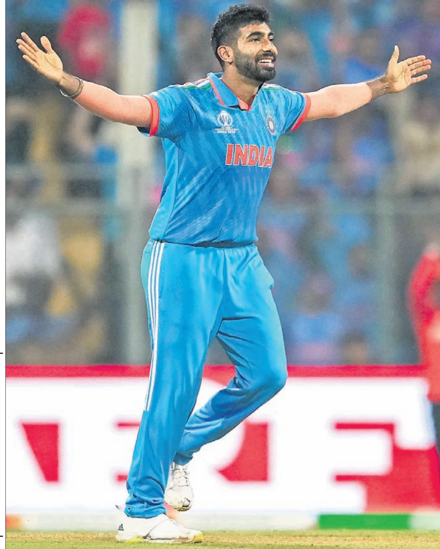
ଶ୍ରୀଲଙ୍କାର ପଥୁମ ନିଶାଙ୍କା ଉଇକେଟ ନେବା ପରେ ଭାରତର ଯଶପ୍ରାପ୍ତ ବୁମ୍ବରା ।

ପୁୟାଲ, ୨୧୧୧ ସ୍ଥାନୀୟ ଖ୍ରୀଷ୍ଟତେ ଷ୍ଟାଡ଼ିୟମରେ ବୁମ୍ବରା ଅନୁଷ୍ଠିତ ଦିନିକିଆ କ୍ରିକେଟ ବିଶ୍ୱକପ ମ୍ୟାଚରେ ଭାରତ ୩୦୨ ରନରେ ଶ୍ରୀଲଙ୍କାକୁ ହରାଇ ଦେଇଛି । ଭାରତ ୫୦ ଓଭରରେ ୮ ଉଇକେଟ ହରାଇ ୩୫୭ ରନ କରିଥିବାବେଳେ ଶ୍ରୀଲଙ୍କା ୧୯.୪ ଓଭରରେ ୫୫ ରନକରି ଅଲଆଉଟ ହୋଇ ଯାଇଛି । ବିଶ୍ୱକପରେ ଭାରତର ଏହା ସର୍ବବୃହତ୍ ଏବଂ ଓଭରଅଲ୍ ଦ୍ୱିତୀୟ ସର୍ବବୃହତ୍ ବିଜୟ । ଚଳିତ ବିଶ୍ୱକପର ନୂଆଦିଲ୍ଲୀରେ ଅନୁଷ୍ଠିତ ମ୍ୟାଚରେ ଅଷ୍ଟ୍ରେଲିଆ ୩୦୯ ରନରେ ନେଦରଲାଣ୍ଡକୁ ହରାଇ ସର୍ବବୃହତ୍ ବିଜୟ ରେକର୍ଡର ଅଧିକାରୀ ରହିଛି । ଏହା ବ୍ୟତୀତ ଦିନିକିଆ କ୍ରିକେଟରେ ମଧ୍ୟ ଭାରତର ଏହା ଦ୍ୱିତୀୟ ସର୍ବବୃହତ୍ ବିଜୟ । ଚଳିତ ବର୍ଷ ପ୍ରାରମ୍ଭରେ ତ୍ରିଭେନ୍ଦ୍ରମଠାରେ ଶ୍ରୀଲଙ୍କା ବିପକ୍ଷରେ ଭାରତ ୩୧୭ ରନରେ ବିଜୟ ହୋଇଥିଲା । ଏହା ଦିନିକିଆରେ ଭାରତର ସର୍ବବୃହତ୍ ବିଜୟ । ୫୫ ରନ ବିଶ୍ୱକପରେ