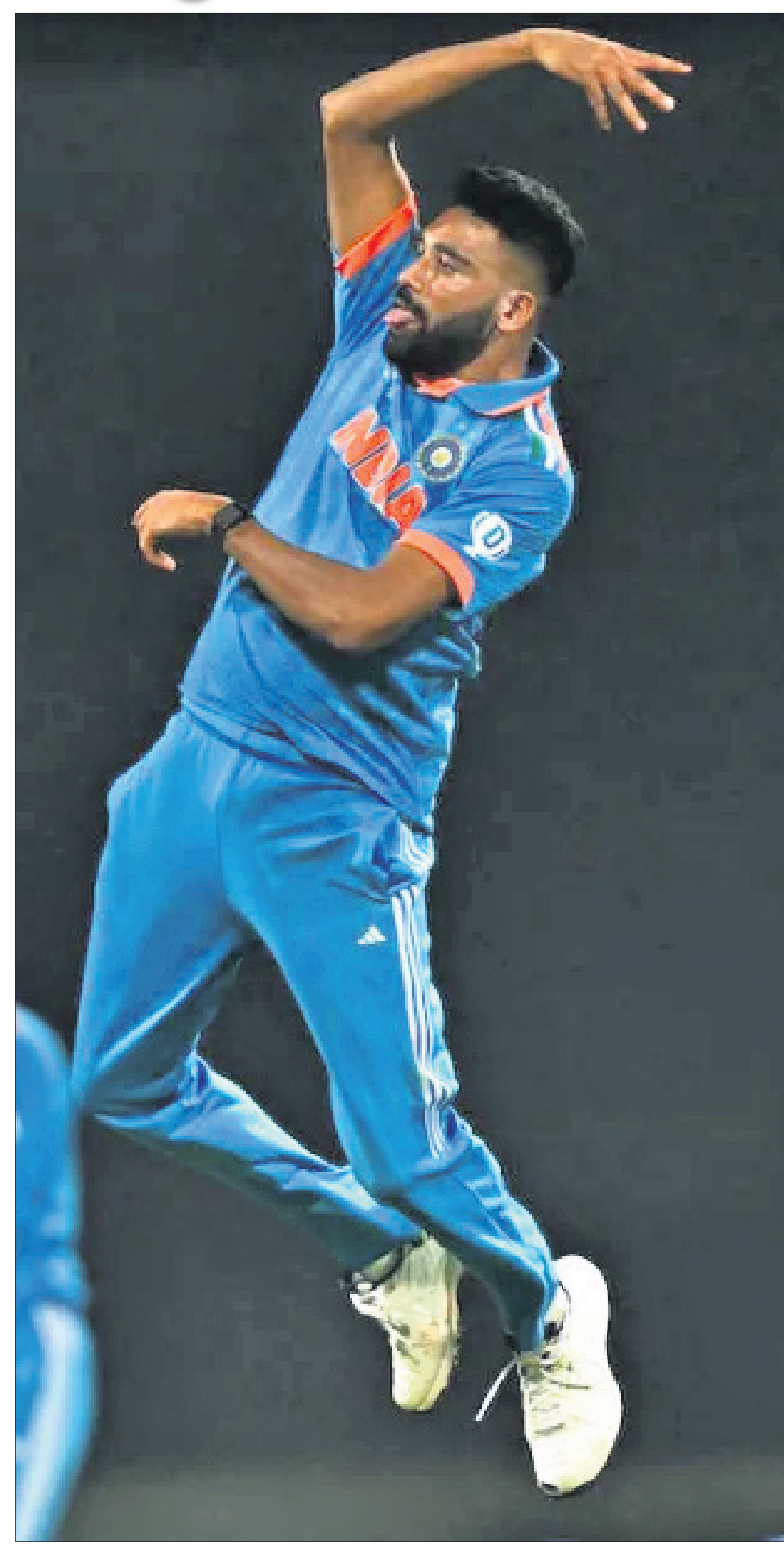
ଗୋଟିଏ ଓଭରରେ ୨ଟି ଉଇକେଟ ନେବା ପରେ ଉଲ୍ଲସିତ ମହମ୍ମଦ ସିରାଜ ।