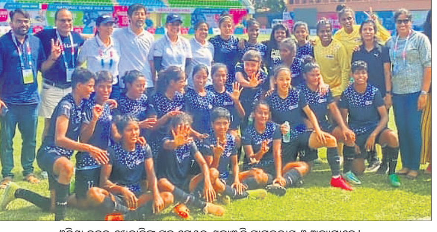
ଓଡ଼ିଶା ଦଳର ଖେଳାଳିଙ୍କ ସହ ମେଣ୍ଟର ଶ୍ରଦ୍ଧାଞ୍ଜଳି ସାମଗ୍ରୀର ଓ ଅନ୍ୟମାନେ ।

ଭୁବନେଶ୍ୱର, ୩୧୧୧ (ତପନ ସାହୁ) ଗୋଆରେ ଚାଲିଥିବା ଜାତୀୟ କ୍ରୀଡ଼ାରେ ଓଡ଼ିଶା ମହିଳା ପୁରସ୍କାର ଦଳର ଚମତ୍କାର ପ୍ରଦର୍ଶନ କରି ରହିଛି । ଶୁକ୍ରବାର ଅନୁଷ୍ଠିତ ଚାନ୍ଦି ଫାଇନାଲରେ ପ୍ରଥମ ସେମିଫାଇନାଲରେ ଓଡ଼ିଶା ପେନାଲ୍ଟି ଶୁରୁ ଆଉଟ ୫-୪ ଗୋଲରେ ବେଙ୍ଗାଳୁ ହରାଇ ପାଇନାଲରେ