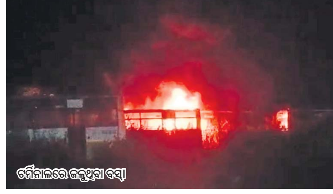
ଚର୍ମିନୀଲରେ ଜଳୁଥିବା ବସ୍

ଭଲ୍ଲେଖ କରିଛନ୍ତି। ତେବେ ଏହି ଘଟଣାକୁ ବିଚାର ମହଲରେ ନିର୍ଦ୍ଦୋଷ ଭାବେ ଗ୍ରହଣ କରାଯାଇଛି। ଚୁରୁ ନାୟକ ବିରୋଧରେ କାର୍ଯ୍ୟାନୁଷ୍ଠାନ ଗ୍ରହଣ ନ କରାଗଲେ ଆନ୍ଦୋଳନ କରାଯିବ ବୋଲି ଖବରଦାତାମାନେ କହିଛନ୍ତି।