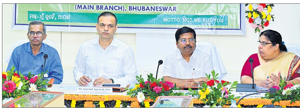
ଭୁବନେଶ୍ୱର, ୩।୧୧ (ଅନୁରାଧା ମହାରଣା)