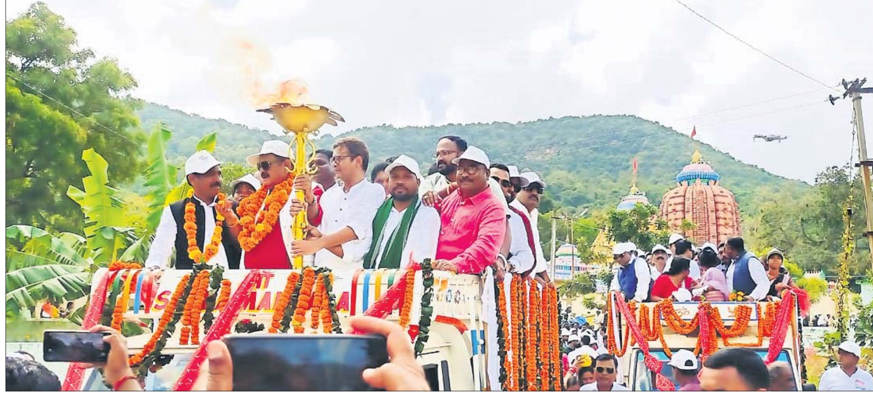
କୋରାପୁଟ ଜିଲ୍ଲା ବୋରିଗୁମ୍ମା ଭୈରବୀ ମନ୍ଦିରରୁ ଶୁକ୍ରବାର ପରବ-୨୦୨୧ ଉଦ୍‌ଘାଟନ ପରେ ଅତିଥିମାନେ ଶୋଭାଯାତ୍ରାରେ ସଭାସ୍ଥଳକୁ ଯାଉଛନ୍ତି।

ଭୁବନେଶ୍ୱର କ୍ୟାମ୍ପିଗାଲ ଆନା ଅନ୍ତର୍ଗତ ପାଖାଠାଣି ଶ୍ରୀରାମ ସ୍ୱାମୀଙ୍କ ଦର୍ଶନ ପାଇଁ ଆସିଥିବା ଯୁବତୀଙ୍କର ରୋଷା ରୋଗର କାର୍ତ୍ତବ୍ୟରେ ୨ ଗୁରୁତର ଘଟଣା ଘଟିଥିଲା ଯାହାକୁ ସେମାନେ ନିର୍ଦ୍ଦୋଷ ଭାବେ ଗ୍ରହଣ କରିଥିଲେ।