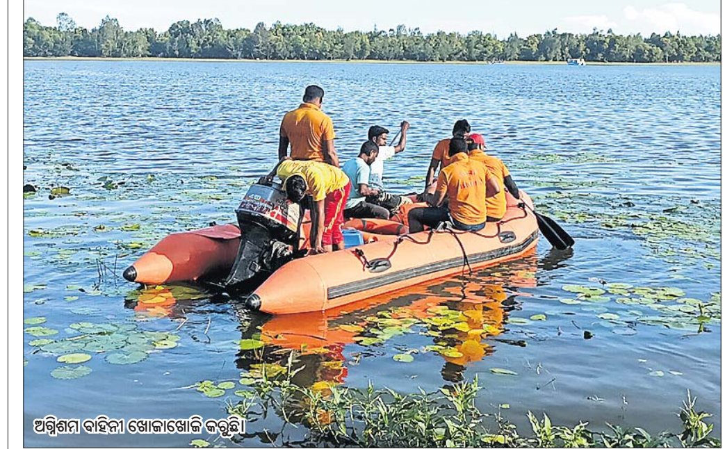
ଅଗ୍ରଣୀୟ ବାହିନୀ ଖୋଜାଖୋଜି କରୁଛି।

ତାମ୍ବିରାରେ ଡଙ୍ଗା... ଉଦ୍ଧାର କରିଥିଲେ। ପୂର୍ଣ୍ଣା ପାଣିରେ ଭୁଜି ଯାଇଥିଲେ। ଅଗ୍ରଣୀୟ ବାହିନୀ କର୍ମଚାରୀ ପହଞ୍ଚିଲାପରେ ମହାକାବାଳ ସହାୟତାରେ ଖୋଜାଖୋଜି କରିବା ପରେ ପୂର୍ଣ୍ଣାଙ୍କ ମୃତଦେହ ମିଳିଥିଲା।