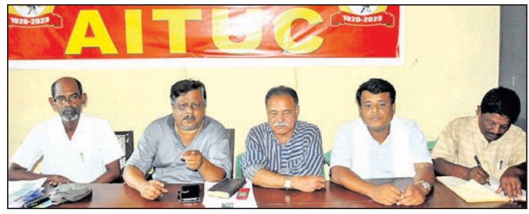
ଏଥିସହ ଅସଂଗଠିତ ଭାବେ ପରିବହନ କର୍ମଚାରୀଙ୍କୁ ମଧ୍ୟ ସମ୍ଭାଷଣ ପ୍ରଦାନ କରାଯାଇଛି।

ଭୁବନେଶ୍ୱର, ୩୧୧ (ବନ୍ଦନା ସେଠା) ରାଜ୍ୟର ବିଭିନ୍ନ ଜିଲ୍ଲା ପଞ୍ଚାୟତ ଗୋଟିଏ କର୍ମଚାରୀ ସଂଘଗଠିତକର ଏକ ବୈଠିକ ଶୁଣାବଣୀରେ ଅନୁଷ୍ଠିତ ହୋଇଥିଲା।