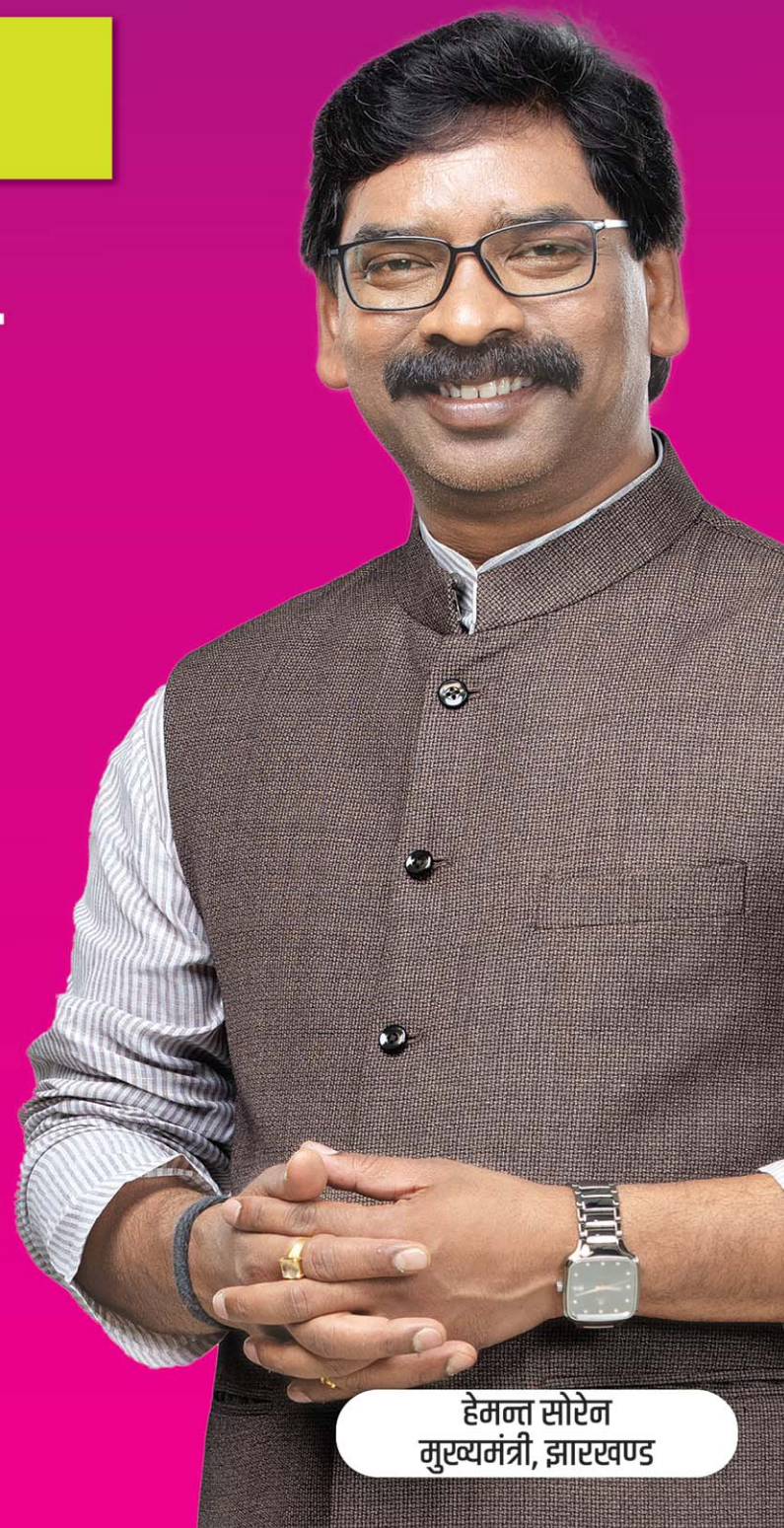
हेमन्त सोरेन मुख्यमंत्री, झारखण्ड