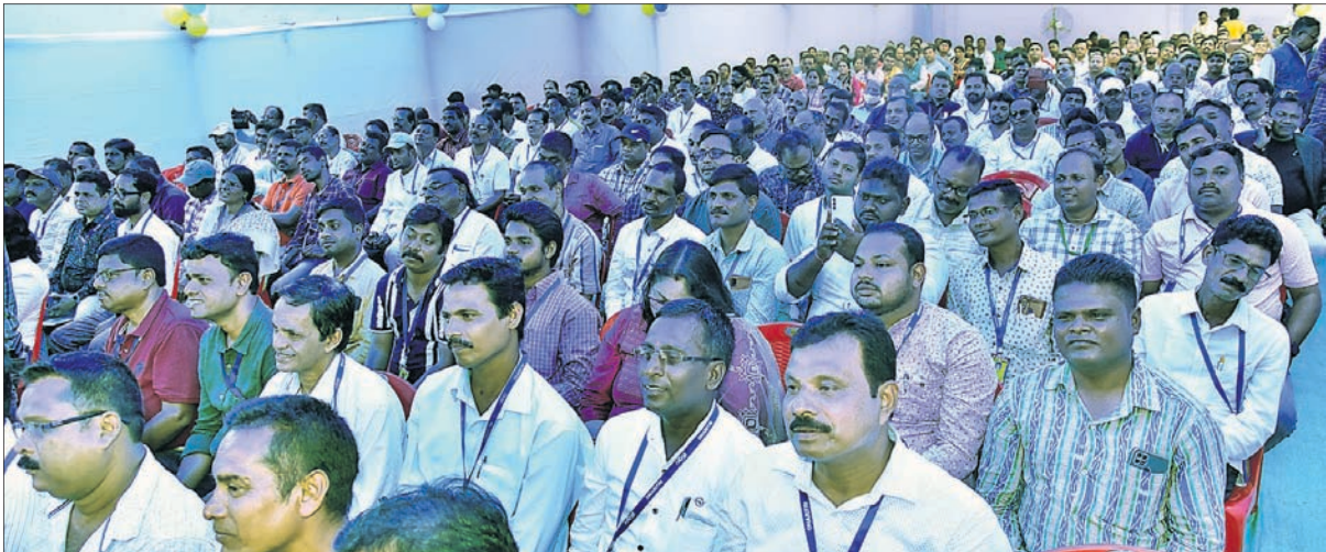
ଉପସ୍ଥିତ ଖବରଦାତା, ଧରିତ୍ରୀ ଏବଂ ଓଡ଼ିଶା ପୋଷ୍ଟ କର୍ମଚାରୀମାନେ ।