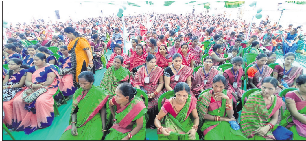
ଧନକଉଡ଼ା ବ୍ଲକରେ ଆୟୋଜିତ କାର୍ଯ୍ୟକ୍ରମରେ ଉପସ୍ଥିତ ମହିଳାପୁଞ୍ଜି ।

ରେଢ଼ାଖୋଳ, ୪।୧୧ (ଅନୁମୋଦନ ପୁରୋହିତ): ମୁଖ୍ୟମନ୍ତ୍ରୀଙ୍କ ଦ୍ୱାରା ଶନିବାର ଶୁଭାରମ୍ଭ ହୋଇଥିବା ଆମ ଓଡ଼ିଶା ନବୀନ ଓଡ଼ିଶା କାର୍ଯ୍ୟକ୍ରମ ବର୍ଷା ଯୋଗୁଁ ରେଢ଼ାଖୋଳ ବ୍ଲକରେ ବାତିଳ ହୋଇଛି । ବତରାହାଳ ପଞ୍ଚାୟତରେ ପଞ୍ଚାୟତ ହାଇସ୍କୁଲରେ କାର୍ଯ୍ୟକ୍ରମ ପାଇଁ ପ୍ରସ୍ତାବନ ପକ୍ଷରୁ ବ୍ୟାପକ ଆୟୋଜନ କରାଯାଇଥିଲା । ହେଲେ କାର୍ଯ୍ୟକ୍ରମ ଆରମ୍ଭ