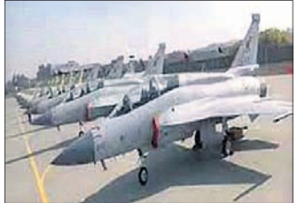
ଇସ୍ଲାମାବାଦ, ୪।୧୧ (ପି.ଟି.)

ପାକିସ୍ତାନର ପଞ୍ଜାବ ପ୍ରଦେଶରେ ଥିବା ପାକ୍ ବାୟୁସେନାର ପ୍ରଶିକ୍ଷଣ କେନ୍ଦ୍ର ଉପରେ ଚଳିତ ସପ୍ତମ ଆତଙ୍କବାଦୀ ଶନିବାର ଭୋର ସମୟରେ ଆକ୍ରମଣ କରିଥିଲେ। ପାକିସ୍ତାନୀ ସୈନ୍ୟଙ୍କ ଜବାବା ଆକ୍ରମଣରେ ସମଗ୍ର ଓ ଆତଙ୍କବାଦୀ ନିହତ ହୋଇଛନ୍ତି। ଏହାର ଗୋଟିଏ ଦିନ ପୂର୍ବରୁ ମିଳି ଆତଙ୍କବାଦୀ ଆକ୍ରମଣରେ ୧୭ ସୈନ୍ୟଙ୍କ ମୃତ୍ୟୁ ଘଟିଥିଲା। ପାକ୍ ସେନା କହିବା ଅନୁଯାୟୀ ଆତଙ୍କବାଦୀମାନେ ନିଆଁଖୁଲି ଟ୍ରେନ୍ ଏୟାରବେସ୍ରେ ଆକ୍ରମଣ କରିଥିଲେ। ଉକ୍ତ ଏୟାରବେସ୍ରେ କୋର୍ଡ଼ ଓ କ୍ଲିୟରାନ୍ସ ଅପରେଶନ ଶେଷ ହୋଇଛି ଓ ସମଗ୍ର ଓ ଆତଙ୍କବାଦୀ ନିହତ ହୋଇଥିବା ସେନା କହିଛି।