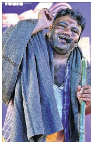
ରଞ୍ଜିତଞ୍ଜନ ଓ ପ୍ରଭାତଙ୍କ ବାବା ପରିବେଷିତ ଏକାଙ୍କିକା।