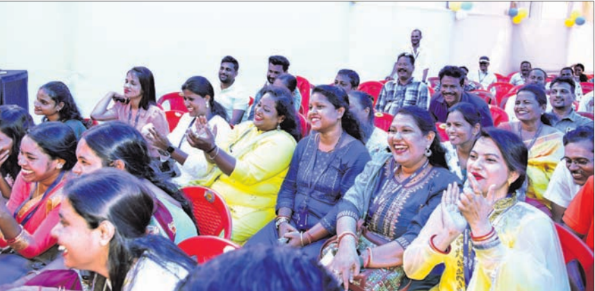
କାର୍ଯ୍ୟକ୍ରମରେ ନୃତ୍ୟ, ଗୀତ ଏବଂ ହାସ୍ୟଅଭିନୟର ଆନନ୍ଦ ଉଠାଇଥିବା ଧରିତ୍ରୀ ପରିବାରର ସଦସ୍ୟମାନେ।