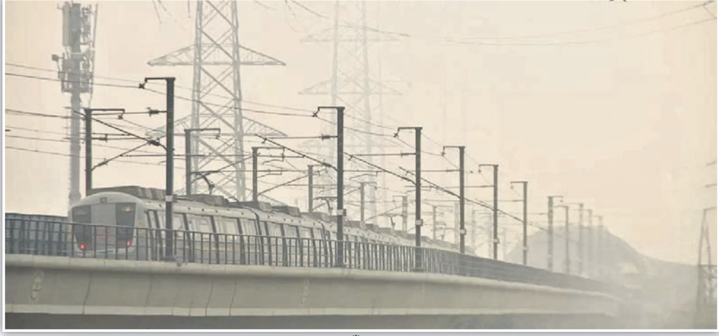
ଦିଲ୍ଲୀରେ ଉଚ୍ଚତ ବାୟୁ ପ୍ରସ୍ତୁତ: ଗୁରୁଗ୍ରାମରେ ଥିବା ଧୂଆଁରେ ଆଲୋକିତ ପରିବେଶରେ ଏକ ମେଟ୍ରୋ ଟ୍ରେନ୍ ଯାଉଛି।

ଜଣଙ୍କୁ ଖୋଜା ଚାଲିଛି। ଖବର ଅନୁଯାୟୀ ଶୁକ୍ରବାର ମହାଦ ଏମ୍ବୁଲେନ୍ସରେ ଅଣା ଥିବା ୪ ଜଣଙ୍କ ମୃତ୍ୟୁ ଘଟିବା ନିଆଁ ଲାଗିଯାଇଥିଲା। ନିଖୋଜ ଥିବା ୧୧ ଜଣଙ୍କ ମଧ୍ୟରୁ ଶନିବାର ସକାଳେ ୪ ମୃତବେଦ ମିଳିଛି।