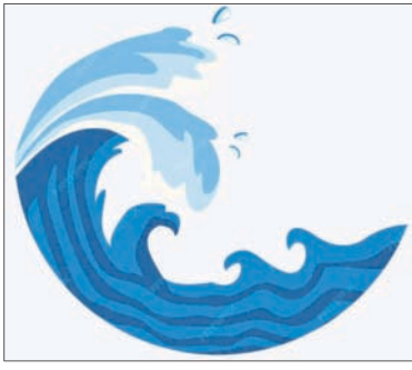
ବିଶ୍ୱ ସୁନାମି ସଚେତନତା ଦିବସ

ପ୍ରାକୃତିକ ବିପର୍ଯ୍ୟୟ ଯୋଗୁ ବହୁ କ୍ଷୟକ୍ଷତି ଘଟିଥାଏ। ତେବେ ସଚେତନତା ଦ୍ୱାରା ଏଥିରୁ ସୁରକ୍ଷିତ ରହି ହୋଇଥାଏ। ଏହାକୁ ଦୃଷ୍ଟିରେ ରଖି ସୁନାମି ନେଇ ସଚେତନତା ସୃଷ୍ଟି ପାଇଁ ପଦକ୍ଷେପ ଗ୍ରହଣ କରାଯିବା ଉପରେ ଗୁରୁତ୍ୱାହୀନ କରାଯାଇଥିଲା। ବିଶ୍ୱ ସୁନାମି ସଚେତନତା ଦିବସ ହେଉଛି ବାର୍ଷିକ କାର୍ଯ୍ୟକ୍ରମ ଯାହାକି ନଭେମ୍ବର ୫ରେ ସୁନାମିର ବିପଦପୂର୍ଣ୍ଣ ପ୍ରଭାବ ଏବଂ ସୁନାମି ପ୍ରଭୃତିର ମହତ୍ତ୍ୱ ଏବଂ ଏହାର ପ୍ରାରମ୍ଭିକ ଚେତାବନୀ ବିଷୟରେ ସଚେତନତା ସୃଷ୍ଟି କରିବା ଲାଗି ପାଳିତ ହୋଇଥାଏ। ମିଳିତ ଜାତିସଂଘର ସାଧାରଣ ସଭାର ସଂକଳ୍ପ ୭୦/୨୩ ଦ୍ୱାରା ଏହା ପ୍ରଥମେ ୨୦୧୫ ରେ ପ୍ରତିଷ୍ଠିତ ହୋଇଥିଲା। ଏହିଦିନ ବିଭିନ୍ନ ଦେଶରେ ବହୁ କାର୍ଯ୍ୟକ୍ରମ ଅନୁଷ୍ଠିତ ହୁଏ ଏବଂ ସୋସିଆଲ ମିଡ଼ିଆରେ ଲୋକଙ୍କୁ ସଚେତନତା ସୃଷ୍ଟି କରିବାକୁ ଉତ୍ସାହିତ କରାଯାଏ। ସୁନାମି ସଚେତନତା ଅନ୍ତର୍ଗତ ଗୁରୁତ୍ୱପୂର୍ଣ୍ଣ। କାରଣ ଗତ ୧୦୦ବର୍ଷ ମଧ୍ୟରେ ସମୁଦାୟ ୫୮ଟି ସୁନାମିରେ ୨,୬୦,୦୦୦ରୁ ଅଧିକ ଲୋକଙ୍କର ମୃତ୍ୟୁ ଘଟିଛି। ୧୯୯୮ ରୁ ୨୦୧୮ ମଧ୍ୟରେ ସୁନାମି ଯୋଗୁ ୨୦୦ ବିଲୟନ