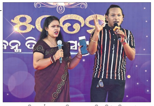
ସାଂସ୍କୃତିକ କାର୍ଯ୍ୟକ୍ରମକୁ ପରିଚାଳନା କରୁଛନ୍ତି ମାସି ଓ ସ୍ମୃତିରଞ୍ଜନ।