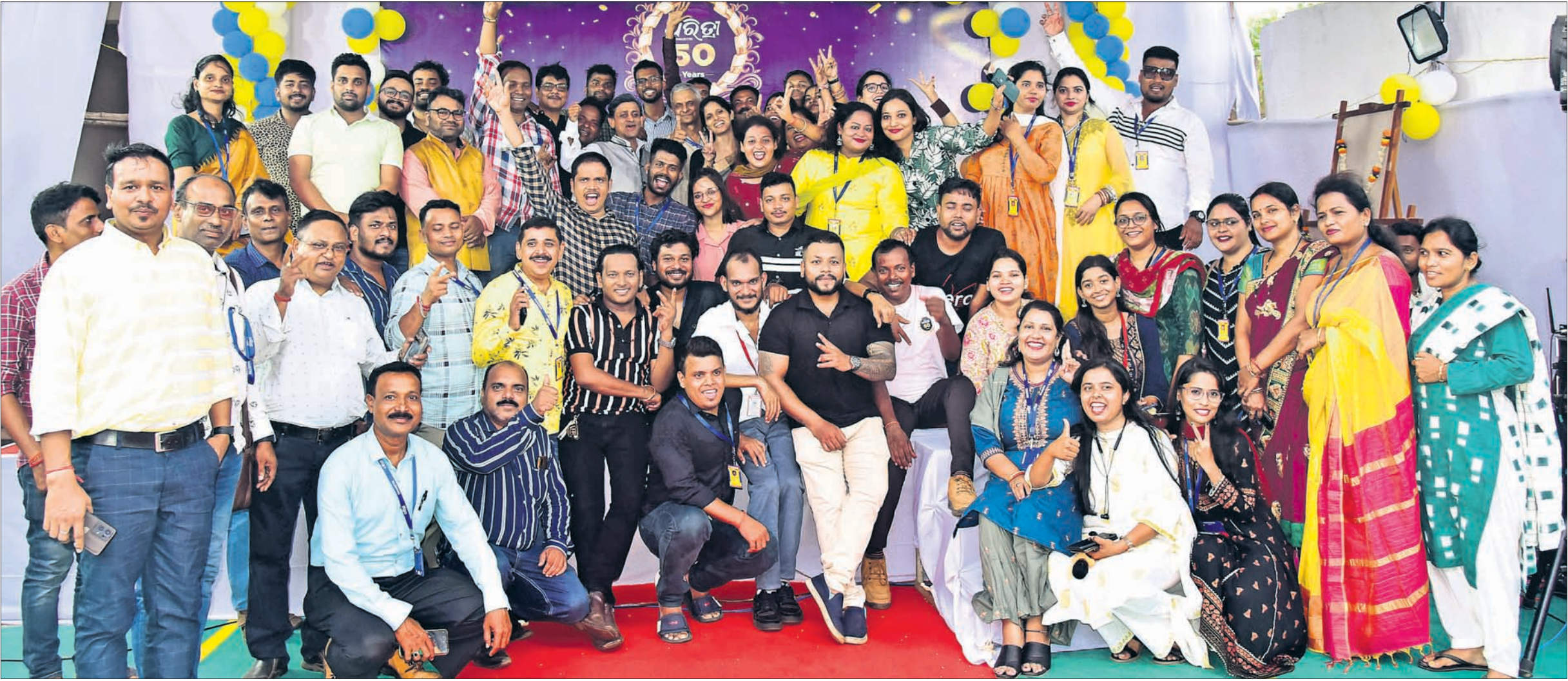
କାର୍ଯ୍ୟକ୍ରମରେ ଉପସ୍ଥିତ ଧରିତ୍ରୀ ପ୍ରବନ୍ଧକାରୀଙ୍କ ସମସ୍ୟାମାନେ ।