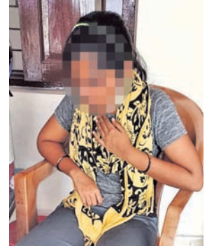
ଗୁରୁତର ହୋଇଥିବା ଛାତ୍ରୀ।

ଅନୁଗୋଳ, ୪।୧୧ (ଅନିତ କୁମାର ସାମଲ) ଅନୁଗୋଳ ସହରରେ ଥିବା ଏକ ଲେଡିଜ୍ ହଷ୍ଟେଲରେ ଶୁକ୍ରବାର ରାତିରେ ଘଟିଥିବା ଚାଷ୍ଟାଳକର ଘଟଣା। ସହପାଠିନୀଙ୍କ ସହ ଶୋଇଥିବା ଜଣେ ମୁକ୍ତ ୨ ଛାତ୍ରୀଙ୍କ ଚଷ୍ମା କେହି ଧାରଣ କରି ସେହିଠାରେ କାଟି ଦେବା ଚର୍ଚ୍ଚାର ବିଷୟ ହୋଇଛି। ଗୁରୁତର ଛାତ୍ରୀଙ୍କୁ ଚୁପ୍ଚାପ ହଷ୍ଟେଲ କର୍ତ୍ତୃପକ୍ଷ ଜିଲ୍ଲା ପୁଖ୍ୟ ଚିକିତ୍ସାଳୟରେ ଭର୍ତ୍ତି କରିଥିଲେ। ସେଠାରେ ଚିକିତ୍ସିତ ହେବା ପରେ ସମ୍ପୂର୍ଣ୍ଣ ଛାତ୍ରୀ ଶନିବାର ଅନୁଗୋଳ ଥାନାର ହାତରୁ ହୋଇଛନ୍ତି। ଘଟଣାକୁ ଗୁରୁତର ସହ ନେଇ ପୋଲିସ ଖୋଜାଚାଡ଼ି ଆରମ୍ଭ କରିଛି।