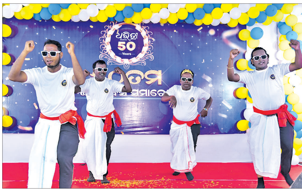
କାର୍ଯ୍ୟକ୍ରମରେ ଧରିତ୍ରୀ ଆଇଟି ଚିମ୍ପର ବିକାଶ, ରାଜୀବ, ସ୍ମୃତିରଞ୍ଜନ ଏବଂ ମନୋରଞ୍ଜନ ବାବା ନୃତ୍ୟ ଓ ଗୀତ ପରିବେଷଣ।