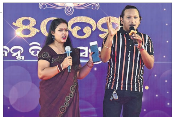
ସାଂସ୍କୃତିକ କାର୍ଯ୍ୟକ୍ରମକୁ ପରିଚାଳନା କରୁଛନ୍ତି ମାସି ଓ ସ୍ମୃତିରଞ୍ଜନ।