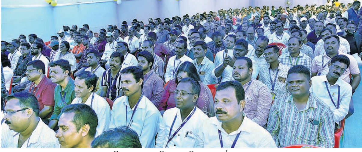
ଉପସ୍ଥିତ ଖବରଦାତା, ଧରିତ୍ରୀ ଏବଂ ଓଡ଼ିଶା ପୋଷ୍ଟ କର୍ମଚାରୀମାନେ ।