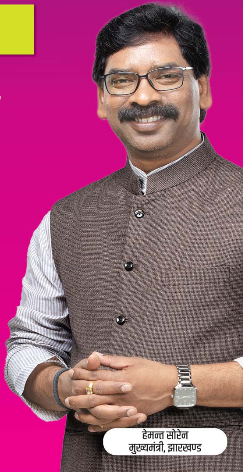
हेमन्त सोरेन मुख्यमंत्री, झारखण्ड

स्टेडियम में प्रवेश (दर्शकों के लिए) - सायं 04:00 बजे से