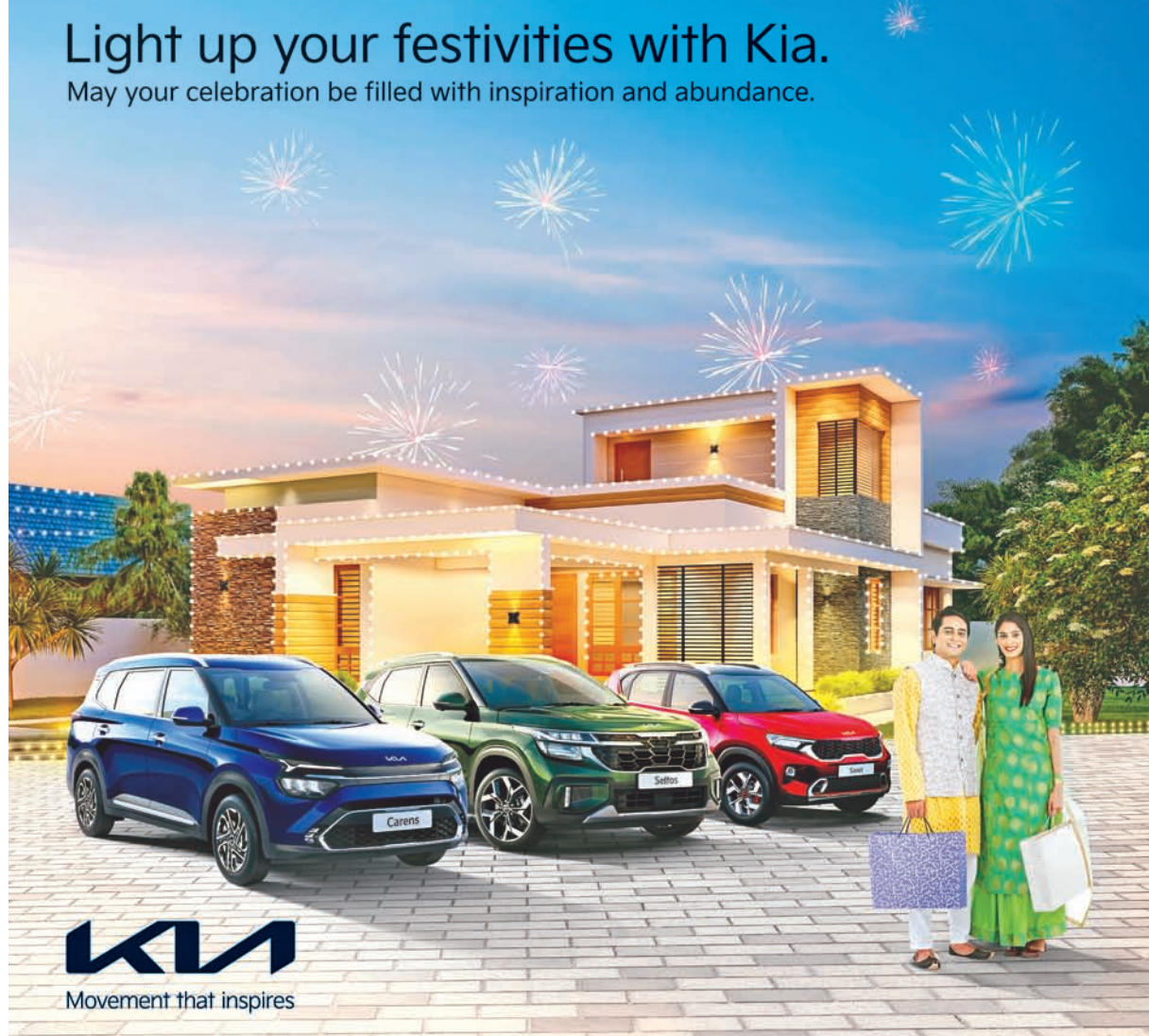
Light up your festivities with Kia. May your celebration be filled with inspiration and abundance.

ଜୋକୋଭିଚ୍ ସେମିଫାଇନାଲରେ ପ୍ୟାରିସ, ୪।୧୧ (ଏସି): ଗତପର ଚାର୍ଜିୟନ ହୋଇଥିବା ରୁଡିଙ୍କୁ ପରାସ୍ତ କରି ନୋଭାକ୍ ଜୋକୋଭିଚ୍ ତାଙ୍କ ପ୍ରତିଷ୍ଠାପକ ବିମର୍ଶ ଲାଗୁ କରିବାକୁ ଏହାକୁ କୋହଲିଙ୍କ ପ୍ରତିଷ୍ଠା କରିଛନ୍ତି।