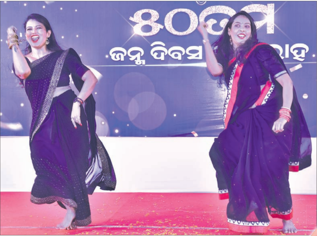
ଶ୍ରେଣୀୟା ଏବଂ ନକ୍ଷତ୍ରକ ନୃତ୍ୟ ପରିବେଷଣ।