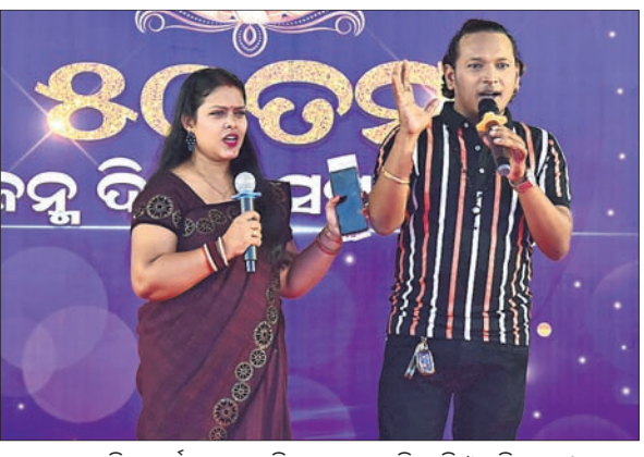
ସାଂସ୍କୃତିକ କାର୍ଯ୍ୟକ୍ରମକୁ ପରିଚାଳନା କରୁଛନ୍ତି ମାସି ଓ ସ୍ମୃତିରଞ୍ଜନ।