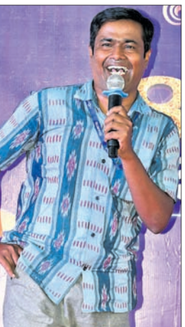
ସ୍ମୃତିରଞ୍ଜନଙ୍କ ଗୀତରେ ମନୋରଞ୍ଜନ ଅଭିନୟ ପରିବେଷଣ।