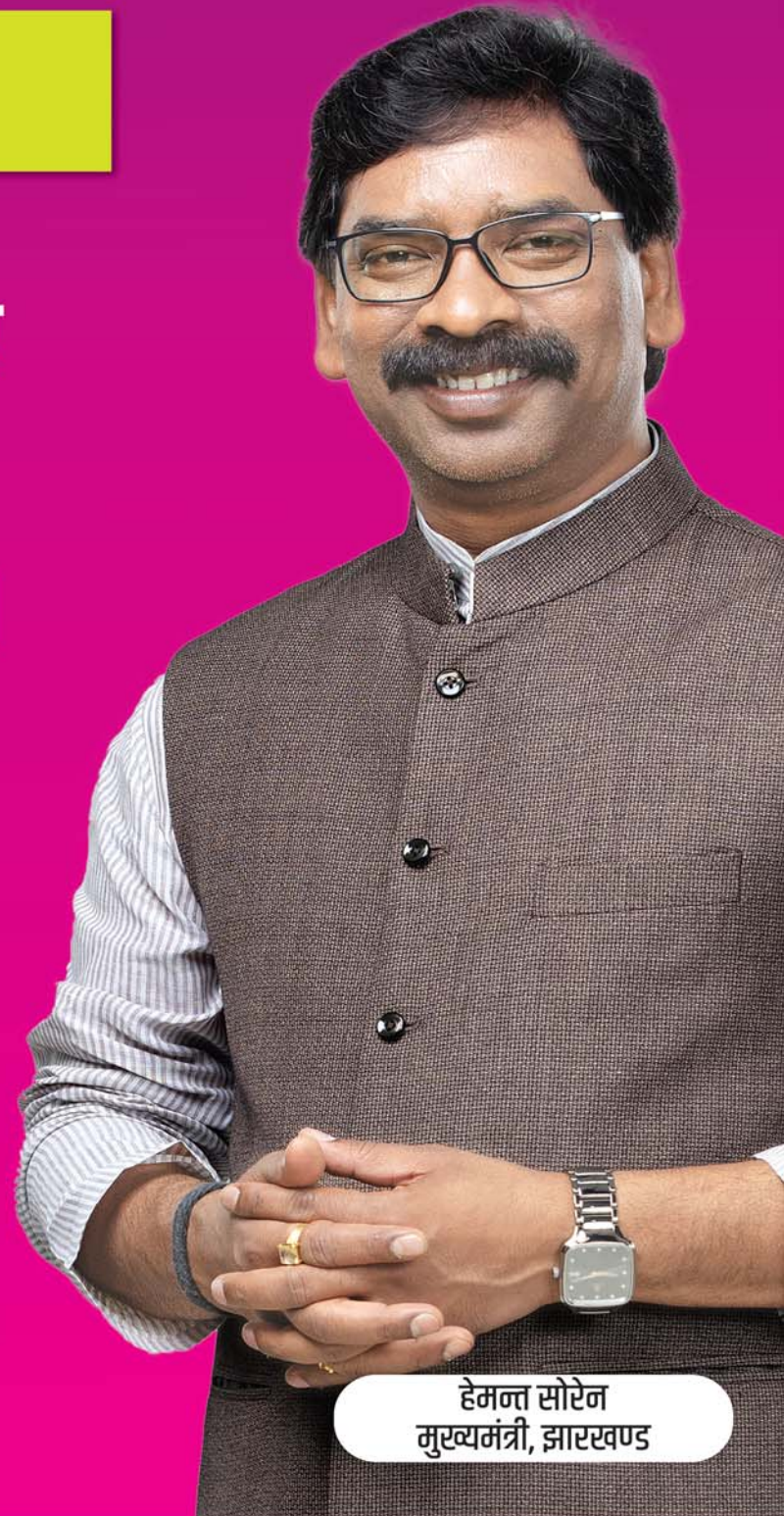
हेमन्त सोरेन मुख्यमंत्री, झारखण्ड