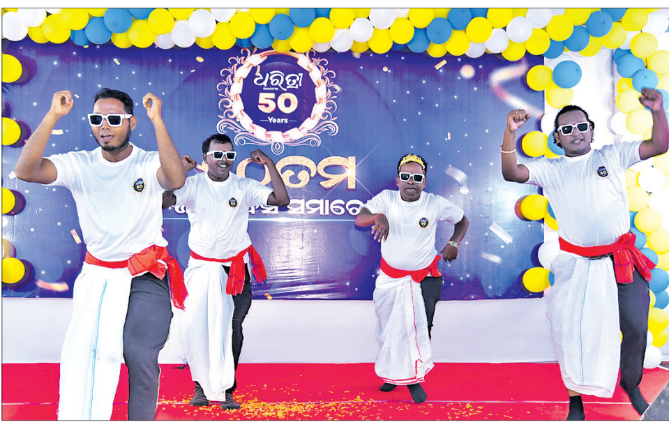
କାର୍ଯ୍ୟକ୍ରମରେ ଧରିତ୍ରୀ ଆଇଟି ଚିମ୍ପର ବିକାଶ, ରାଜୀବ, ସ୍ମୃତିରଞ୍ଜନ ଏବଂ ମନୋରଞ୍ଜନ ବାବା ନୃତ୍ୟ ଓ ଗୀତ ପରିବେଷଣ।