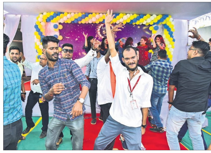
ନାଚଗୀତରେ ମସ୍ତୁରୁ ଧରିତ୍ରୀ ପରିବାର ସଦସ୍ୟ।