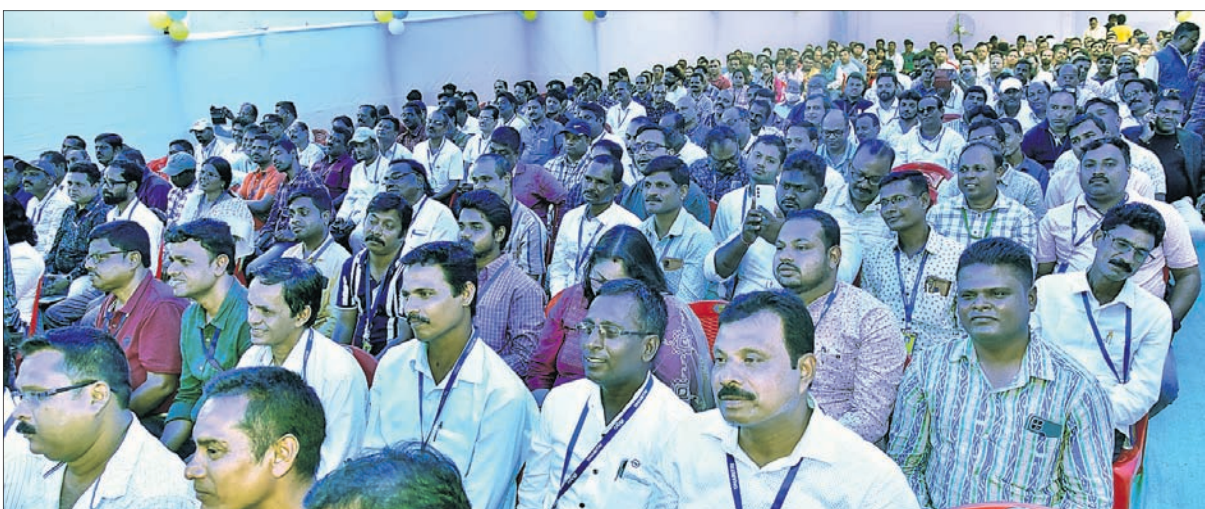
ଉପସ୍ଥିତ ଖବରଦାତା, ଧରିତ୍ରୀ ଏବଂ ଓଡ଼ିଶା ପୋଷ୍ଟ କର୍ମଚାରୀମାନେ ।