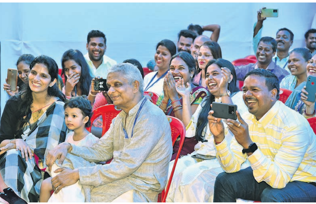
ନୃତ୍ୟର ତାଳେ ତାଳେ ଆନନ୍ଦର ଆସର।