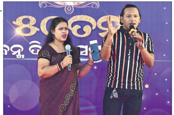
ସାଂସ୍କୃତିକ କାର୍ଯ୍ୟକ୍ରମକୁ ପରିଚାଳନା କରୁଛନ୍ତି ମାସି ଓ ସ୍ମୃତିରଞ୍ଜନ।