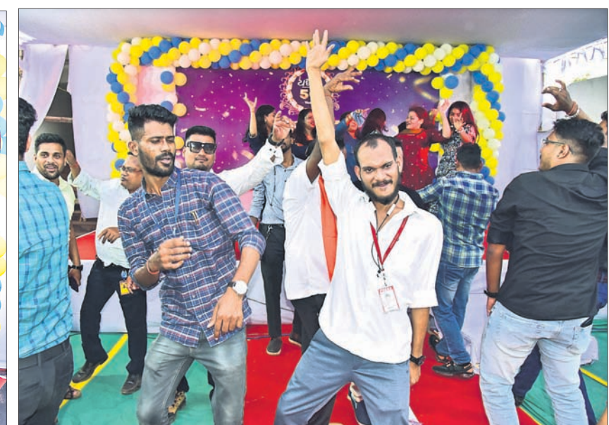
ନାଟଗୀତରେ ମସ୍ତୁରୁ ଧରିତ୍ରୀ ପରିବାର ସଦସ୍ୟ।