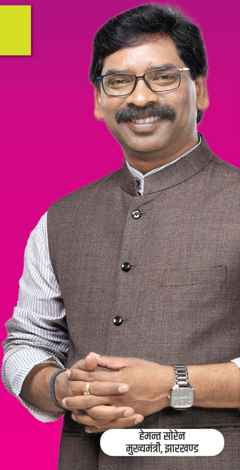
हेमन्त सोरेन मुख्यमंत्री, झारखण्ड

स्टेडियम में प्रवेश (दर्शकों के लिए) - सायं 04:00 बजे से