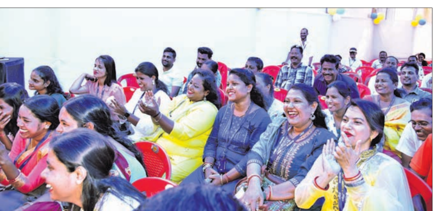
କାର୍ଯ୍ୟକ୍ରମରେ ନୃତ୍ୟ, ଗୀତ ଏବଂ ହାସ୍ୟଅଭିନୟର ଆନନ୍ଦ ଉଠାଇଥିବା ଧରିତ୍ରୀ ପରିବାରର ସଦସ୍ୟମାନେ।