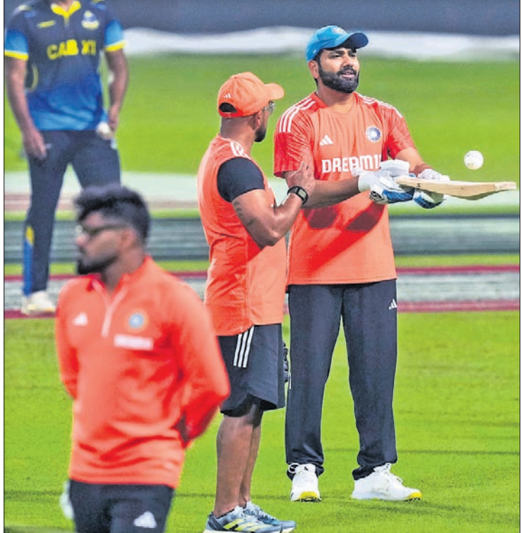
ଭାରତୀୟ ଦଳର ଅଭ୍ୟାସ ସେସନରେ ରୋହିତ ଶର୍ମା।

କୋଲକାତା, ୪।୧୧ (ପି.ଟି.) ଦିନିକିଆ କ୍ରିକେଟ ବିଶ୍ୱକପର ୩୭ ତମ ମ୍ୟାଚରେ ଭାରତ ଓ ଦକ୍ଷିଣ ଆଫ୍ରିକା କୋଲକାତାରେ ଲଡେନ୍ ଗାଡେଟ୍‌ସ୍‌ରେ ମୁହାଁମୁହିଁ ହେବାକୁ ଯାଉଛନ୍ତି। ଏହି ମ୍ୟାଚକୁ ଜିତିବା ସହିତ ଭାରତ ନିଜ ଅପରାଜେୟ ଧାରା ବଜାୟ ରଖିବାକୁ ଚାହଁବ। ଭାରତ ଏହାର ୭ ମ୍ୟାଚରେ ବିଜୟ ସହିତ ସେମିଫାଇନାଲରେ ପ୍ରବେଶ କରିସାରିଥିବା ବେଳେ ଦକ୍ଷିଣ ଆଫ୍ରିକା ସମାନ ସଂଖ୍ୟକ ମ୍ୟାଚ ଖେଳି ଶୁନିରେ ବିଜୟା ହୋଇଛି। ଦକର ଏକମାତ୍ର ପରାଜୟ ନେଦରଲାଣ୍ଡ ନିକଟରୁ ଆସିଛି। ୨୦୧୧ ବିଶ୍ୱକପ୍ ସଂସ୍କରଣରେ ଚାମ୍ପିୟନ