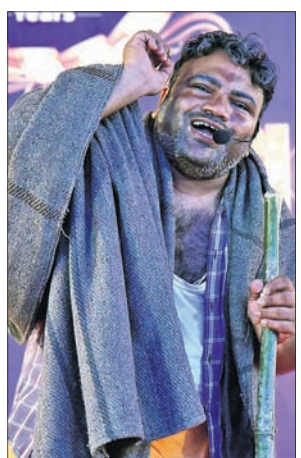
ରଞ୍ଜିତଞ୍ଜନ ଓ ପ୍ରଭାତଙ୍କ ବାବା ପରିବେଷିତ ଏକାଙ୍କିକା।