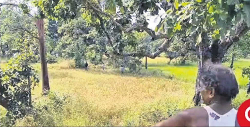
ଏହି ଜଙ୍ଗଲରେ ମହିଳାଙ୍କୁ ବାଘ ଖାଇଦେଇଛି।

■ ଶିଶୁକୁ ଝାମ୍ପିନେବାବେଳେ ଉଦ୍ଧାର କଲେ ଗାଁ ଲୋକେ ■ ଗୁରୁତର ଅବସ୍ଥାରେ ନୂଆପଡ଼ା ହସ୍ପିଟାଲରେ ଭର୍ତ୍ତି ■ ୬ ଦିନ ପୂର୍ବେ ୭ ବର୍ଷର ବାଳକଙ୍କୁ ମାରିଥିଲା ନୂଆପଡ଼ା, ୪।୧୧ (ମକାଭୁ ବେମାଲ)