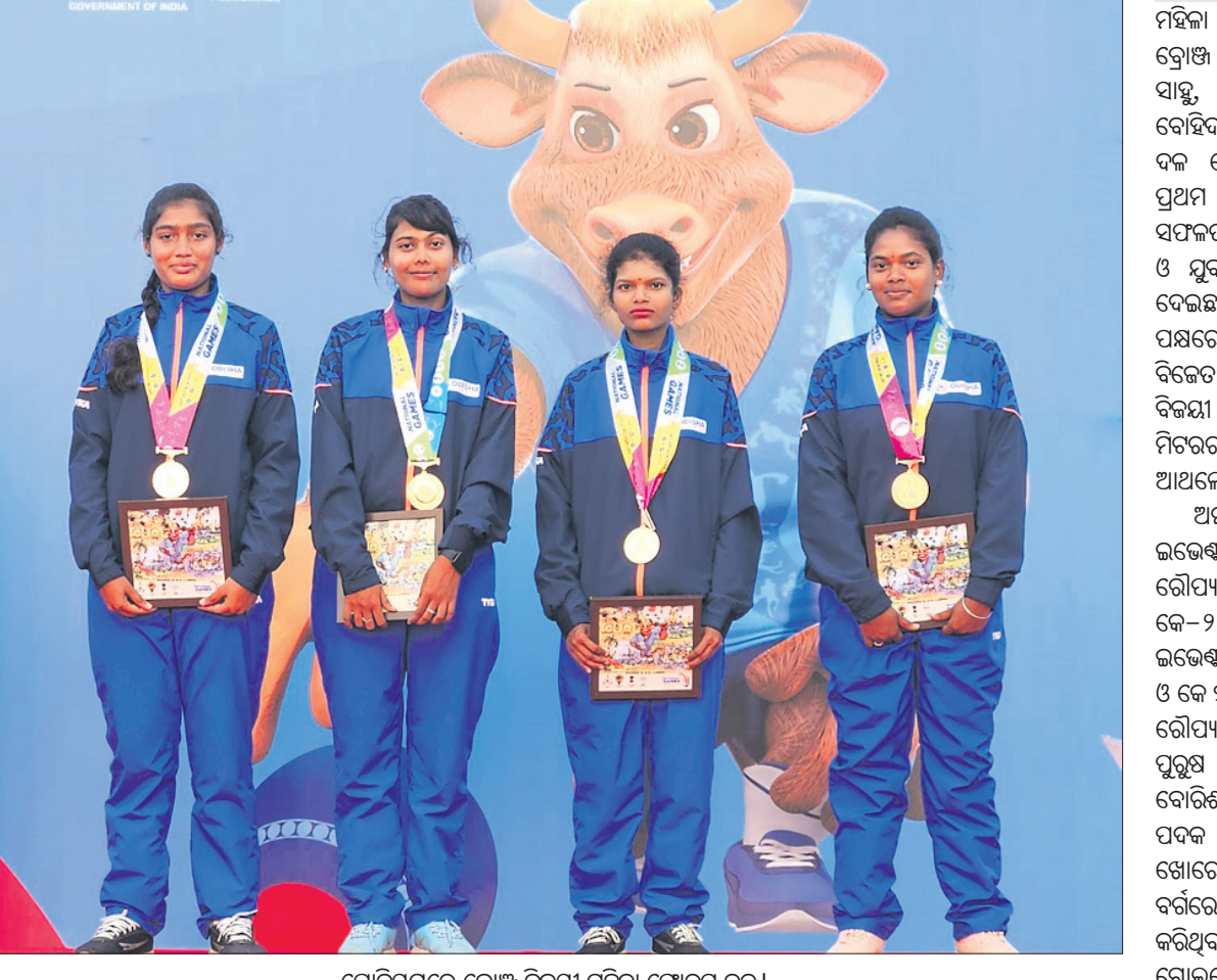
ପୋଡ଼ିୟମରେ ଦ୍ରୋଞ୍ଜି ବିଜୟୀ ମହିଳା ଫୋର୍‌ସ୍ ଦଳ।

ଓଡ଼ିଶା ମହିଳା ଲନ୍‌ ବୋଲ୍‌ ଦଳ ଓ ଜାଭେଲିନ୍‌ ପ୍ରୋୟର କିଶୋର କେନା ଦ୍ରୋଞ୍ଜି ପଦକ ହାସଲ କରିଛନ୍ତି। ପ୍ରଥମ ଥର ଓଡ଼ିଶା ଏହି ଇଭେଣ୍ଟରେ ଅଂଶଗ୍ରହଣ କରିଥିବା ବେଳେ