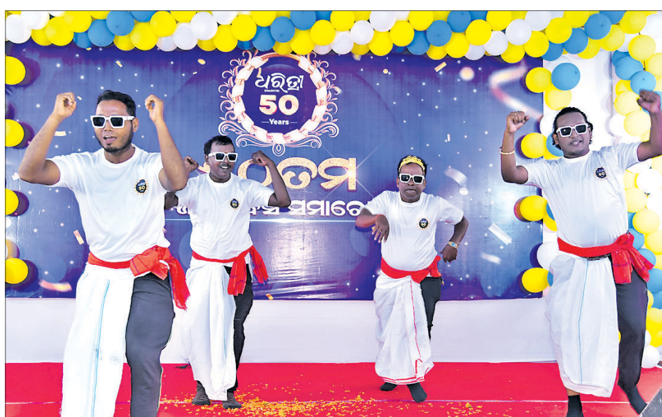
କାର୍ଯ୍ୟକ୍ରମରେ ଧରିତ୍ରୀ ଆଇଟି ଚିମ୍ପର ବିକାଶ, ରାଜୀବ, ସ୍ମୃତିରଞ୍ଜନ ଏବଂ ମନୋରଞ୍ଜନ ବାବା ନୃତ୍ୟ ଓ ଗୀତ ପରିବେଷଣ।