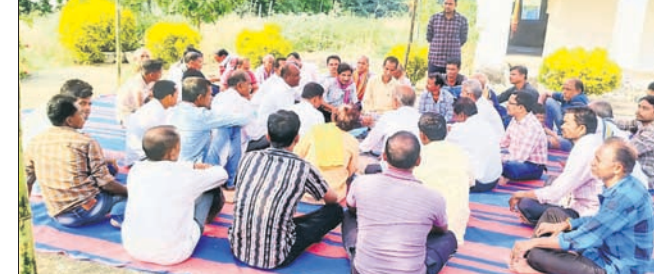
ବୈଠକରେ ଉପସ୍ଥିତ ସମାଜର ସଦସ୍ୟବୃନ୍ଦ ।