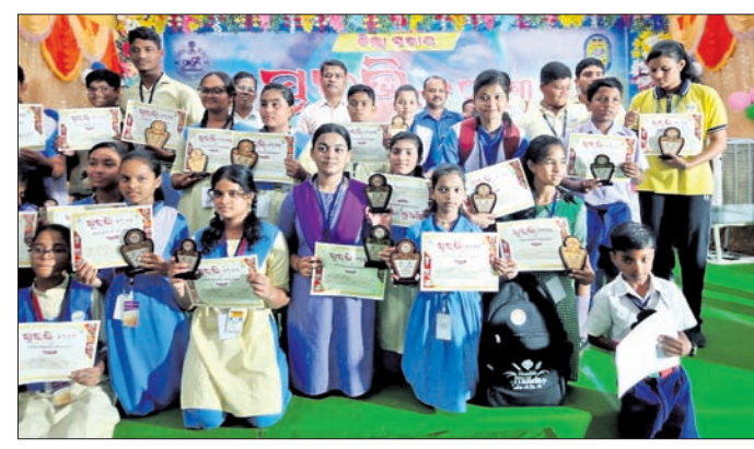
ଅତିଥିଙ୍କ ସମ୍ମାନରେ କୃତି ପ୍ରତିଯୋଗିତା।

ଜିଲ୍ଲା ଶିକ୍ଷା ବିଭାଗ ପକ୍ଷରୁ ରବିବାର ବୌଦ୍ଧ ସହରର ଚାନ୍ଦନହଳଠାରେ ଜିଲ୍ଲାସ୍ତରୀୟ ଶିଶୁ ପ୍ରତିଭା କାର୍ଯ୍ୟକ୍ରମ ସୁରଭି ଓ ଓଡ଼ିଶା ମିଲେଟ୍ସ ପ୍ରତିଯୋଗିତା ଅନୁଷ୍ଠିତ ହୋଇଯାଇଛି।