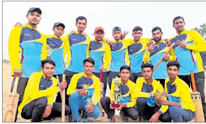
ସେମି ଫାଇନାଲରେ ପ୍ରବେଶ କରିଥିବା ପଞ୍ଚିଆପାଲି ଦଳ।

ଭୁବନେଶ୍ୱର ଜିଲ୍ଲା ବୀରବ୍ରହ୍ମାପୁର କୁଳ ଅନ୍ତର୍ଗତ ପଞ୍ଚିଆପାଲି ଗ୍ରାମରେ ବୀର ଶଙ୍କର ଶଙ୍କର, ଅଧ୍ୟାପକାଳର ଘୁମୁରା, ବିଭାଷଣ ସାହୁ ସ୍ମାରକା କ୍ରିକେଟ ଟୁର୍ଣ୍ଣାମେଣ୍ଟ ଉଦ୍‌ଘାଟିତ ହୋଇଯାଇଛି।