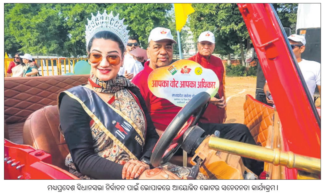
ମଧ୍ୟପ୍ରଦେଶ ବିଧାନସଭା ନିର୍ବାଚନ ପାଇଁ ଭୋପାଳରେ ଆୟୋଜିତ ଭୋଟର ସଚେତନତା କାର୍ଯ୍ୟକ୍ରମ।