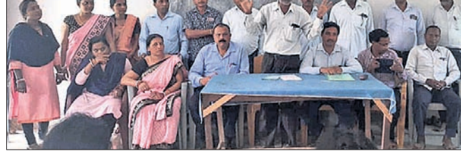
ବୈଠକରେ ଉପସ୍ଥିତ ସଂଘର କର୍ମକର୍ତ୍ତା ।