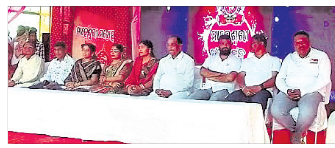
ବୀରବ୍ରହ୍ମାପୁରରେ ତୃତୀୟ ମାହେଶ୍ୱରୀ ମହୋତ୍ସବ

ଭୁବନେଶ୍ୱର ଜିଲ୍ଲା ବୀରବ୍ରହ୍ମାପୁର ଚନ୍ଦ୍ର ଚରଣ ଚନ୍ଦ୍ର ପରୀକ୍ଷା ପ୍ରାଥମିକ ବିଦ୍ୟାଳୟ ପରିସରରେ ରବିବାର ମାଗଣା ଚନ୍ଦ୍ର ପରୀକ୍ଷା ଶିବିର ଅନୁଷ୍ଠିତ ହୋଇଯାଇଛି।