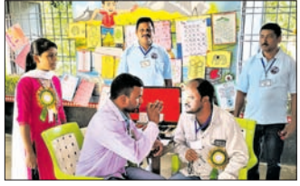
ଭୁବନେଶ୍ୱର, ୫୧୧ (ବୀରବ୍ରହ୍ମା ପୁରୀ)

ଭୁବନେଶ୍ୱର ଜିଲ୍ଲା ବୀରବ୍ରହ୍ମାପୁର ଚନ୍ଦ୍ର ଚରଣ ଚନ୍ଦ୍ର ପରୀକ୍ଷା ପ୍ରାଥମିକ ବିଦ୍ୟାଳୟ ପରିସରରେ ରବିବାର ମାଗଣା ଚନ୍ଦ୍ର ପରୀକ୍ଷା ଶିବିର ଅନୁଷ୍ଠିତ ହୋଇଯାଇଛି।