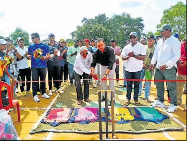
ଅତିଥିବୃନ୍ଦ ଚୁର୍ନାମେଞ୍ଚୁ ଉଦ୍‌ଯାପନ କରୁଛନ୍ତି।