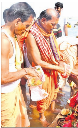
ହରଗୌରୀଙ୍କୁ ମହାନଦୀରେ ବିସର୍ଜନ ପାଇଁ ନିଆଯାଇଛି।

ଭୁବନେଶ୍ୱର ସହରର ଡେରାପଡାଠାରେ ୯ ଦିନ ଧରି ଚାଲିଥିବା ହରଗୌରୀ ଯାତ୍ରା ଉପଯାପିତ ହୋଇଯାଇଛି।