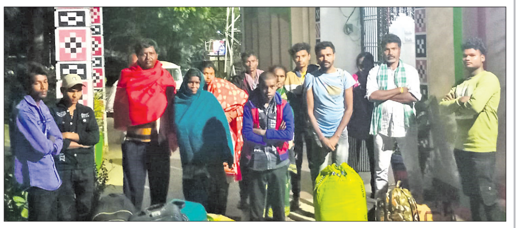
କଞ୍ଚାବାଞ୍ଜି ଥାନାରେ ଉଦ୍ଧାର ଶ୍ରମିକମାନେ।