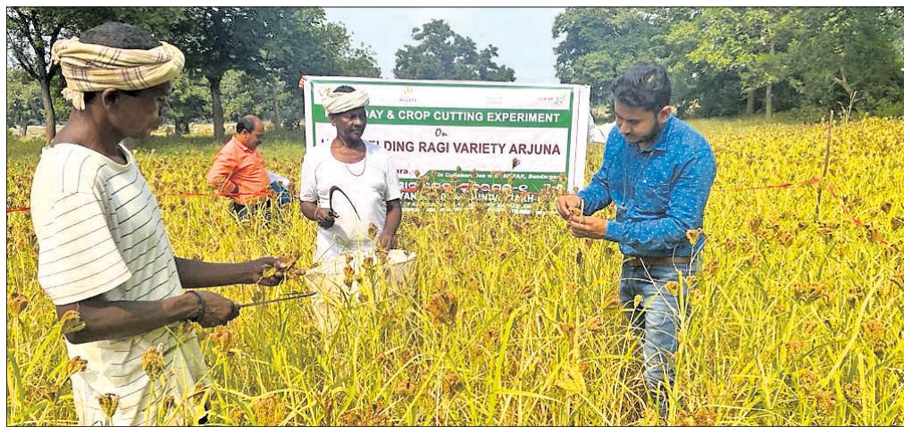
ଚାଷୀମାନେ ମିଲେଟ୍ କ୍ଷେତ୍ର ବୁଲି ଦେଖୁଛନ୍ତି ।