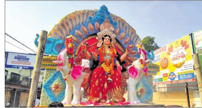
ଗଜଲକ୍ଷ୍ମୀଙ୍କୁ ଭାଷା ଶୋଭାଯାତ୍ରାରେ ନିଆଯାଇଛି।