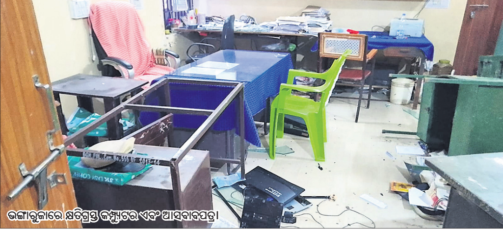
ଭଙ୍ଗାଭୁଜାରେ କ୍ଷତିଗ୍ରସ୍ତ କମ୍ପ୍ୟୁଟର ଏବଂ ଆସବାବପତ୍ର।

ବରଗଡ଼ ଜିଲ୍ଲା ଅଧିକାରୀ ଆନାରେ ରବିବାର ଚୁକ୍ତିକାଣ୍ଡ ଘଟିଛି। ଶତାଧିକ ଲୋକ ଅତୀତ ଭାବେ ଆନା ଭିତରକୁ ପଶି ବ୍ୟାପକ ଭଙ୍ଗାଭୁଜା କରିଛନ୍ତି। ଫଳରେ ଆନାରେ ରହିଥିବା କମ୍ପ୍ୟୁଟର, ଟେବିଲ, ଟେବୁଲ ଆଦି ନଷ୍ଟ ହୋଇଥିବା ସୂଚନା ମିଳିଛି। ଅନ୍ୟପକ୍ଷେ ଆନା ଭିତରେ ଭଙ୍ଗାଭୁଜା ଚାଲିଥିବାବେଳେ ସେଠାରେ ଉପସ୍ଥିତ ପୋଲିସ ନିରାକାର କରି ନ ପାରି ନିରୁପାୟ ରହିଥିବା ସାଧାରଣରେ ଆଲୋଚନା ହେଉଛି। ତେବେ ଏହି ଘଟଣାର କାରଣ ସ୍ପଷ୍ଟ ହୋଇ ନ