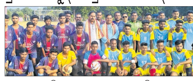
ପ୍ରତିଯୋଗୀଗଣଙ୍କୁ ଭାଗ ନେଇଥିବା ଖେଳାଳି।

ଦେବଗଡ଼, ୩୧୧ (ଶଶାଙ୍କ ଶେଖର ଝାଙ୍କର) ତିଳକାଳୀଙ୍କୁ ନିମନ୍ତ୍ରଣ କରି ଦେବଗଡ଼ ପଞ୍ଚାୟତ ସଦର ମହକୁମାରେ ଜୟ ମା' ଦୁର୍ଗାଙ୍କୁ ଆନୁକୂଲ୍ୟରେ ମୋଟ ୧୬ଟି ଦଳକୁ ନେଇ ରବିବାର ତ୍ରି ଦିବସୀୟ ପୁରୁଷ ପ୍ରତିଯୋଗିତା ଉଦ୍ଘାଟିତ ହୋଇଯାଇଛି। କୁଳ ଉପାପତି ବିରଞ୍ଚି ଟ୍ରଫିସହ ନଗର ଅର୍ଥ ପୁରସ୍କାର ପ୍ରଦାନ କରାଯାଇଛି। ପ୍ରତିଯୋଗିତା ଆୟୋଜନରେ ନିର୍ଦ୍ଦେଶ ଦେଇ ଗ୍ରାମାପାଳ ସାହୁ ସହଯୋଗ କରିଥିଲେ। ଶେଷରେ ସମ୍ପାଦକ ସମାପନ ପ୍ରଦାନ ଧନ୍ୟବାଦ ଅର୍ପଣ କରିଥିଲେ।