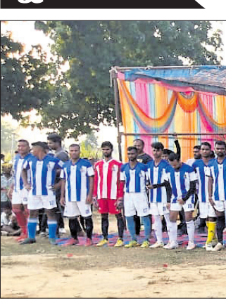
ଉଦ୍‌ଯାପନୀ ମ୍ୟାଚରେ ଅତିଥିଙ୍କ ସହ ଉଭୟ ଦଳର ଖେଳାଳିମାନେ।