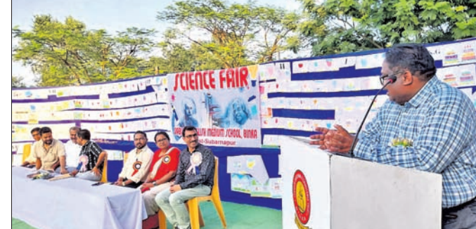
ମେଳାରେ ଯୋଗ ଦେଇଥିବା ଅତିଥି।