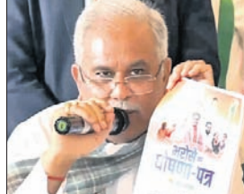
ନିର୍ବାଚନୀ ଲଢ଼ାହାର ଉଦ୍ଘୋଷଣା କରୁଥିବା ମୁଖ୍ୟମନ୍ତ୍ରୀ କୁଚେପଣ ବସେଇ।