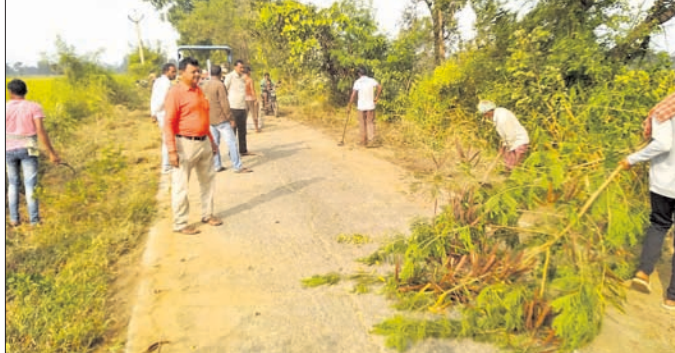
କୁଜାପାଲି ଗ୍ରାମବାସୀ ଗାଁ ରାସ୍ତା ସଫେଇ କରୁଛନ୍ତି ।

ବରଗଡ଼, ୫।୧୧ (ପୂର୍ଣ୍ଣଚନ୍ଦ୍ର ମହାପାତ୍ର): ବରଗଡ଼ ଜିଲା ଅତୀତରା କୁଜାପାଲି ଗ୍ରାମବାସୀ ନିଜ ଗାଁ ରାସ୍ତାକୁ ରବିବାର ସଫେଇ କରିଛନ୍ତି । ଗୋଡ଼ଢ଼ଗା - ସୋନପୁର ୫୪ ନମ୍ବର ରାଜ୍ୟ ରାଜପଥର କୁଜାପାଲି ଛକରୁ ଗାଁକୁ ଯାଇଥିବା ରାସ୍ତାର ଉଭୟ ପାର୍ଶ୍ୱ ଉତ୍ତରୀୟରେ ପରିଷ୍କାର ହୋଇପଡ଼ିଥିଲା । ଆସନ୍ତା ୧୨ ତାରିଖ ଗ୍ରାମରେ ଶ୍ୟାମକାଳୀ ପୂଜା ଅନୁଷ୍ଠିତ ହେବ । ଏହି ରାସ୍ତା ଦେଇ ବହୁ ଲୋକ ଯିବାଆସିବା କରିବେ । ଏହାକୁ ଦୃଷ୍ଟିରେ ନାଏକ ଧର୍ମବାଦ ଅର୍ପଣ କରିଥିଲେ ।