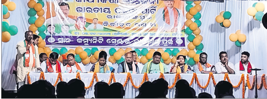
କାର୍ଯ୍ୟକର୍ତ୍ତା ସମ୍ମିଳନୀରେ ମଞ୍ଚାସୀନ ଭାଗ ନେବୁଥିଲେ ।