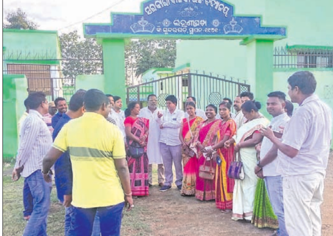
ବିଜେଡି କର୍ମକର୍ତ୍ତା ଏବଂ କର୍ମୀମାନେ ରୁକ୍ମି ପ୍ରୋଗ୍ରାମ ସହ ଆଲୋଚନା କରୁଛନ୍ତି ।

କାର୍ଯ୍ୟକର୍ତ୍ତା ଏବଂ କର୍ମୀମାନେ ରୁକ୍ମି ପ୍ରୋଗ୍ରାମ ସହ ଆଲୋଚନା କରୁଛନ୍ତି ।