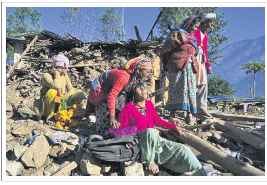
ନେପାଳ ଯାଜକରକୋଟ୍ ଜିଲ୍ଲାରେ ଭୂକମ୍ପରେ ପୁଅ, ବୋହୂ ଓ ନାତିକୁ ହରାଇଥିବା ଜଣେ ମହିଳା ଜଣା ଘର ନିକଟରେ କାନ୍ଦୁଛନ୍ତି।

ଜେରୁଜେଲମ୍, ୫୧୧: ଗାଜା ଉପରେ ଅଣୁଅଣୁ ଆକ୍ରମଣ କରାଯିବା ଦରକାର ବୋଲି ଇସ୍ରାଏଲ୍ କର୍ମଚାରୀ ମନ୍ତ୍ରୀ କହି ବିବାଦ ଘେରକୁ ଆସିଛନ୍ତି।