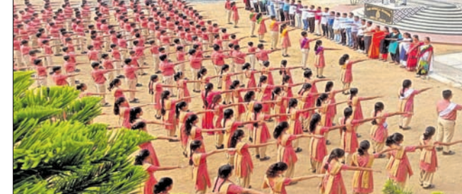
ଏକତା ଦିବସରେ କୋଶଳ ସ୍କୁଲ ଛାତ୍ରାଛାତ୍ର ସଂକଳ୍ପ ନେଉଛନ୍ତି ।