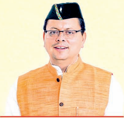
Pushkar Singh Dhami Chief Minister, Uttarakhand