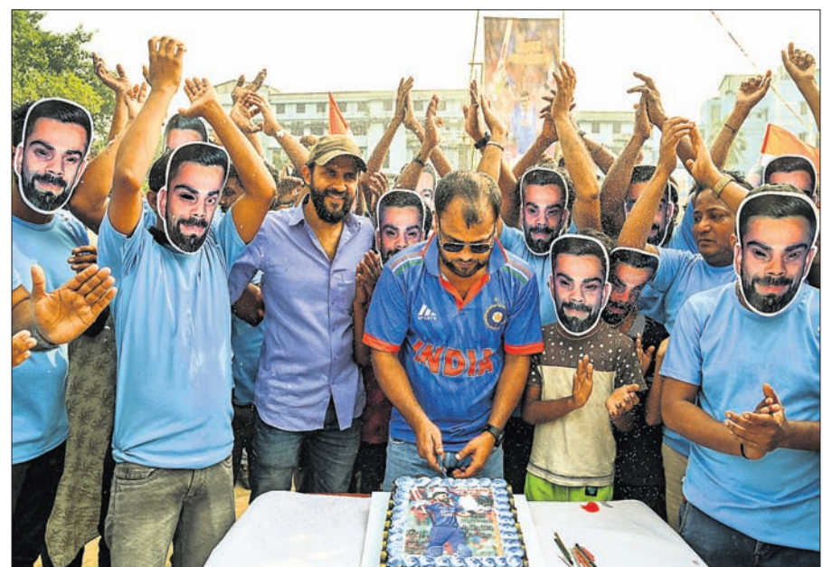
କୋହଲିଙ୍କ ଜନ୍ମଦିନରେ ରବିବାର କୋଲକାତାରେ ପ୍ରଶଂସକମାନେ କେକ୍ କାଟୁଛନ୍ତି।

କୋଲକାତା, ୫୧୧ (ପି.ଟି.) ୩୫ତମ ଜନ୍ମଦିନରେ ବିରାଟ କୋହଲି ନିଜ କ୍ୟାରିୟରର ୪୯ତମ ଦିନିକିଆ ଶତକ ହାସଲ କରି କିମ୍ବଦନ୍ତୀ ସଚିନ ଡେବ୍ଲାଇକରଙ୍କ ରେକର୍ଡର ସମକକ୍ଷ ହୋଇଥିଲେ।