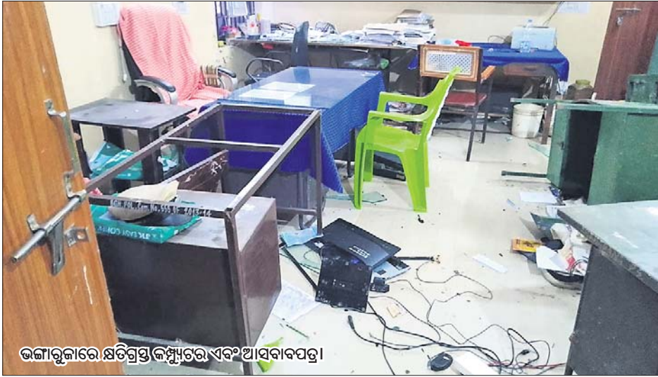
ଭଙ୍ଗାଠୁଜାରେ ଶିଶୁଗ୍ରହଣ କରାଯାଇଥିବା ବର୍ତ୍ତମାନ ସ୍ଥାନ।

ବରଗଡ଼ ଜିଲ୍ଲା ଅଧିକାରୀ ଆନାରେ ରବିବାର ଭଙ୍ଗାଠୁଜା ଘଟଣା ଘଟିଛି। ଶତାଧିକ ଲୋକ ଅତକିତ ଭାବେ ଆନା ଭିତରକୁ ପଶି ବ୍ୟାପକ ଭଙ୍ଗାଠୁଜା କରିଛନ୍ତି। ଫଳରେ ଆନାରେ ରହିଥିବା କମ୍ପ୍ୟୁଟର, ଟେବିଲ, ଟେବୁଲ ଆଦି ନଷ୍ଟ ହୋଇଥିବା ସୂଚନା ମିଳିଛି। ଅନ୍ୟପକ୍ଷେ ଆନା ଭିତରେ ଭଙ୍ଗାଠୁଜା ଚାଲିଥିବାବେଳେ ସେଠାରେ ଉପସ୍ଥିତ ପୋଲିସ ନିରୁପାୟ କରି ନ ପାରି ନିରୁପାୟ ରହିଥିବା ଯାଆରଣରେ ଆଲୋଚନା ହେଉଛି। ତେବେ ଏହି ଘଟଣାର କାରଣ ଖଣ୍ଡ