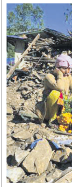
ନେପାଳ ଯାଜନକୋଟ୍ ଜିଲ୍ଲାରେ ଭୂକମ୍ପରେ ପୁଅ, ବୋହୂ ଓ ନାତିକୁ ହରାଇଥିବା ଜଣେ ମହିଳା ଜଣା ଘର ନିକଟରେ କାନ୍ଦୁଛନ୍ତି।

ଜେରୁଜେଲମ୍, ୫୧୧: ଗାଜା ଉପରେ ଅଶୁଅସ୍ତ୍ର ଆକ୍ରମଣ କରାଯିବା ଦରକାର ବୋଲି ଇସ୍ରାଏଲ୍ କହିଛନ୍ତି। ମନ୍ତ୍ରୀ କହିଛନ୍ତି ଯେ ଇସ୍ରାଏଲ୍ ଆସିବ। ତେବେ ପ୍ରଧାନମନ୍ତ୍ରୀ ବେନିମିନ ନେତାନ୍ୟାହୁ ଏହାକୁ ଖଣ୍ଡନ କରିଛନ୍ତି।