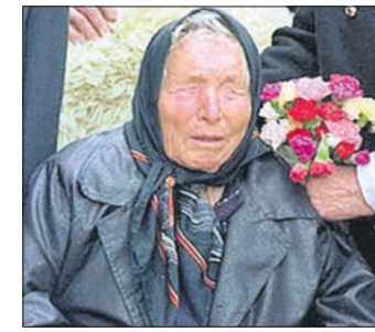
ଆତଙ୍କବାଦୀ ଆକ୍ରମଣ, ପ୍ରିୟ ଡାକ୍ତରୀଙ୍କ ମୃତ୍ୟୁ, ଚେନୋବିଲ୍ ବିପର୍ଯ୍ୟୟ ଏବଂ ଟ୍ରେକ୍ଟିଙ୍ଗ୍ ସମ୍ପର୍କରେ ପୂର୍ବରୁ ସୂଚନା ଦେଇଥିଲେ ବୋଲି କୁହାଯାଏ।

ତାଙ୍କ ନିଜ ଦେଶର ଜଣେ ବ୍ୟକ୍ତି ହତ୍ୟା କରିବ ବୋଲି ଏଥିରେ ଉଲ୍ଲେଖ ରହିଛି। ସୁରୋପରେ ଆତଙ୍କବାଦୀ ଆକ୍ରମଣ ବୃଦ୍ଧି ପାଇବ ଏବଂ ଏକ ବଡ଼ ଦେଶ ଭେଦିତ ଅସ୍ତ୍ର ପରୀକ୍ଷା କରିବ କିମ୍ବା ଏଥିରେ ଆକ୍ରମଣ କରିବ।