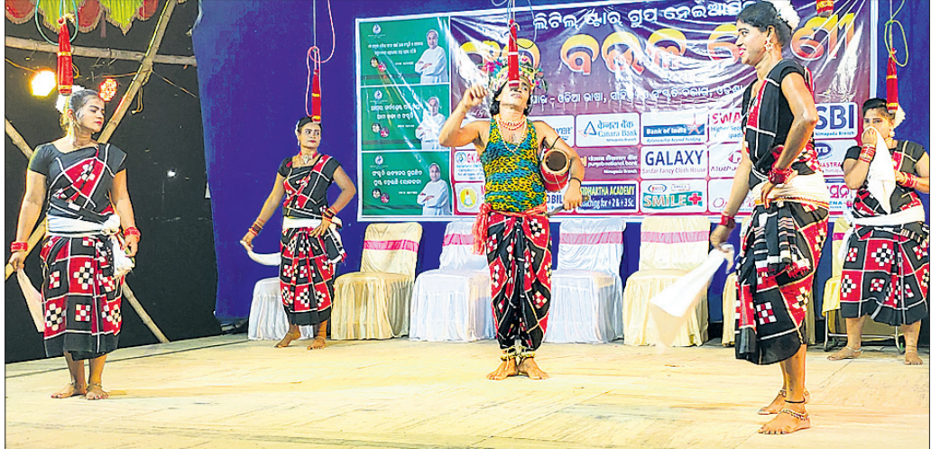
ସମାରୋହରେ କଳାକାରମାନେ ପାରମ୍ପରିକ ଧୁଡୁକି ନୃତ୍ୟ ପରିବେଷଣ କରୁଛନ୍ତି ।