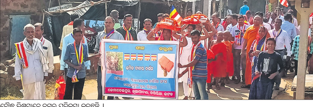
ବୌଦ୍ଧ ଭିକ୍ଷୁମାନେ ନଗର ପରିକ୍ରମା କରୁଛନ୍ତି ।