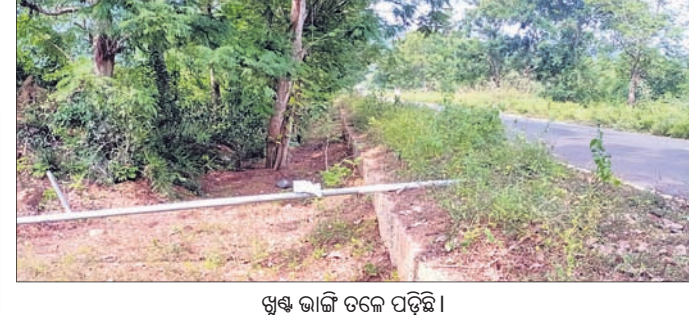
ଖୁଣ୍ଟ ରାଜି ତଳେ ପଡ଼ିଛି।

ରୁକ୍ମିଣୀଙ୍କ ଗୀତା ଆବୃତ୍ତି ପ୍ରତିଯୋଗିତା... ଗୀତା, ୫୧୧ (ରୁକ୍ମିଣୀ ସାହୁ) ପ୍ରଜ୍ଞାନ ମିଶ୍ର ଆନୁକୂଲ୍ୟରେ ରବିବାର ଗୀତା ବକରାମ ଦେବ ବିଦ୍ୟାପୀଠ ପରିସରରେ ରୁକ୍ମିଣୀଙ୍କ ଗୀତା ଆବୃତ୍ତି ପ୍ରତିଯୋଗିତା ଆରମ୍ଭ ହୋଇଯାଇଛି।