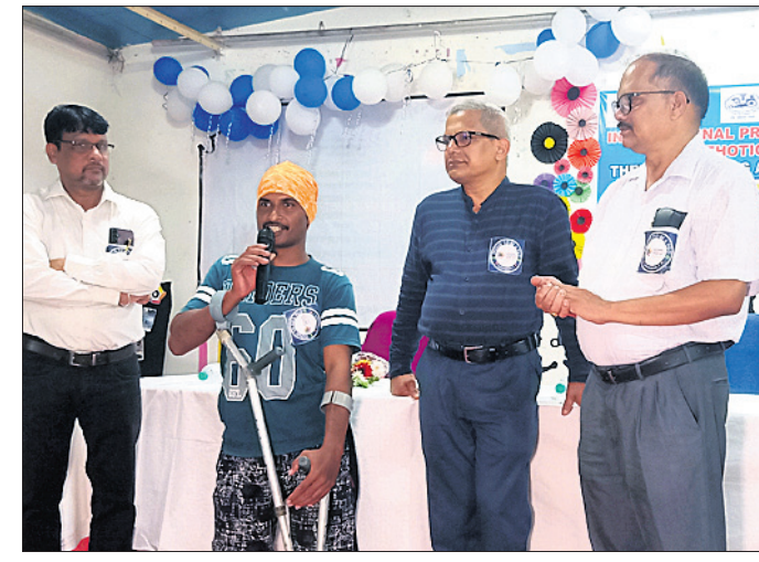
କାର୍ଯ୍ୟକ୍ରମରେ ଜଣେ ଦିବ୍ୟାଙ୍ଗ ନିକଟ ଅଙ୍ଗେନିଆ କଥା କହୁଛନ୍ତି ।