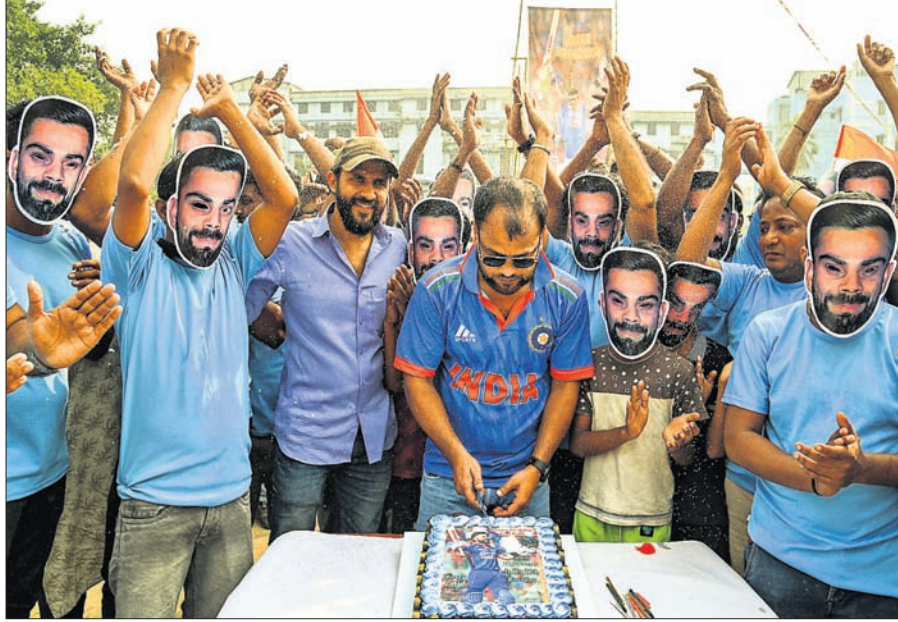
କୋହଲିଙ୍କ ଜନ୍ମଦିନରେ ରବିବାର କୋଲକାତାରେ ପ୍ରଶଂସକମାନେ କେକ୍ କାଟୁଛନ୍ତି।

କୋଲକାତା, ୫୧୧ (ପି.ଟି.) ୩୫ତମ ଜନ୍ମଦିନରେ ବିରାଟ କୋହଲି ନିଜ କ୍ୟାରିୟରର ୪୯ତମ ଦିନିକିଆ ଶତକ ହାସଲ କରି କିମ୍ବଦନ୍ତୀ ସଚିନ୍ ଡେବୁଲକରଙ୍କ ରେକର୍ଡର ସମକକ୍ଷ ହୋଇଥିଲେ। ଏହି ଅବସରରେ ଡେବୁଲକରଙ୍କୁ ଭୁଲ୍ କରି ବିରାଟଙ୍କୁ ଶୁଭେଚ୍ଛା ଜଣାଇଛନ୍ତି। ରବିବାର ସଚିନ୍ ଡେବୁଲକରଙ୍କୁ ଭୁଲ୍ କରି ବିରାଟଙ୍କୁ ଶୁଭେଚ୍ଛା ଜଣାଇଥିବା ବେଳେ ଦ୍ୱିତୀୟ ରୁଲ୍‌ରେ ୪୯ତମ ଶତକ ରେକର୍ଡ ପାଇଁ ଧନ୍ୟବାଦ ଜଣାଇଛନ୍ତି। ପ୍ରଥମ ରୁଲ୍‌ରେ କୋହଲିଙ୍କ ସହିତ ନିଜର ଏକ ଫଟୋ ପୋଷ୍ଟ କରିଥିଲେ ସଚିନ୍। ପ୍ରଦର୍ଶନ ଓ ଦୃଢ଼ ଇଚ୍ଛାଶକ୍ତି ବଳରେ ସଚିନ୍ ହୁଏତ ଜିତୁଆ। ଚଳିତବର୍ଷ ରୁମ ପାଇଁ ଆହୁରି ଶୁଭକର ହେଉ, ଜନ୍ମ ଦିନ ଡେରସାରା ଶୁଭେଚ୍ଛା ବୋଲି ସଚିନ୍ ନିଜ ପୋଷ୍ଟରେ ଲେଖିଥିଲେ। ବିରାଟ ୪୯ତମ ଶତକ ପୂରଣ କରିବା ପରେ ସଚିନ୍ ଆଉ ଏକ ରୁଲ୍ କରିଥିଲେ। ଏଥିରେ ଲେଖାଥିଲା ବହୁତ ବଡ଼ିଆ ଖେଳିଲ ବିରାଟ। ୪୯ରୁ ୫୦ ଶତକରେ ପହଞ୍ଚିବା ପାଇଁ ମୋଟେ