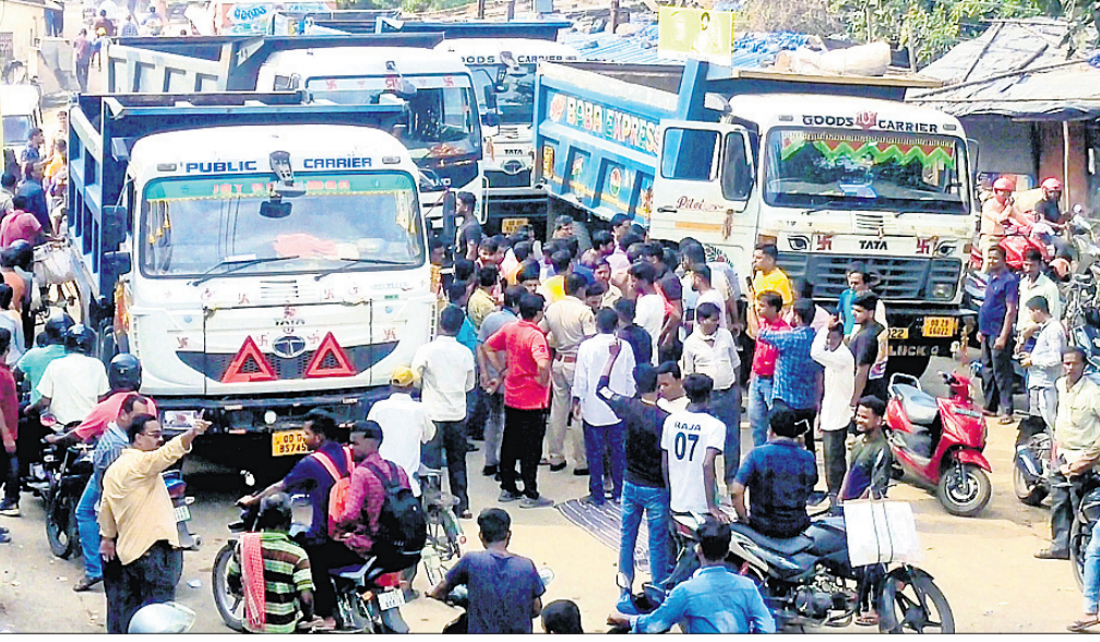
ନୂଆପଡା ତ୍ରିନାଥ ବଜାର ଛକରେ ଲୋକମାନେ ରାସ୍ତାରୋକୋ କରିଛନ୍ତି ।