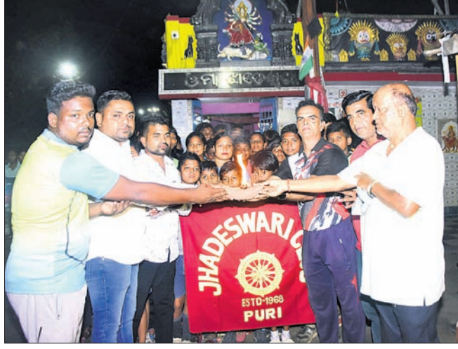
ଝାଡ଼େଶ୍ୱରୀ କୁଳ ପକ୍ଷରୁ ଅଖଣ୍ଡ ଦୀପ ପ୍ରଜ୍ୱଳନ କରାଯାଇଛି ।