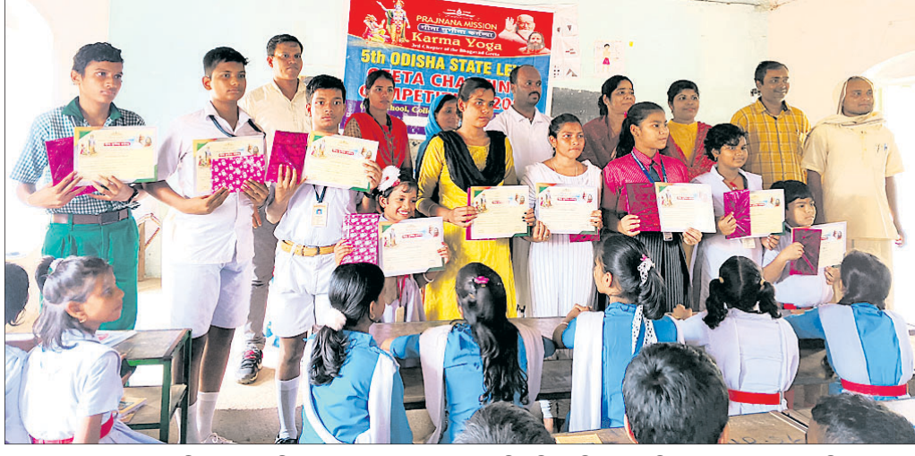
ଗୀତା ବକରାମ ଦେବ ବିଦ୍ୟାପୀଠ ପରିସରରେ ରୁକ୍ମିଣୀଙ୍କ ଗୀତା ଆବୃତ୍ତି ପ୍ରତିଯୋଗିତାରେ ଅତିଥିଙ୍କୁ ଉପହାର ଦେଇ କୃତୀ ପ୍ରତିଯୋଗୀ।

ବୋଲଗଡ଼, ୫୧୧ (ଦେବଦତ୍ତ ହୋତା): ବୋଲଗଡ଼ ଥାନା ବକୋଇ ଫାଣ୍ଡି ଥାନା ବାରବାଟୀ ନିକଟରେ ରବିବାର ପୋଲିସକୁ ଖସିପଡ଼ିବାକୁ ଖଣ୍ଡେ ବାଇକ୍ ଆରୋହୀଙ୍କ ମୃତ୍ୟୁ ଘଟିଛି।