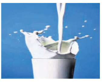
ଦୁଗ୍ଧର ଆବଶ୍ୟକତା ରହିଛି।

ରାଜ୍ୟରେ ଦୁଗ୍ଧ ଉତ୍ପାଦନ କମ୍ପୁଟି ଅନ୍ୟ ରାଜ୍ୟ ତୁଳନାରେ ଓଡ଼ିଶାର ସ୍ଥିତି ଚିନ୍ତାଜନକ ରହିଛି। ଗୋପାଳନ ଉପରେ ନିର୍ଭର କରୁଥିବା ଗରିବ ଏବଂ ନାମମାତ୍ର ଚାଷୀଙ୍କ ଆୟ ହ୍ରାସ ପାଇବା ଆଶଙ୍କା ଦୃଷ୍ଟି ହୋଇଛି। ଉଚିତ ପ୍ରାପ୍ୟ ଓ ପ୍ରୋତ୍ସାହନ ମିଳୁ ନ ଥିବାରୁ ଚାଷୀମାନେ ଗୋପାଳନରୁ ମୁହଁ ଫେରାଇଛନ୍ତି। ନିକଟରେ ନ୍ୟାଶନାଲ ବ୍ୟାଙ୍କ ଫର୍ ଏଗ୍ରିକଲଚର ଆଣ୍ଡ ରୁରାଲ ଡେଭେଲପମେଣ୍ଟ(ନାବାଡ଼) ରିପୋର୍ଟରେ ଏହି ତଥ୍ୟ ଦିଆଯାଇଛି। ଯଦିଓ ଓଡ଼ିଶା ଗାଈ ସଂଖ୍ୟାରେ ଦେଶର ୧୦ ଶ୍ରେଣୀ ରାଜ୍ୟ ମଧ୍ୟରେ ରହିଛି। ଏହା ସତ୍ତ୍ୱେ ୨୦୨୧-୨୨ରେ ଦୁଗ୍ଧ ଉତ୍ପାଦନରେ ୧୮ତମ ସ୍ଥାନରେ ରହିଛି ଓଡ଼ିଶା।