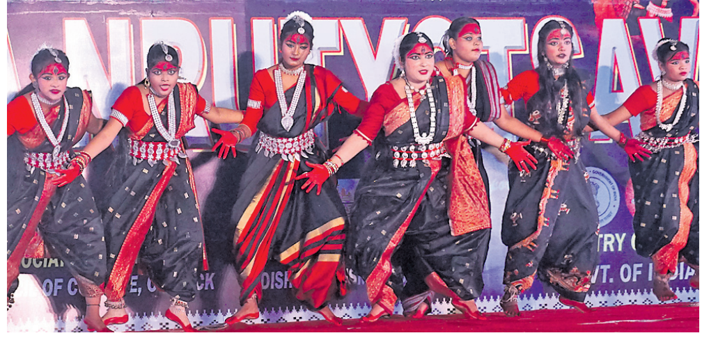
କଟକ ବାଲିଯାତ୍ରା ଉପର ପଡିଆରେ ସାତସାହି କଟକ ନୃତ୍ୟାସବର ରବିବାର ଚତୁର୍ଥ ସମ୍ପାଦନା ବେଳା ଧାଡ଼ିନ ନୃତ୍ୟମ ପକ୍ଷରୁ କଳାକାରମାନେ ସେମି କ୍ଲବିକାଳ ନୃତ୍ୟ ପରିବେଷଣ କରୁଛନ୍ତି ।