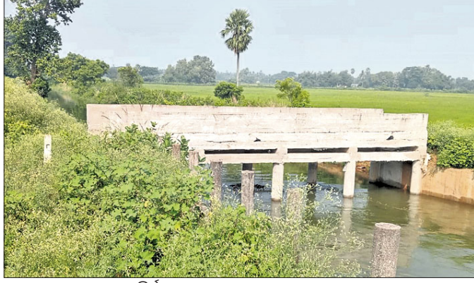
୮ ନଂ. କେନାଲ ଉପରେ ନିର୍ମାଣ ହୋଇଥିବା ସେତୁ।

ନିଶ୍ଚିତକୋଇଲି ବ୍ଲକ୍ ୮ ନମ୍ବର କେନାଲ ଉପରେ ନିର୍ମାଣଧୀନ ସେତୁ କାର୍ଯ୍ୟ ନିମ୍ନମାନର ହୋଇଥିବା ଅଭିଯୋଗ ହୋଇଛି। ଫଳରେ ସେତୁର ସ୍ଥାୟିତ୍ୱ ନେଇ ପ୍ରଶ୍ନବାଣୀ ସୃଷ୍ଟି ହୋଇଛି। କେନ୍ଦ୍ରପାଟଣା ଜଳ ସମ୍ପଦ ବିଭାଗ ସହକାରୀ ନିର୍ବାହୀ ଯନ୍ତ୍ରୀଙ୍କ ଅଧୀନରେ ୮ ନମ୍ବର କେନାଲ ରହିଛି। ଏହି କେନାଲର ବୁଝାଇଲୋ ପଞ୍ଚାୟତ ଅନ୍ତର୍ଗତ ଭୁବନପାରେ ଉଚ୍ଚ ସେତୁ ନିର୍ମାଣ କରାଯାଇଛି। ସରକାରଙ୍କ ତରଫରୁ ଏହି ସେତୁ ନିର୍ମାଣ ପାଇଁ ପ୍ରଥମ ପର୍ଯ୍ୟାୟରେ ୧୪ ଲକ୍ଷ ଟଙ୍କା ମଞ୍ଜୁର କରାଯାଇଥିଲା। ତେବେ ସେତୁ