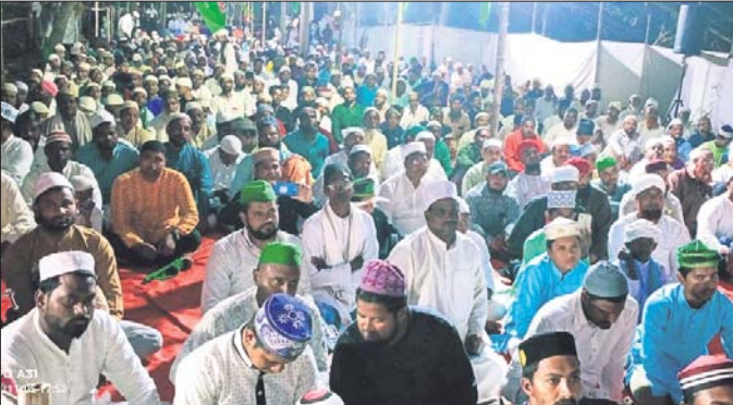
ଧର୍ମସଭାରେ ଯୋଗଦେଇଥିବା ମୁସଲିମ୍ ସମ୍ପ୍ରଦାୟର ଲୋକେ ।