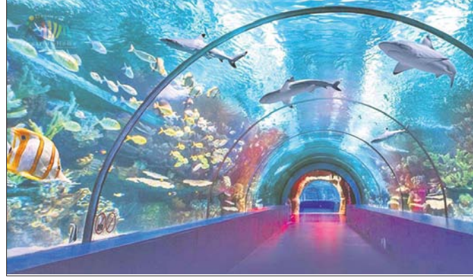
କଟକ, ୫.୧୧ (ସୁପ୍ରିୟା ପ୍ରିୟଦର୍ଶିନୀ)

ଚଳିତବର୍ଷ କଟକ ବାଲିଯାତ୍ରାକୁ ପ୍ରଥମଥର ଆସୁଛି ଅକ୍ଷର ଓଡ଼ିଶା ଚନେଲ ଆକ୍ୱାରିୟମ। ବାଲିଯାତ୍ରା ବୁଲିବା ପାଇଁ ଆସିବାକୁ ଥିବା ଲୋକମାନେ ଏହାର ଚଳଚ୍ଚିତ୍ର ଆରମ୍ଭ କରିଛନ୍ତି। ବାଲିଯାତ୍ରା ପଡ଼ିଆକୁ ଆସିବା ପାଇଁ ଲୋକମାନେ ଏହାର ଚଳଚ୍ଚିତ୍ର ଆରମ୍ଭ କରିଛନ୍ତି। ବାଲିଯାତ୍ରା ପଡ଼ିଆକୁ ଆସିବା ପାଇଁ ଲୋକମାନେ ଏହାର ଚଳଚ୍ଚିତ୍ର ଆରମ୍ଭ କରିଛନ୍ତି। ବାଲିଯାତ୍ରା ପଡ଼ିଆକୁ ଆସିବା ପାଇଁ ଲୋକମାନେ ଏହାର ଚଳଚ୍ଚିତ୍ର ଆରମ୍ଭ କରିଛନ୍ତି।