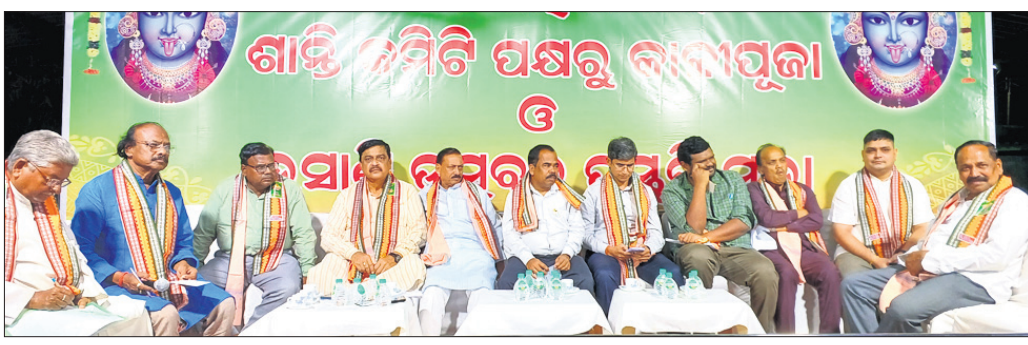
ବୈଠକରେ ଜିଲ୍ଲାପାଳ, ସିଏମ୍‌ସି ମେୟର, କମିଶନର, ଡିପିଓ ଓ ପୂର୍ବତନ ବିଧାୟକଙ୍କ ସମେତ ଅନ୍ୟମାନେ ।

ଆସନ୍ତା ୧୨ ତାରିଖରେ କାଳୀପୂଜା । ଏହାକୁ ଶାନ୍ତିଶୃଙ୍ଖଳା ସହ ସମାପନ କରିବା ପାଇଁ ରବିବାର କଟକ ମହାନଗର ଶାନ୍ତି କମିଟି ପକ୍ଷରୁ ଗଡ଼ଖାଇସ୍ଥିତ ସିଏମ୍‌ସି ମେୟରଙ୍କ ଆବାସିକ କାର୍ଯ୍ୟାଳୟ ସମ୍ମିଳନୀ କକ୍ଷରେ ଏକ ପ୍ରସ୍ତୁତି ସଭା ଅନୁଷ୍ଠିତ ହୋଇଯାଇଛି ।