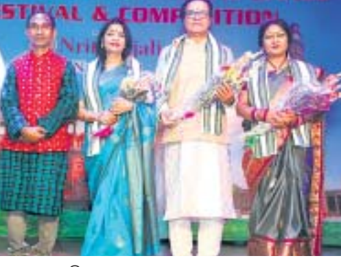
କାର୍ଯ୍ୟକ୍ରମରେ ଯୋଗଦେଇଥିବା ଅତିଥି।

ଭୁବନେଶ୍ୱର, ୫.୧୧ (ବନ୍ଦନା ସେଠୀ) ନୃତ୍ୟାଞ୍ଜଳୀ ପକ୍ଷରୁ ନୂଆଦିଲ୍ଲୀର ଲକ୍ଷ୍ମୀପତ୍ର ଭବନ ମଞ୍ଚରେ ସପ୍ତମ ଅନ୍ତର୍ଜାତୀୟ ଭାରତୀୟ ଶାସ୍ତ୍ରୀୟ ନୃତ୍ୟ ପ୍ରତିଯୋଗିତା ଉଦ୍ଘାଟନ ହୋଇଯାଇଛି। କାର୍ଯ୍ୟକ୍ରମରେ ବେଶ ବିବେଶରୁ ବହୁ ନୃତ୍ୟଶିଳ୍ପୀ ଯୋଗଦେଇ ନୃତ୍ୟ ପରିବେଷଣ କରିଥିଲେ। ଓଡ଼ିଶା, କର୍ଣାଟକ, ଭାରତ ବ୍ୟବସ୍ଥେତ କରି ଚାଳ ପରିବାର ଲୋକଙ୍କୁ ହସ୍ତାନ୍ତର କରିଥିବା ଜଣାଯାଇଛି।