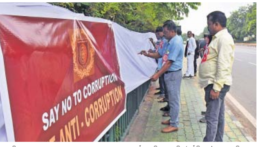
ଦ ଆଣ୍ଡି କରପ୍ସନ ପକ୍ଷରୁ ଭୁବନେଶ୍ୱର ସୁନା ଭବନ ସମ୍ମୁଖ ରାସ୍ତା ପାର୍ଶ୍ୱରେ ରବିବାର ଅନୁଷ୍ଠିତ 'ସୁନାଟିକୁ ନା' ଦସ୍ତଖତ ଅଭିଯାନରେ ଅତିଥି ଓ ସାଧାରଣ ଲୋକ ଦସ୍ତଖତ କରି ସମର୍ଥନ ଜଣାଇଛନ୍ତି।

ଭୁବନେଶ୍ୱର, ୫.୧୧ (ବନ୍ଦନା ସେଠୀ) ନୃତ୍ୟାଞ୍ଜଳୀ ପକ୍ଷରୁ ନୂଆଦିଲ୍ଲୀର ଲକ୍ଷ୍ମୀପତ୍ର ଭବନ ମଞ୍ଚରେ ସପ୍ତମ ଅନ୍ତର୍ଜାତୀୟ ଭାରତୀୟ ଶାସ୍ତ୍ରୀୟ ନୃତ୍ୟ ପ୍ରତିଯୋଗିତା ଉଦ୍ଘାଟନ ହୋଇଯାଇଛି। କାର୍ଯ୍ୟକ୍ରମରେ ବେଶ ବିବେଶରୁ ବହୁ ନୃତ୍ୟଶିଳ୍ପୀ ଯୋଗଦେଇ ନୃତ୍ୟ ପରିବେଷଣ କରିଥିଲେ। ଓଡ଼ିଶା, କର୍ଣାଟକ, ଭାରତ ବ୍ୟବସ୍ଥେତ କରି ଚାଳ ପରିବାର ଲୋକଙ୍କୁ ହସ୍ତାନ୍ତର କରିଥିବା ଜଣାଯାଇଛି।