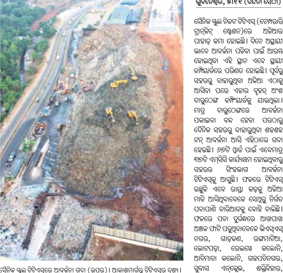
ଦୈନିକ ସ୍କୁଲ ଚିତ୍ତପ୍ତରେ ଆବର୍ଜନା ଗଦା (ଉପର) । ଆକାଶମାର୍ଗରୁ ଚିତ୍ତପ୍ତର ଦୃଶ୍ୟ ।

ଭୁବନେଶ୍ୱର, ୫.୧୧ (ବନ୍ଦନା ସେଠୀ) ଦୈନିକ ସ୍କୁଲ ନିକଟ ଚିତ୍ତପ୍ତ (ଟେମ୍ପୋରାରି ଟ୍ରାନ୍ସିଏଣ୍ଟ୍ ଷ୍ଟେସନ)ରେ ଅଜଣା ଆବର୍ଜନା ଗଦା ହୋଇଛି। ଦିନେ ଅସ୍ଥାୟୀ ଭାବେ ଆବର୍ଜନା ପଡ଼ିବା ପାଇଁ ଆରମ୍ଭ ହୋଇଥିବା ଏହି ସ୍ଥାନ ଏବେ ସ୍ଥାୟୀ ତମ୍ପୋରାରେ ପରିଣତ ହୋଇଛି। ପୂର୍ବରୁ ସହରରୁ ବାହାରୁଥିବା ଅଜଣା ଏଠାକୁ ଆସିବା ପରେ ଏହାର ବୃହତ୍ ଏଂଶ ବାରୁଣ୍ଡେ ତମ୍ପୋରାକୁ ଯାଉଥିଲା। ମାତ୍ର ବାରୁଣ୍ଡେରେ ଆବର୍ଜନା ପକାଇବା ବନ୍ଦ ହେବା ପରଠାରୁ ଦୈନିକ ସହରରୁ ବାହାରୁଥିବା ଶହଶହ ଟନ୍ ଆବର୍ଜନା ଆସି ଏହିଠାରେ ଗଦା ହେଉଛି। ୬୭ଟି ଘାଟ ପାଇଁ ଏବେମାତ୍ର ୩୭ଟି ଏମ୍ବିସି କାର୍ଯ୍ୟକ୍ଷମ ହୋଇଥିବାରୁ ସହରର ସିଂହଭାଗ ଆବର୍ଜନା ଚିତ୍ତପ୍ତକୁ ଆସୁଛି। ଫଳରେ ଚିତ୍ତପ୍ତ ଉଚ୍ଚଳି ଏବେ ରାସ୍ତା କଡ଼କୁ ଅଜଣା ମାଡ଼ି ଆସିଥିବାବେଳେ ସେଥିରୁ ନିର୍ଗତ ପଦାପାଣି ଚାରିଆଡ଼କୁ ବୋହି ଚାଲିଛି। ଫଳରେ ପଦା ପୂର୍ବରେ ଆଖପାଖ ଅଞ୍ଚଳ ଫାଟି ପଡ଼ୁଥିବାବେଳେ ଭିଏସ୍‌ଏସ୍ ନଗର, ଗାଡ଼କଣ, ରଙ୍ଗମାଟିଆ, ଭୋଟପଡ଼ା, ରେଲଗେଜ କଲୋନି, ଆଦିମାତା କଲୋନି, ଗଜପତିନଗର, ସୁବାସ ଏନ୍‌କ୍ଲେଭ, ଶକ୍ତିବିହାର, ଗଜପତିନଗର, ଲକ୍ଷ୍ମୀବିହାର, ପ୍ରତ୍ୟକ୍ଷବିହାର, ବାଣାବିହାର, ରଘୁଲଗଡ଼, ମଞ୍ଜୁଶ୍ୟାମରେ ରହୁଥିବା ଲୋକଙ୍କ ମନରେ ରୋଗ ଭୟ ଘାରିଲାଣି। ଅନେକ ଚର୍ମ ଓ ଅଜଣା ରୋଗରେ ଆକ୍ରାନ୍ତ ହୋଇଥିବା ଅଭିଯୋଗ ଆସୁଛି। ପୂର୍ବରୁ ଏ ସଂକ୍ରାନ୍ତରେ ଆଞ୍ଚଳିକ ସୁରକ୍ଷା ମଞ୍ଚ ଓ ଭିଏସ୍‌ଏସ୍ ଉନ୍ନୟନ ପରିଷଦ