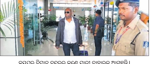
ଜୟପୁର ବିମାନ ବନ୍ଦରରୁ ଜଣେ ଯାତ୍ରୀ ବାହାରକୁ ଆସୁଛନ୍ତି।

ଜୟପୁର, ୬।୧୧ (ପବନ ପାଣିଗ୍ରାହୀ) ଭୁବନେଶ୍ୱରରୁ ଜୟପୁରକୁ ଯୋଗଦାନ ଦ୍ୱିତୀୟ ବିମାନ ଉଡ଼ିଲା। ଇଣ୍ଡିଆ ଖାନ୍ ସାଧାରଣାଳୟ ପକ୍ଷରୁ ସମ୍ପ୍ରାହତ ୨୦୨୨ ୨୯ମ ଦିନ ଯୋଗଦାନ ଓ ଶୁକ୍ରବାର ଏହି ବିମାନ ଚଳାଚଳ କରିବ। ଯୋଗଦାନ ସକାଳ ୭ଟା ୧୦ରେ ଇଣ୍ଡିଆ ଖାନ୍ ଏୟାରଲାଇନର 'ସେସନା' ବିମାନ ଭୁବନେଶ୍ୱର ବିଦ୍ୱେଷ ପକ୍ଷୀମାନଙ୍କୁ ବିମାନବନ୍ଦରରୁ ଜୟପୁର ଅଭିଯୁକ୍ତ ଉଡ଼ାଣ ଆରମ୍ଭ କରିଥିଲା। ଏଥିରେ ୬୫ ଯାତ୍ରୀ ଯାଇଥିଲେ। ବିମାନଟି ୮ଟା ୪୫ରେ ଜୟପୁର ବିମାନବନ୍ଦରରେ ପହଞ୍ଚିଥିଲା। ପରେ ଏହା ୯ଟାରେ ଜୟପୁରକୁ ଉଡ଼ି ୧୦ଟା ୩୫ରେ ଭୁବନେଶ୍ୱରରେ ପହଞ୍ଚିଥିବା ଜଣାଯାଇଛି। ଜୟପୁରରୁ ୨୯୯୯ ଟଙ୍କା ଯାତ୍ରାଭଡ଼ା ରହିଛି।