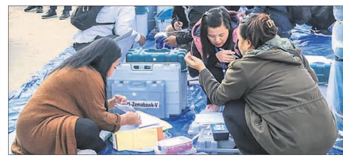
ମିଜୋରାମ ଭୋଟ ପାଇଁ ପୋଲିଂ କର୍ମଚାରୀମାନେ ଲାଭିଏନ୍ ଓ ଅନ୍ୟ ସାମଗ୍ରୀ ସଂଗ୍ରହ କରୁଛନ୍ତି। ନଭେମ୍ବର ମୋତି ତାଙ୍କୁ ଗର୍ଭେଷ୍ଟ କରିଥିଲେ।

ବିଷ୍ଣୋଗଣ୍ଡରେ ଜଣେ ଯବାନ, ୨ ପୋଲିଂ କର୍ମଚାରୀ ଆହତ ରାୟପୁର, ୬୧୧ ଛତିଶଗଡ଼ ଓ ମିଜୋରାମ ବିଧାନସଭା ନିର୍ବାଚନ ଲାଗି ମଙ୍ଗଳବାର ମତଦାନ ହେବାକୁ ଯାଇଛି।