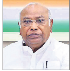
କଂଗ୍ରେସ ଅଧ୍ୟକ୍ଷ ମଲ୍ଲିକାର୍ଜୁନ ଖାର୍ଗେ

କଂଗ୍ରେସ ଅଧ୍ୟକ୍ଷ ମଲ୍ଲିକାର୍ଜୁନ ଖାର୍ଗେ ଯୋଗଦାନ ରାଜସ୍ଥାନର ଯୋଧପୁରରେ ଏକ ନିର୍ବାଚନ ରାଲିକୁ ସମ୍ବୋଧିତ କଲାବେଳେ ପ୍ରବଚନ ନିର୍ଦ୍ଦେଶାକ୍ତ (ଇଡି), ସିବିଆଇ ଏବଂ ଆଇନ ବିଭାଗକୁ ପ୍ରଧାନମନ୍ତ୍ରୀ ନରେନ୍ଦ୍ର ମୋଦିଙ୍କ ଯୋଗାଣ କରିଛନ୍ତି। ମୋଦି ନିର୍ବାଚନ ପ୍ରଚାରରେ ଆସିବା ପୂର୍ବରୁ ବିରୋଧୀ ନେତାମାନଙ୍କୁ ଗାର୍ଜେଟ କରିବା ପାଇଁ ଉପରୋକ୍ତ କେନ୍ଦ୍ରୀୟ ଏଜେଣ୍ଟଗୁଡ଼ିକୁ ପଠାଉଛନ୍ତି। ନିର୍ବାଚନ ସମୟ ହୋଇଥିବାରୁ