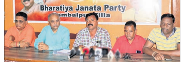
ଖବରଦାତା ସମ୍ମିଳନୀରେ ଉପସ୍ଥିତ ଭାଜପା ନେତୃବୃନ୍ଦ।

କ୍ରମ ପ୍ରକ୍ରିୟାରେ କର୍ମଚାରୀଙ୍କୁ ହେଉ ନ ଥିବା କଥାରେ ଅସହମତି ପ୍ରକାଶ କରିଛନ୍ତି। ସେ କହିଛନ୍ତି, ରେଡ଼ାଖୋଲ ଓ କୁଟିଆ ଅଞ୍ଚଳର ଗଣ୍ଡାମାନେ କର୍ମଚାରୀଙ୍କୁ ଶିକାର ହେଉଥିବା ଅଭିଯୋଗ କରୁଥିବା ବେଳେ ସେଠାରେ ବିଧାନସଭା ସହାୟକ ଅଧିକାରୀ କରିବା ଦୁର୍ଭାଗ୍ୟକରକ। ଏହାଛଡ଼ା ବୈଠକରେ ଧାନର ସର୍ବନିମ୍ନ ସହାୟକ ମୂଲ୍ୟ ୨୯୩୦ ଟଙ୍କା ବୃଦ୍ଧି କରିବାକୁ ରାଜ୍ୟ ସରକାର କେନ୍ଦ୍ରକୁ ପ୍ରସ୍ତାବ ଦେଇଥିଲେ। ମାତ୍ର କେନ୍ଦ୍ର ସରକାର ଏ ନେଇ କୌଣସି ପଦକ୍ଷେପ ନେଇ ନ ଥିବା ନେଇ ବିଧାନସଭା ଅଭିଯୋଗକୁ ମଧ୍ୟ ସେ ଶସ୍ତ୍ର ରାଜନୀତି ବୋଲି କହିଥିଲେ। ଅନ୍ୟ ଏକ ଅଭିଯୋଗରେ ସେ କହିଥିଲେ ଯେ ଗତ ନିର୍ବାଚନରେ ରାଜ୍ୟ ସରକାରଙ୍କ