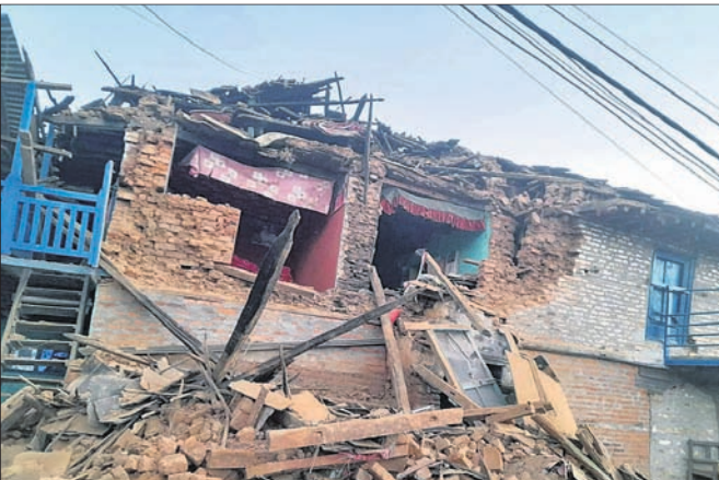
ଶୁକ୍ରବାର ବିକସିତ ରାତିରେ ହୋଇଥିବା ଭୂକମ୍ପ ଯୋଗୁଁ ବିଧ୍ୟୁ ଏକ ଘର।

କାଠମାଣ୍ଡୁ/ନୂଆଦିଲ୍ଲୀ, ୬୧୧ ନେପାଳରେ ୩ ଦିନ ମଧ୍ୟରେ ତୃତୀୟ ଭୂକମ୍ପ ସୋମବାର ଅପରାହ୍ନ ୪ଟା ୧୪ ମିନିଟ୍ରେ ହୋଇଛି। ଭୂକମ୍ପର ତୀବ୍ରତା ୫.୬ ଥିଲା।