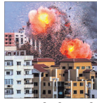
ଇସ୍ରାଏଲର ସାମରିକ ଅଭିଯାନକୁ ନାଗରିକ ଓ ଖବରଦାତାଙ୍କ ନିକଟକୁ ଗାଣିନେଇଥିବାରୁ ପ୍ରକଟ ସମୟରେ ଗାଜାରେ ଖବରଦାତାମାନଙ୍କୁ ଚ୍ୟାଲେଞ୍ଜିତ କରିବାକୁ ପଡ଼ିଥିଲା।