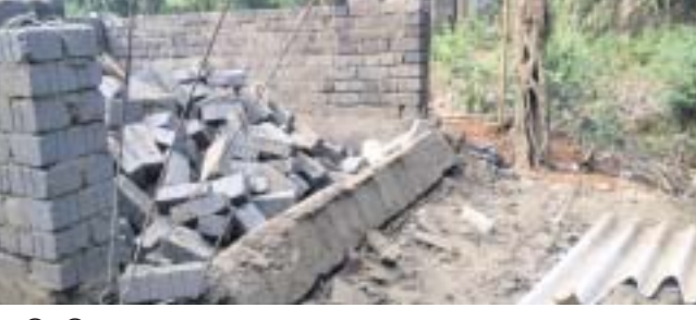
ଭୁଶୁଡ଼ି ପଡ଼ିଥିବା ପ୍ରଧାନମନ୍ତ୍ରୀ ଆବାସ।