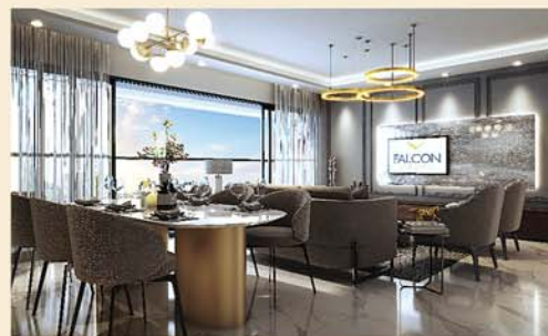
Living / Dining Room