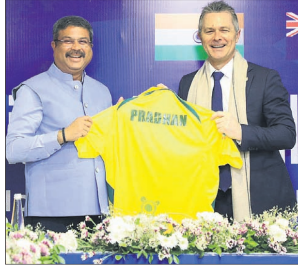
କେନ୍ଦ୍ରମନ୍ତ୍ରୀ ଧର୍ମେନ୍ଦ୍ର ପ୍ରଧାନ ଓ ଅଷ୍ଟେଲିଆ ଶିକ୍ଷା ମନ୍ତ୍ରୀ ଜେସନ କ୍ଲେୟାର।

ଆଇଆଇଆଇଟି ଗାନ୍ଧୀନଗରରେ ଅନୁଷ୍ଠିତ ପ୍ରଥମ ଅଷ୍ଟେଲିଆ-ଭାରତ ଶିକ୍ଷା ଏବଂ କୌଶଳ ପରିଷଦ ବୈଠକ (ଏଆଇଇଏସପି)ରେ ଶିକ୍ଷା ଓ ଦକ୍ଷତା କ୍ଷେତ୍ରରେ 'ଅଧିକ ସହଯୋଗ, ଅଧିକ ଭାଗାଦାରି ଏବଂ ଅଧିକ ମୋବିଲିଟି' ପାଇଁ ମାର୍ଗ ପ୍ରଶସ୍ତ ହୋଇଛି ବୋଲି କେନ୍ଦ୍ରମନ୍ତ୍ରୀ ଧର୍ମେନ୍ଦ୍ର ପ୍ରଧାନ କହିଛନ୍ତି। କେନ୍ଦ୍ରମନ୍ତ୍ରୀ ଧର୍ମେନ୍ଦ୍ର ଓ ଅଷ୍ଟେଲିଆ ଶିକ୍ଷା ମନ୍ତ୍ରୀ ଜେସନ କ୍ଲେୟାରଙ୍କ ମିଳିତ ଅଧିକାରରେ ଅନୁଷ୍ଠିତ ଏହି ବୈଠକରେ ଶିକ୍ଷା ଓ ଦକ୍ଷତା ବିକାଶ କ୍ଷେତ୍ରକୁ ଦୃଢ଼ କରିବା ଉପରେ ବିଶେଷ ଗୁରୁତ୍ୱ ଦିଆଯାଇଥିଲା। ଏଥିରୁ ଉଭୟେ ଶିକ୍ଷା ଏବଂ ଦକ୍ଷତା କ୍ଷେତ୍ରରେ ଦ୍ୱିପକ୍ଷୀୟ ସହଯୋଗର ବ୍ୟାପକ ସମୀକ୍ଷା କରିଥିଲେ। ବୈଠକ ପରେ ଆୟୋଜିତ ଖବରଦାତା ସମ୍ମିଳନୀରେ ଧର୍ମେନ୍ଦ୍ର କହିଛନ୍ତି ଯେ,