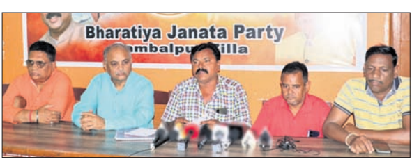
ଖବରଦାତା ସମ୍ମିଳନୀରେ ଉପସ୍ଥିତ ଭାଜପା ନେତୃବୃନ୍ଦ।

କୃଷି ପ୍ରକ୍ରିୟାରେ କର୍ମଚାରୀଙ୍କୁ ହେଉ ନ ଥିବା କଥାରେ ଅସହମତି ପ୍ରକାଶ କରିଛନ୍ତି। ସେ କହିଛନ୍ତି, ରେଡ଼ାଖୋଲ ଓ କୁଟିଆ ଅଞ୍ଚଳର ଗଣ୍ଡାମାନେ କର୍ମଚାରୀଙ୍କୁ ଶିକାର ହେଉଥିବା ଅଭିଯୋଗ କରୁଥିବା ବେଳେ ସେଠାରେ ବିଧାନସଭା ସହାୟକ ଅଧିକାରୀ କରିବା ଦୁର୍ଭାଗ୍ୟକରକ। ଏହାଛଡ଼ା ବୈଠକରେ ଧାନର ସର୍ବନିମ୍ନ ସହାୟକ ମୂଲ୍ୟ ୨୯୩୦ ଟଙ୍କା ବୃଦ୍ଧି କରିବାକୁ ରାଜ୍ୟ ସରକାର କେନ୍ଦ୍ରକୁ ପ୍ରସ୍ତାବ ଦେଇଥିଲେ। ମାତ୍ର କେନ୍ଦ୍ର ସରକାର ଏ ନେଇ କୌଣସି ପଦକ୍ଷେପ ନେଇ ନ ଥିବା ନେଇ ବିଧାନସଭା ଅଭିଯୋଗକୁ ମଧ୍ୟ ସେ ଶସ୍ତ୍ର ରାଜନୀତି ବୋଲି କହିଥିଲେ। ଅନ୍ୟ ଏକ ଅଭିଯୋଗରେ ସେ କହିଥିଲେ ଯେ ଗତ ନିର୍ବାଚନରେ ରାଜ୍ୟ ସରକାରଙ୍କ