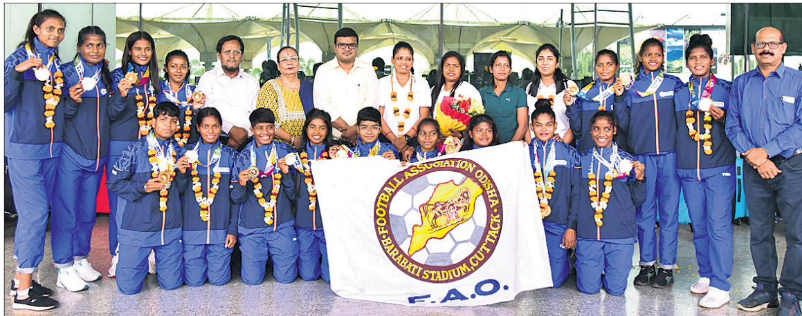
ଗୋଆରେ ଚାଲିଥିବା ଜାତୀୟ କ୍ରୀଡ଼ାରେ ସର୍ବ ପଦକ ବିଜୟୀ ଓଡ଼ିଶା ମହିଳା ଟିମ୍ ଟ୍ରଫି ପାଇବା ପରେ ଭୁବନେଶ୍ୱରରେ ଭବ୍ୟ ସାଗର କରାଯାଇଛି।

ଭୁବନେଶ୍ୱର, ୬ ନଭେମ୍ବର (ବିପି) - ଆନ୍ତଃଜାତୀୟ ମହିଳା ବାସ୍କେଟବଲ୍ ପ୍ରତିଯୋଗିତାରେ ଭୁବନେଶ୍ୱର ଟିମ୍ ଚାମ୍ପିୟନ ହୋଇଛି।