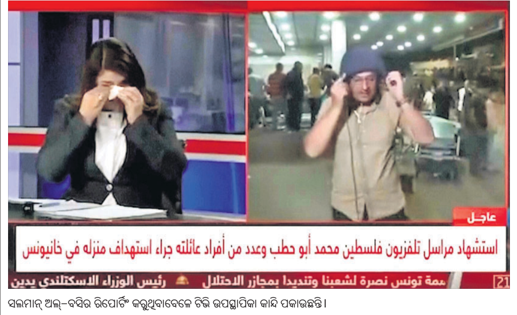
ସମ୍ଭାଷଣ ଅଲ-ସୟିଦ୍ ରିପୋର୍ଟିଂ କରୁଥିବାବେଳେ ତିଲି ଉପସ୍ଥାପିକା କାହି ପକାଉଛନ୍ତି।

ନୂଆଦିଲ୍ଲୀ, ୬୧୧: ବର୍ତ୍ତମାନର ଆପରାଧିକ ଆଇନ ଗୃହଣରେ ନୂଆ ଆଇନ ଆଣିବା ପାଇଁ ବିଲ୍ ଉପରେ ୩ଟି ରିପୋର୍ଟ ସୋମବାର ସ୍ୱରାଷ୍ଟ୍ର ବ୍ୟାପାର ସଂସଦୀୟ କମିଟିରେ ଗୃହୀତ ହୋଇଛି। ତେବେ କମିଟିର କେତେକଜଣ ବିରୋଧୀ ସଦସ୍ୟ ଭିନ୍ନ ମତ ଉପସ୍ଥାପନ କରିଥିଲେ ବୋଲି ଜଣାପଡ଼ିଛି।