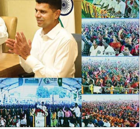
ଭୁବନେଶ୍ୱର, ୬/୧୧ (ଅନିଲ ଦାସ)

ରାଜ୍ୟ ପୌରାଧିକ୍ଷା, ପୌରାଧିକ୍ଷ ସଂଘ ସଭାପତି ହେଲେ ବସନ୍ତ