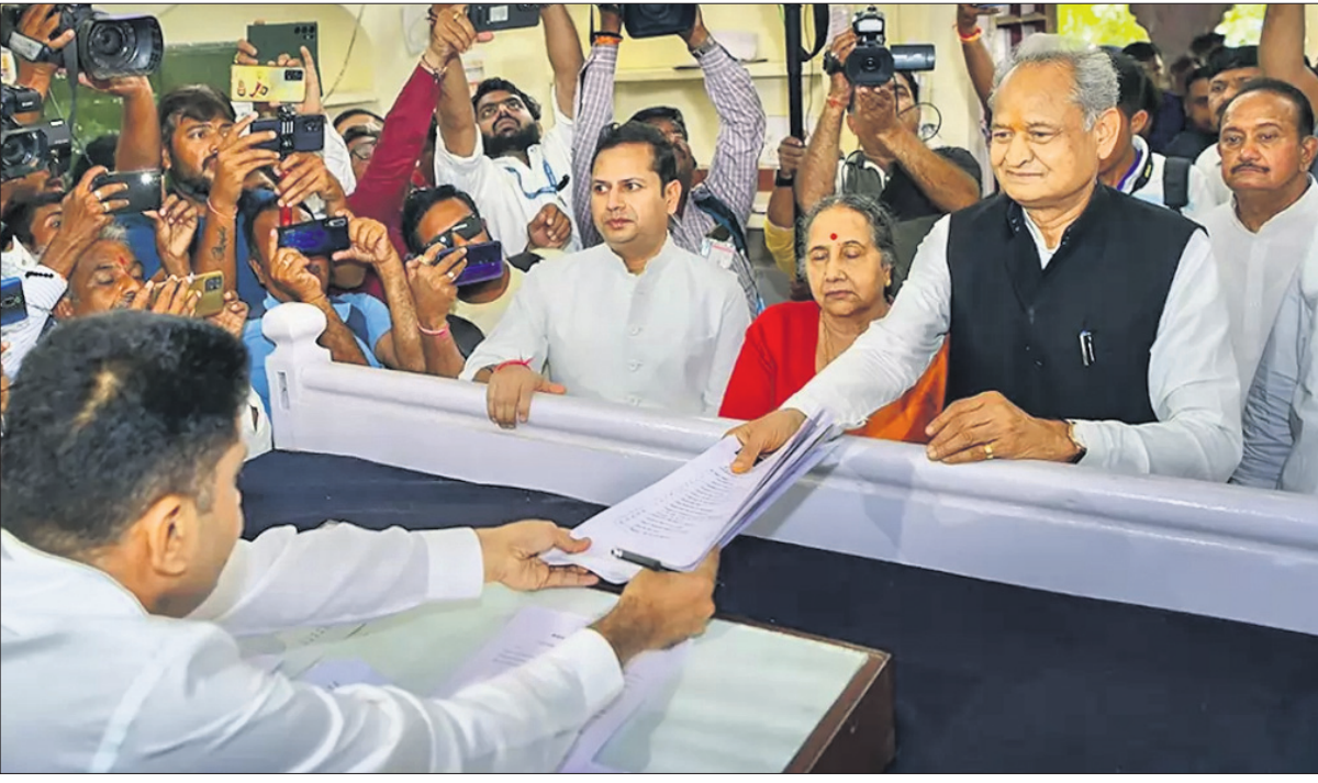
ରାଜସ୍ଥାନ ମୁଖ୍ୟମନ୍ତ୍ରୀ ଅଶୋକ ଗେହଲଟ୍ ଯୋଗଦାନ ଯୋଧପୁର ଜିଲାର ସର୍ଦ୍ଦାରପୁରା ଆସନରୁ ନାମାଙ୍କନପତ୍ର ଦାଖଲ କରୁଛନ୍ତି।