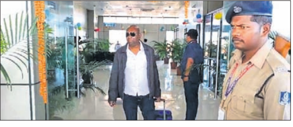
ଜୟପୁର ବିମାନ ବନ୍ଦରରୁ ଜଣେ ଯାତ୍ରୀ ବାହାରକୁ ଆସୁଛନ୍ତି।

ଜୟପୁର, ୬୧୧ (ପବନ ପାଣିଗ୍ରାହୀ) ଭୁବନେଶ୍ୱରରୁ ଜୟପୁରକୁ ଯୋଗଦାନ ଦ୍ୱିତୀୟ ବିମାନ ଉଡ଼ିଛି। ଇଣ୍ଡିଆ ଖାନ୍ ସାଧାରଣାଳୟ ପକ୍ଷରୁ ସମ୍ପ୍ରାହତ ୨୦୨୨ ୨୯ମ ଦିନ ସୋମବାର ଓ ଶୁକ୍ରବାର ଏହି ବିମାନ ଚଳାଚଳ କରିବ। ସୋମବାର ସକାଳ ୭ଟା ୧୦ରେ ଇଣ୍ଡିଆ ଖାନ୍ ଏୟାରଲାଇନର 'ସେସନା' ବିମାନ ଭୁବନେଶ୍ୱର ବିଜୁ ପଟ୍ଟନାୟକ ବିମାନବନ୍ଦରରୁ ଜୟପୁର ଅଭିଯୁକ୍ତ ଉଡ଼ାଣ ଆରମ୍ଭ କରିଥିଲା। ଏହାର ପରଦିନ ସମ୍ପ୍ରାହତ ୨୯ମ ଦିନ ପରିବର୍ତ୍ତେ ନିୟମିତ ଉଡ଼ାଣ କରିବା ସହ ଆଗକୁ ବଡ଼ ବିମାନ ଉଡ଼ିଲେ ଅନେକ ଯାତ୍ରୀ ହୁରିଆ ପାଇପାରିବେ ବୋଲି ମତ ପ୍ରକାଶ ପାଇଛି। ଜୟପୁରରୁ ଭୁବନେଶ୍ୱରକୁ ୨୯୯୯ ଟଙ୍କା ଯାତ୍ରାଭଡ଼ା ରହିଛି।