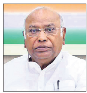
କଂଗ୍ରେସ ଅଧକ୍ଷ ମଲ୍ଲିକାର୍ଜୁନ ଖାର୍ଗେ

କଂଗ୍ରେସ ଅଧକ୍ଷ ମଲ୍ଲିକାର୍ଜୁନ ଖାର୍ଗେ ଯୋଗଦାନ ରାଜସ୍ଥାନର ଯୋଧପୁରରେ ଏକ ନିର୍ବାଚନ ରାଲିକୁ ସମ୍ବୋଧିତ କଲାବେଳେ ପ୍ରବଚନ ନିର୍ଦ୍ଦେଶାକ୍ଷର (ଇଡି), ସିବିଆଇ ଏବଂ ଆୟକର ବିଭାଗକୁ ପ୍ରଧାନମନ୍ତ୍ରୀ ନରେନ୍ଦ୍ର ମୋଦିଙ୍କ ଯତ୍ନ ବୋଲି କହିଛନ୍ତି। ମୋଦି ନିର୍ବାଚନ ପ୍ରଚାରରେ ଆସିବା ପୂର୍ବରୁ ବିରୋଧୀ ନେତାମାନଙ୍କୁ ଗାର୍ଗେଟ କରିବା ପାଇଁ ଉପରୋକ୍ତ କେନ୍ଦ୍ରୀୟ ଏଜେନ୍ସିଗୁଡ଼ିକୁ ପଠାଉଛନ୍ତି। ନିର୍ବାଚନ ସମୟ ହୋଇଥିବାରୁ