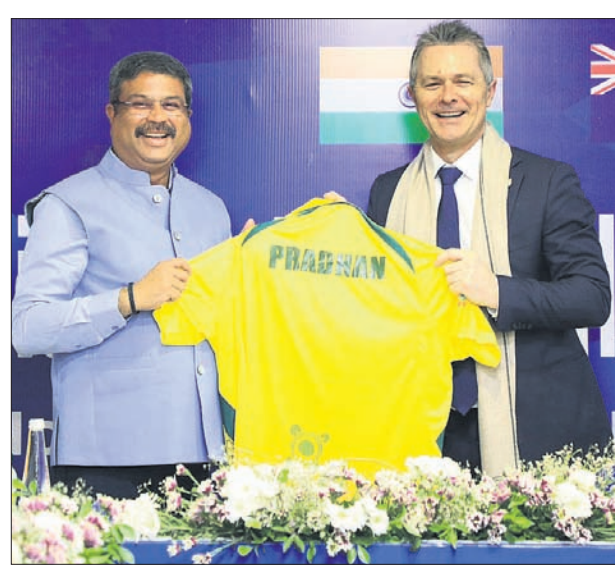
କେନ୍ଦ୍ରମନ୍ତ୍ରୀ ଧର୍ମେନ୍ଦ୍ର ପ୍ରଧାନ ଓ ଅଷ୍ଟେଲିଆ ଶିକ୍ଷା ମନ୍ତ୍ରୀ ଜେସନ କ୍ଲେୟାର।

ବିଶେଷ ଭାବେ ଶିକ୍ଷା ଓ ଦକ୍ଷତା ବିକାଶ କ୍ଷେତ୍ରରେ ସହଯୋଗ ବୃଦ୍ଧି ପାଇଁ ୨୦୨୩ ଅଷ୍ଟେଲିଆ ଏବଂ ଭାରତ ପାଇଁ ଏକ ଐତିହାସିକ ବର୍ଷ। ପ୍ରଥମ ଥର ପାଇଁ ଶିକ୍ଷା ଓ ଦକ୍ଷତାକୁ ସମାନ ଆନୁଷ୍ଠାନିକ ମଞ୍ଚ ଅଧୀନରେ ଅଣାଯାଇଛି। ଶିକ୍ଷା ଏବଂ ଦକ୍ଷତା କ୍ଷେତ୍ରରେ ପାରସ୍ପରିକ ସ୍ୱାର୍ଥର ଗୁରୁତ୍ୱପୂର୍ଣ୍ଣ କ୍ଷେତ୍ରରେ ସହଯୋଗ, ଭାଗାବାର ଏବଂ ସମନ୍ୱୟକୁ ପ୍ରୋତ୍ସାହିତ କରିବା ଦିଗରେ ବୈଠକ ଫଳପ୍ରସ୍ତ ହୋଇଛି। କୃଷି, ଜଳ ପରିଚାଳନା, ଗୁରୁତ୍ୱପୂର୍ଣ୍ଣ ଖଣିକ ପଦାର୍ଥ, ସ୍ୱାସ୍ଥ୍ୟସେବା, ଏଆଇ, ଅକ୍ଷୟ ଉର୍ଜା ଏବଂ ଜଳବାୟୁ ପରିବର୍ତ୍ତନ ଭଳି କ୍ଷେତ୍ରରେ ଅଧିକ ଗବେଷଣାଭିତ୍ତିକ