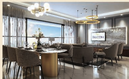
Living / Dining Room