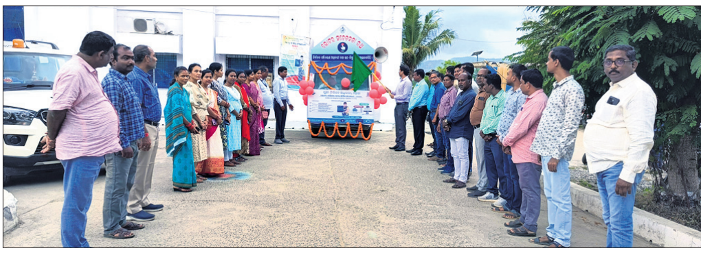
ଭୋଟର ସଚେତନତା ରଥ ଉଦ୍‌ଘାଟନ କରାଯାଇଛି ।